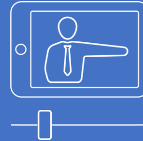
Storytelling con avatar