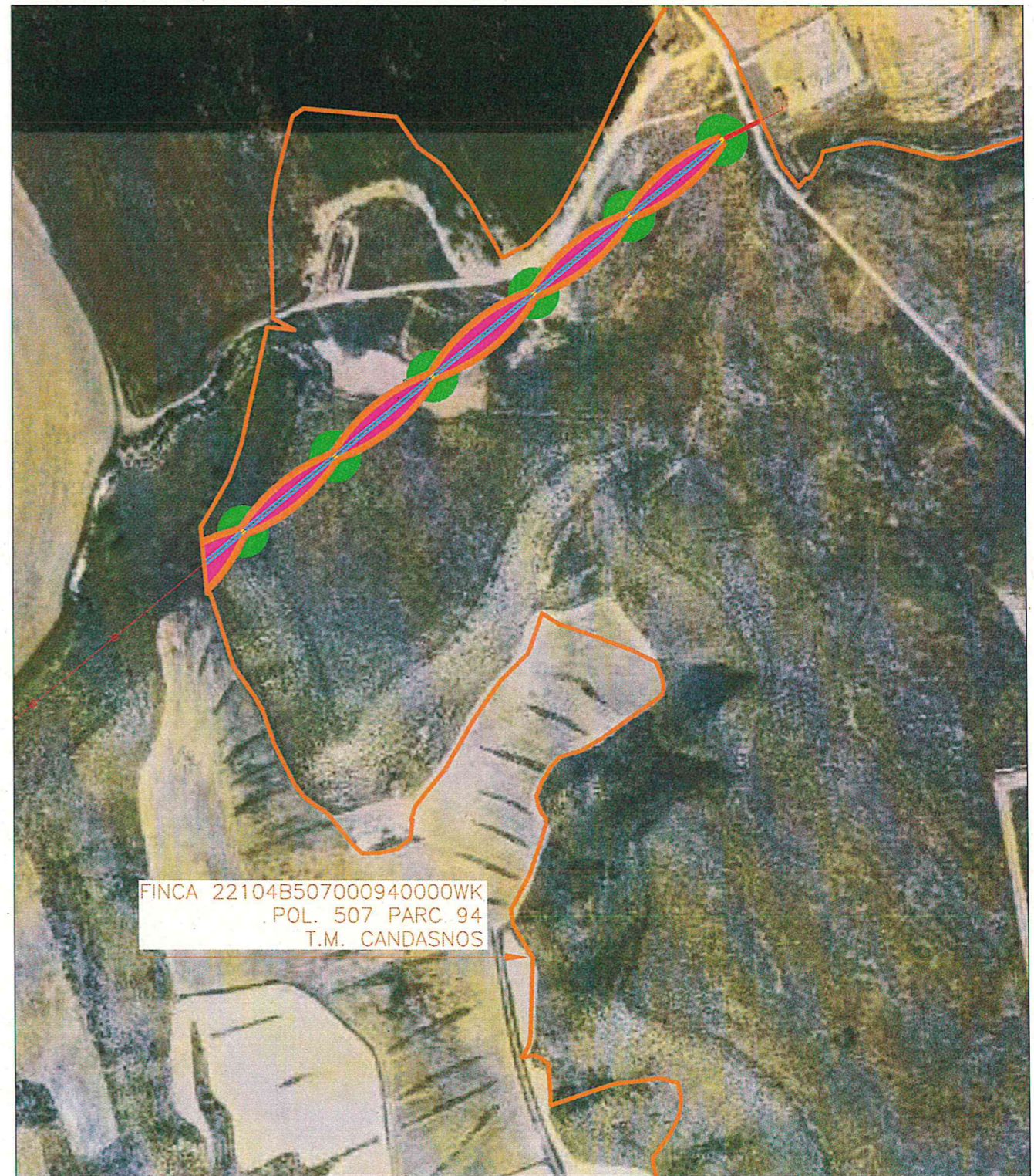
PLANO DE EMPLAZAMIENTO ESCALA 1:4.000

TERMINO MUNICIPAL: CANDASNOS TIPO DE TERRENO: E- Pastos REFERENCIA CATASTRAL: 22104B507000940000WK POLIGONO: 507 PARCELA: 94 SUPERFICIE TOTAL DE LA FINCA: 749.662 m2