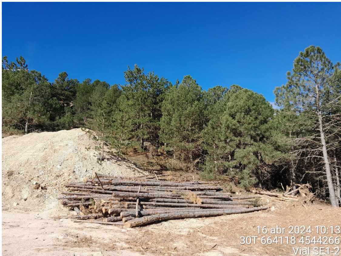
Acopio Vial SE1-2