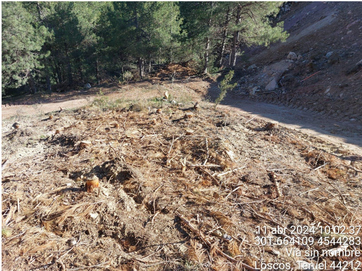
Acopio de trozas de Royuela