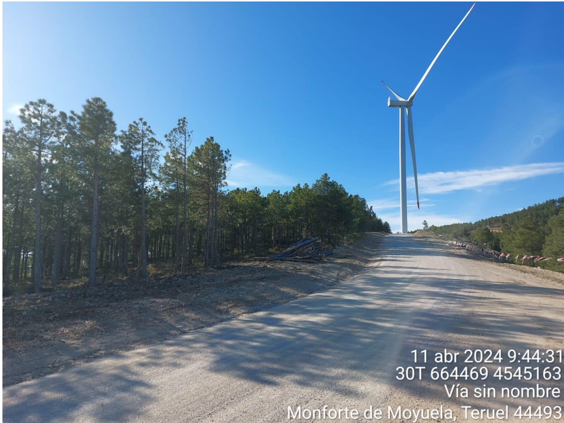
Camino de cazadores