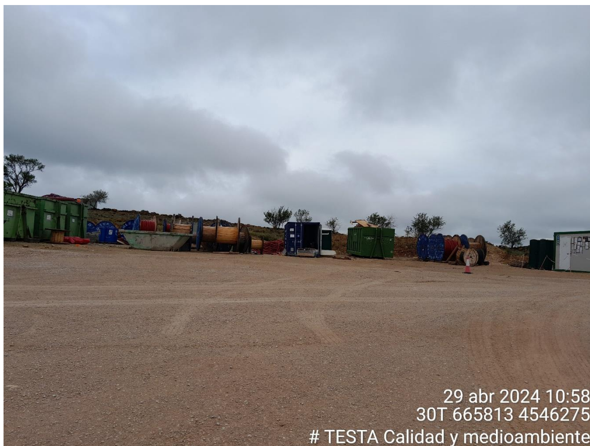
Imagen 1. Campa de Seguras