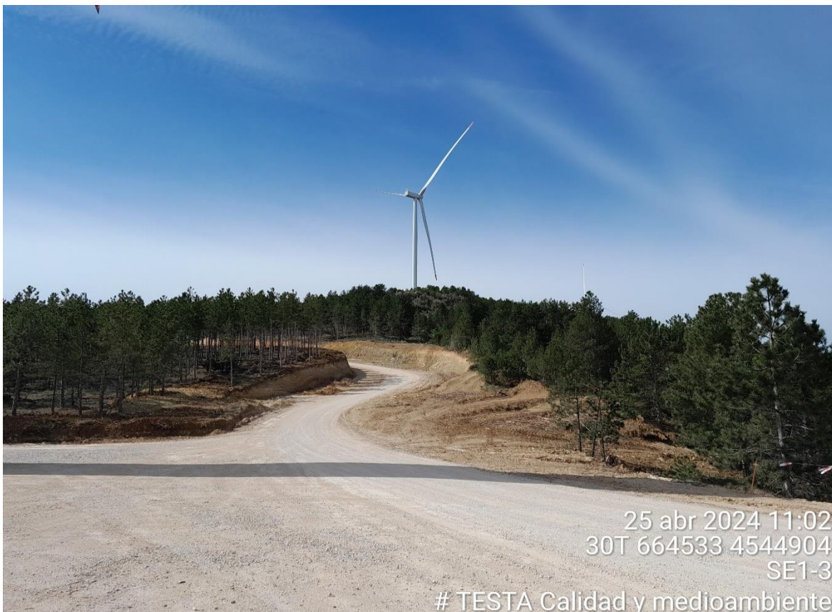
Imagen 2. Plataforma SE1-3