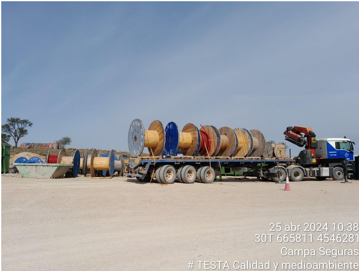
Imagen 1. Campa de Seguras