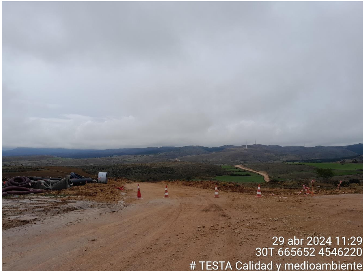
Imagen 2. Acceso a vial este balizado