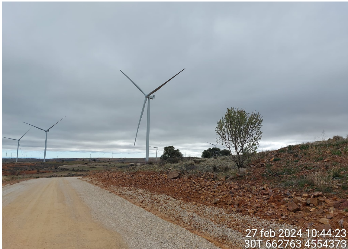
Vial acceso SEI 01 y SEI 02