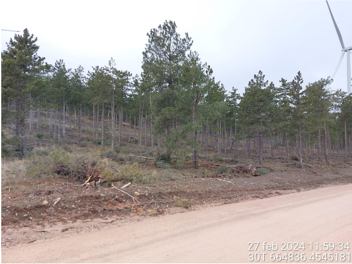
Acceso a la plataforma SEI-1