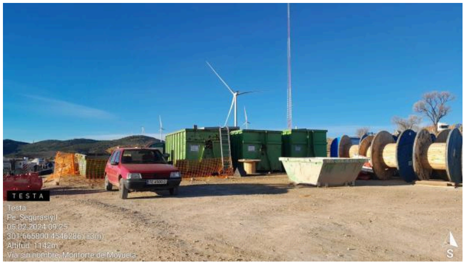
Punto limpio Seguras I