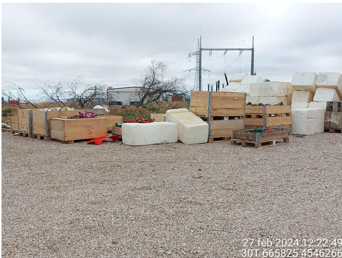
Campa en SET