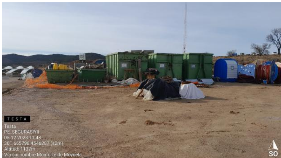
Contenedores RNP y punto limpio en mal estado.