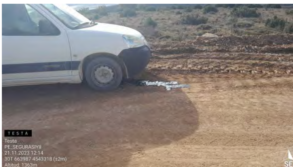
Derrame por avería.