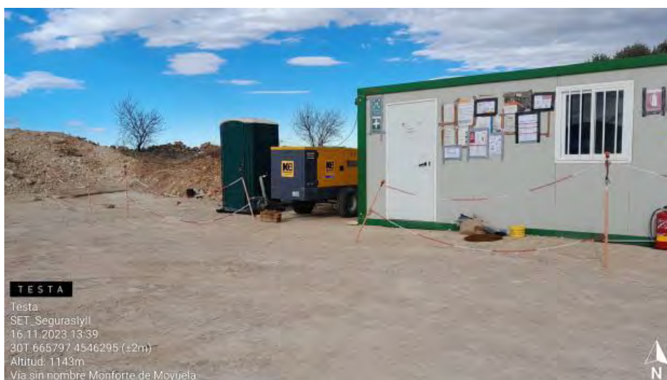
Generador sin protección de suelo .