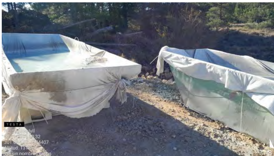
Pozo de lavado sin gestionar SE1-2 .