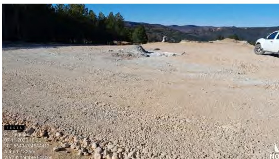
Residuos sin recoger en SE1-2