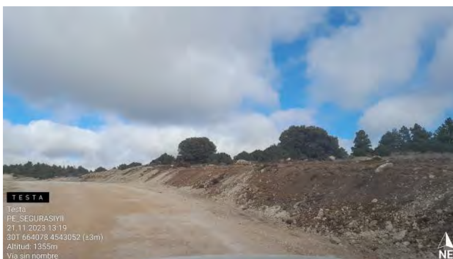
Tapado de zanja con mezcla de tierras .