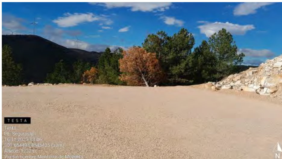
Árboles secos sin cortar en SE1-1.