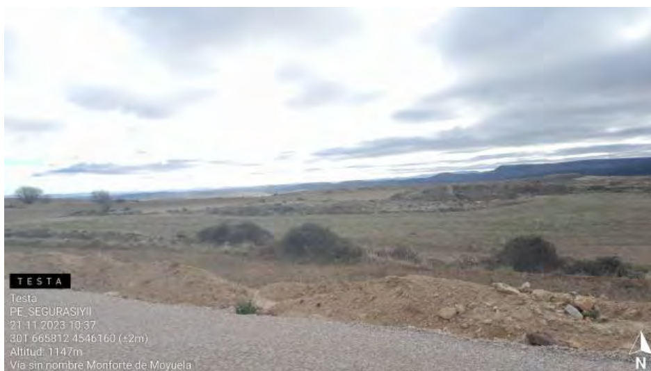
Zona con residuos para realizar batida.