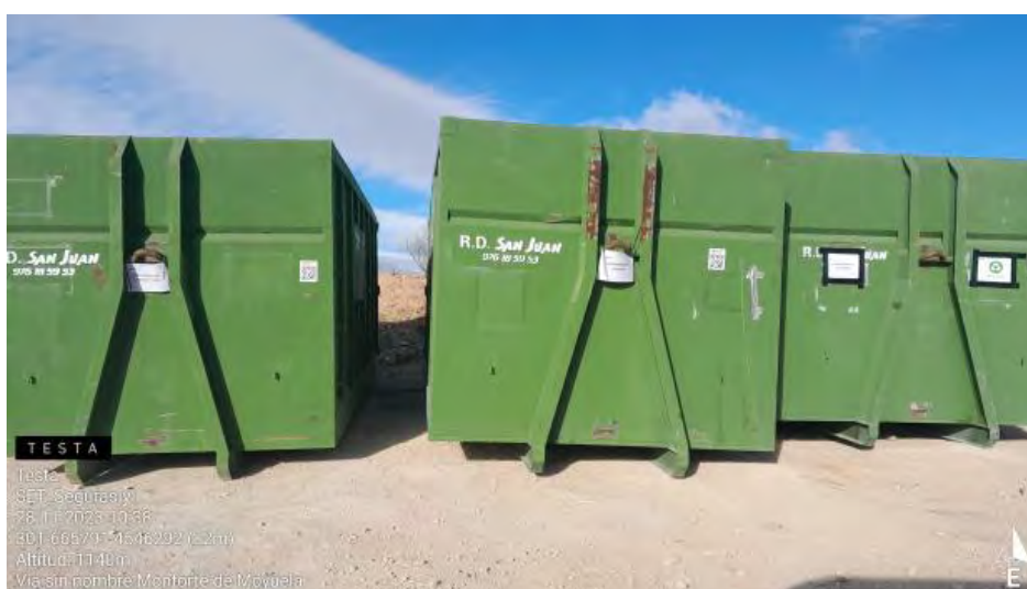
Contenedores RNP en punto limpio de nueva contrata .