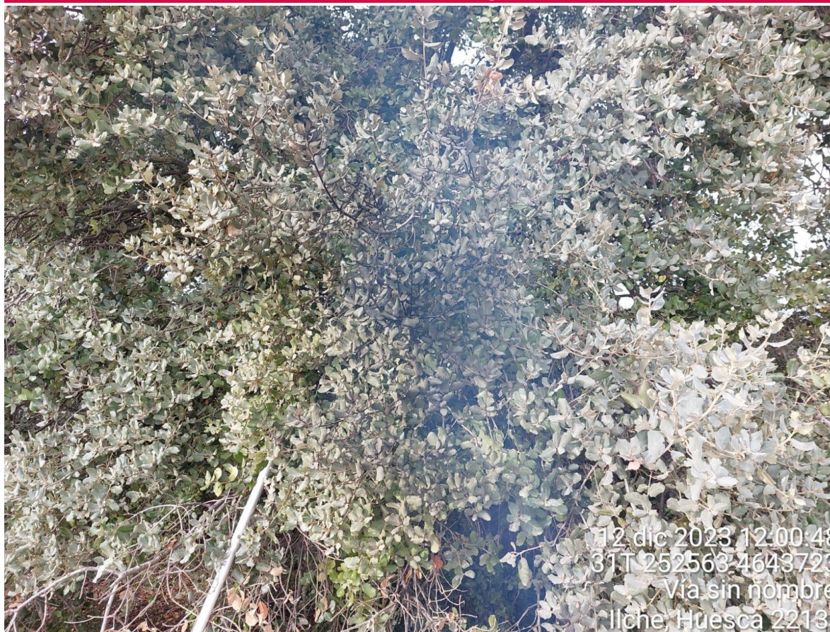
Imagen 1. NC Grave. Afección a carrasca.