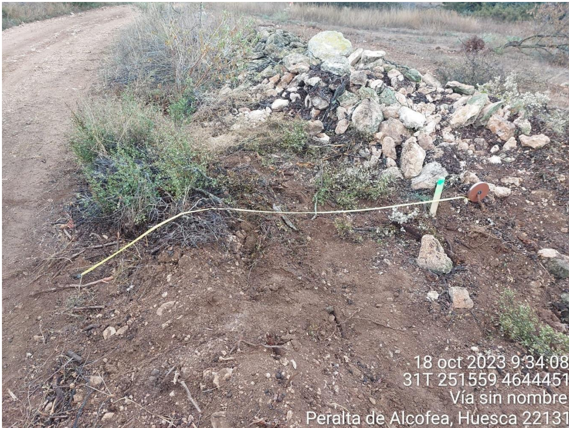
Imagen 1. No conformidad grave. Medición del borde del camino a la estaca muy superior a 1,5m.