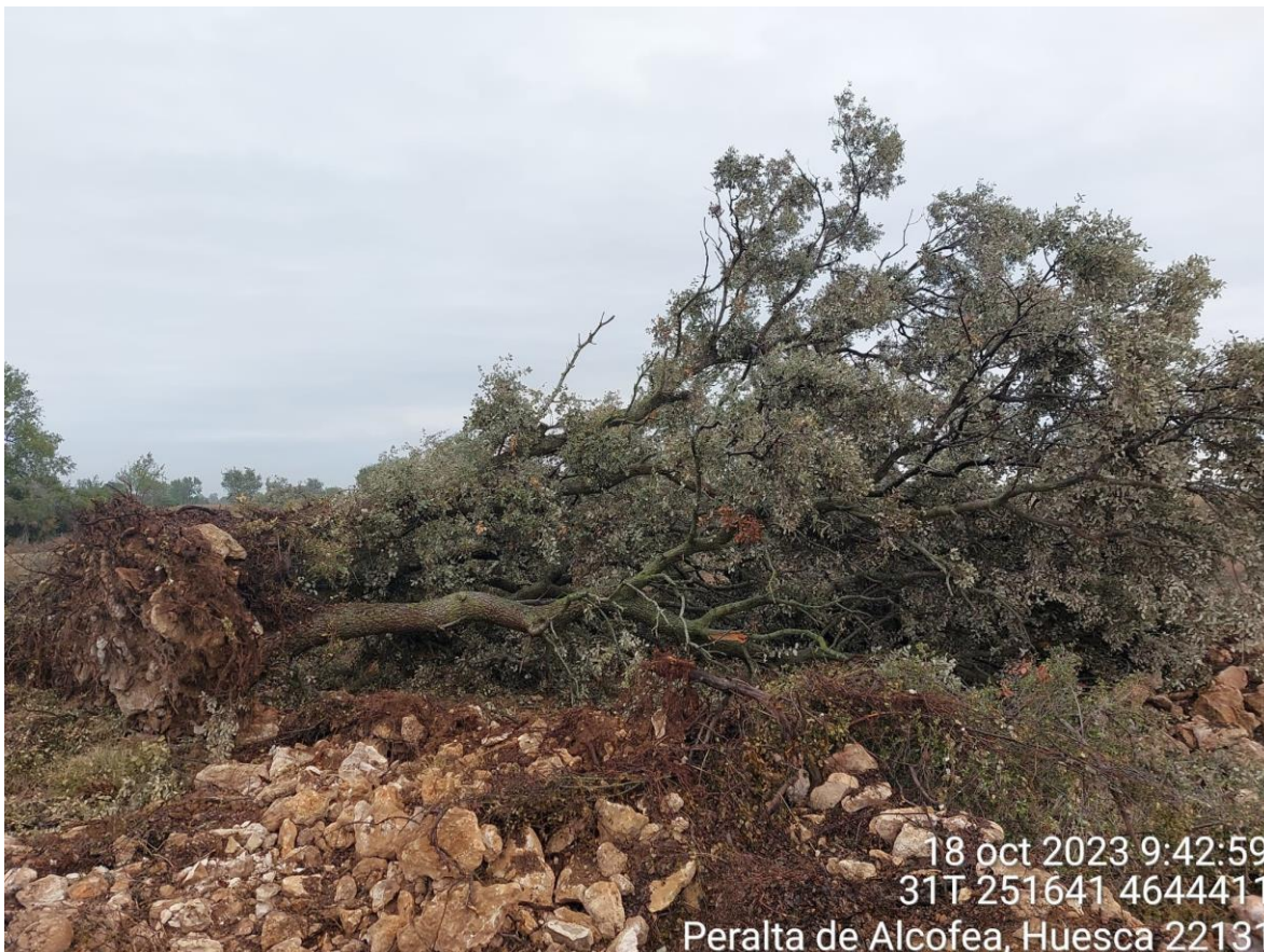
Imagen 2. Carrasca arrancada fuera de los límites del perímetro de la obra.