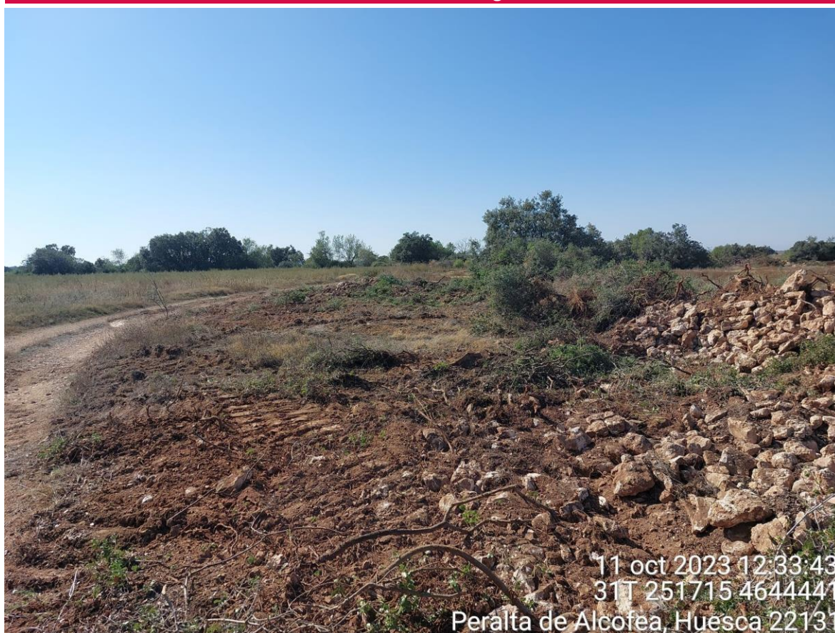
Imagen 1. No conformidad grave. Sobreafección en camino sin cumplir el condicionado del INAGA.