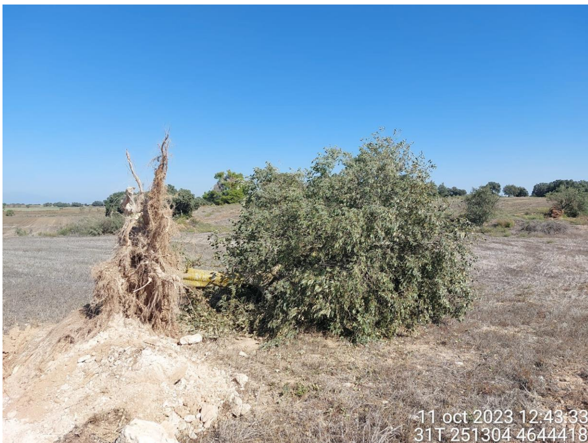
Imagen 3. No conformidad grave. Sobreafección en camino sin cumplir el condicionado del INAGA. Ejemplar de Celtis australis .