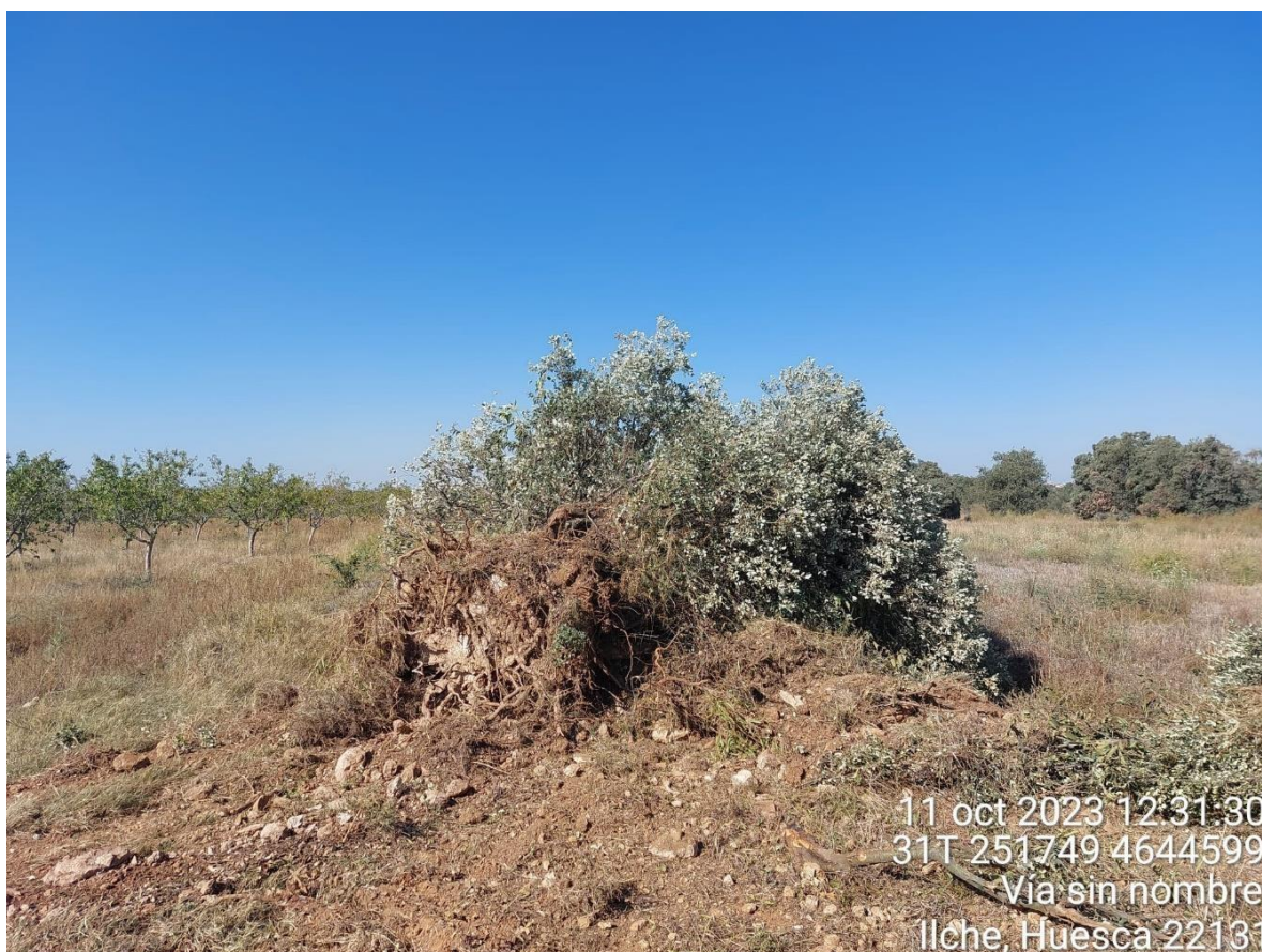
Imagen 2.No conformidad grave. Sobreafección en camino sin cumplir el condicionado del INAGA. Ejemplar de Quercus ilex arrancado.