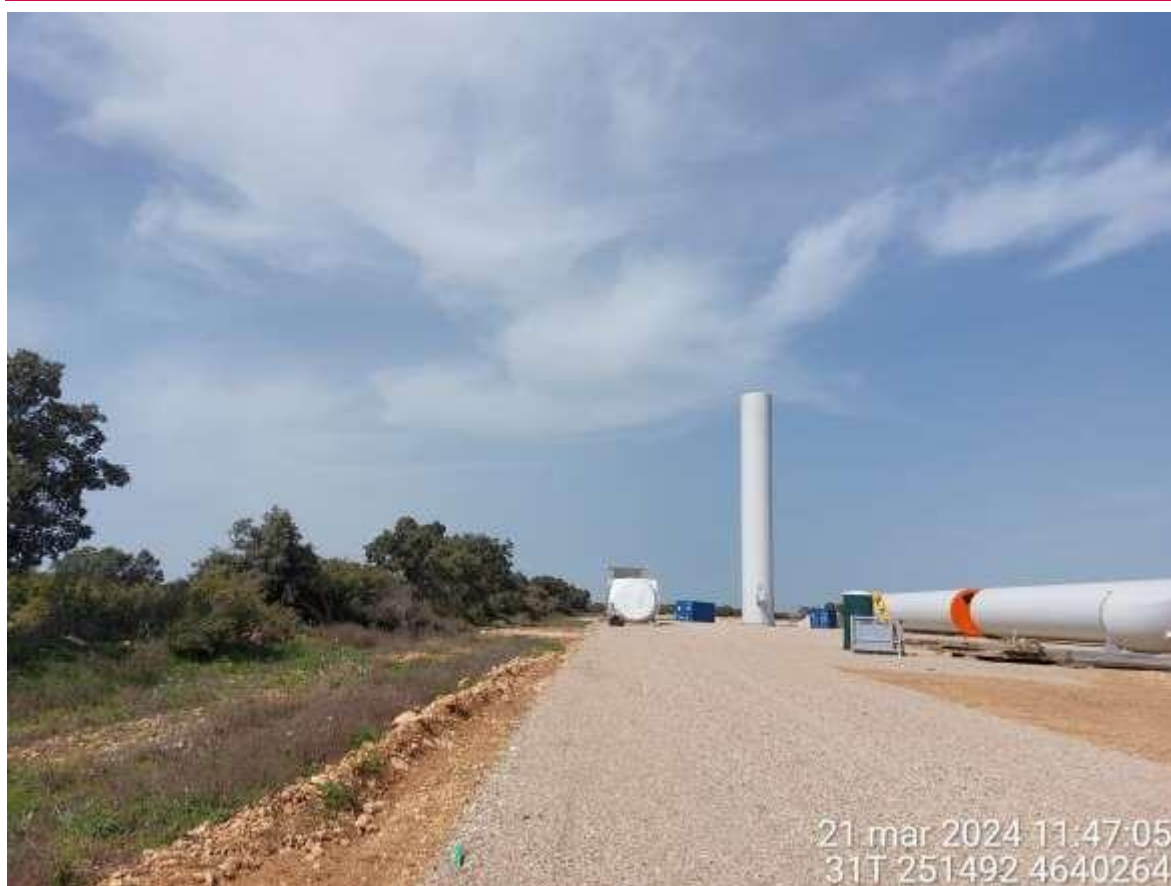
Ilustración 1. Montaje en SC3-03.