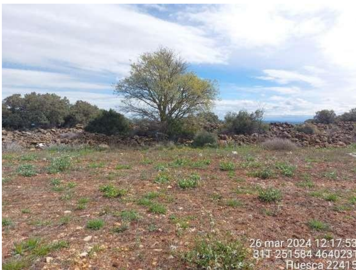
Imagen 1. NC leve debido a plásticos en el monte en SC3-03.