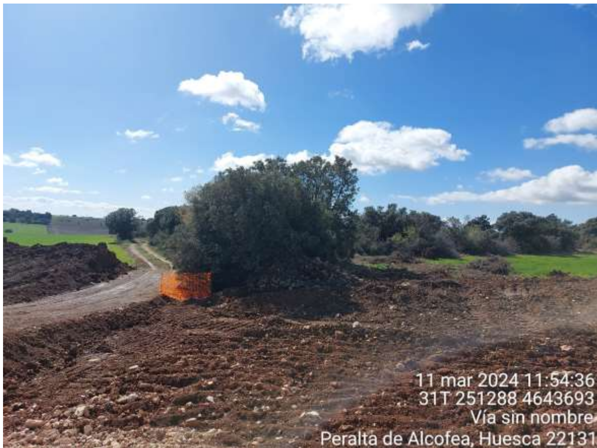
Imagen 1. Ejemplar de Quercus ilex balizado.