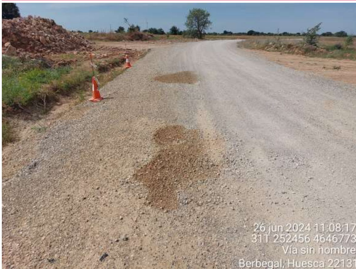
Imagen 1. Derrame en SC4-02 por fuga en uno de los transportes de componentes. Se notifica y se gestiona adecuadamente