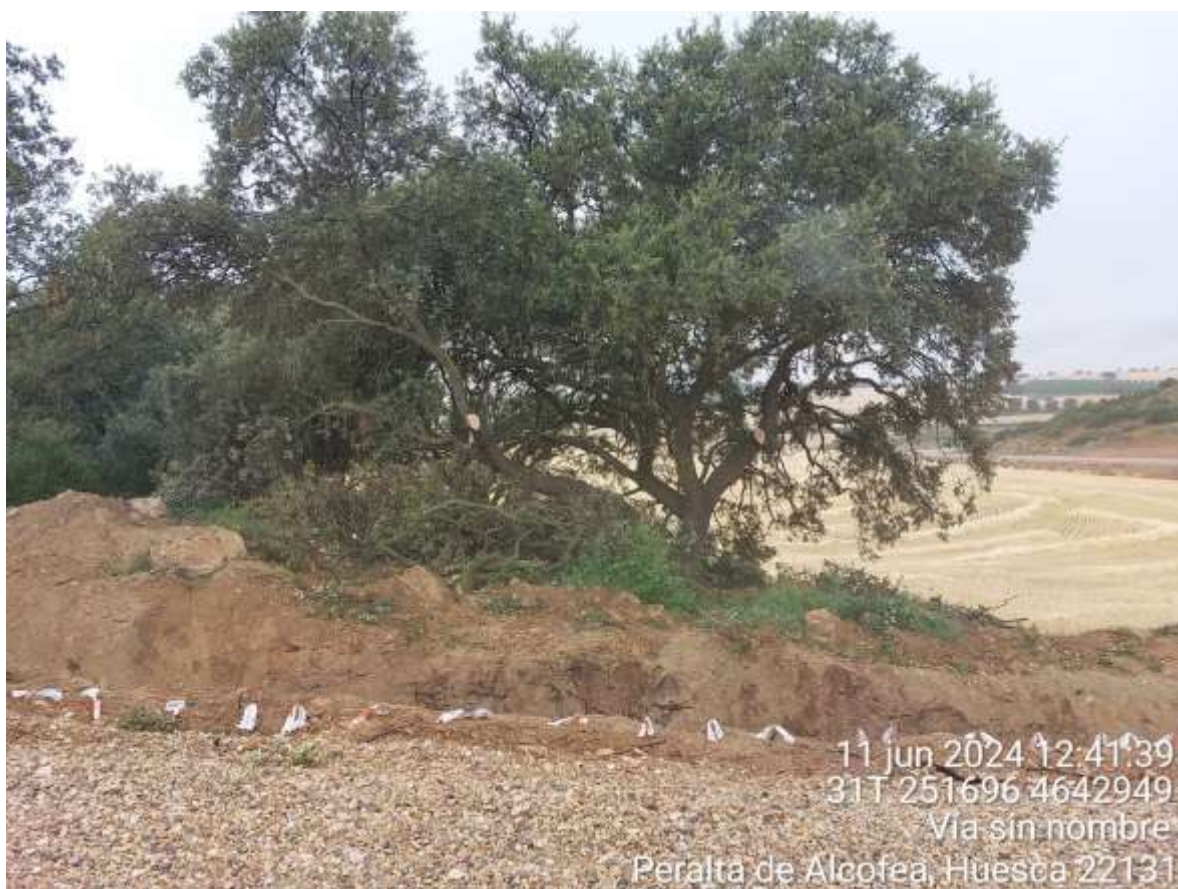
Imagen 1. Trabajos de poda en carrasca para posibilitar el paso de grandes componentes.