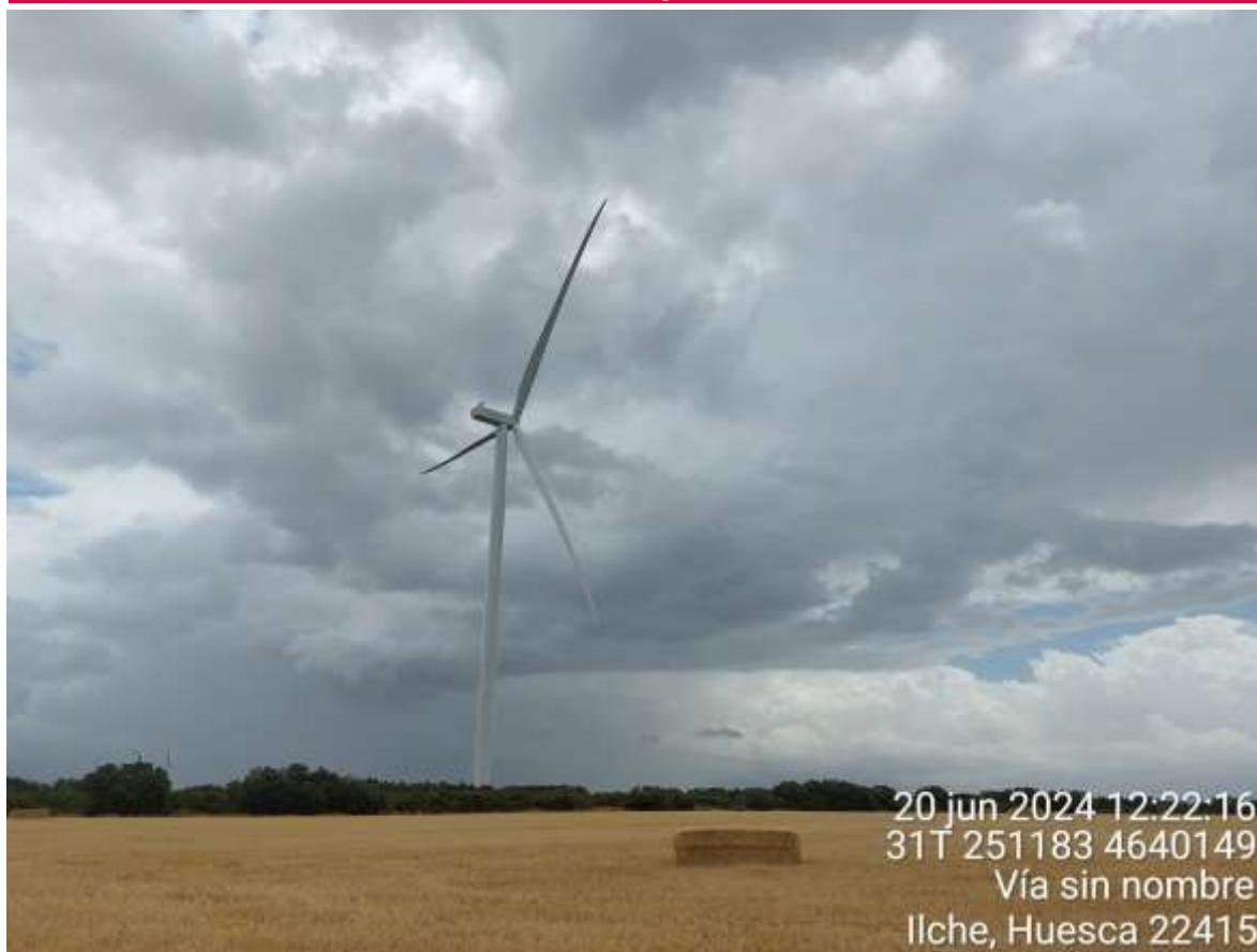
Imagen 1. Aerogenerador de SIS montado visto desde campo de cultivo cosechado.