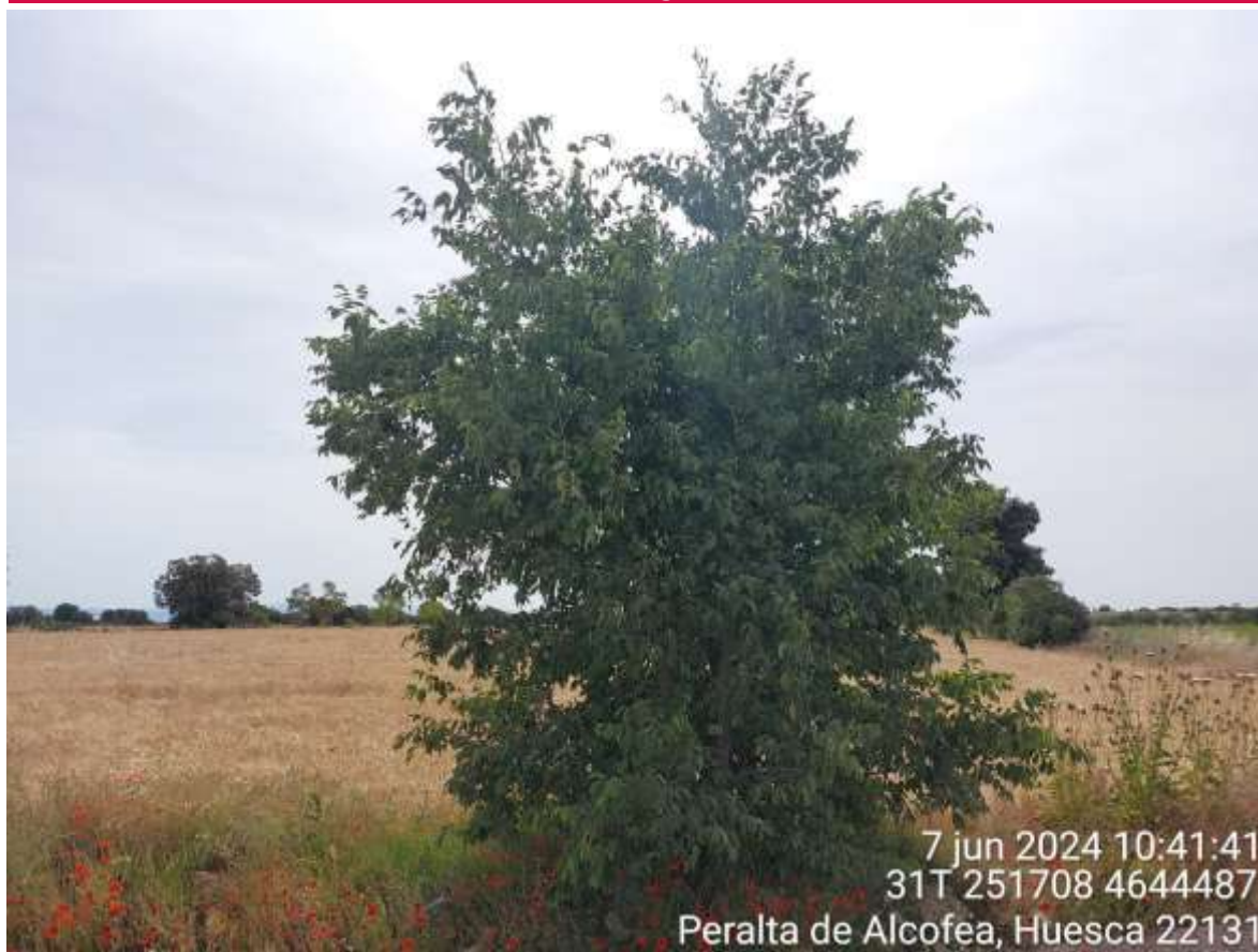
Imagen 1. Ejemplar de Tilia cordata que debe ser arrancado para el paso de componentes.