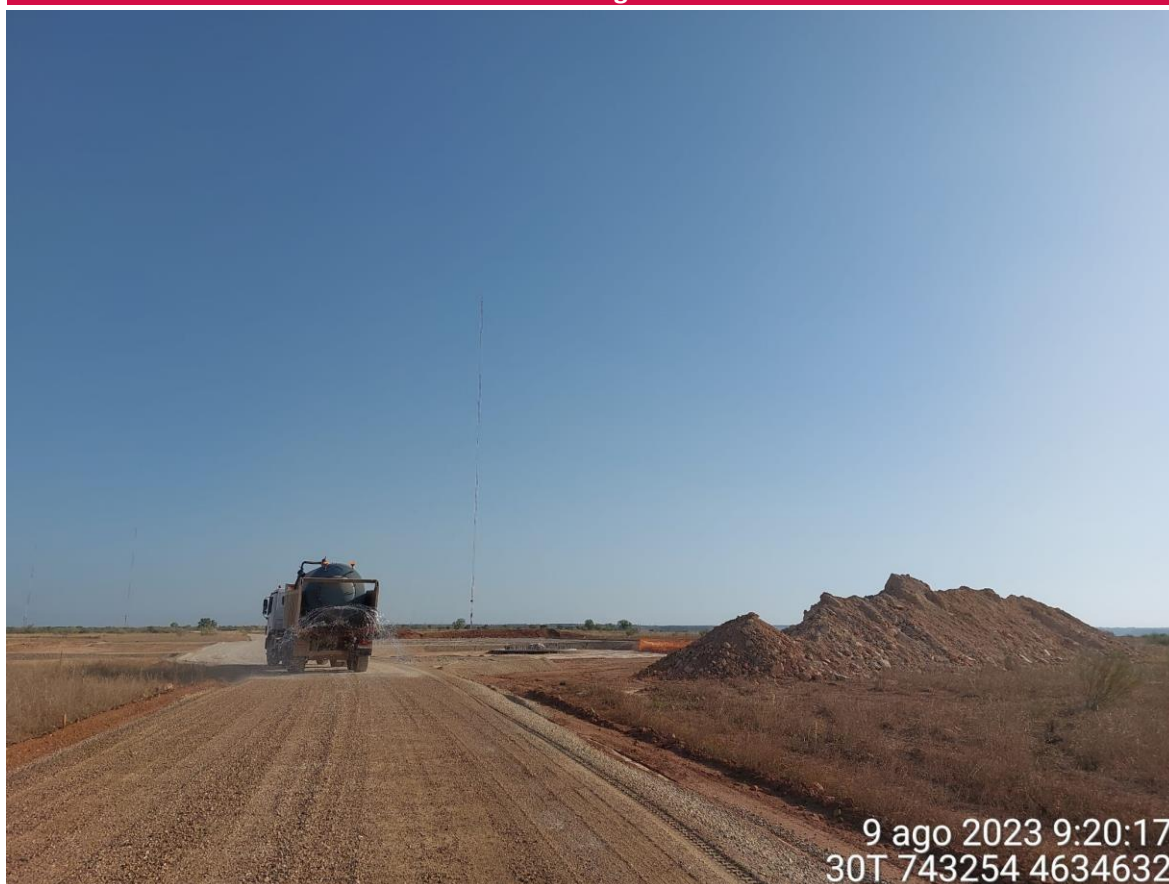
Imagen 1. Cuba de agua regando vial en SC2 durante el extendido de zahorra.