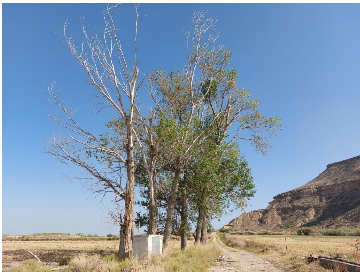
Imagen 2. Chopos a podar para el paso de componentes a SC.