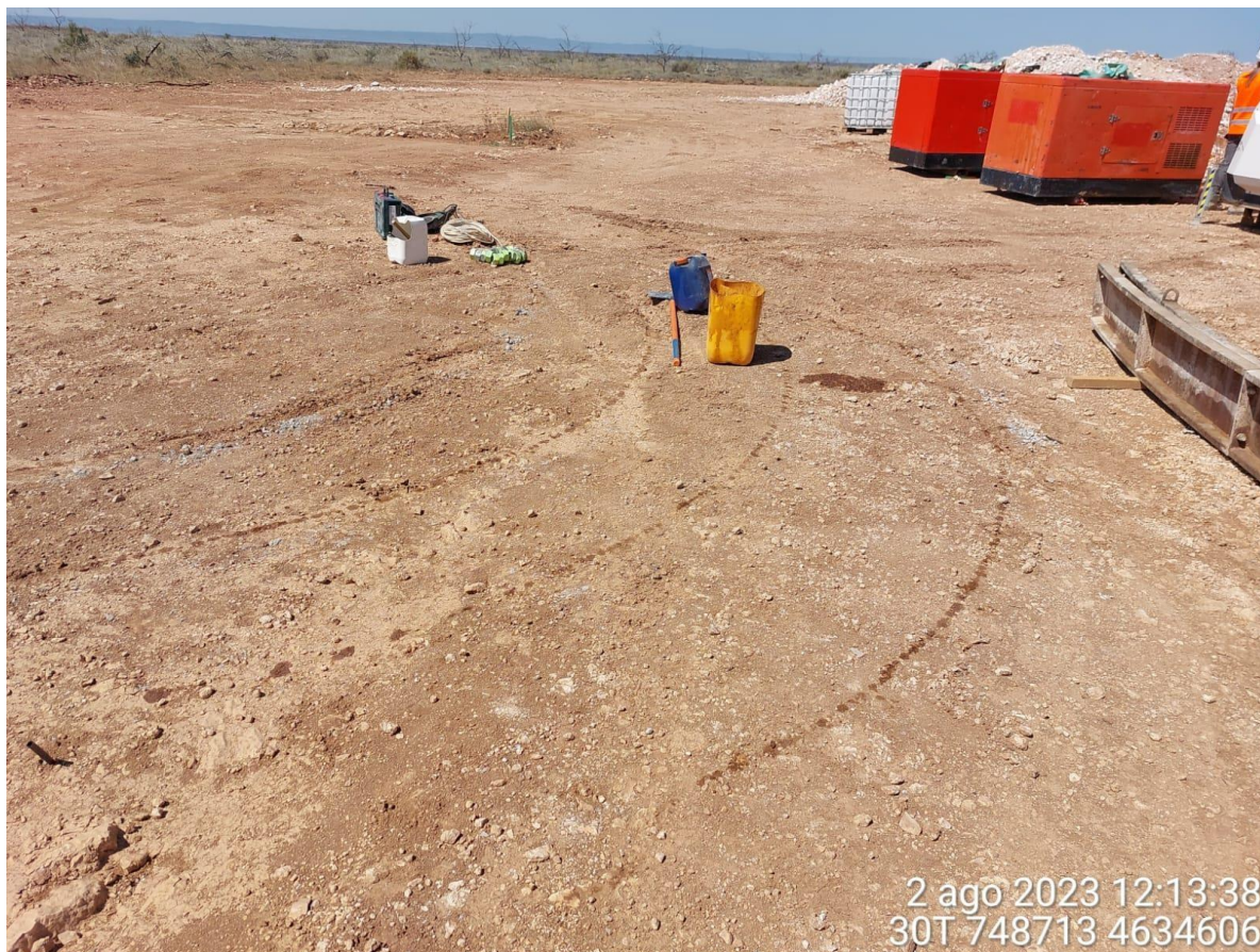
Imagen 2. Manchas de aceite en el suelo debido a la fuga de maquinaria.