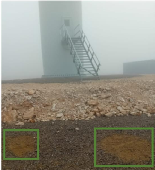
Santa Cruz I – 01