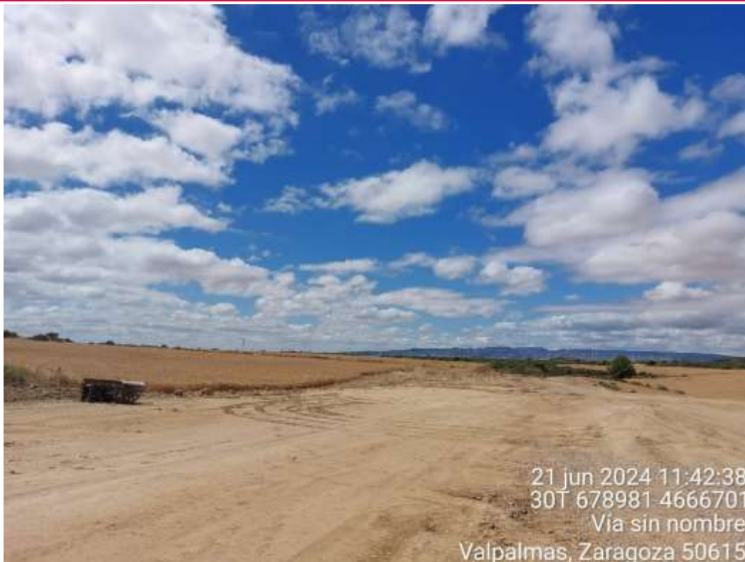
Imagen 1. Imagen panorámica tomada desde PAU06.