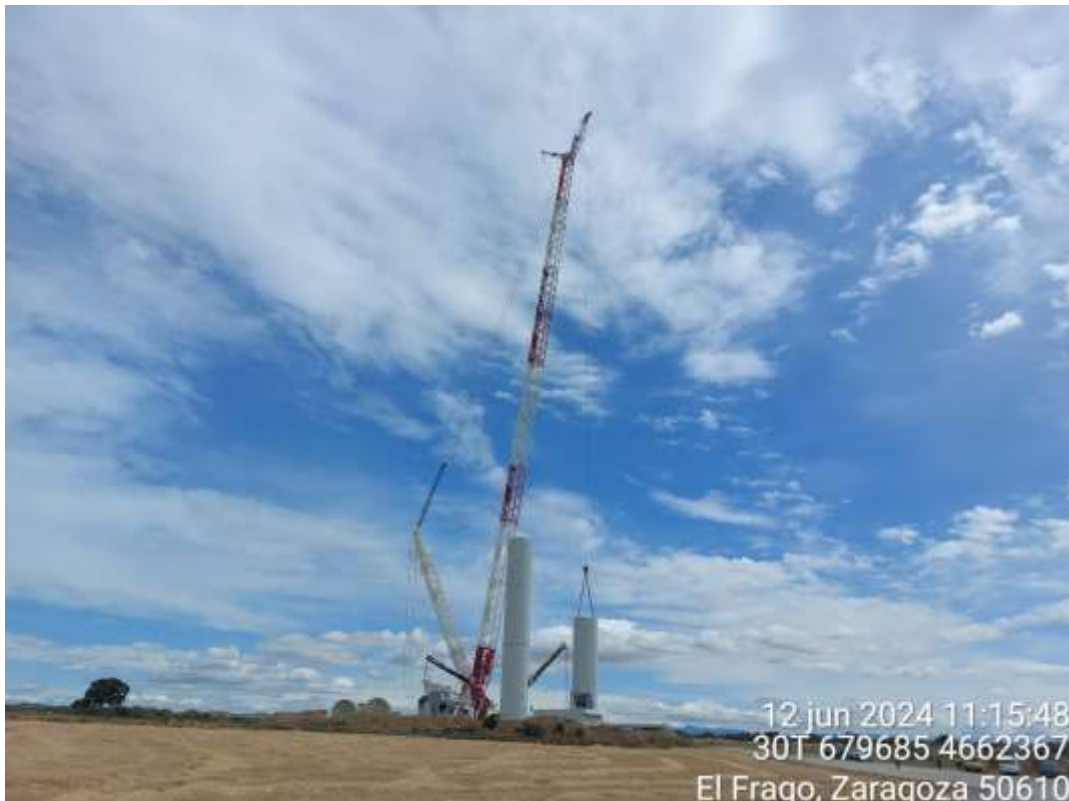
Imagen 1. Primeras fases de montaje de la posición PAU-09.