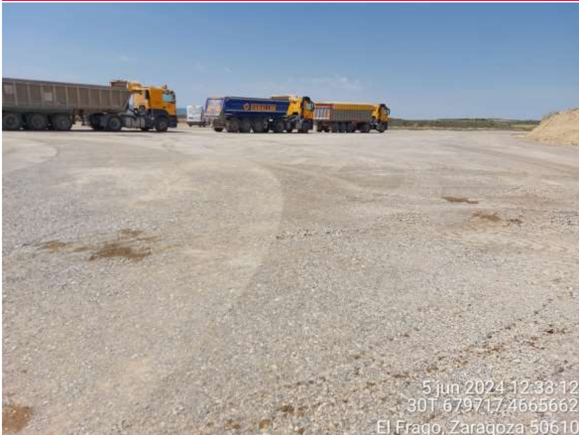
Imagen 1. No conformidad grave. Varios de los muchos derrames que hay por la obra.