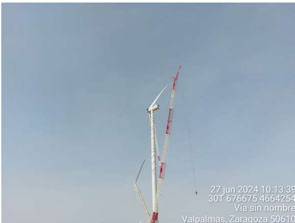
Imagen 2. Montaje del aerogenerador SRQ-03.