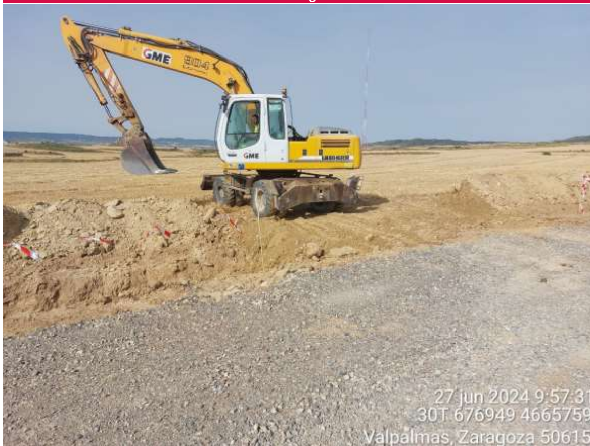
Imagen 1. Trabajos de tapado de zanja para permitir paso de agricultores para cosechar.