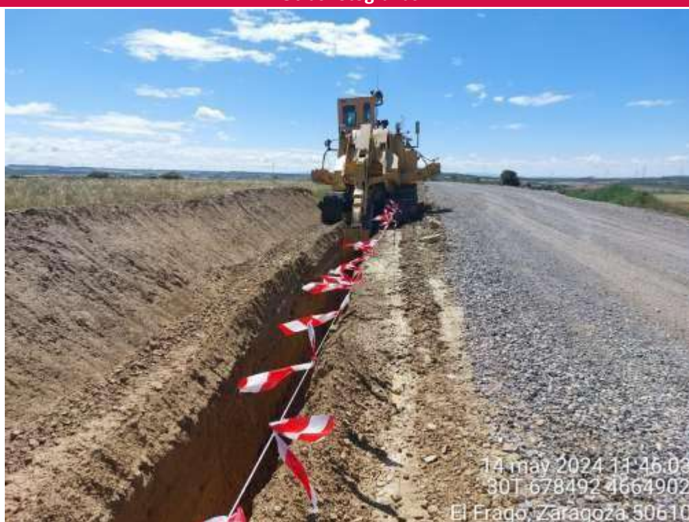
Imagen 1. Zanjadora realizando trabajos de apertura de zanja en SRQ.