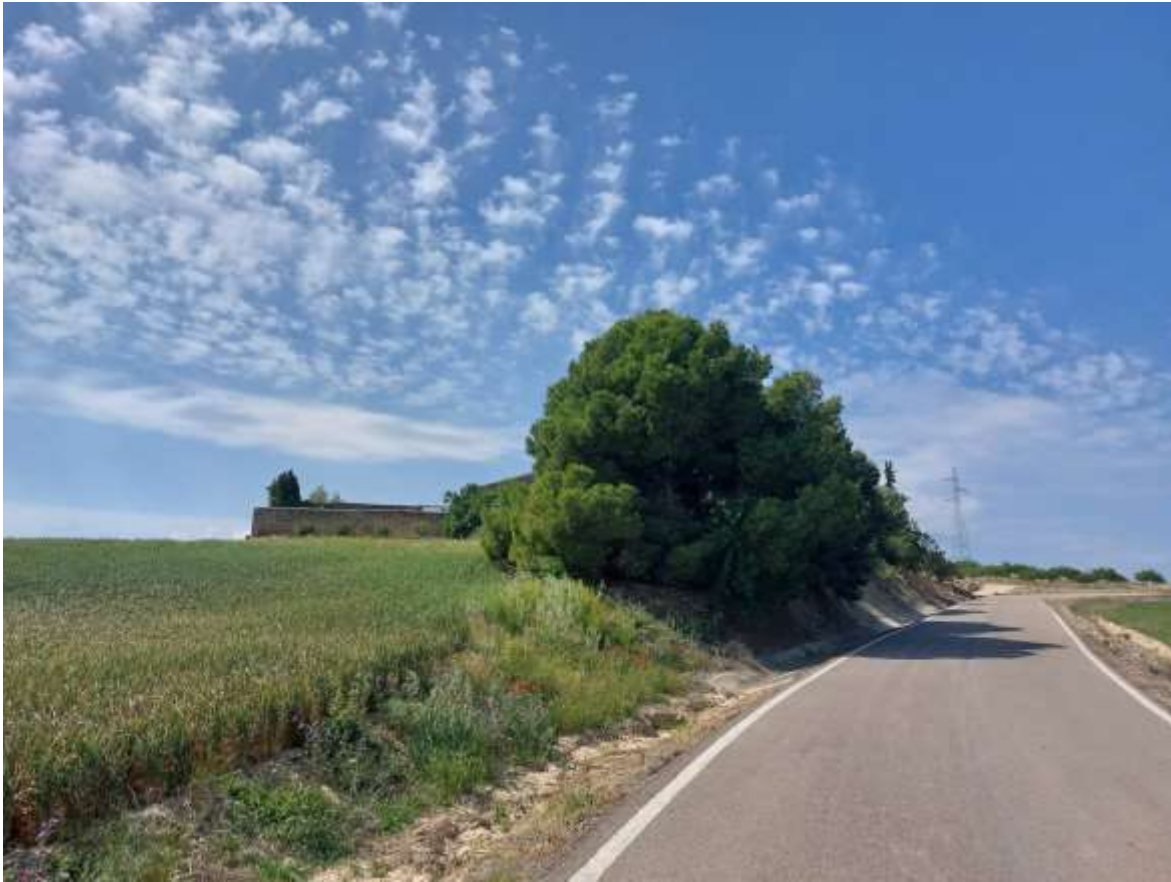
Imagen 1. Zona sobre la que se va a actuar con trabajos de poda para paso de componentes.