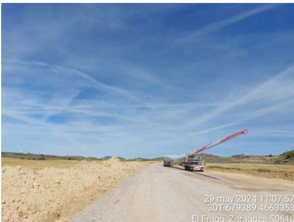
Imagen 1. Llegada de componentes a parque.