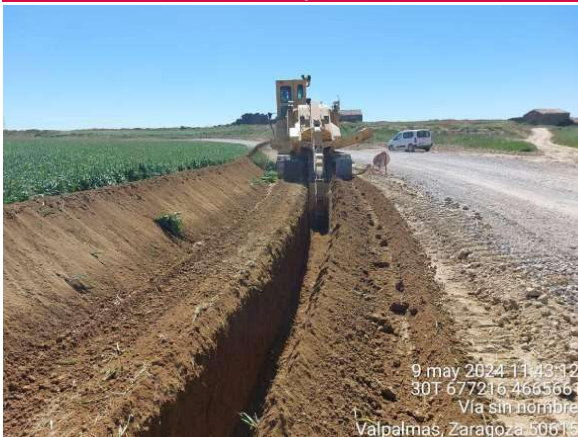
Imagen 1. Zanjadora abriendo zanja en PE San Roque.