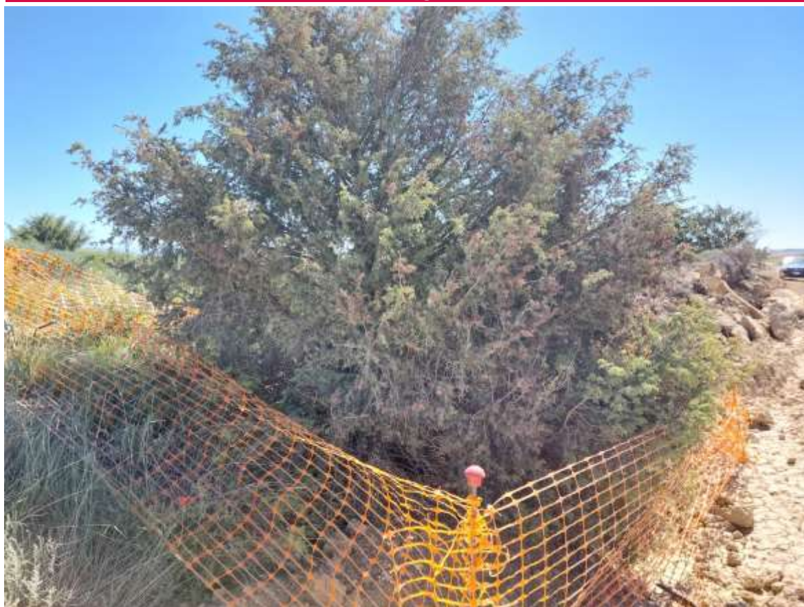
Imagen 1. Ejemplar de Juniperus sp sobre el que se consulta una posible poda para el paso de la zanja.