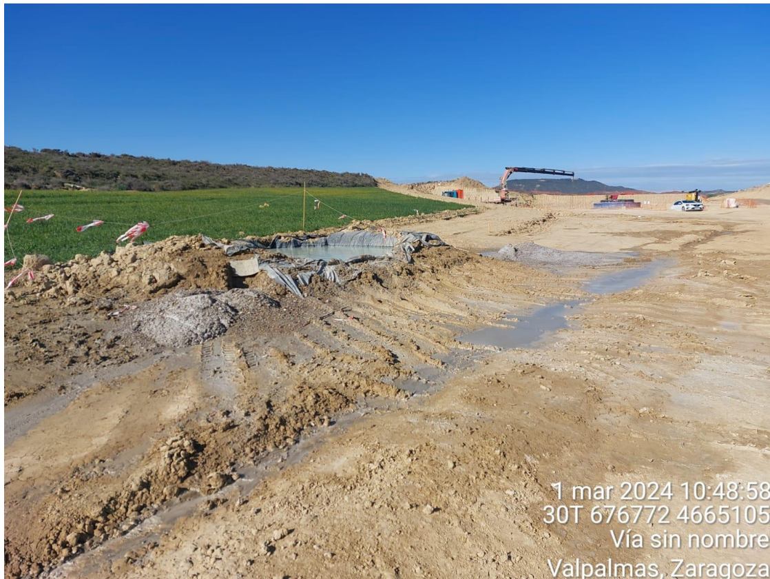
Imagen 1. No conformidad leve. Contaminación del suelo por pozo de lavado rebosado y por mal lavado de las cubas.