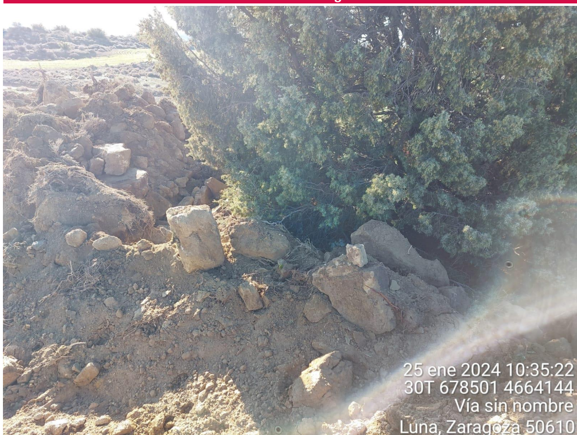
Imagen 1. Ejemplar de Juniperus communis afectado por el cordón de tierra vegetal y material de excavación.