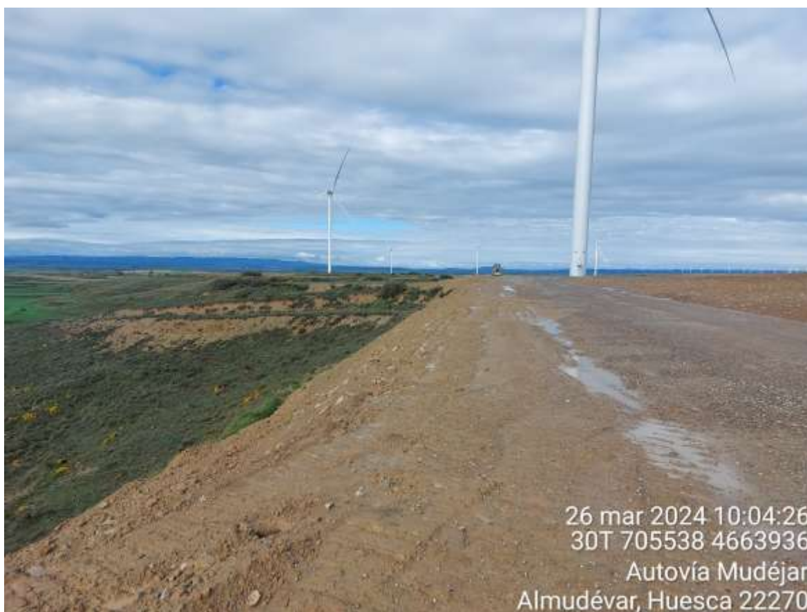
Imagen 1. Hidrosiembra en talud de SIS-06.