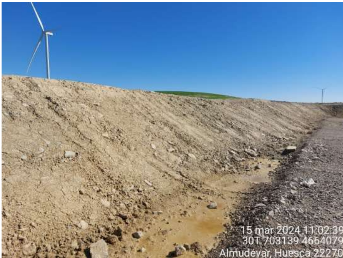
Imagen 2. Talud de SIS-02 recién hidrosechado.