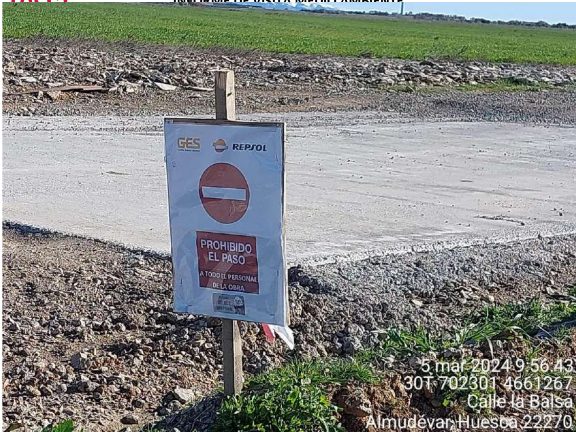
Imagen 1. Prohibición de paso al personal de la obra por ocupación de nido de águila real.