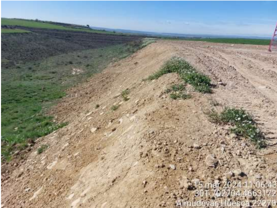
Imagen 1. Talud de la TM tras realizar la hidrosiembra.