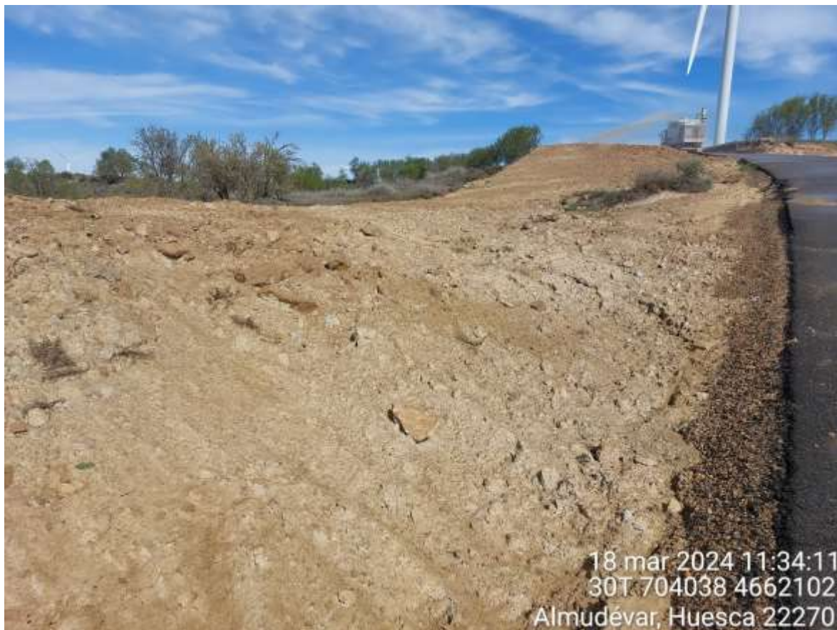
Imagen 1. Trabajos de hidrosiembra en el vial que sube a SIS-04.