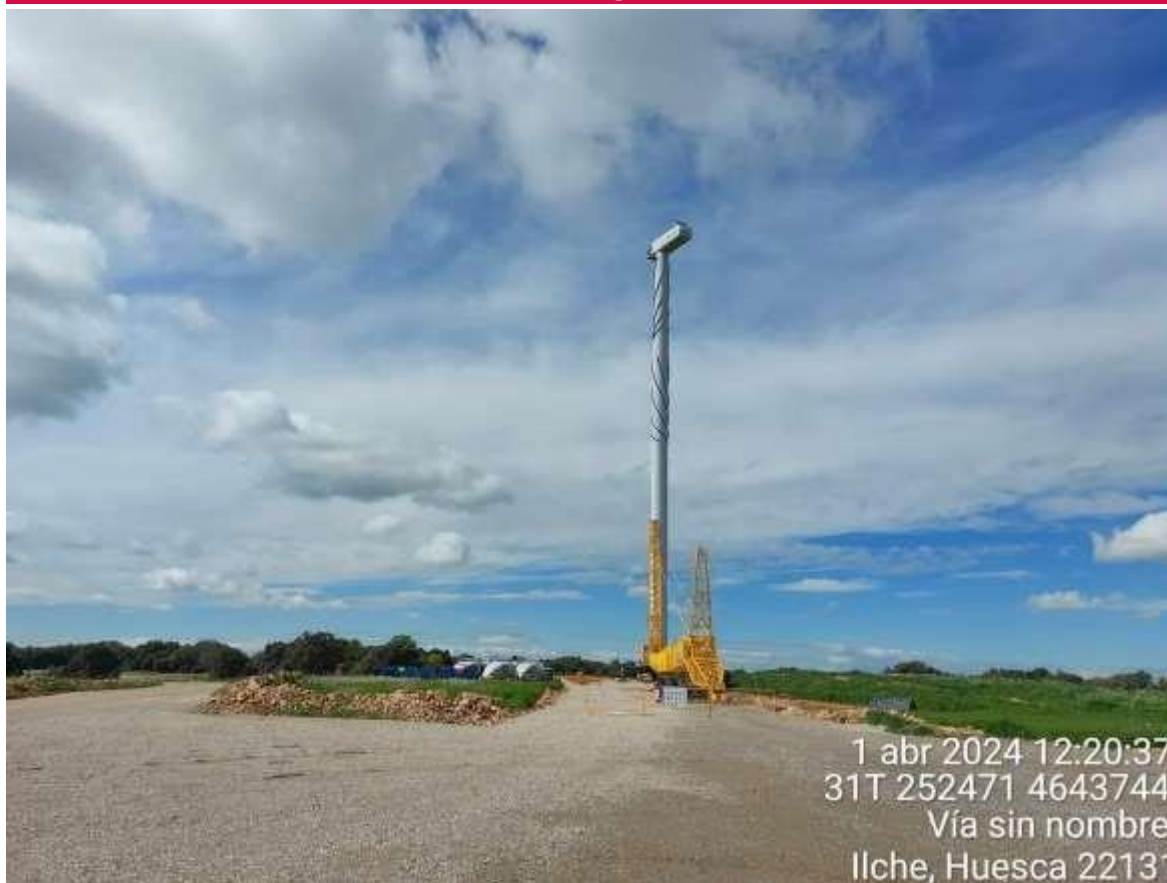
Imagen 1. Posición SIS2-01 en montaje.