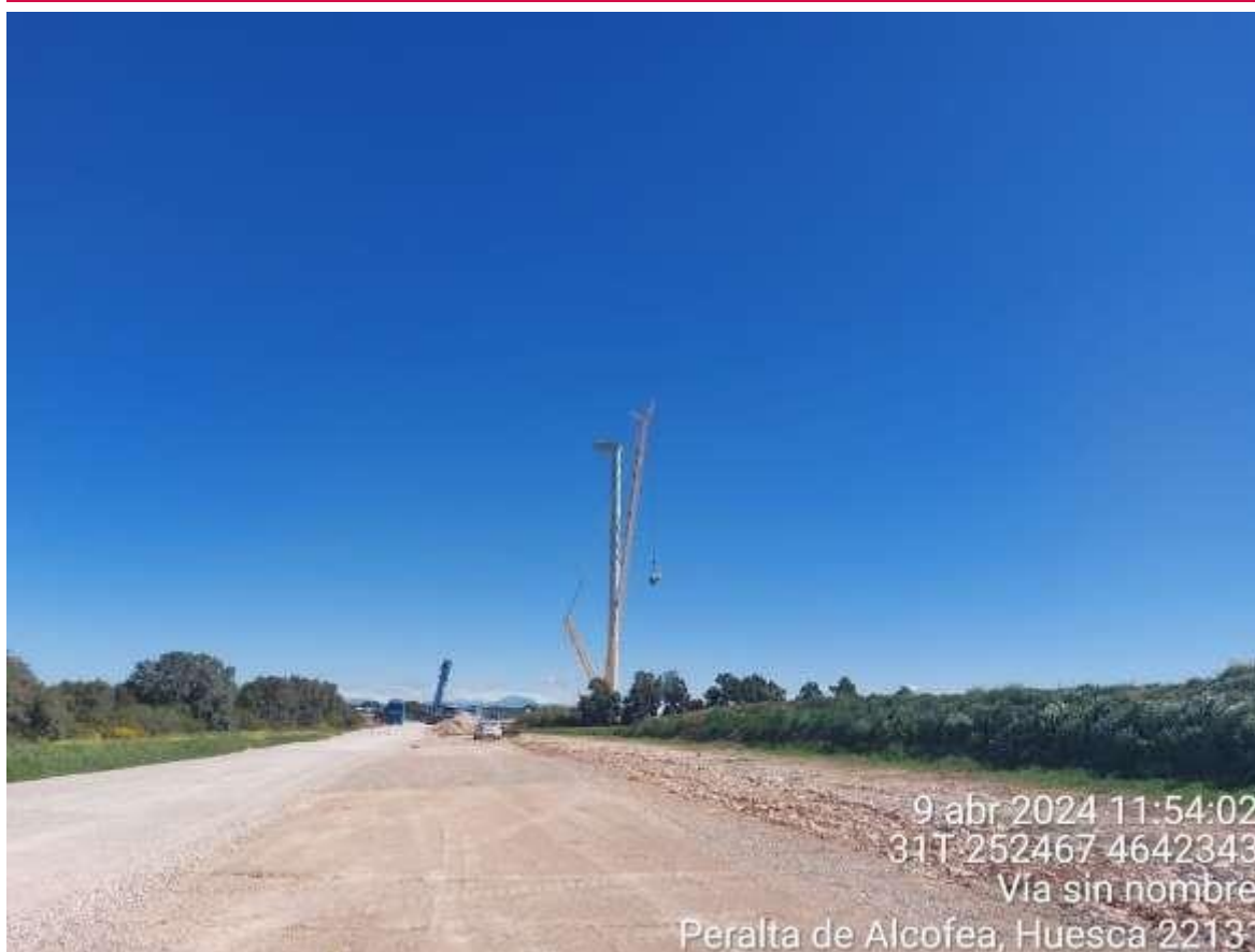
Imagen 1. SIS2-02 con prohibición de paso con DT asegurado.