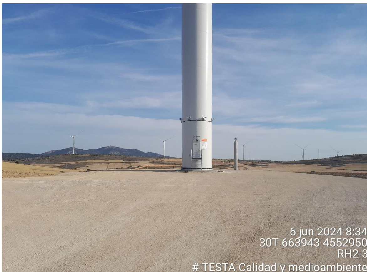
Imagen 1. Plataforma RH2-3