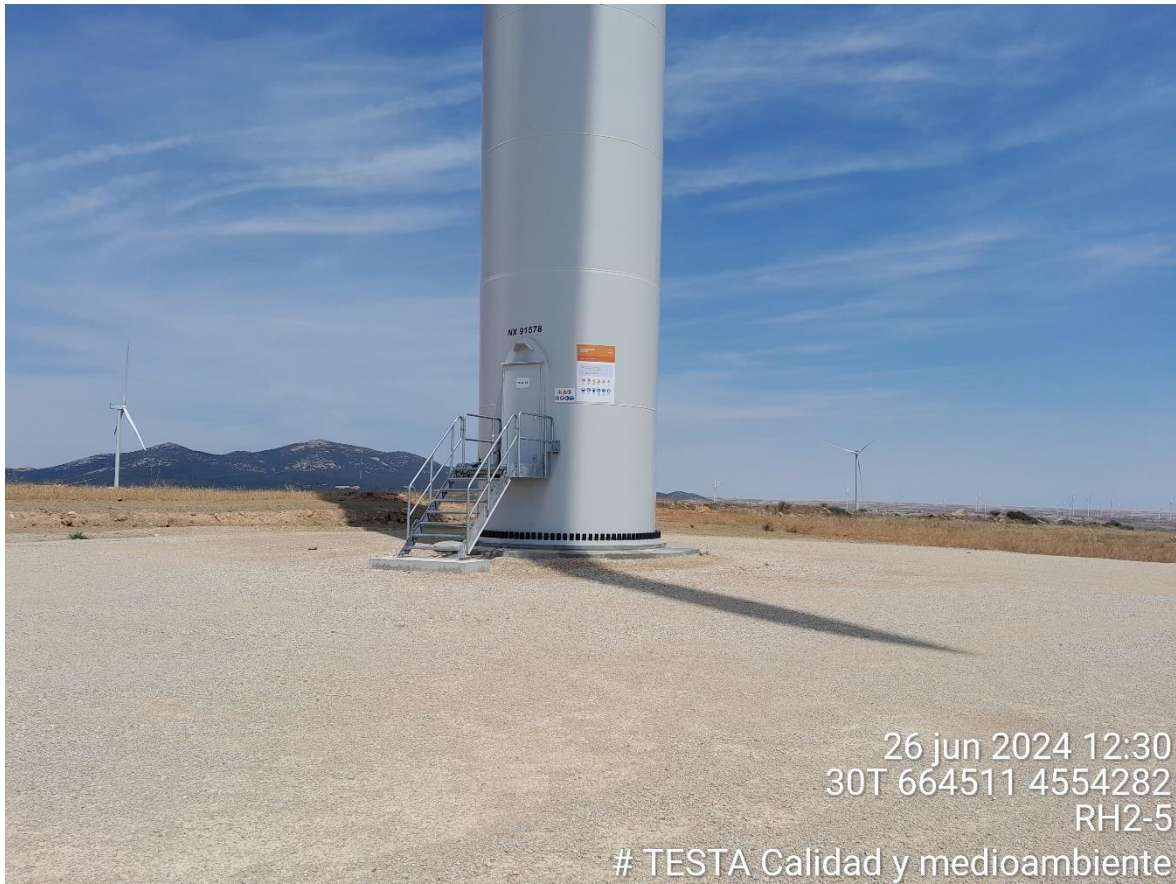
Imagen 1. Plataforma RH2-5 restaurada