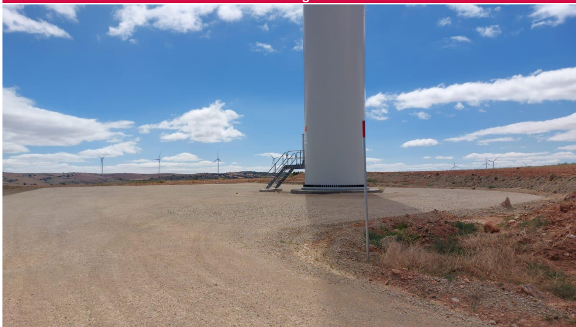
Imagen 1. Plataforma RH2-4 restaurada