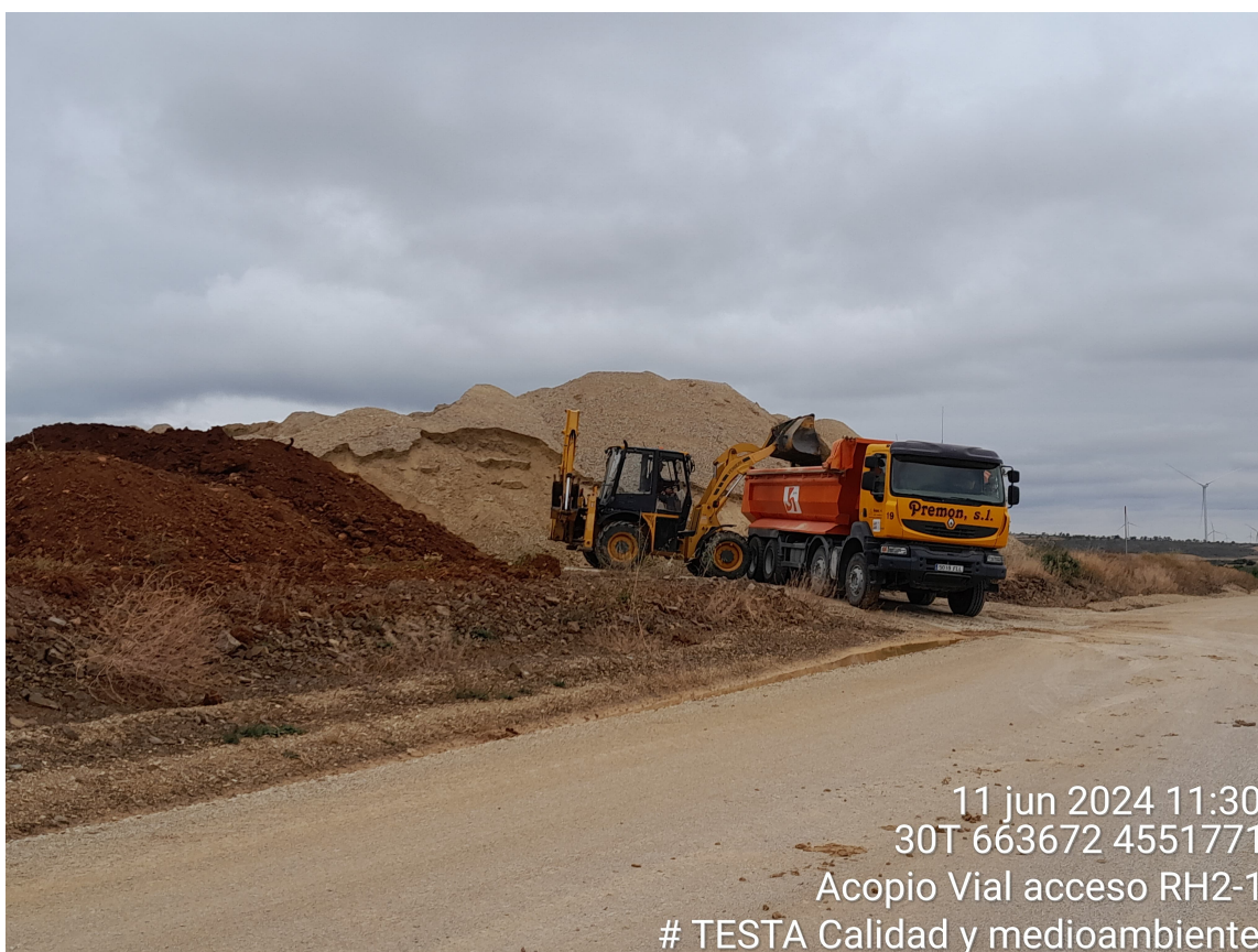
Imagen 1. Acopio Vial acceso RH2-1