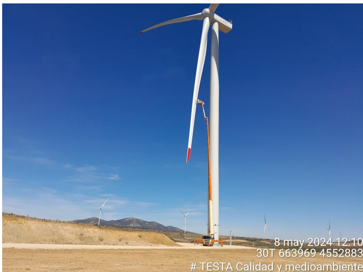
Imagen 1. Ajuste de palas en RH2-3