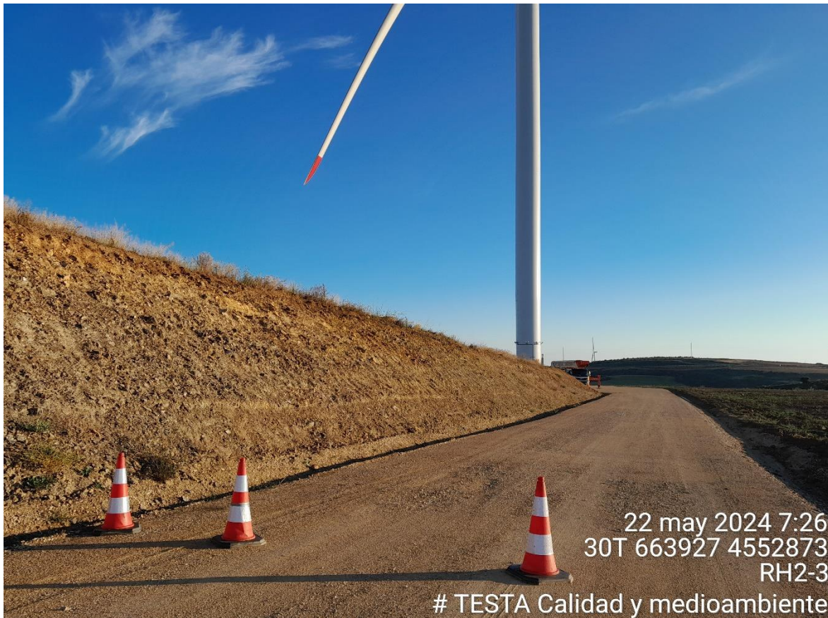
Imagen 1. Plataforma RH2-3