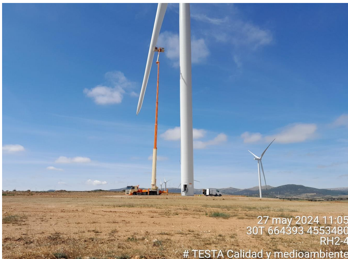
Imagen 1. Plataforma RH2-4. Reparación de palas.