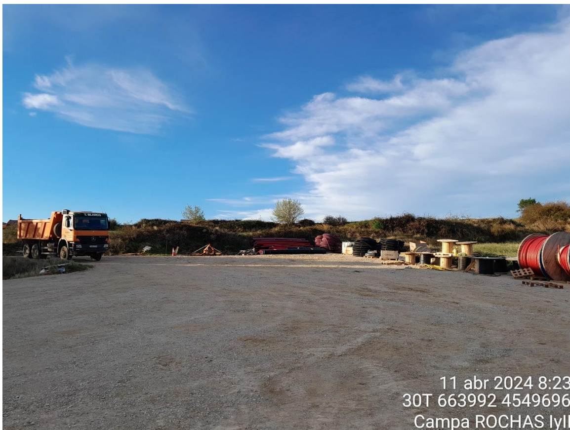
Campa ROCHAS Iyll