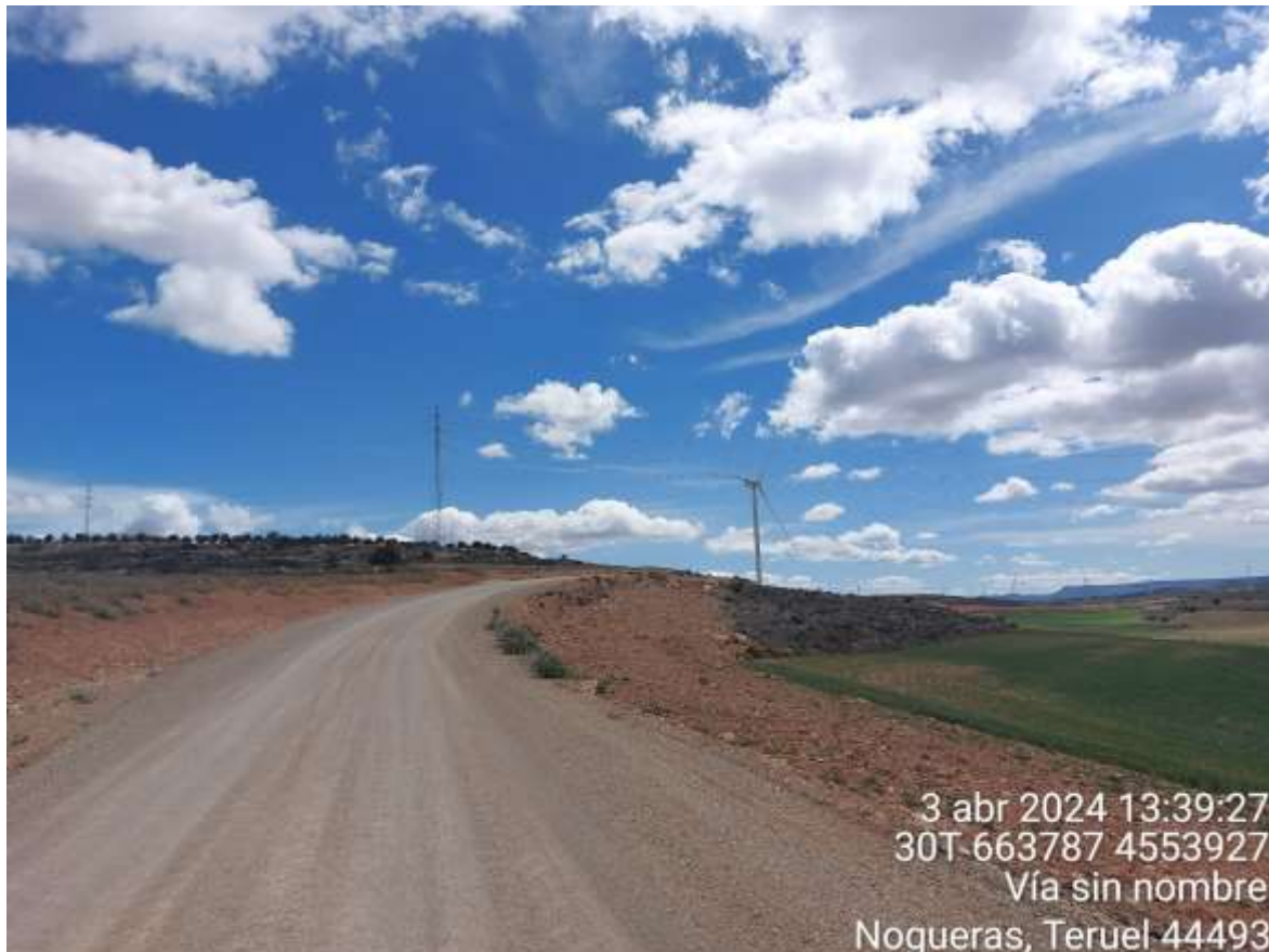
Imagen 1. Vial restaurado con la zona de la zanja hidrosebrada.