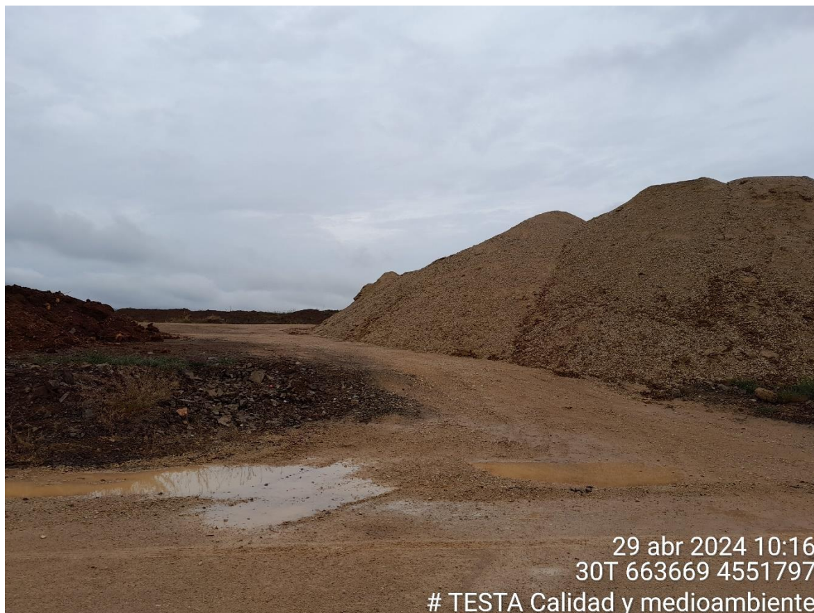
Imagen 1. Acopio junto al vial de acceso a RH2-1