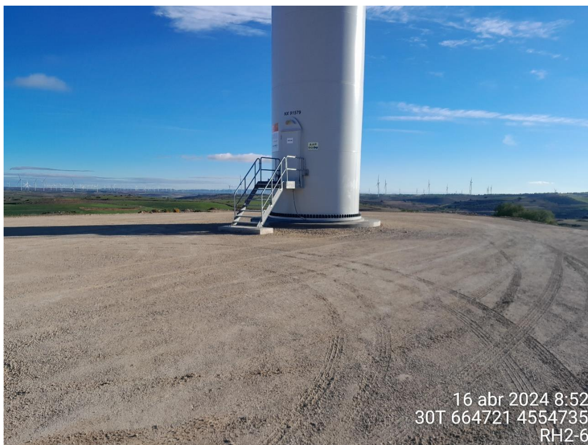
Imagen 1. Plataforma RH2-6