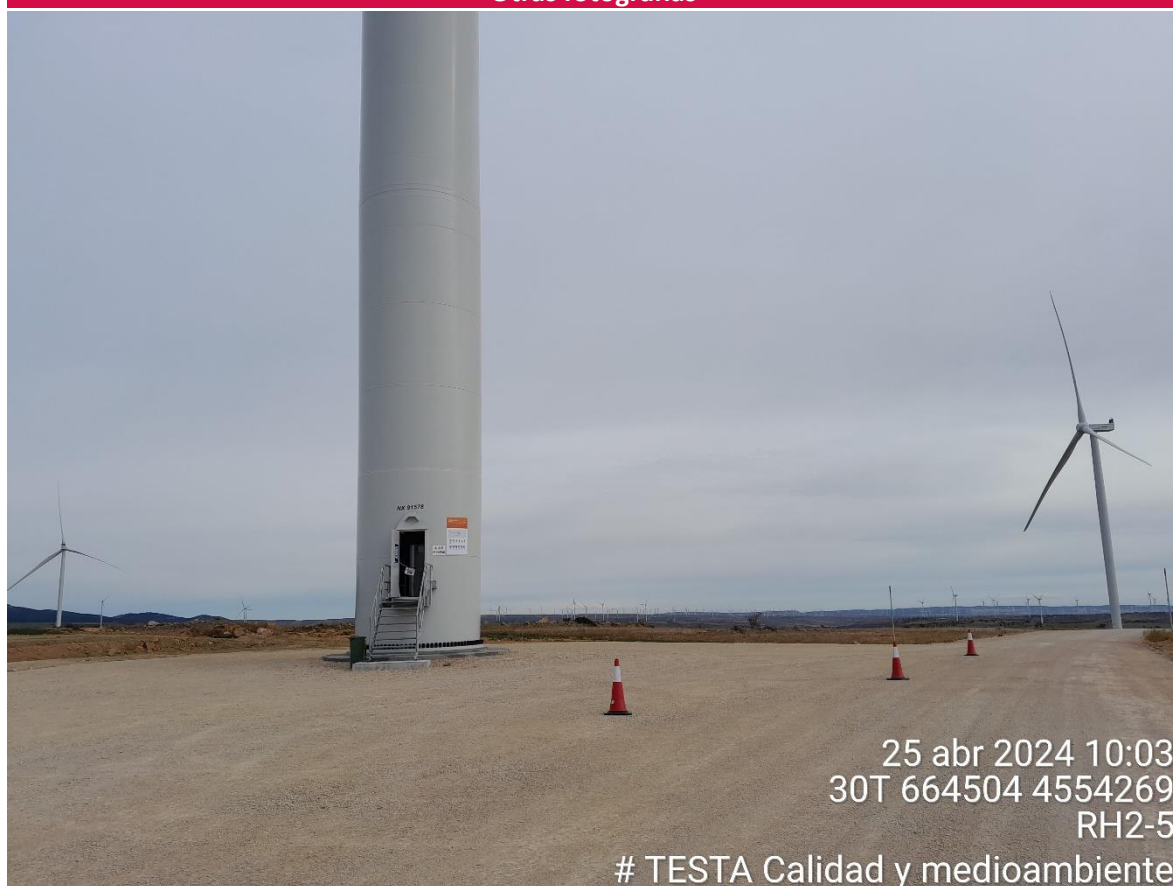
Imagen 1. Plataforma RH2-5 balizada