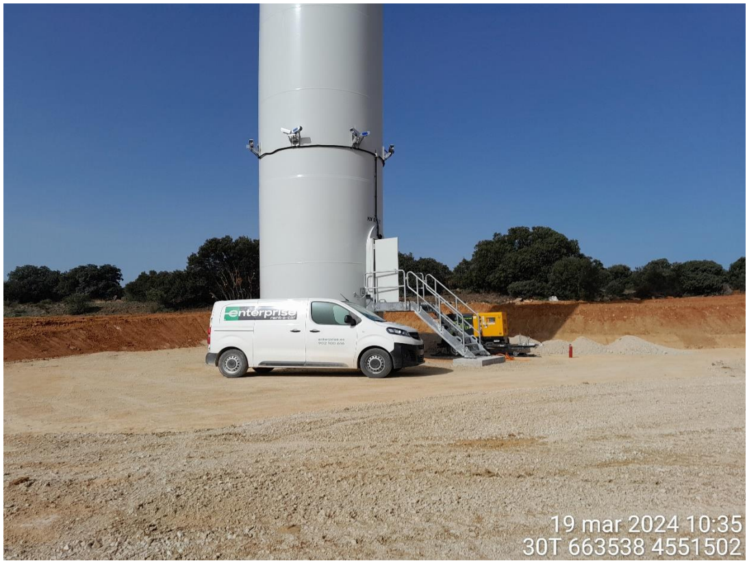
Acceso cortado a RH2-3