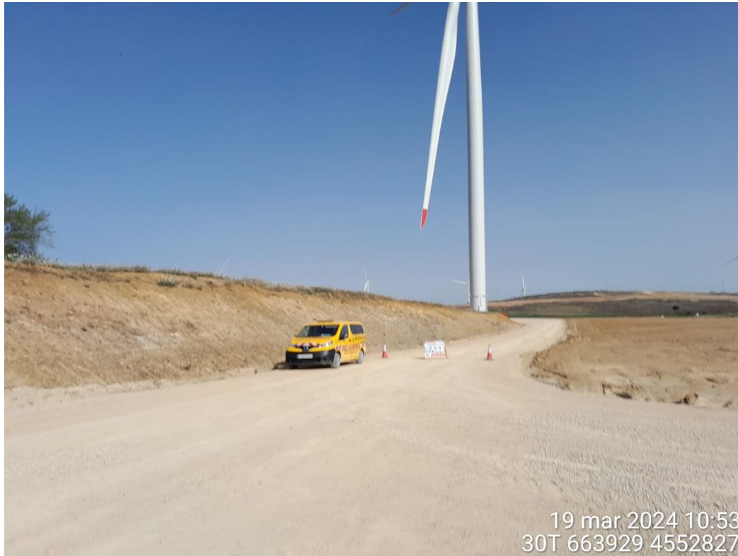
Acceso cortado a RH2-5