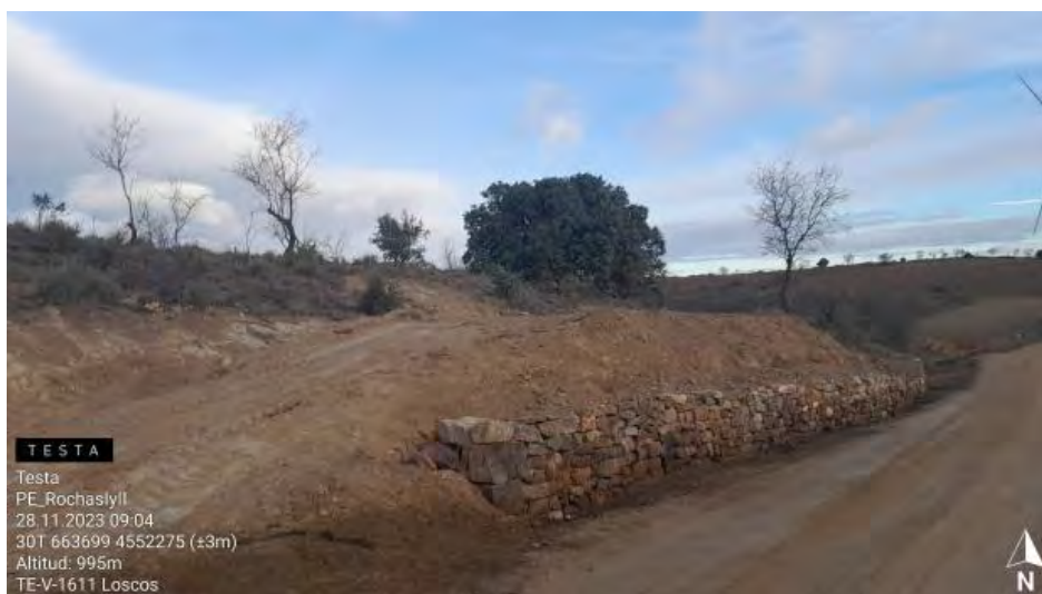
Restauración de murete en vial anterior a campa de acopio en RH2.