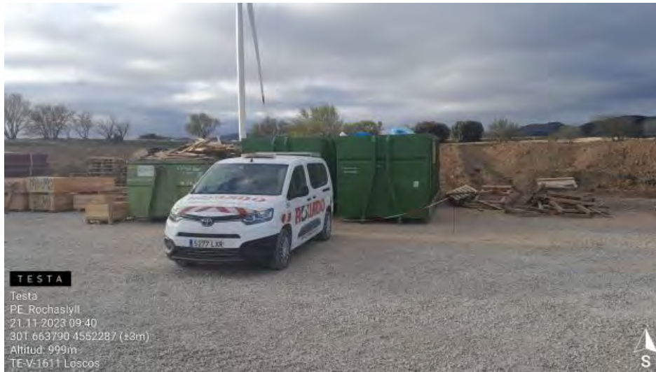
Contenedores RNP sin gestionar en punto limpio.