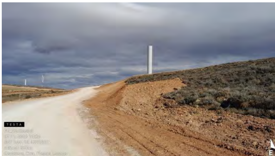
Tapado de zanja de evacuación y extendido de tierra vegetal .