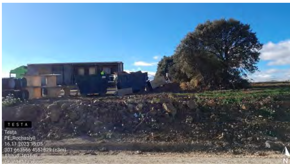
Punto limpio adecuado.