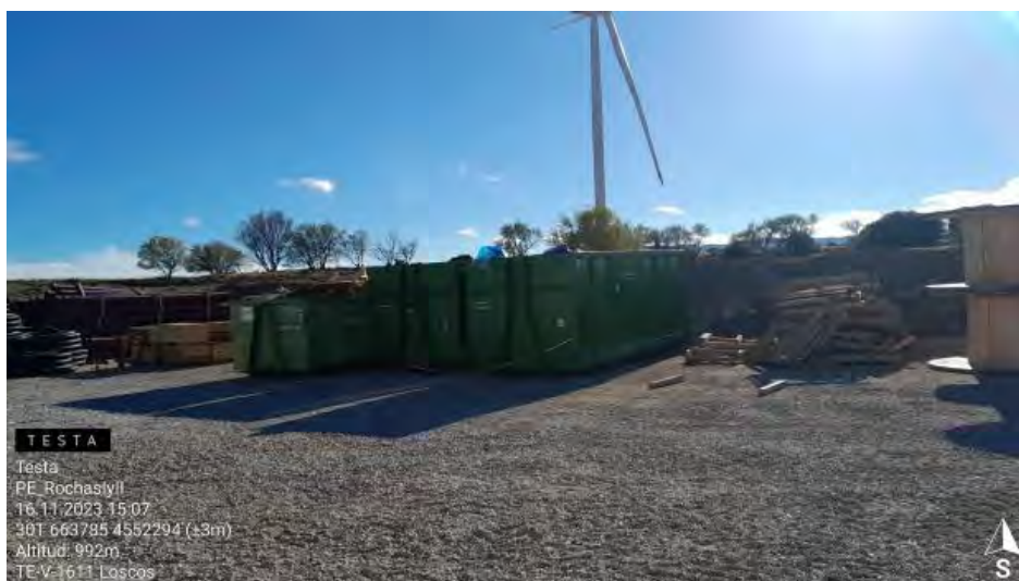
Contenedores RNP sin gestionar.