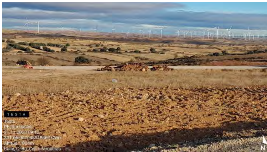
Residuos y materiales esparcidos debido a las fuertes rachas de viento en RH2-5 .