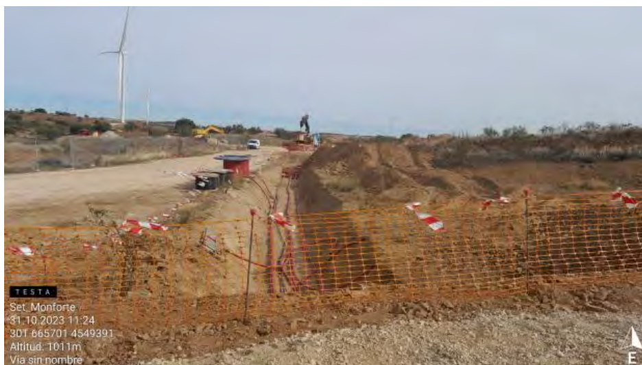
Tendido de cable en tramo SET monforte.