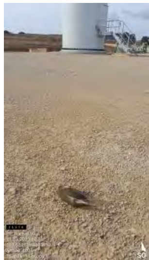
Siniestro de curruca capirotada en RH2-1.