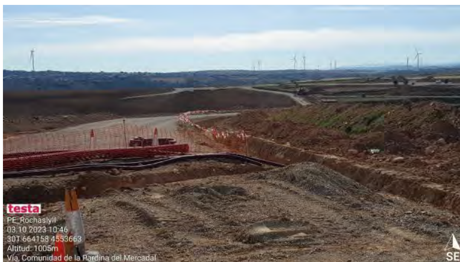
Trabajos en zona de RH2-4