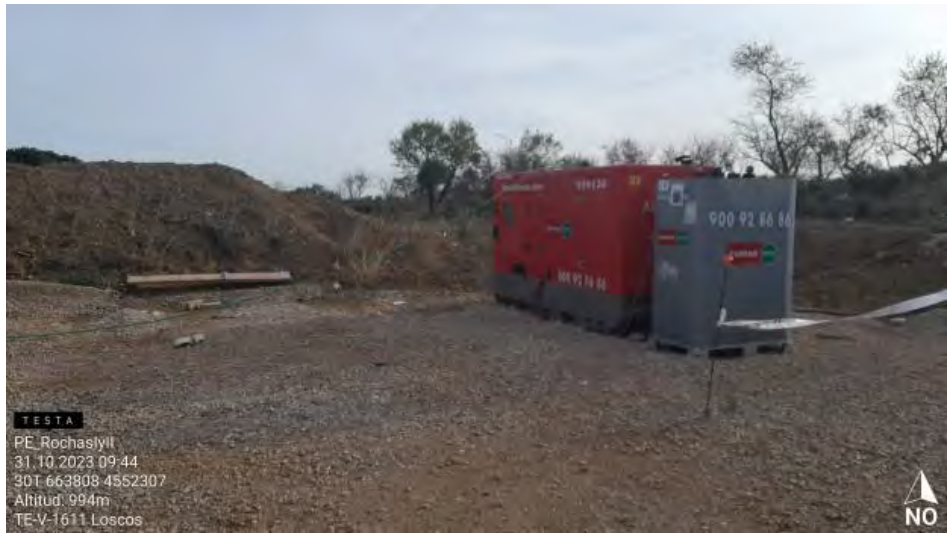
Generador sin protección de suelo