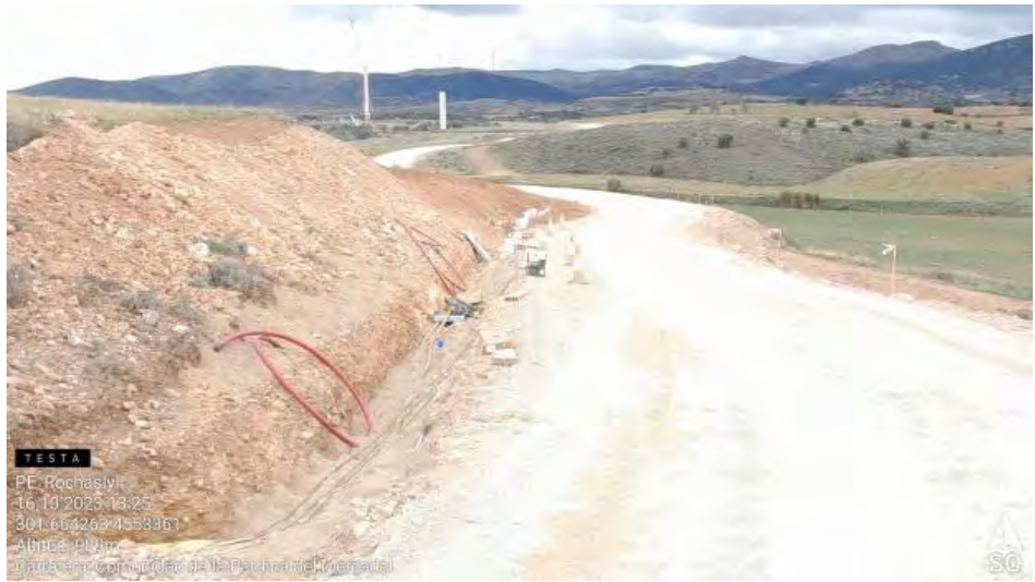
Generador sin protección de suelo