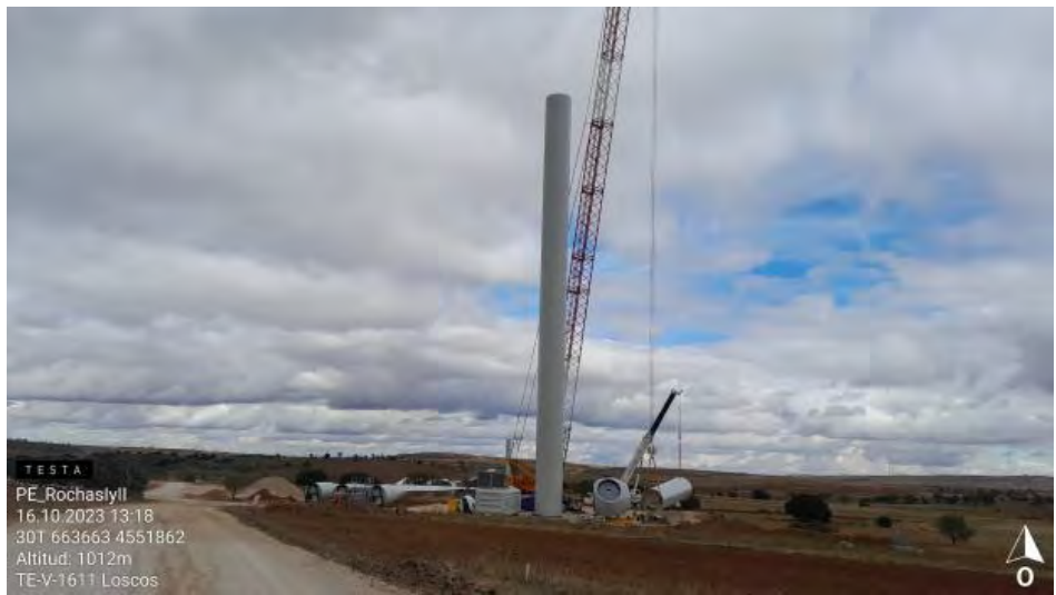
Montaje en RH2-1