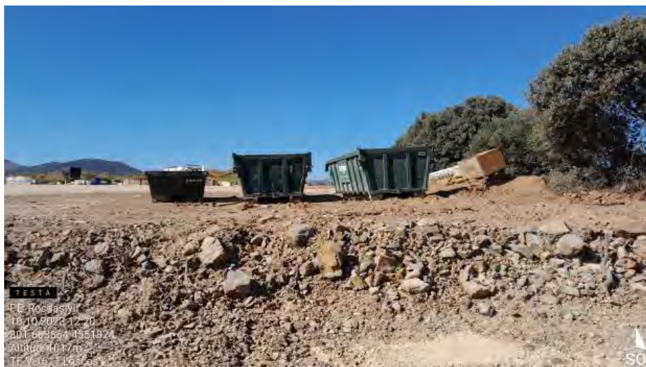
Punto limpio en correcto estado .