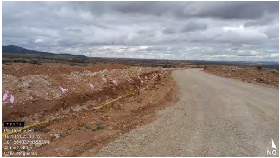
Zanja de evacuación