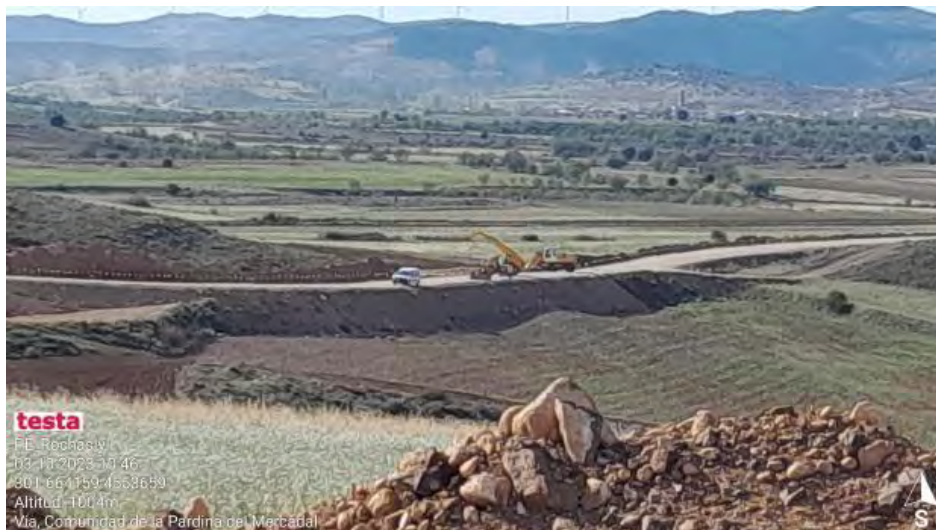
Tendido de cable en vial