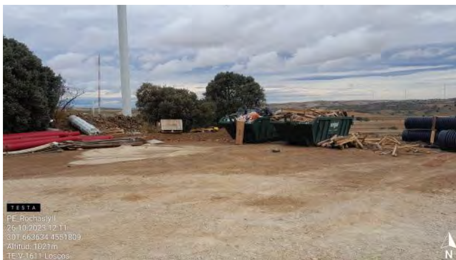
Punto limpio con excesos