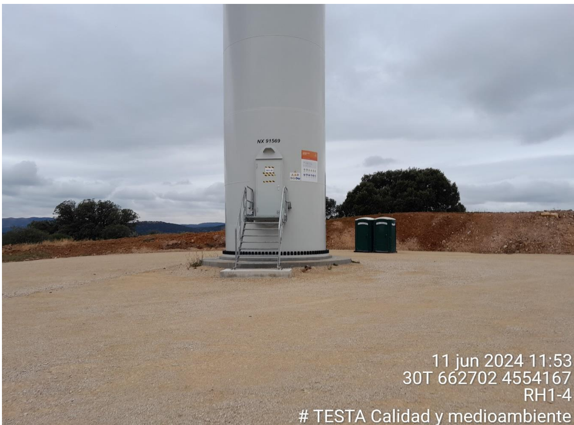
Imagen 2. Plataforma RH1-4