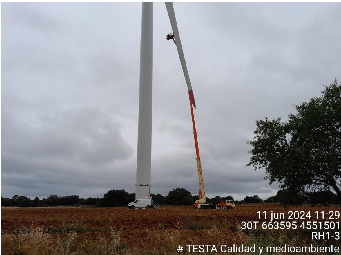
Imagen 1. Revisión de palas en la Plataforma RH1-3