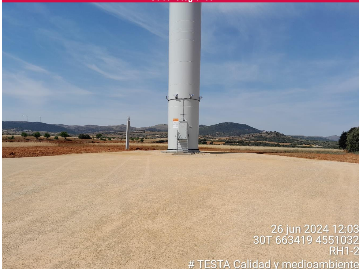
Imagen 1. Plataforma RH1-2 restaurada. Aerogenerador con medidas de innovación de detección de avifauna