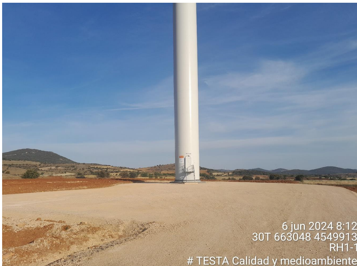
Imagen 1. Plataforma RH1-1