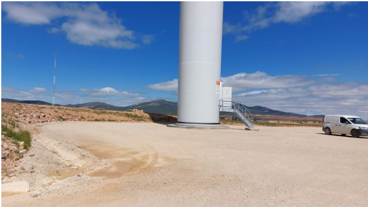
Imagen 1. Plataforma RH1-7 restaurada