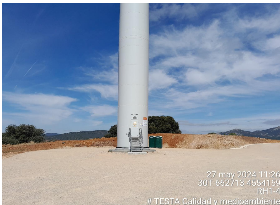
Imagen 1. Plataforma RH1-4