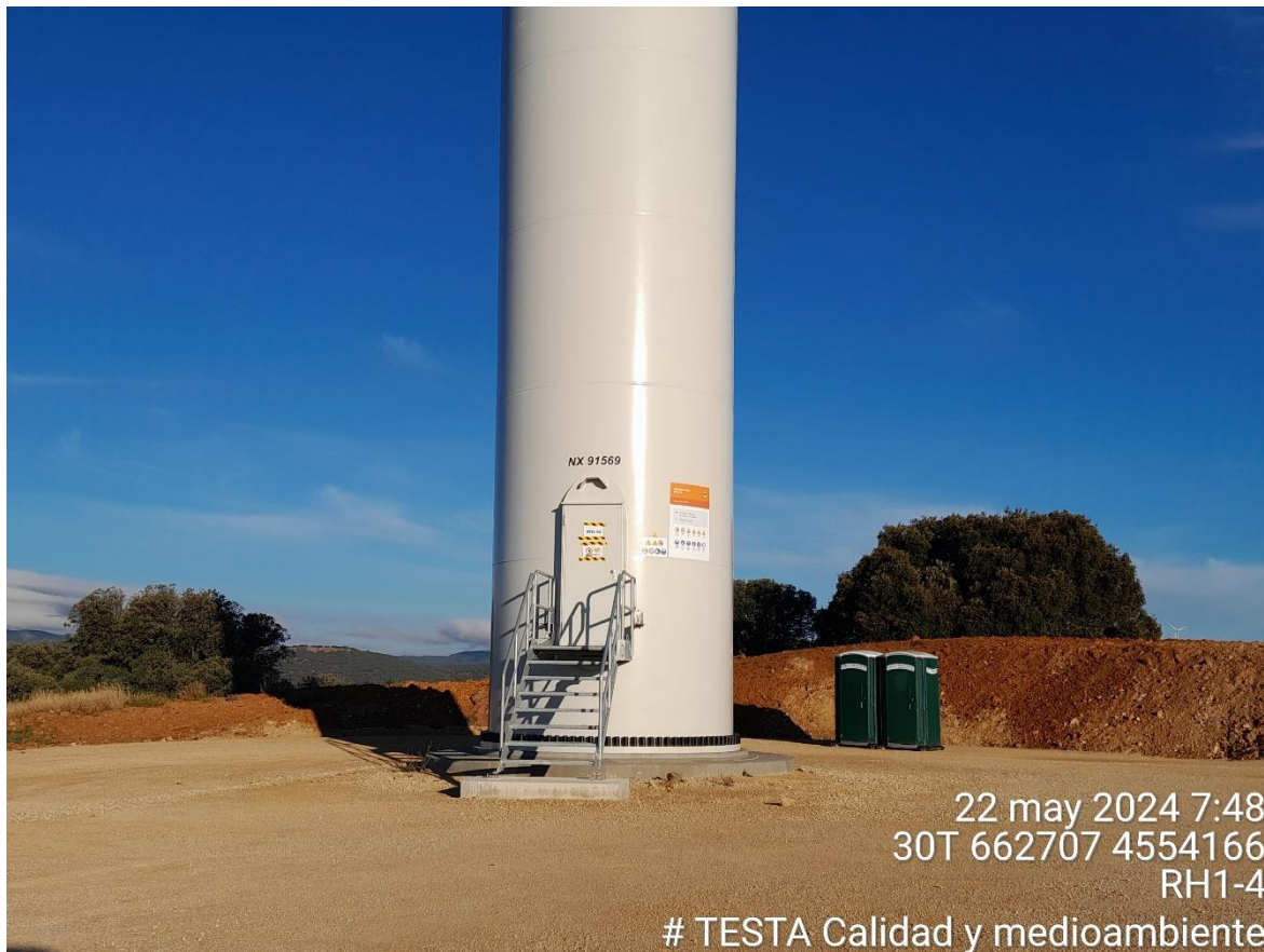
Imagen 1. Plataforma RH1-4