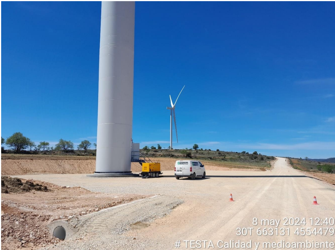
Imagen 1. Balizado acceso a RH1-5