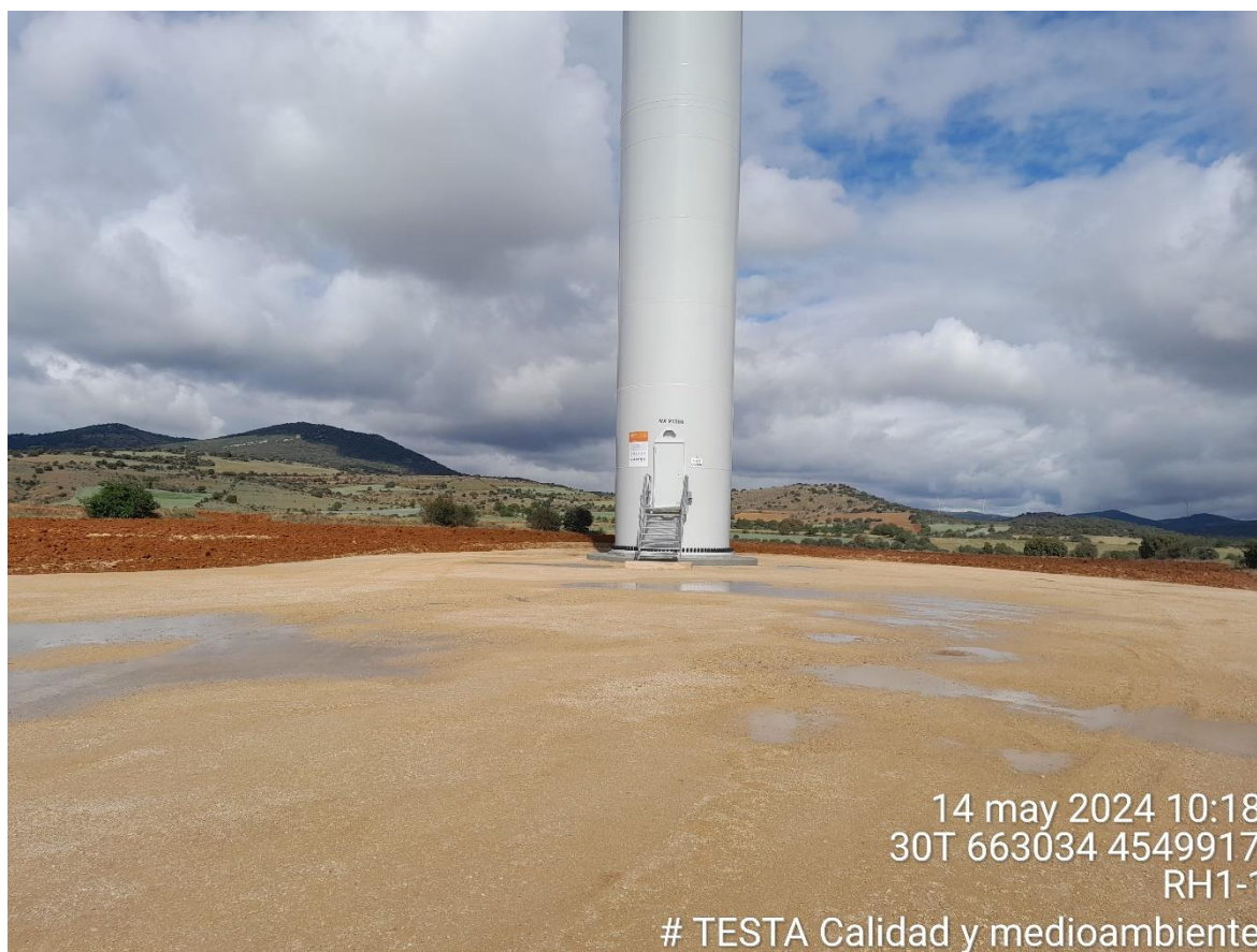
Imagen 1. Plataforma RH1-1