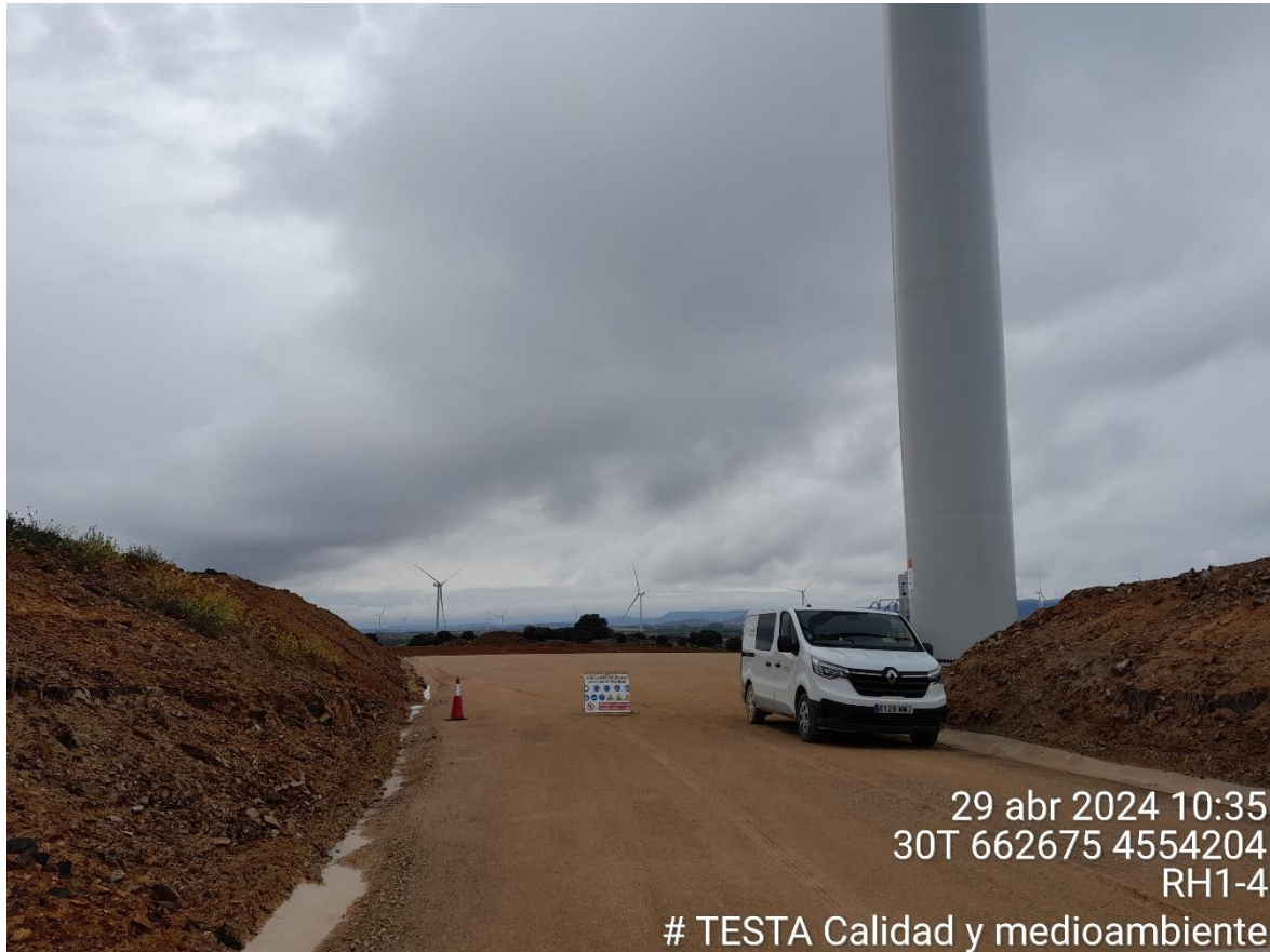
Plataforma Rh1-4 balizada