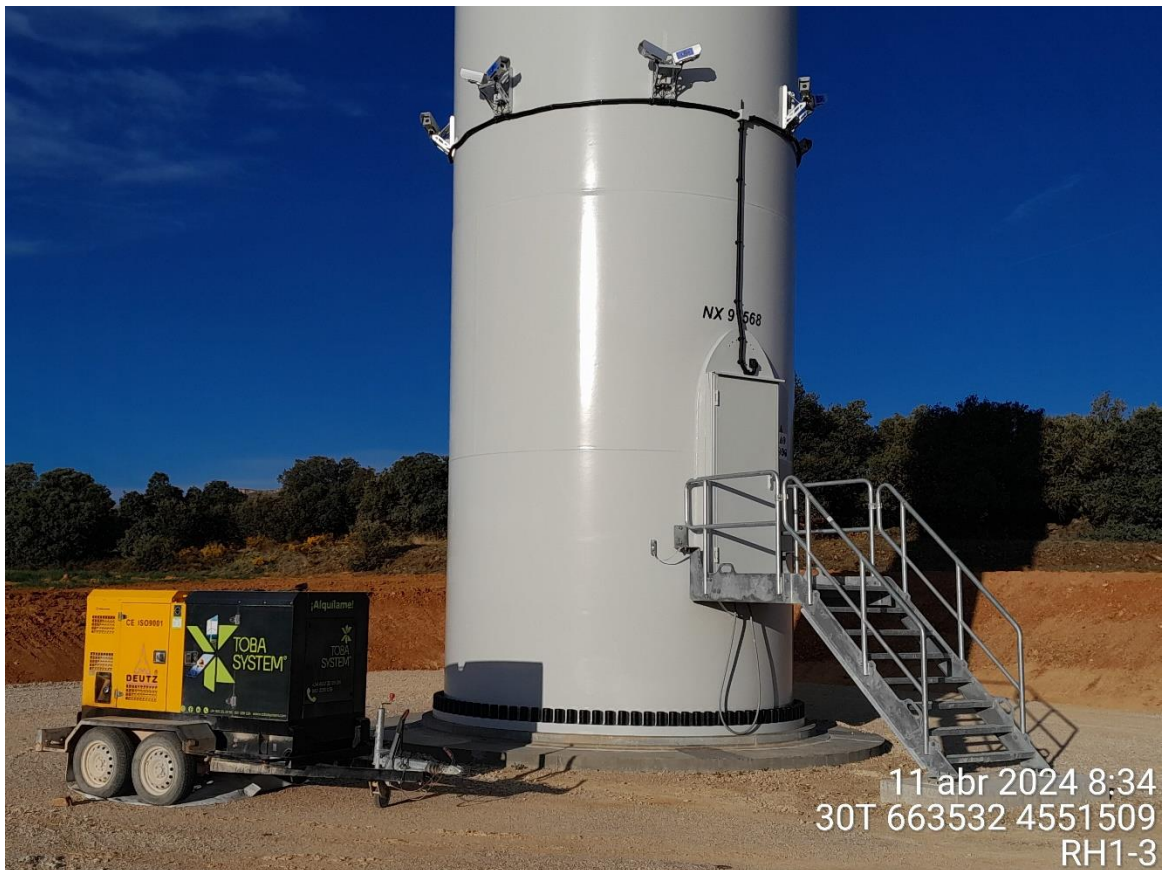
3D Observer, RH1-3