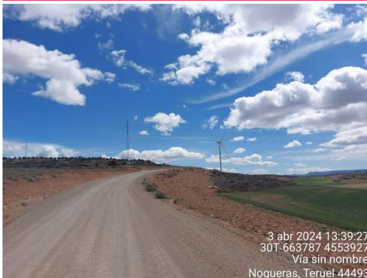
Imagen 1. Vial restaurado con la zona de la zanja hidrosebrada.