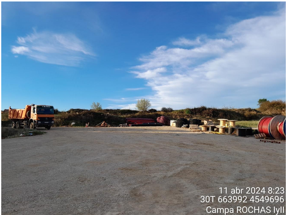
Campa ROCHAS Iyll