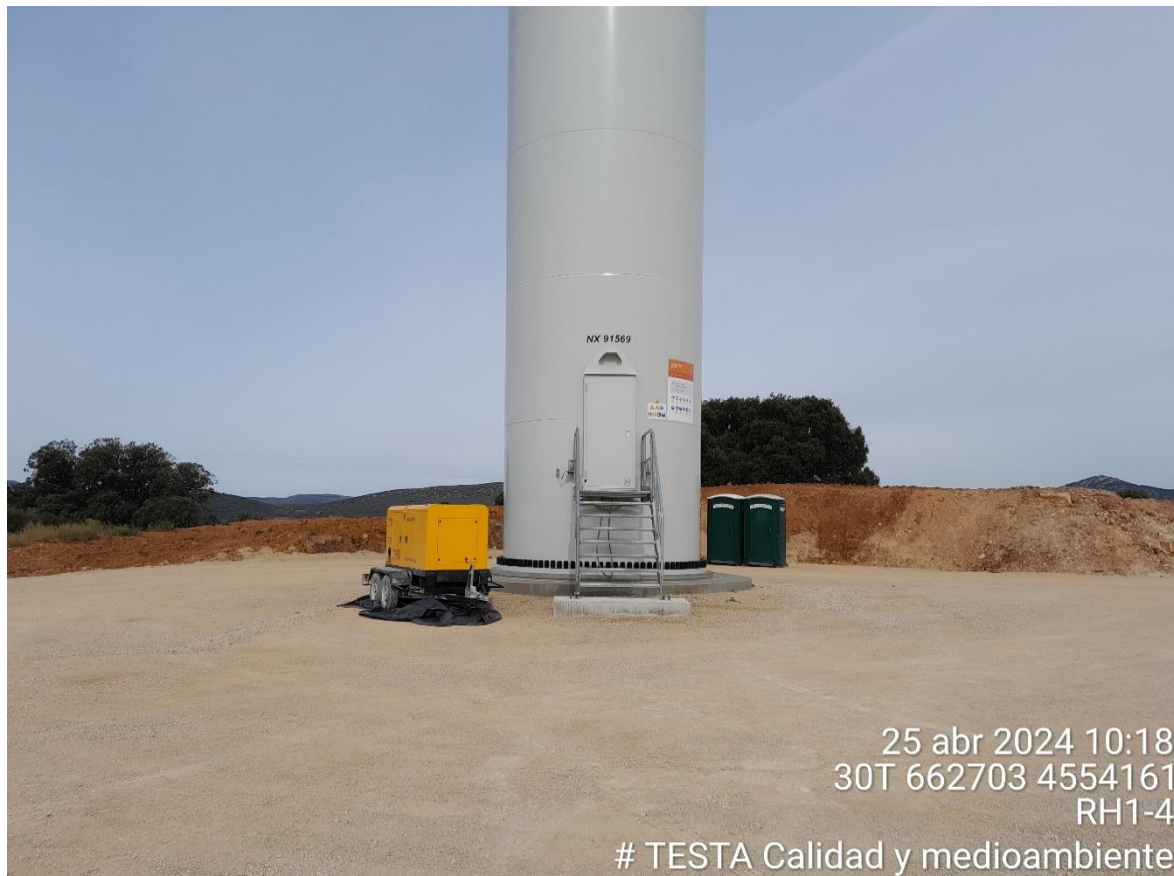
Imagen 4. Plataforma RH1-4