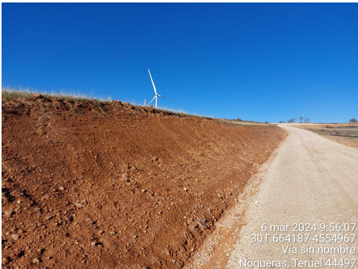
Talud vial Rocha I tras restauración ambiental