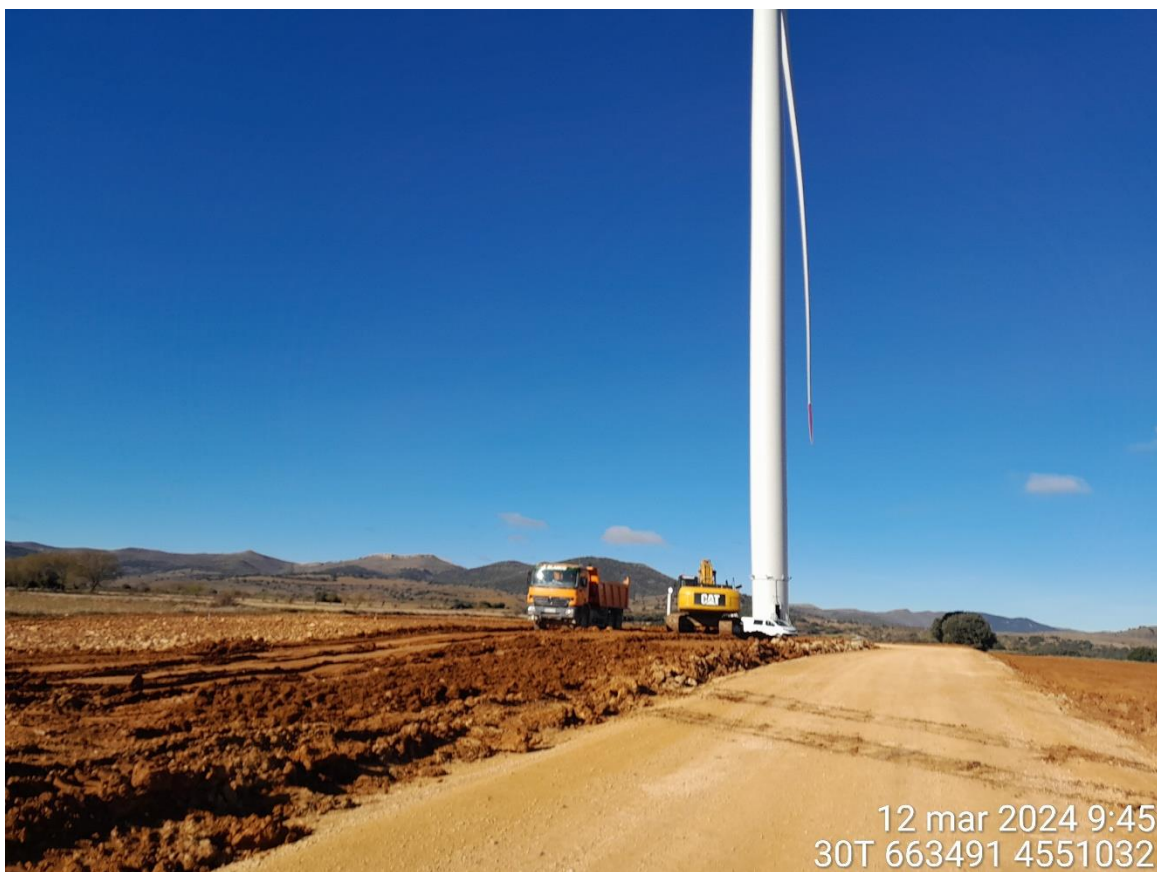
Maquinaria pesada realizando labores de movimiento de tierras en RH1-02 para restauración ambiental