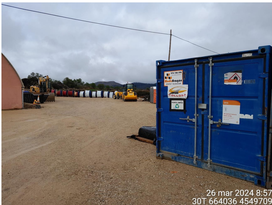
Contenedor en punto limpio de la campa