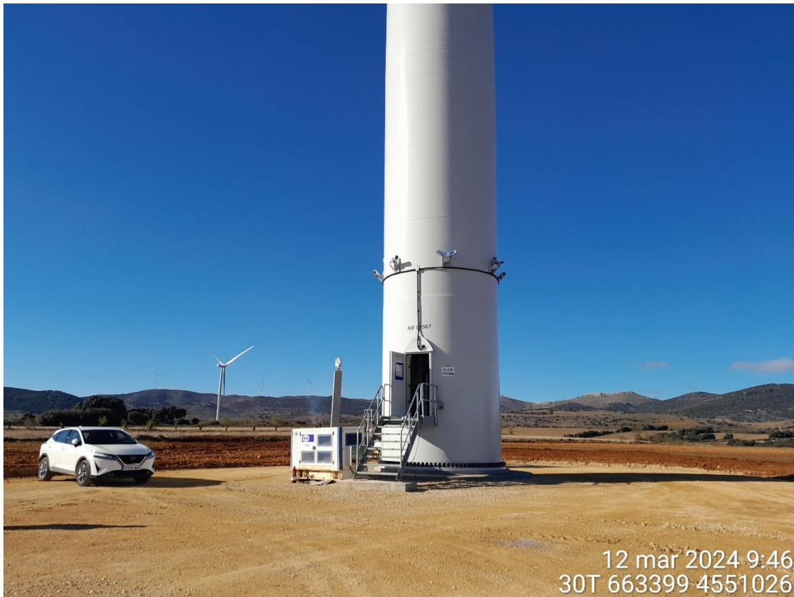
Inspección puesta a punto en RH1-02