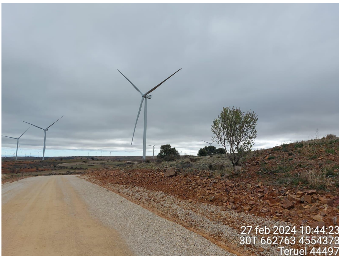
Acceso a la plataforma RHI-4