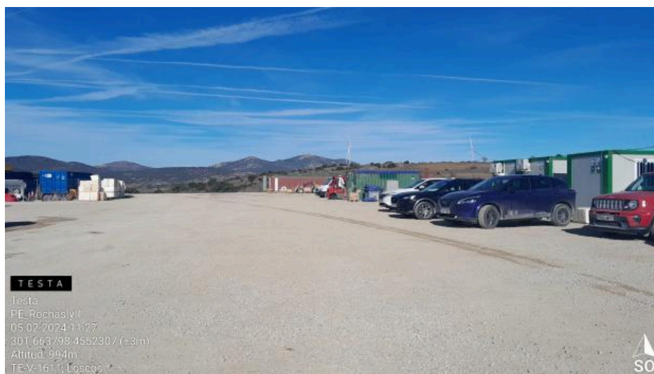
Desmantelamiento de carpa en camp RH1