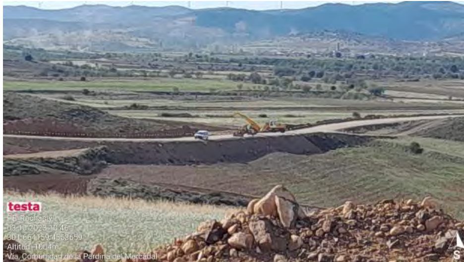
Tendido de cable en vial