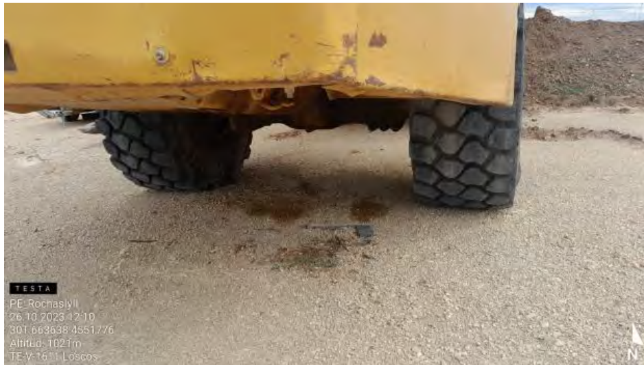
Fuga en camión aparcado en campa .