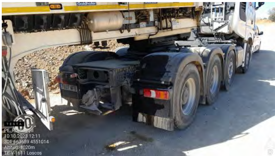
Fuga de hidráulico en transporte de componentes en RH1-2