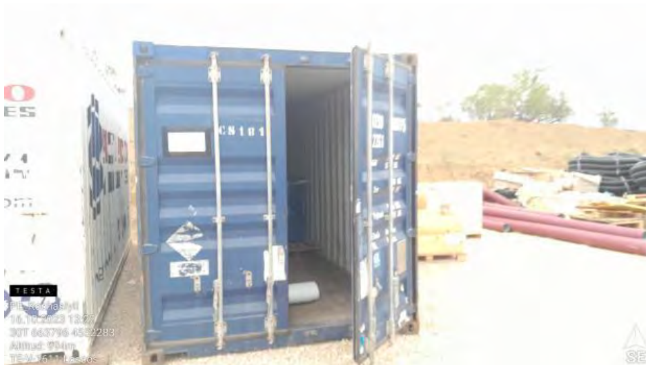
Contenedor RP abierto