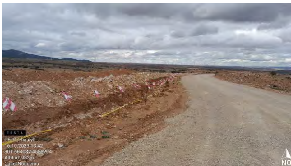
Zanja de evacuación