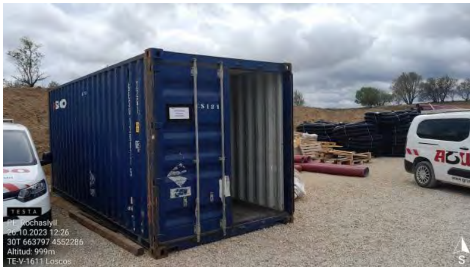
Contenedor RP abierto