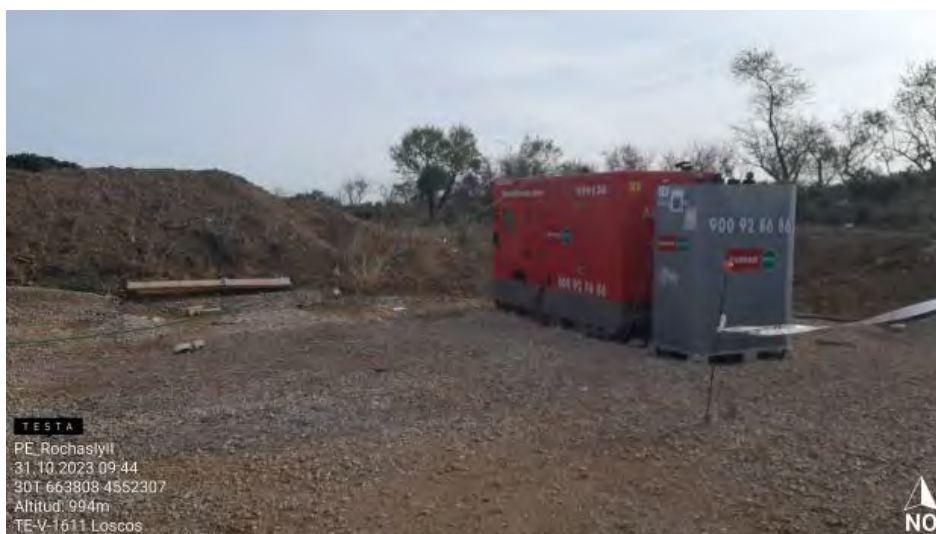
Generador sin protección de suelo