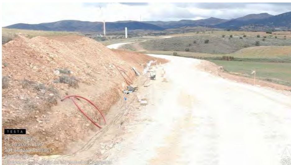
Generador sin protección de suelo