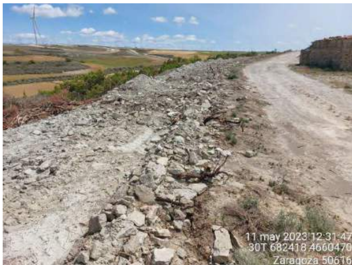
Imagen 3. Ejemplo en el que se debe incidir en la restauración con posterior plantación.