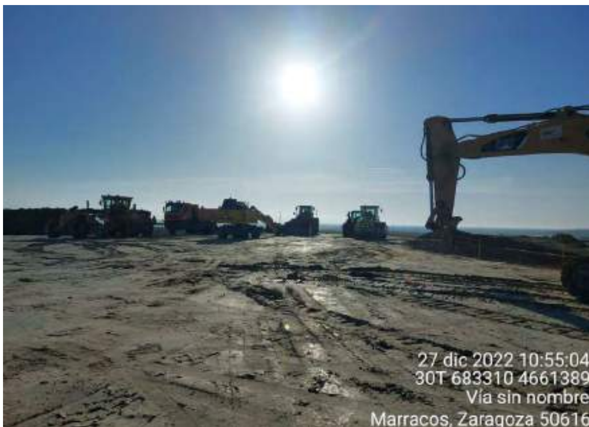
Imagen 2. Maquinaria parada en OBIII-01 y sin cubetos de contención que actúen y protejan el suelo ante posibles fugas.