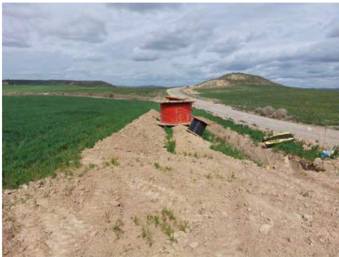
Imagen 1. Zanja de evacuación OBIII.