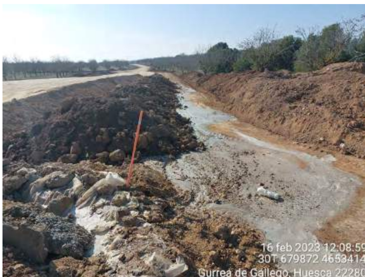
Imagen 1. Tierra contaminada por residuo de agua con hormigón debido a la colmatación del pozo de lavado.