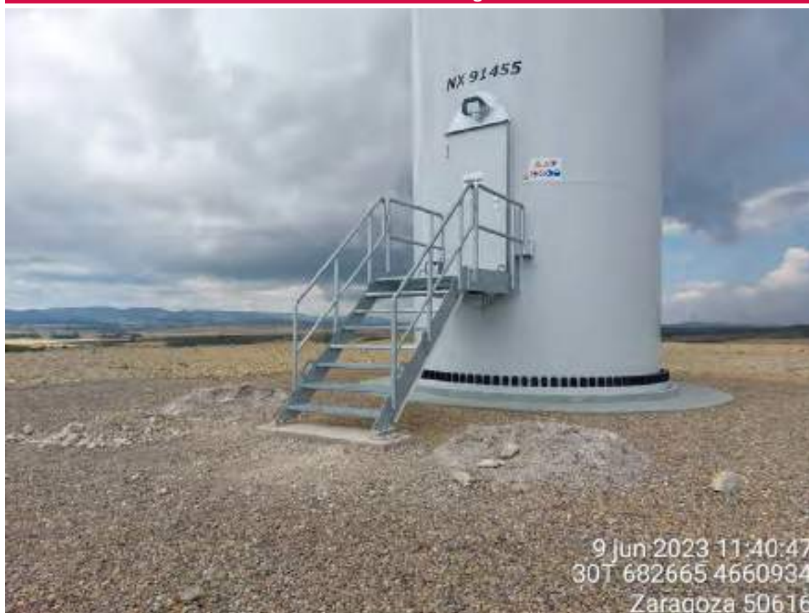
Imagen 1. Observación realizada en OBIII-02 debido a residuo de hormigón tras trabajos en la escalera.