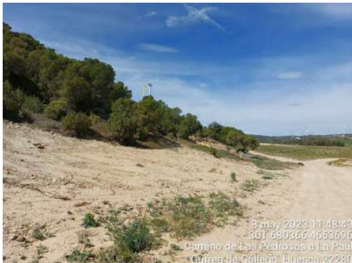
Imagen 2. Tramo de zanja de evacuación que se deberá revegetar.