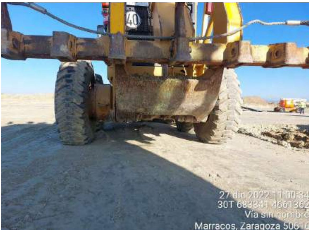
Imagen 3. Maquinaria parada en OBIII-01 y sin cubetos de contención que actúen y protejan el suelo ante posibles fugas.