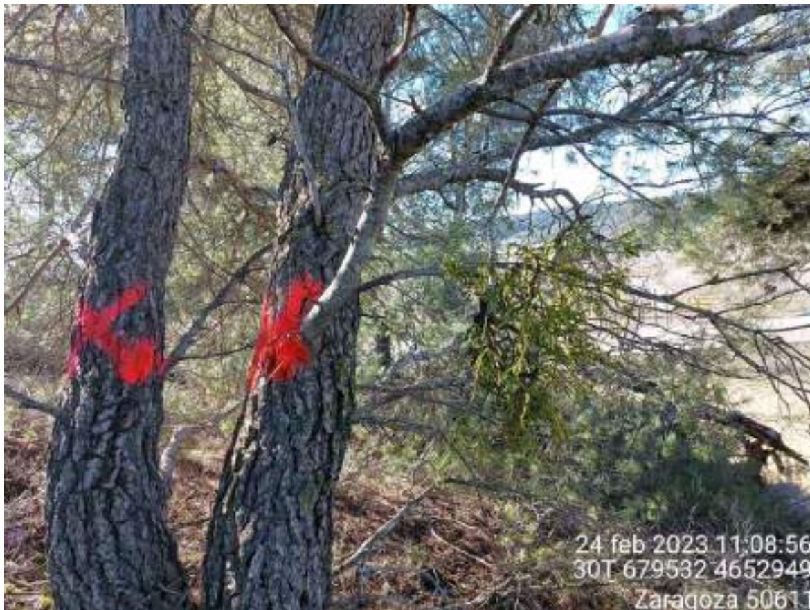
Imagen 5. Marcaje de árboles que se van a talar en la zona del apoyo 50 junto con Ernesto (Tecinsa).