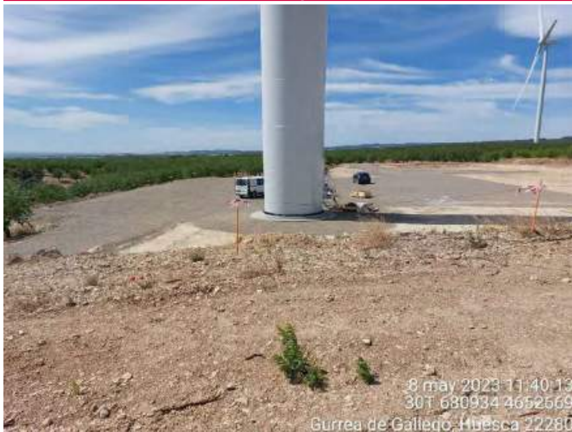
Imagen 1. Posición OBII-02 desde el ramal.