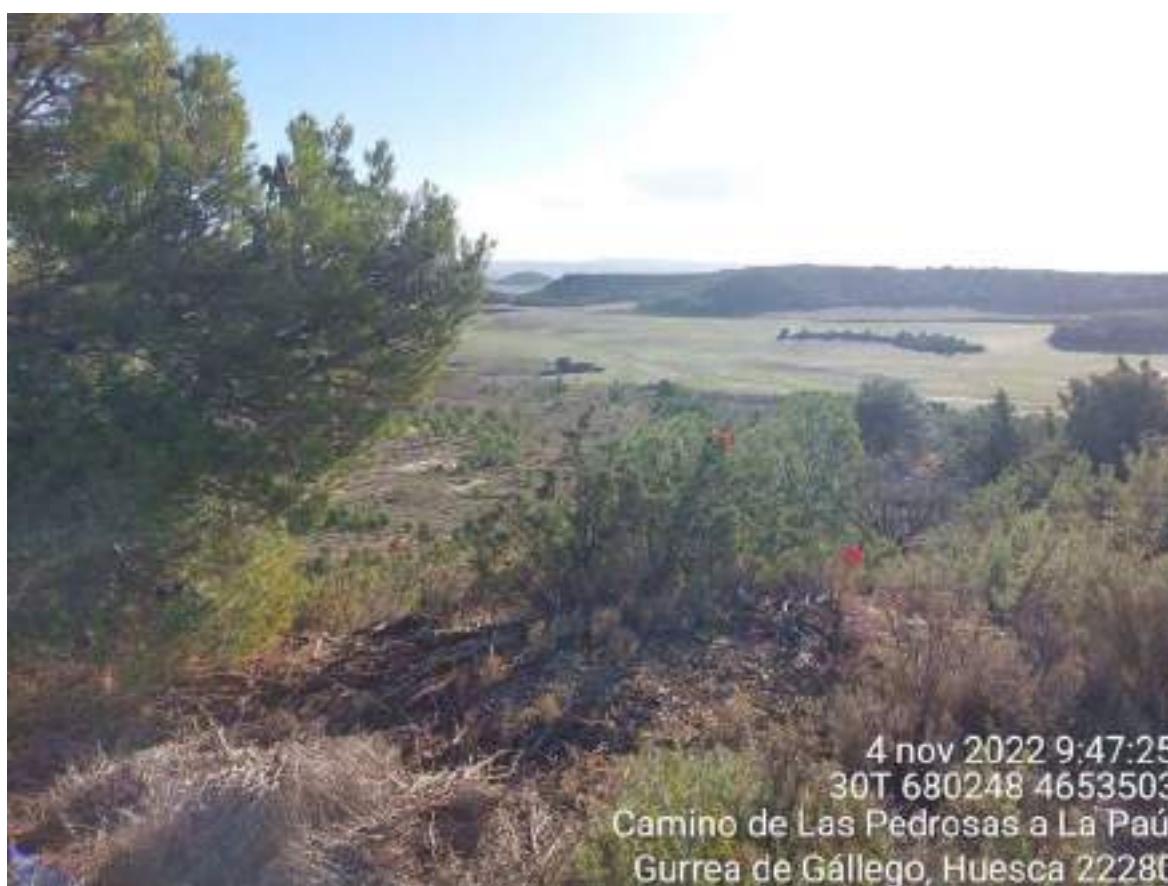
Imagen 1. Zona de vegetación natural a talar como consecuencia de la ejecución de la línea de evacuación.