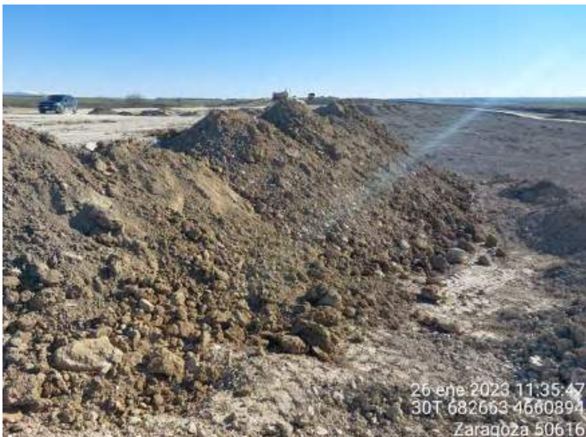
Imagen 3. Tierra vegetal acopiada en OBIII-02 que será utilizada para la restauración de ese talud.