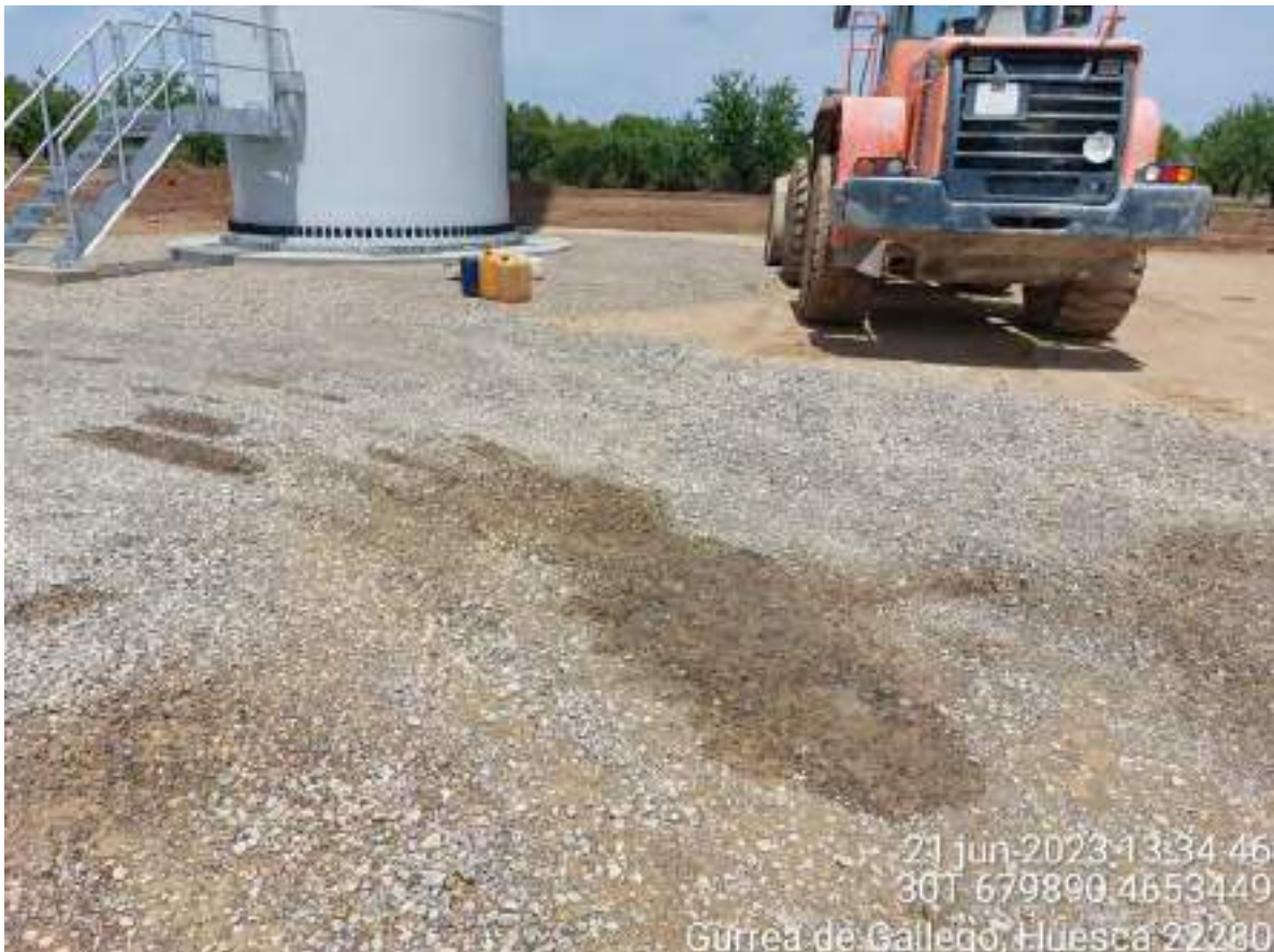
Imagen 3. Vertido de gasolina en OBII-03 que ya ha sido corregido.