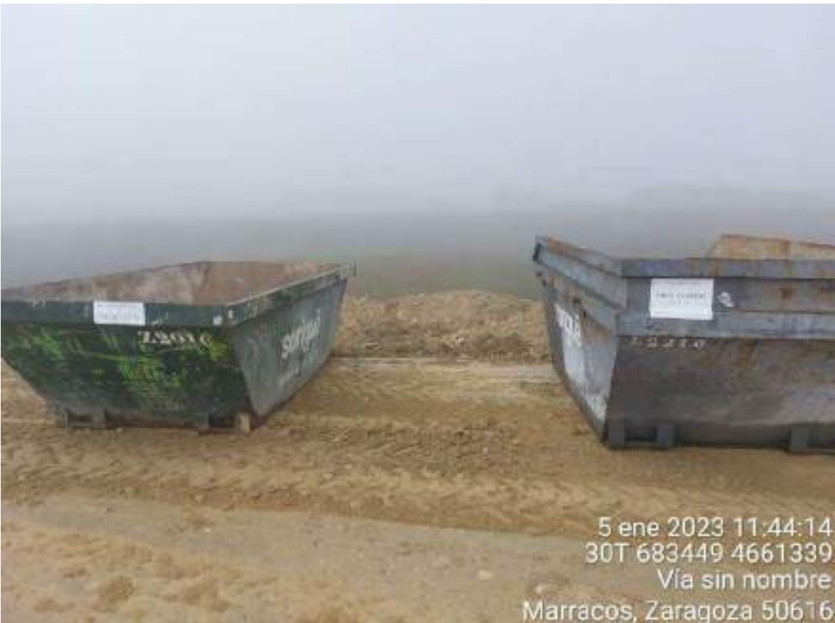
Imagen 3. Contenedores de RNP colocados en OBIII.