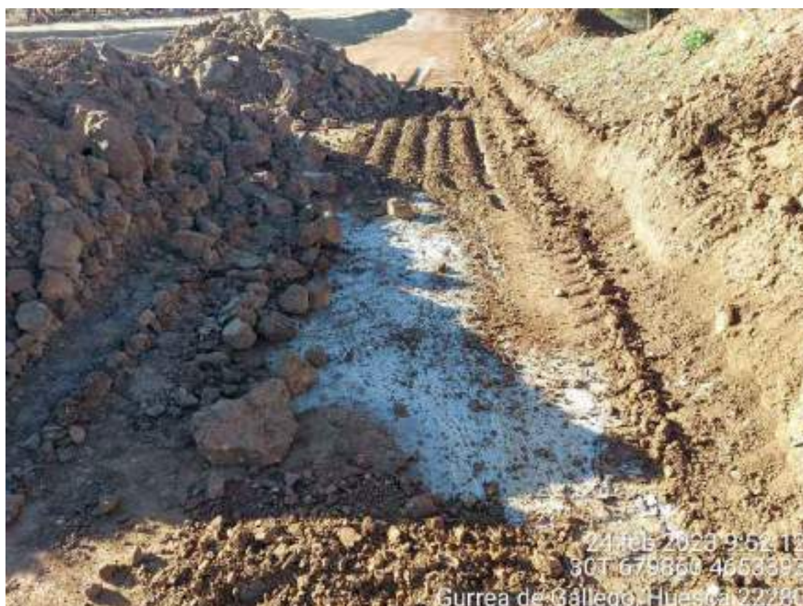
Imagen 1. Residuo de hormigón en el pozo de lavado que se restauró y limpió incorrectamente. Cuando se limpie y se gestione correctamente se cerrará la NC.