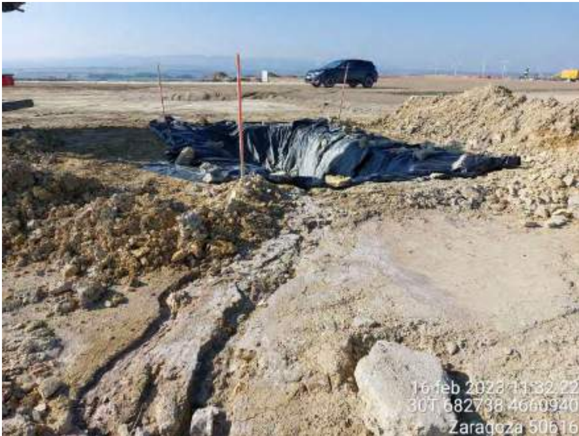
Imagen 4. Escorrentía de agua manchada con hormigón en el pozo de lavado de OBIII-02.