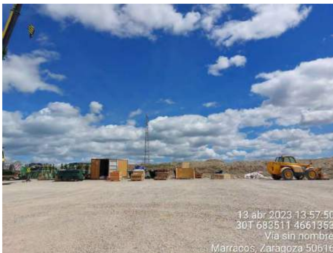
Imagen 1. Punto limpio de NORDEX.