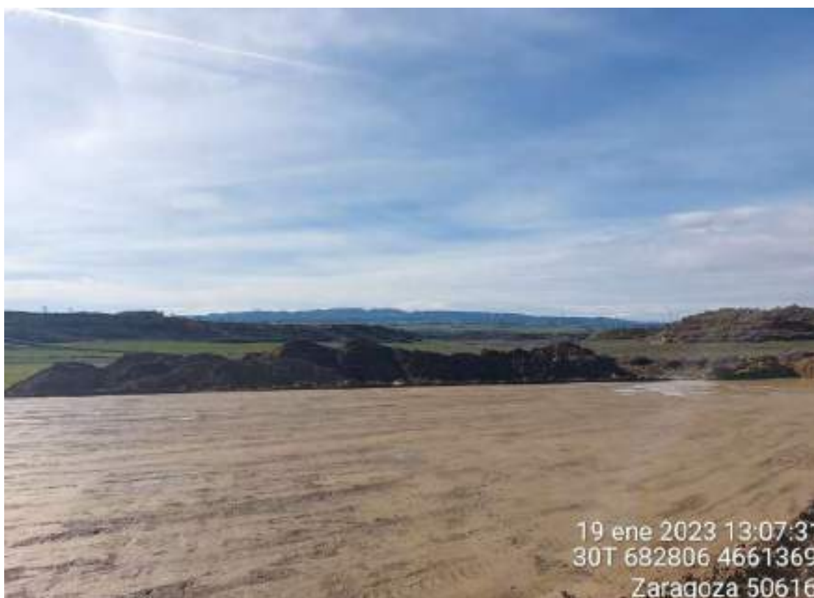
Imagen 1. Acopio de tierra vegetal en la zona de la TM de OBIII. Los cordones son mucho mayores de 1,5 m.