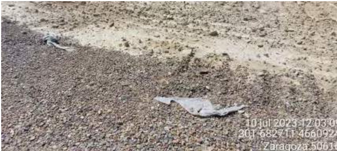
Imagen 2. Material geotextil en OBIII-02. Se debe retirar.