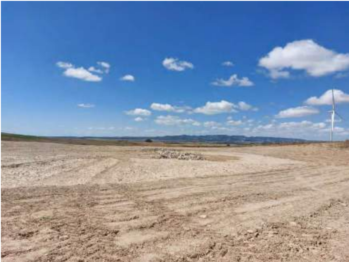
Imagen 1. Balsa cercana a OBIII-01 que en caso de lluvias se llena y se debe corregir.