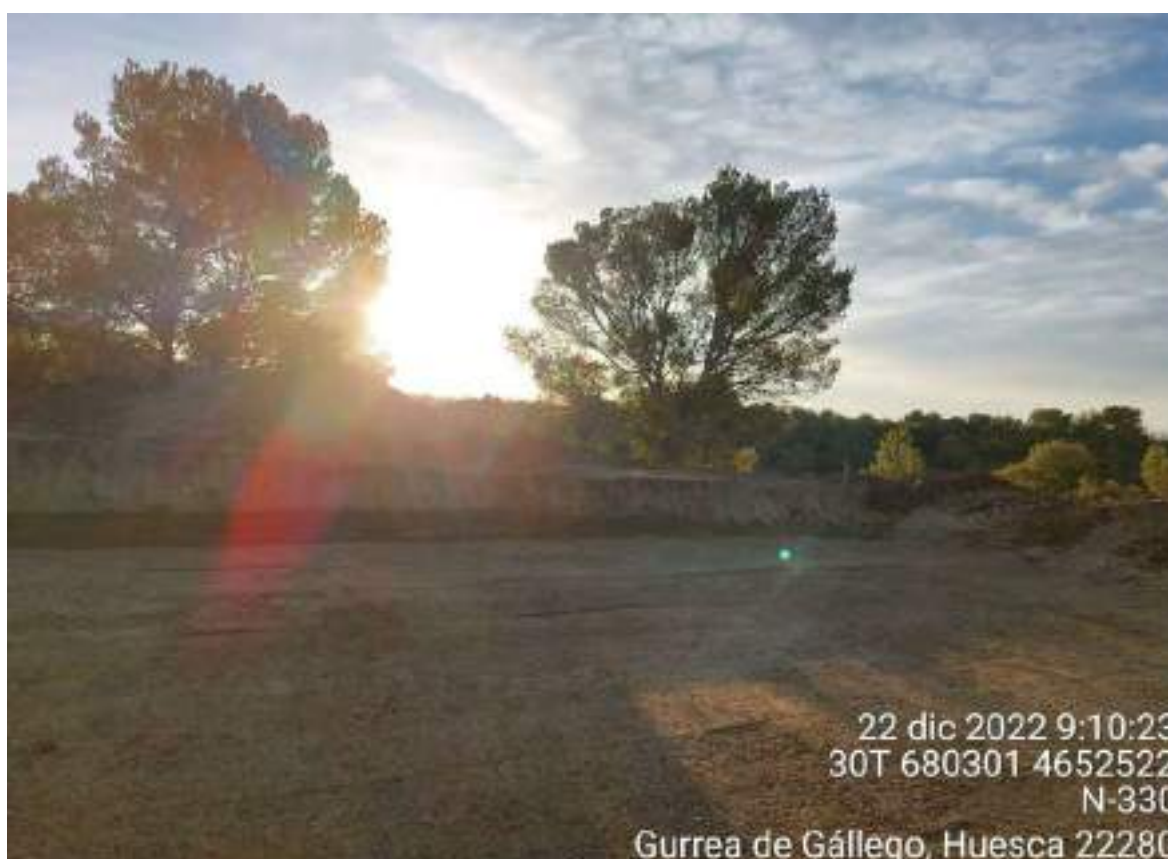
Imagen 1. Zona de la TM en la que se produjo el vertido de residuo de hormigón en el suelo.