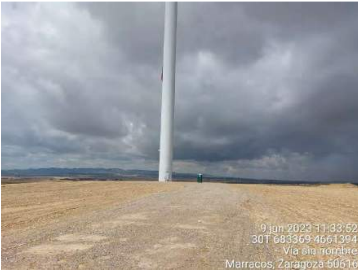
Imagen 2. Posición OBIII-01 tras realizar los trabajos de restauración morfológica.