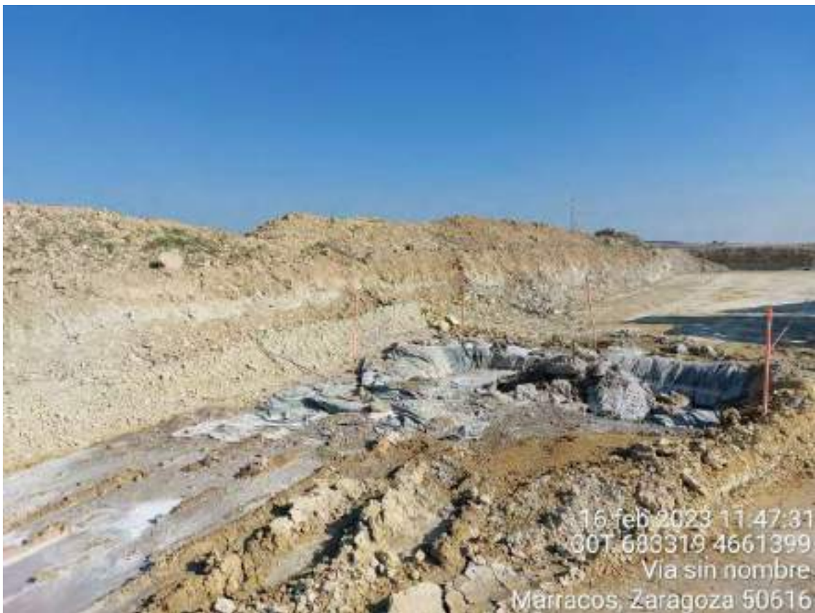
Imagen 3. Tierra manchada de agua con hormigón en OBIII-02.