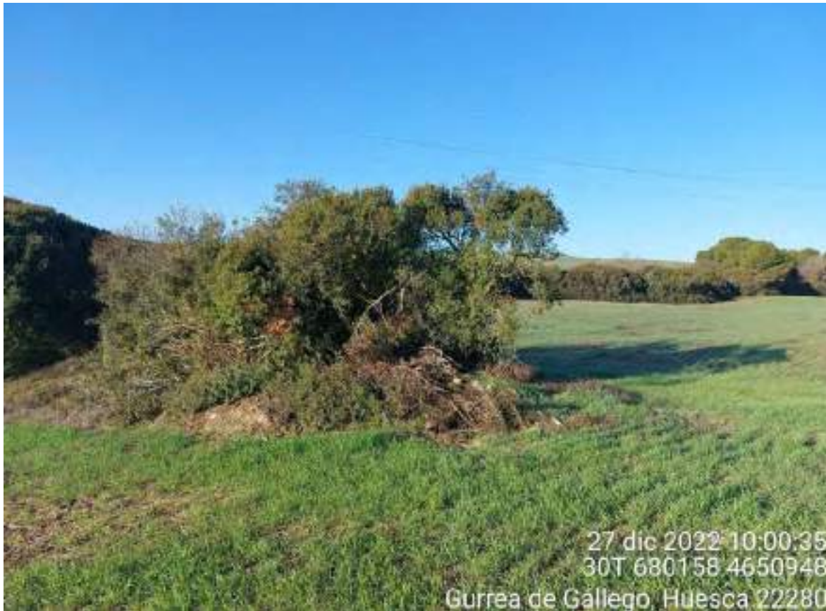
Imagen 4. Quercus sp. a retirar en el apoyo 59 de la línea de evacuación