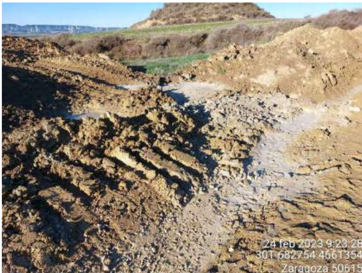
Imagen 2. Residuo de hormigón en la zona de la TM de OBIII próximo al cordón de tierra vegetal. Igualmente, se tiene que limpiar y gestionar correctamente para poder cerrar la NC.