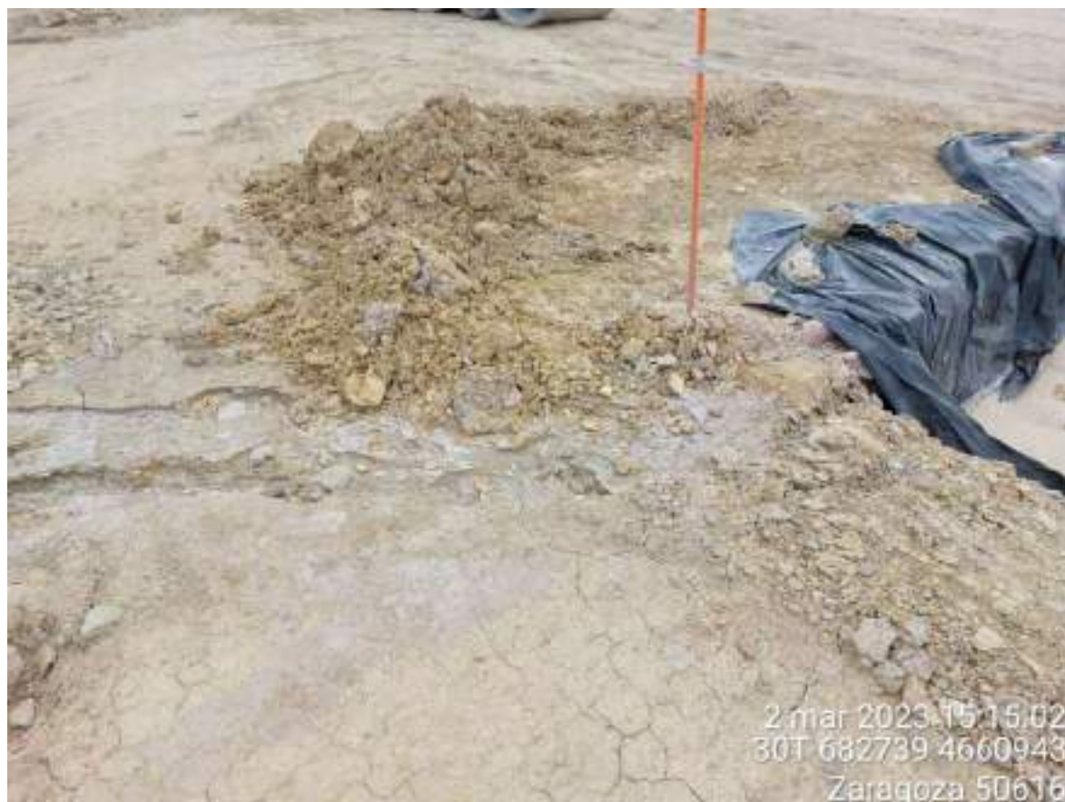
Imagen 1. Suelo contaminado de residuo de hormigón en OBIII-02.