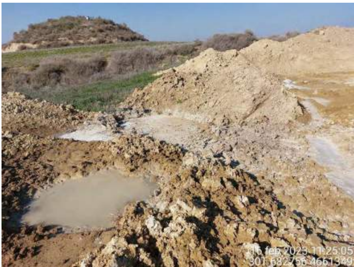
Imagen 2. Manchas de agua con hormigón en la zona de la TM de OBIII próxima a los cordones de tierra vegetal.