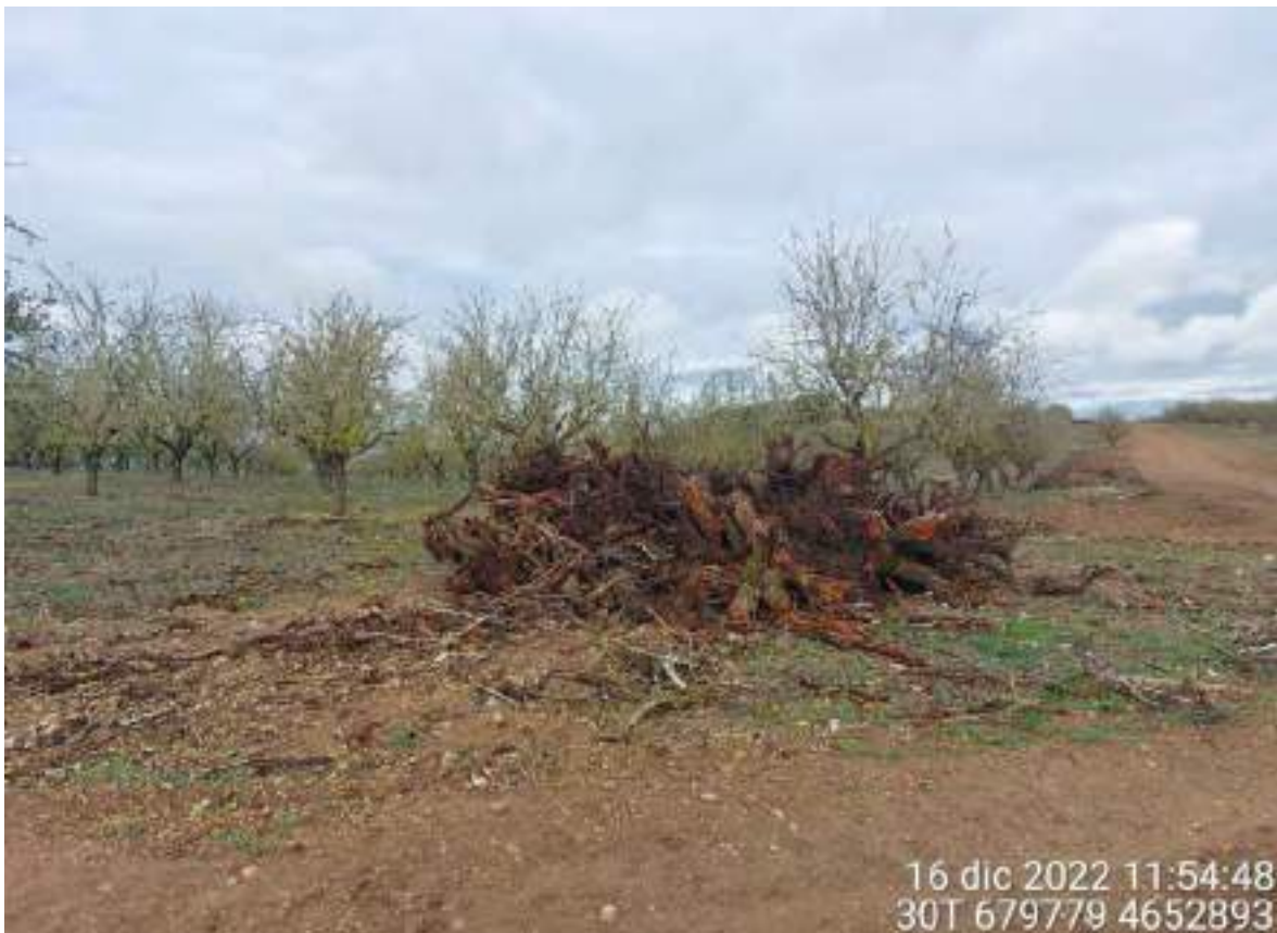
Imagen 1. Restos de poda de almendros en vial de OBII. Se deben retirar cuanto antes.