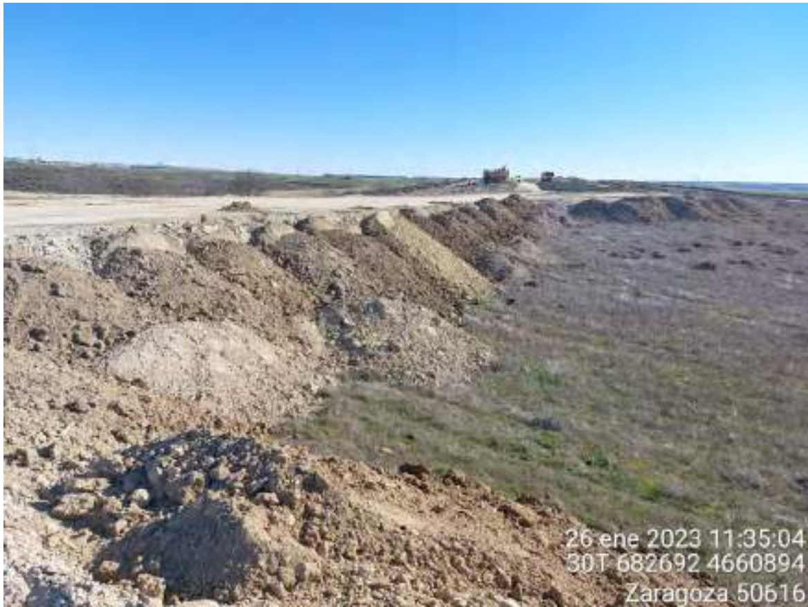
Imagen 2. Tierra vegetal acopiada en OBIII-02 que será utilizada para la restauración de ese talud.