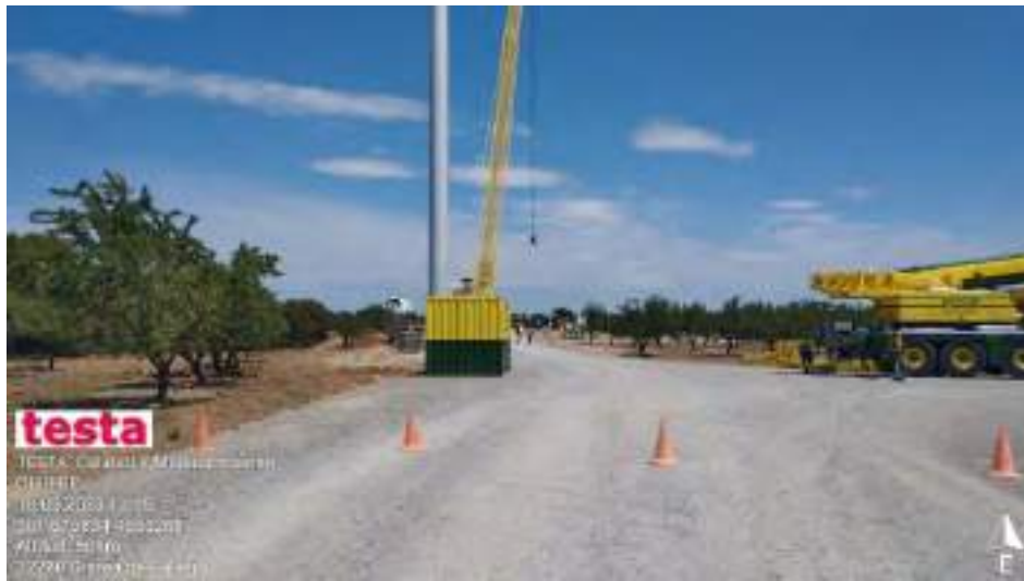
Trabajos en OB2-3