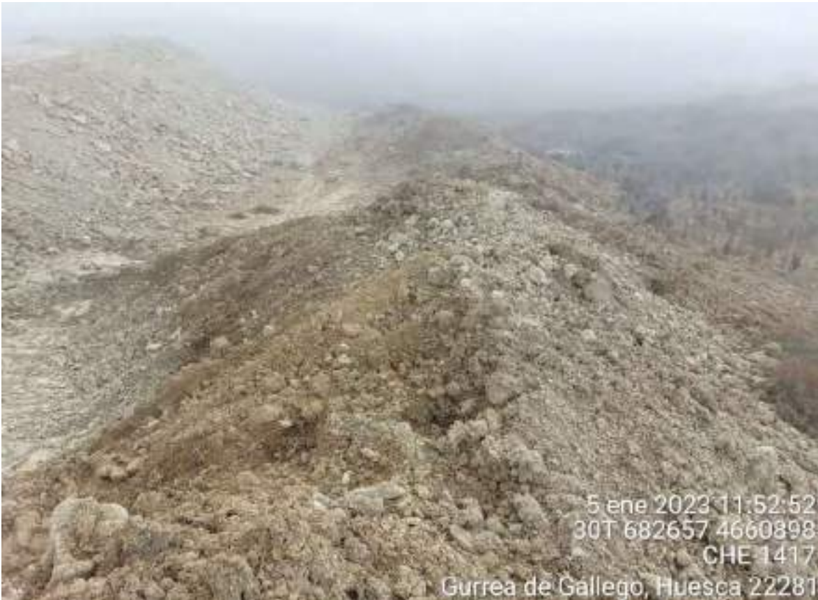
Imagen 2. No conformidad leve. Incorrecta separación de la tierra vegetal del resto del material extraído en OBIII-02.