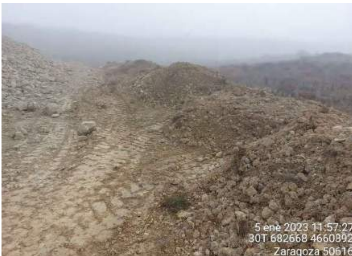
Imagen 1. No conformidad leve. Incorrecta separación de la tierra vegetal del resto del material extraído en OBIII-02.