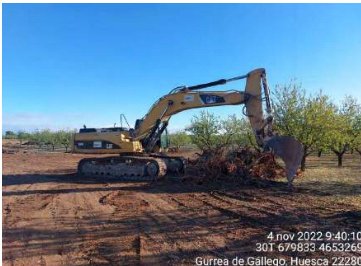
Imagen 2. Máquina en OBII-03 tras arrancar los almendros y amontonar el material extraído.