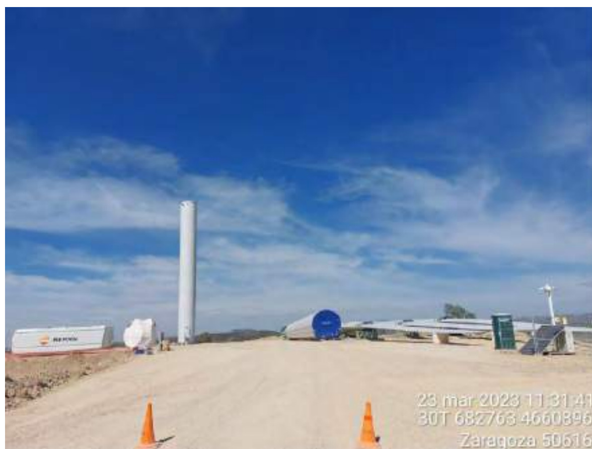
Imagen 1. Posición OBIII-02 con el material acopiado en plataforma.