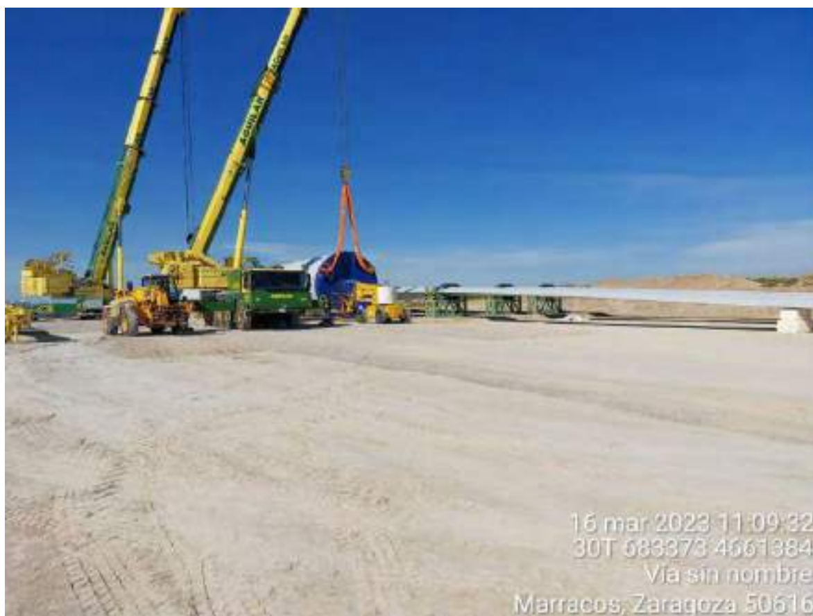
Imagen 1. Posición OBIII-01.