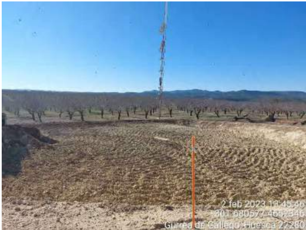
Imagen 3. Excavación en OBII.