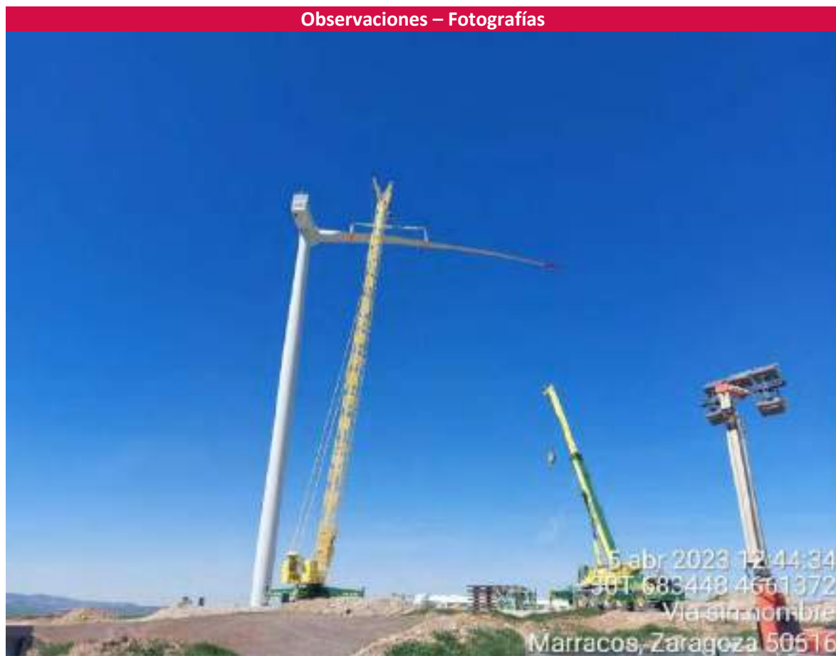
Imagen 2. Montaje de la posición OBIII-01.