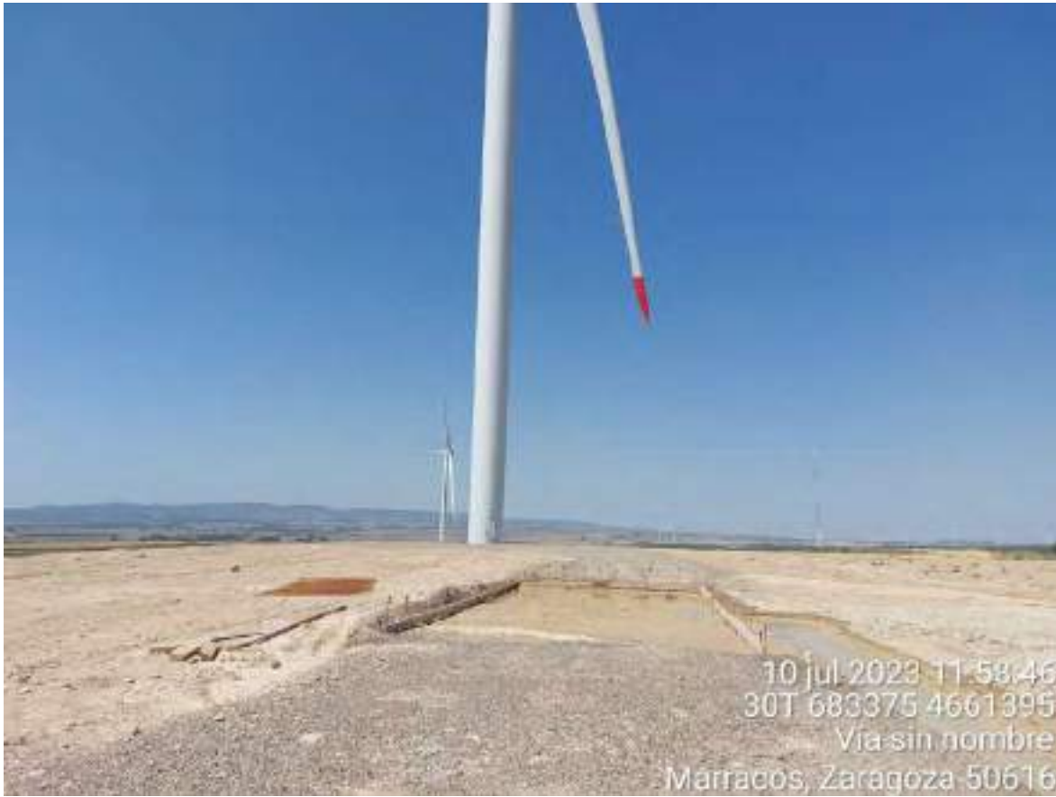
Imagen 1. Vial hacia OBIII-01 en el que todavía deben realizarse trabajos.