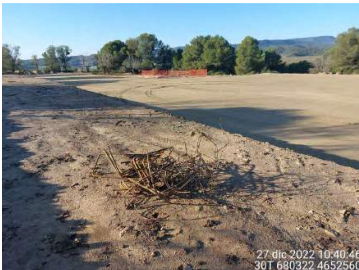
Imagen 1. Restos de ferralla en la zona de la TM en OBII. Se debe retirar cuanto antes.