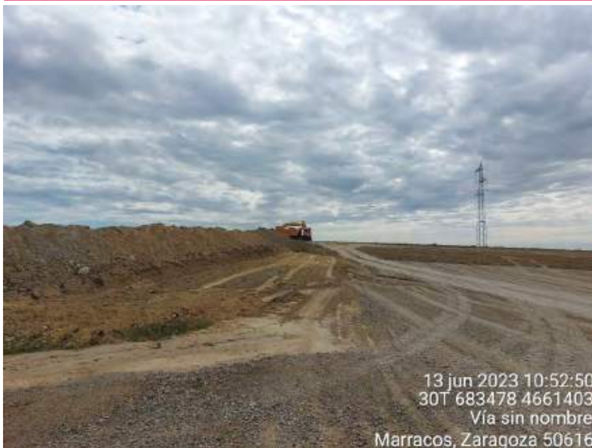
Imagen 3. Trabajos de restauración en la campa de acopio de OBIII.