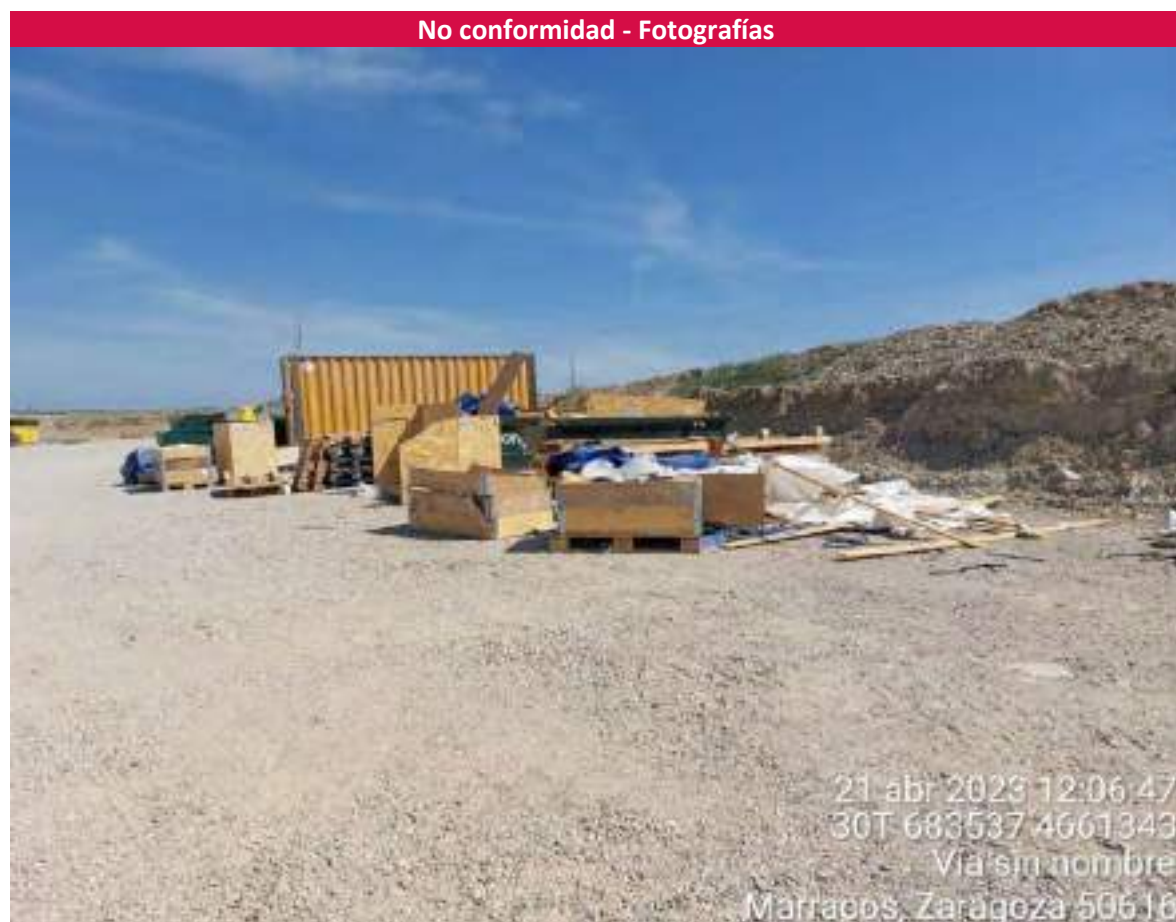
Imagen 1. Punto limpio de NORDEX. Se debe ordenar y recoger. Se comprometen a hacerlo inmediatamente.