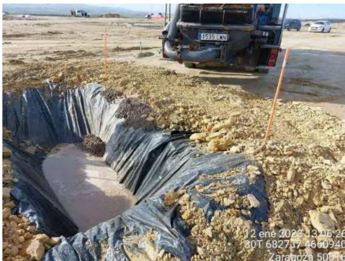
Imagen 2. Pozo de lavado en buen estado apto para el lavado de hormigón en OBIII.