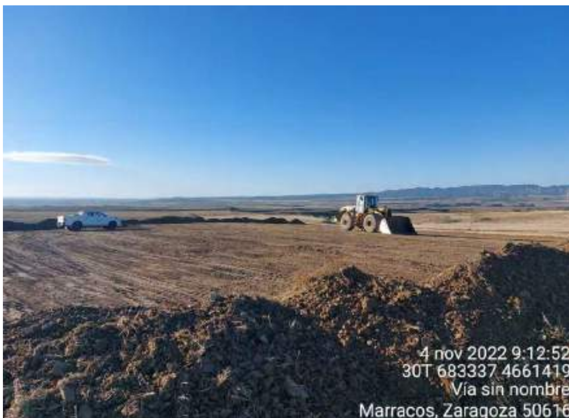
Imagen 3. Montones de tierra apilados tras trabajos de excavación en OBIII-01.