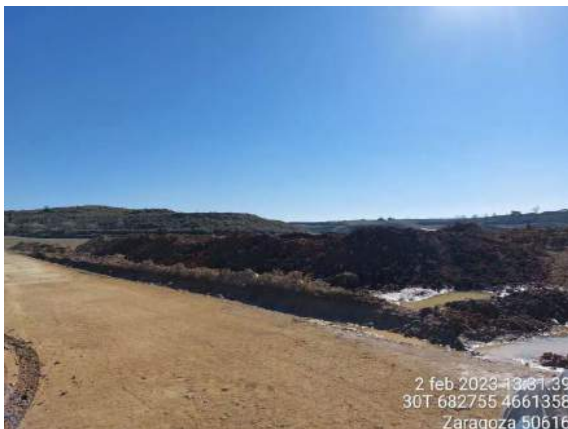
Imagen 1. Acopio de tierra vegetal realizando correctamente subsanando la NC en la TM de OBIII.