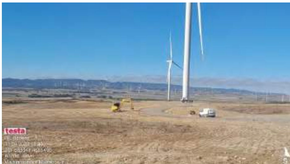
trabajos en cunetas