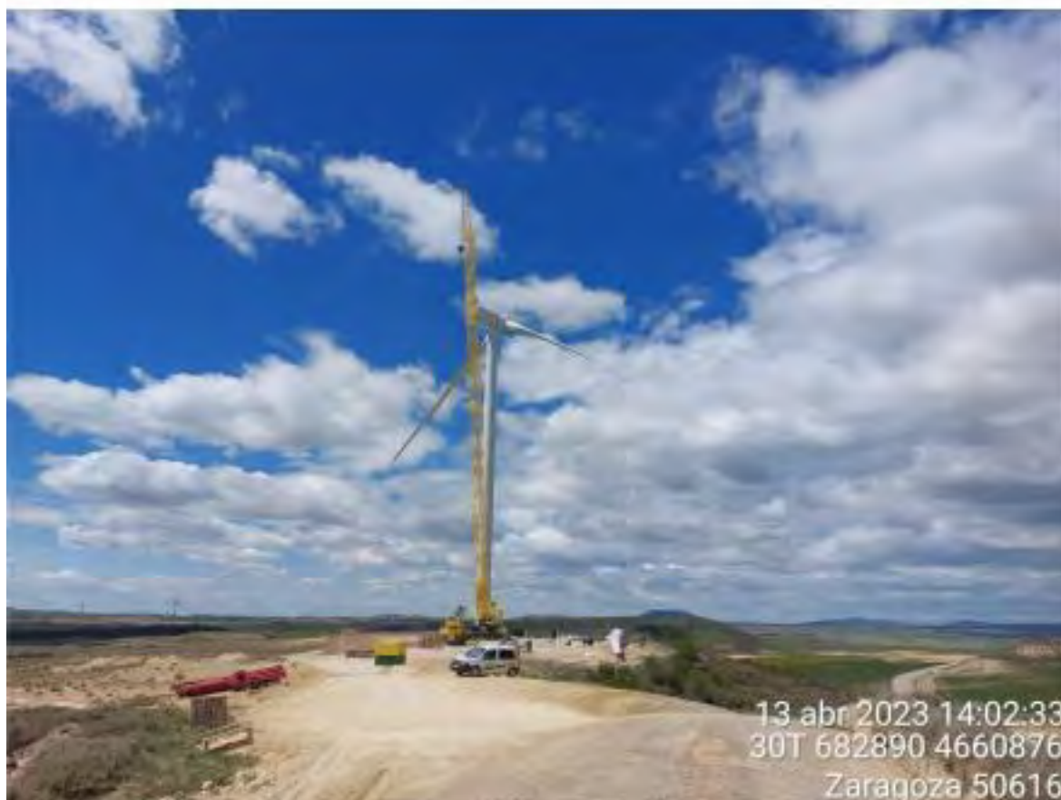
Imagen 2. Montaje OBIII-02.