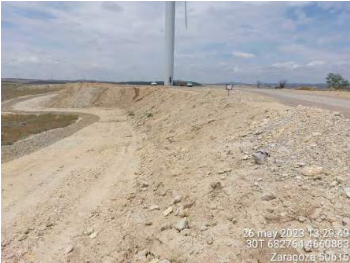
Imagen 1. Posición OBIII-02 en proceso de restauración.