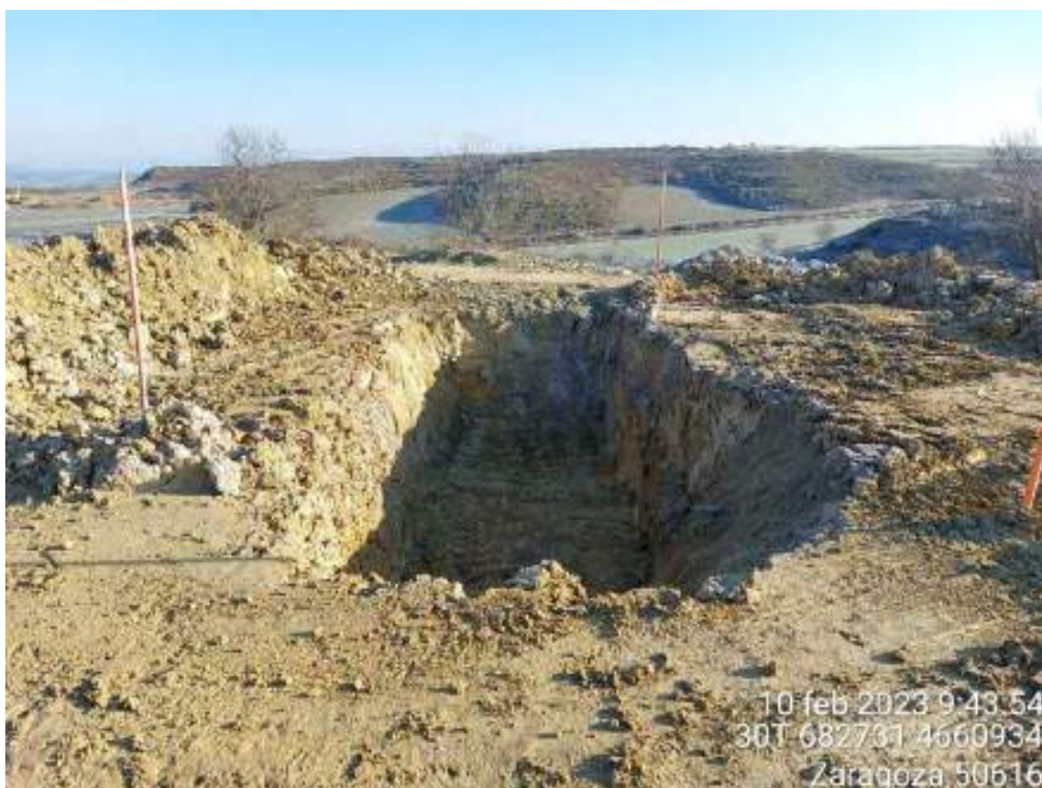
Imagen 1. Pozo de lavado utilizado en proceso de restauración.