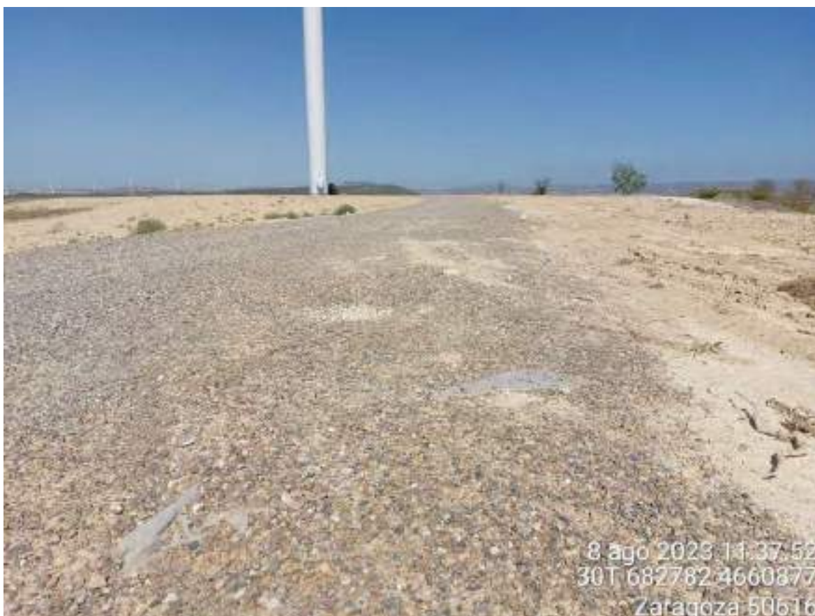
Imagen 2. Materia geotextil en plataforma de OBIII-02. Se debe retirar.