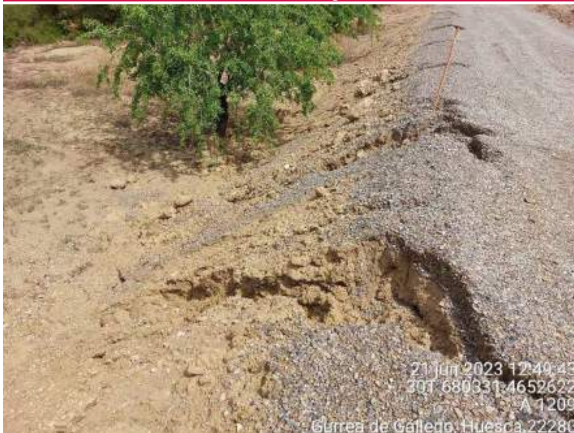
Imagen 1. Cárcavas generadas en vial de OBII debido a las lluvias caídas. Se debe volver a trabajar en estas zonas.