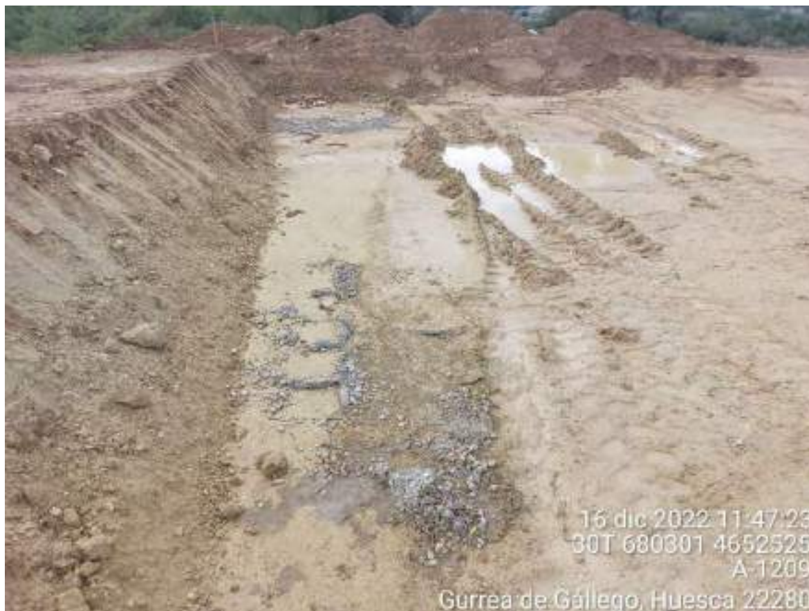
Imagen 2. Residuo de hormigón contaminando el suelo de la zona de la TM.