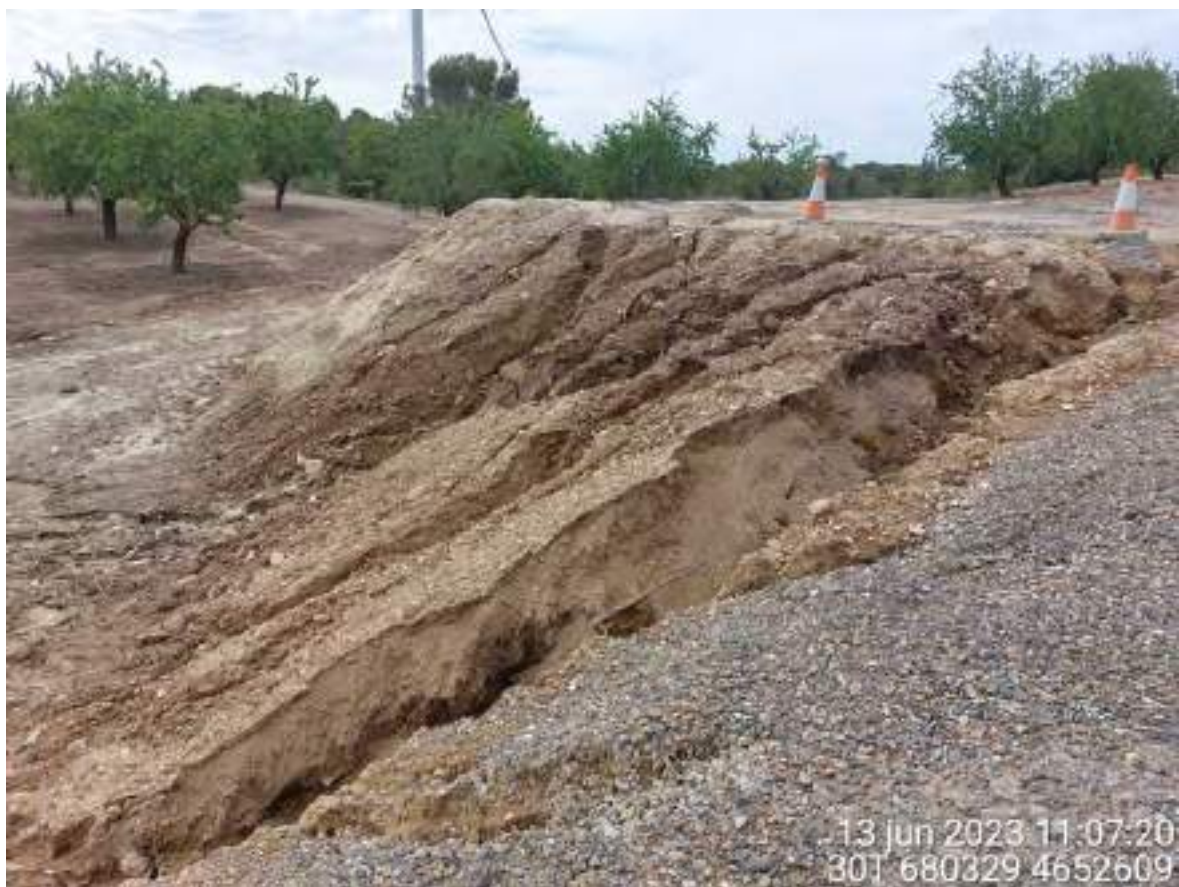
Imagen 1. Cárcavas en TM de OBII.