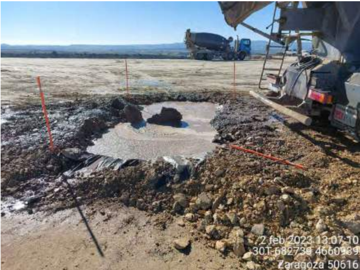
Imagen 2. Pozo de lavado colmatado durante el hormigonado de OBIII-02. COLLOSA gestiona el vaciado parcial del pozo mediante absorción. Al terminar el hormigonado se pasará maquinaria para retirar el hormigón de la plataforma y gestionarlo como tal.