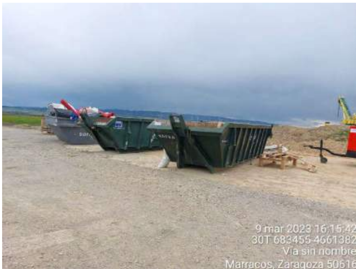
Imagen 2. Contenedores RNP Collosa.