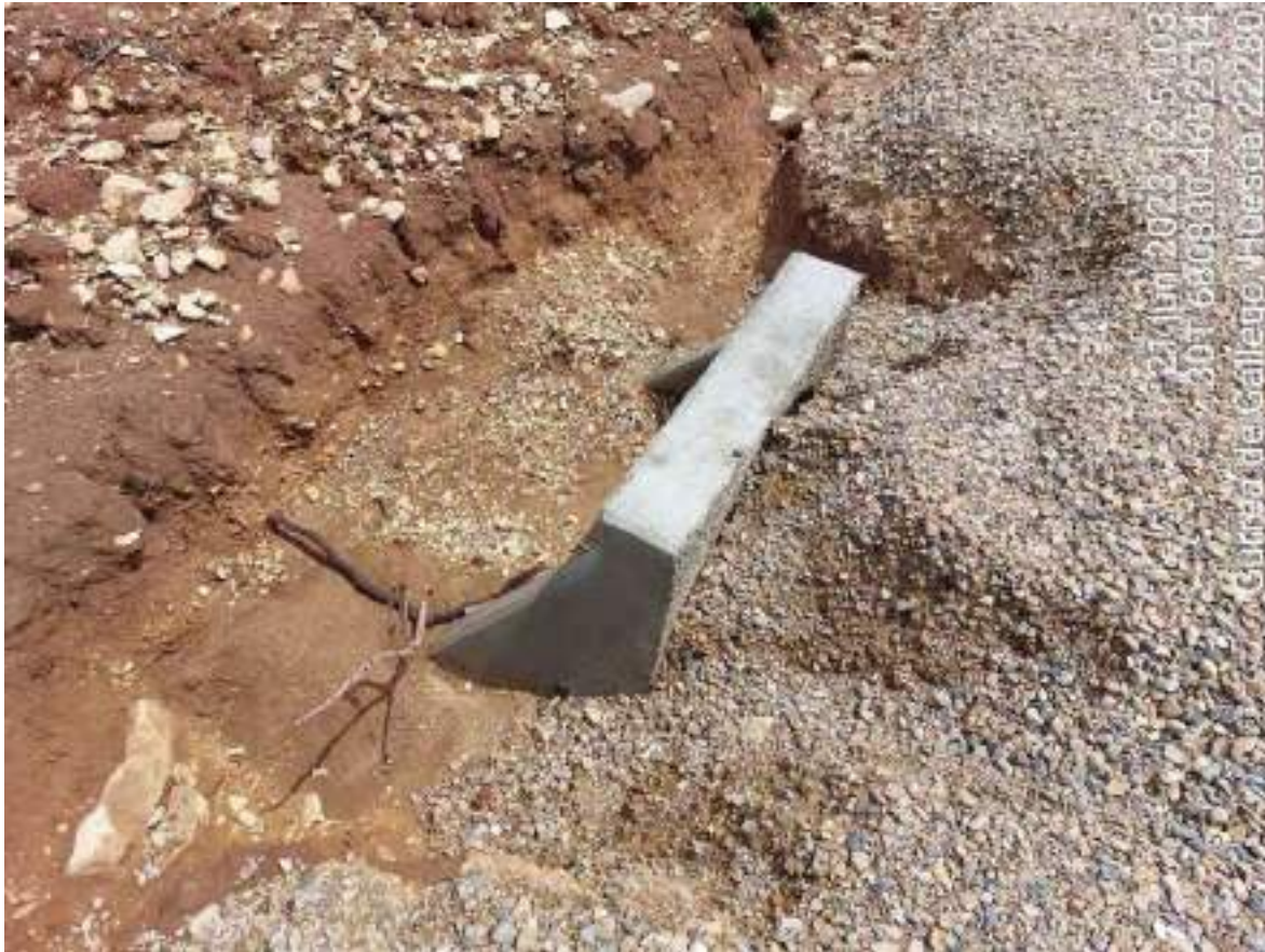
Imagen 2. Desagüe que se debe corregir debido a las lluvias.