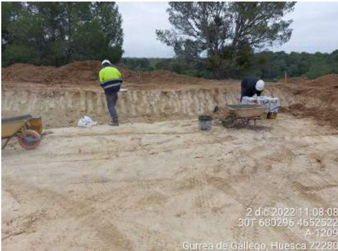
Imagen 2. Residuo de hormigón en el suelo. Se debe poner plástico para proteger el suelo y trabajar sobre él.