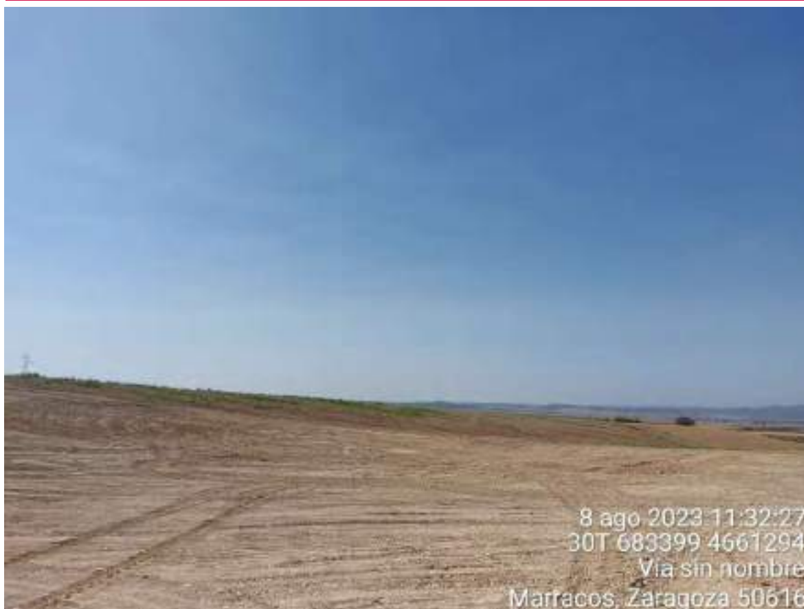
Imagen 3. Trabajos realizados en la balsa creada con el objetivo de eliminarla.