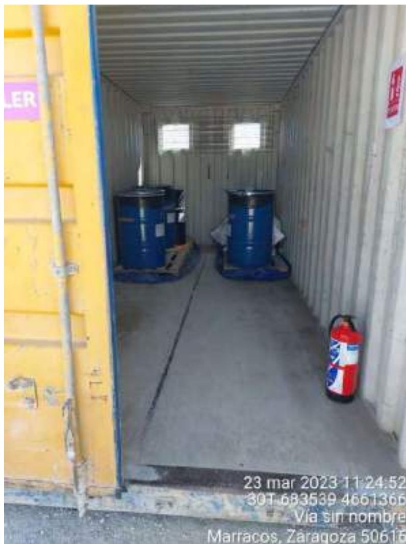
Imagen 2. Almacén de RP de Nordex en buenas condiciones.