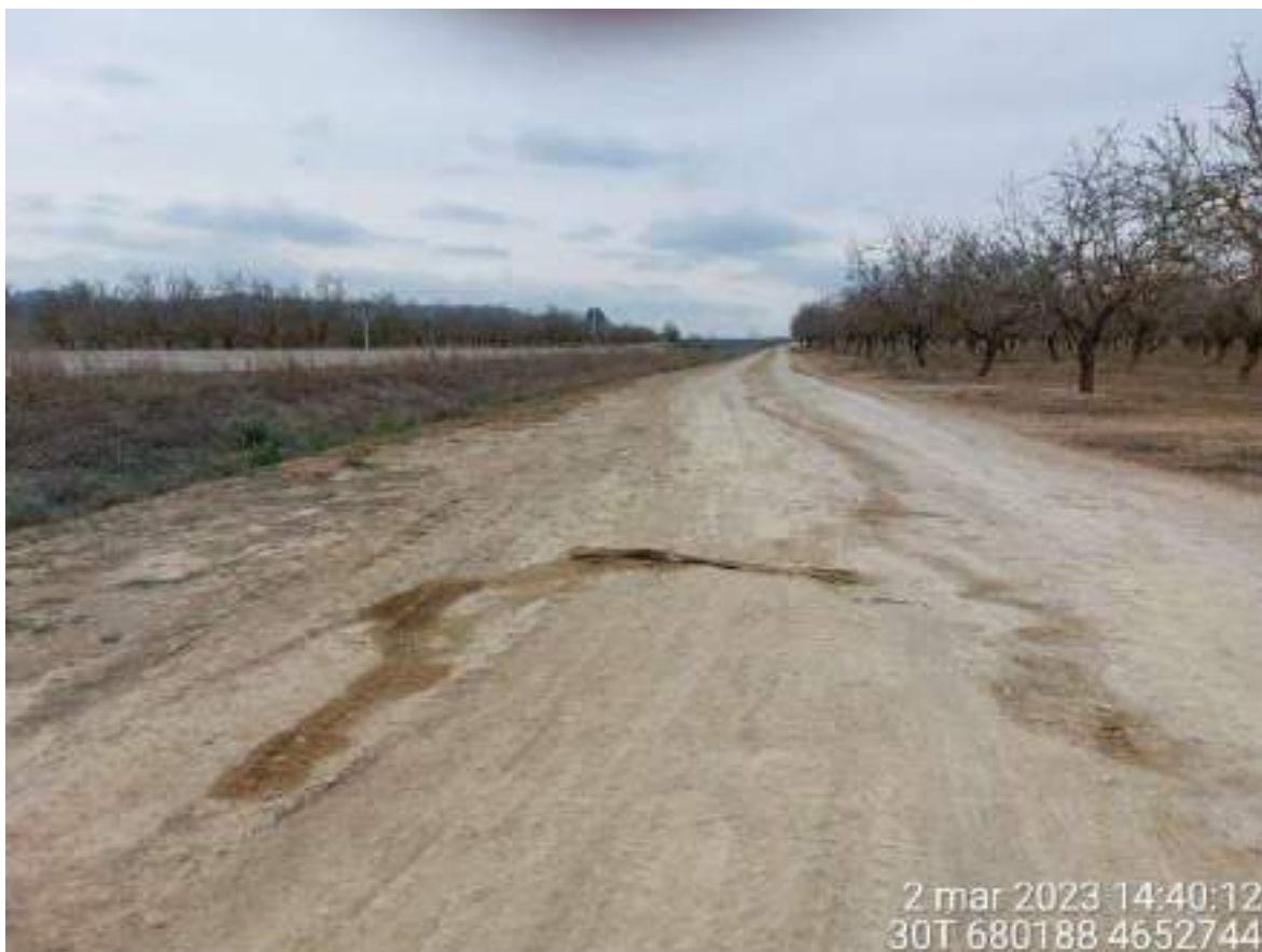
Imagen 3. Mancha de aceite en vial de OBII-03. Se debe recoger y actuar de forma rápida.