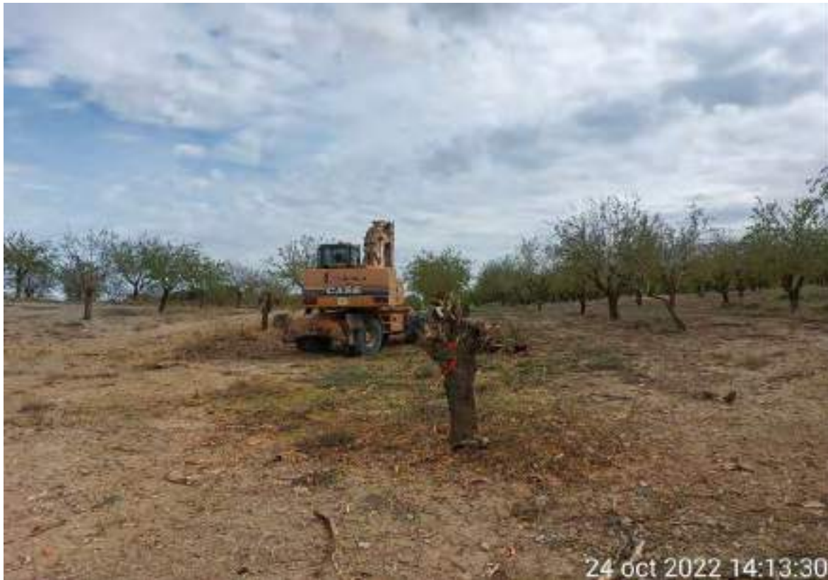
Imagen 2. Maquinaria de Hidroman triturando los almendros marcados para arrancarse.