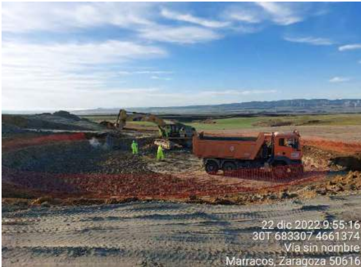
Imagen 2. Maquinaria trabajando en la excavación de OBIII-1