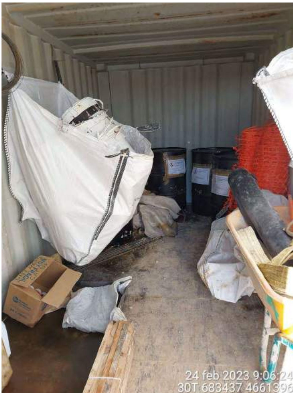
Imagen 4. Almacén de RP de Collosa en el momento de mi visita. Se deben tomar las medidas comentadas en el informe y en mi visita a Diego.