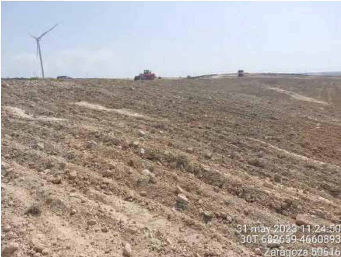
Imagen 3. Restauración morfológica de OBIII-02 todavía sin terminar.