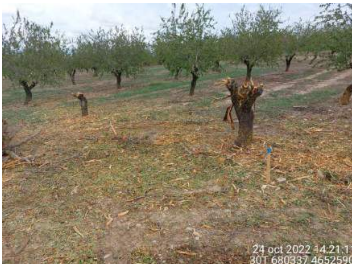
Imagen 1. Almendros afectados fuera de los límites del proyecto según marca el estaquillado.