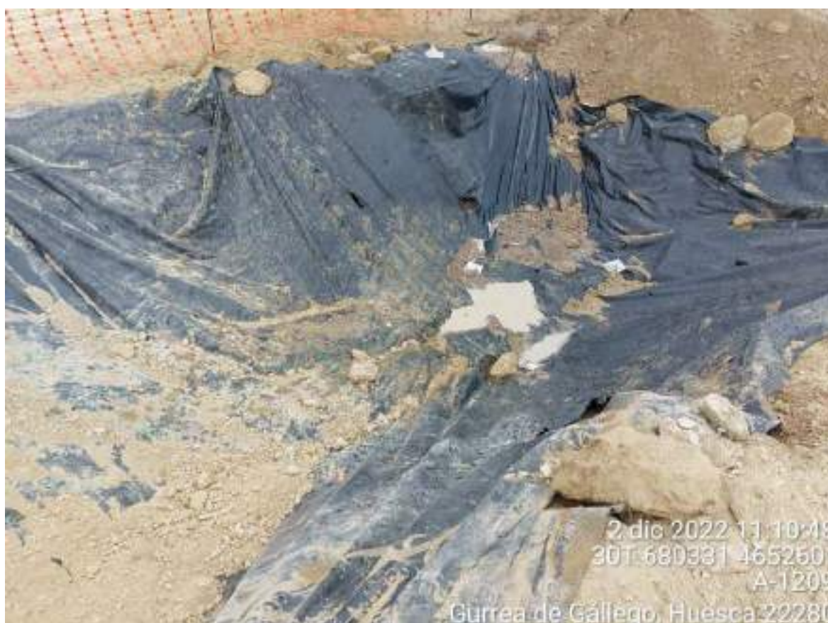
Imagen 1. No conformidad leve. Pozo de lavado en mal estado que genera contaminación del suelo por residuo de hormigón.