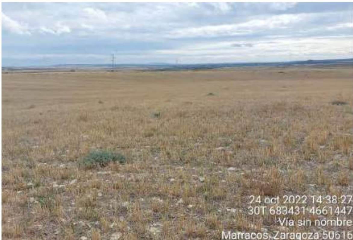
Ilustración 3. Estaquillado de la posición SBIII-01.