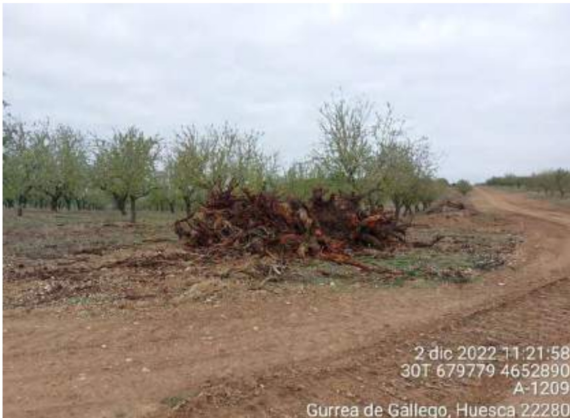
Imagen 3. Restos de almendros que se deben retirar y gestionar del modo correcto.