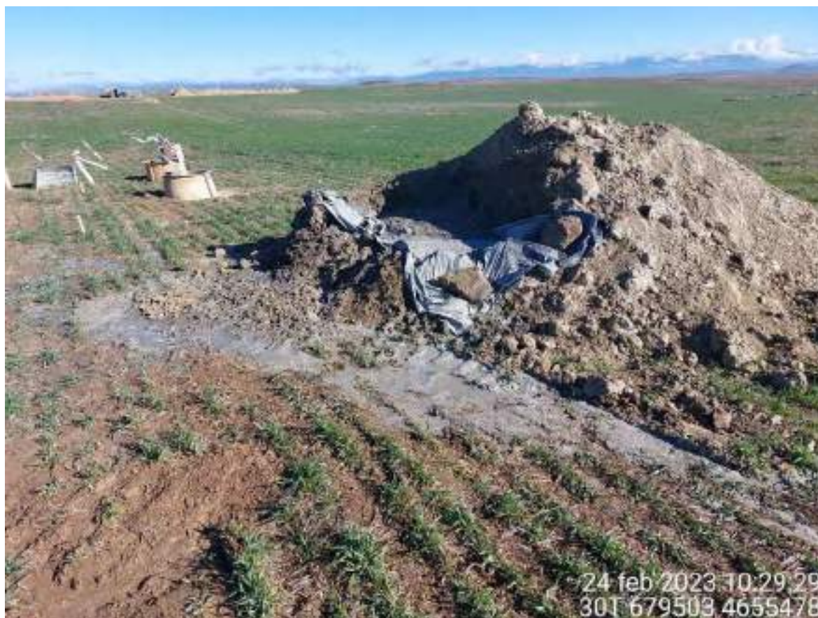
Imagen 3. Residuo de hormigón en el apoyo 39. Se debe recoger y gestionar como tal para no abrir una NC.