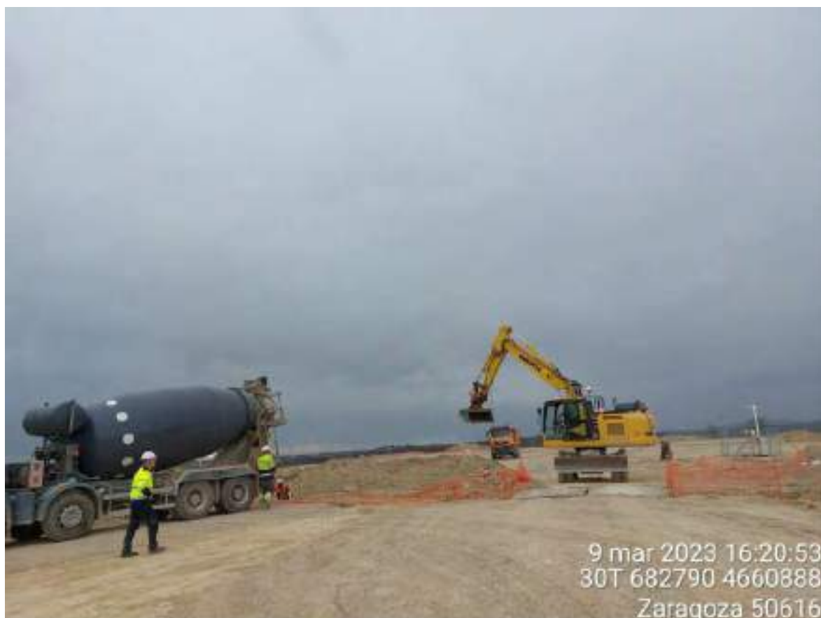
Imagen 1. Maquinaria preparando OBIII-02.