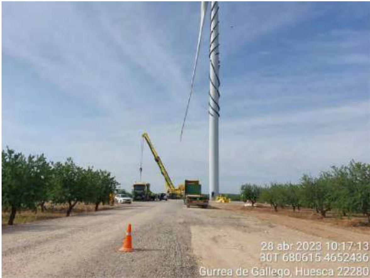
Imagen 1. Posición OBII-02.