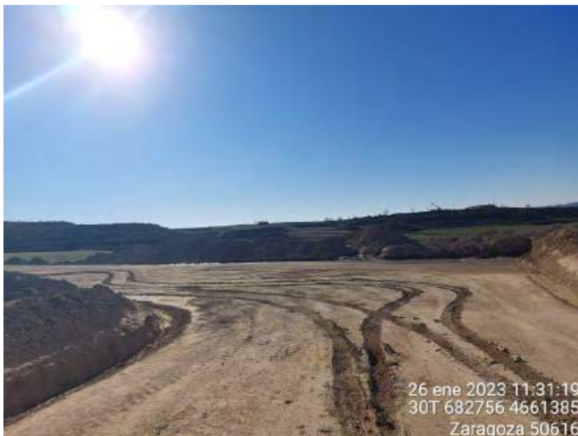
Imagen 1. Zona de la TM de OBIII con el acopio de tierra realizado incorrectamente y caballones por encima de los dos m.