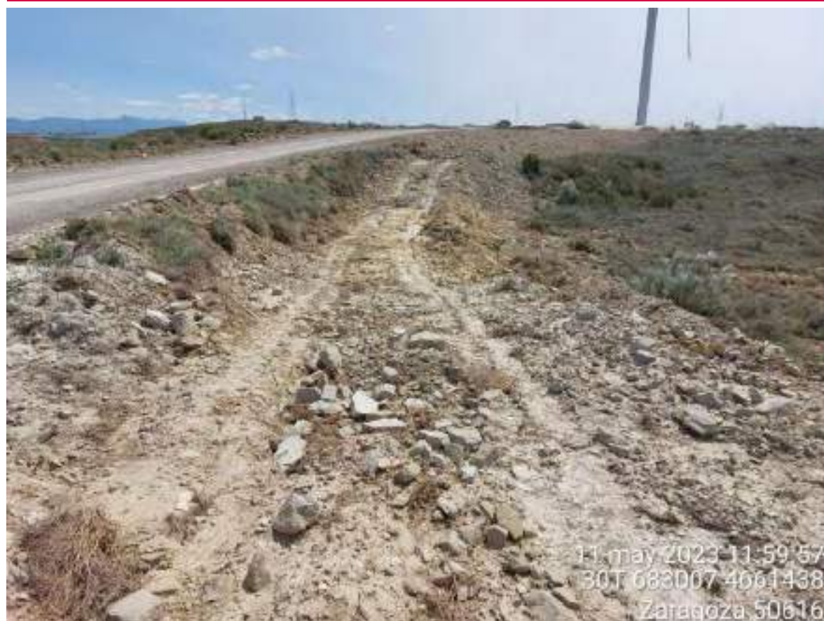
Imagen 1. Ejemplo en el que se debe incidir en la restauración con posterior hidrosiembra.