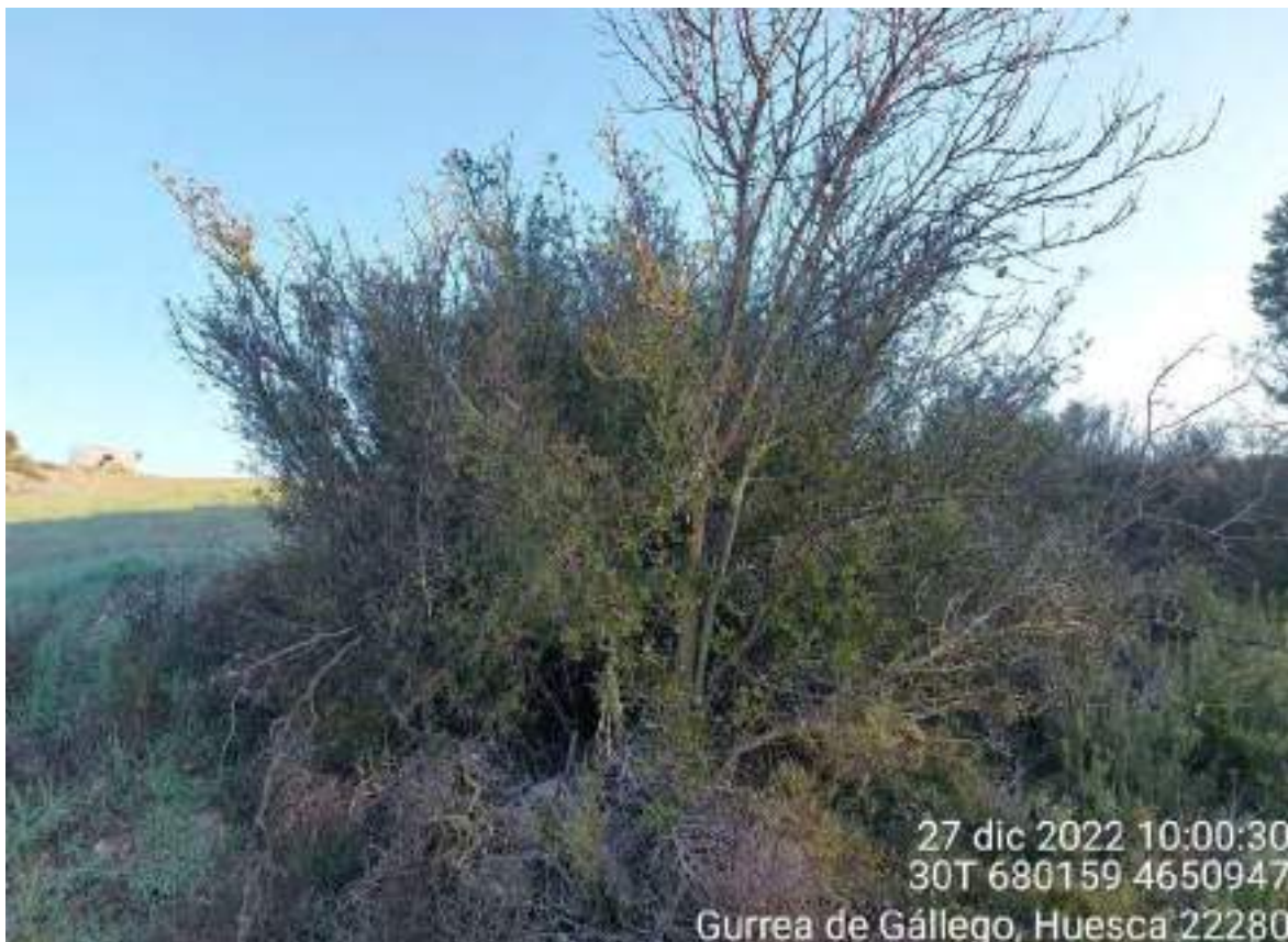
Imagen 5. Arbusto (Quercus sp.) a retirar en el apoyo 59 de la línea de evacuación.