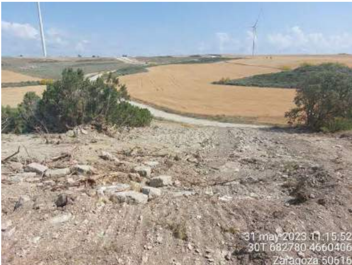
Imagen 2. Tramo de la zanja de evacuación tras relleno, pero sin restaurar definitivamente. Se deben retirar piedras y bolos de tamaño considerable.