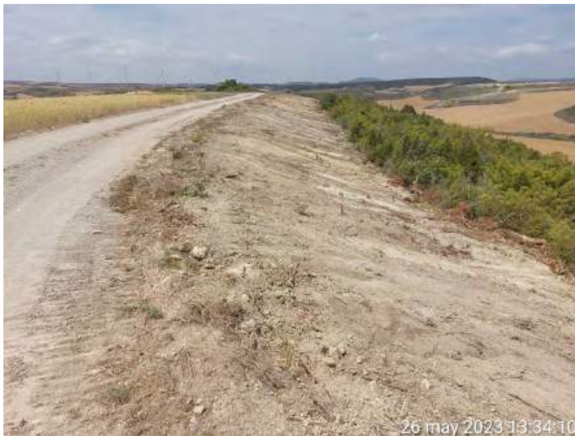
Imagen 2. Relleno de zanja de evacuación sobre el que hay que realizar trabajos de restauración.