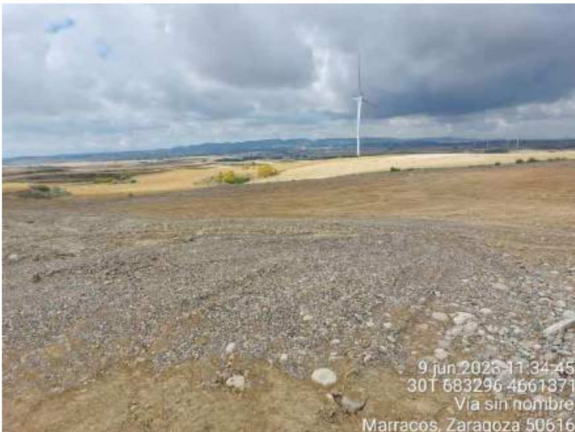
Imagen 3. Suave caída desde la plataforma de ocupación definitiva hasta el campo de cultivo del propietario en OBIII-01.