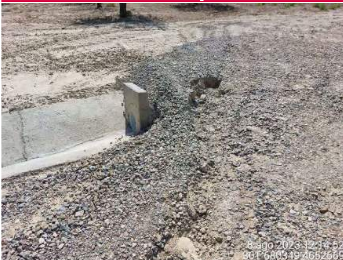
Imagen 1. Drenaje que se debe mejorar tras la restauración geomorfológica.