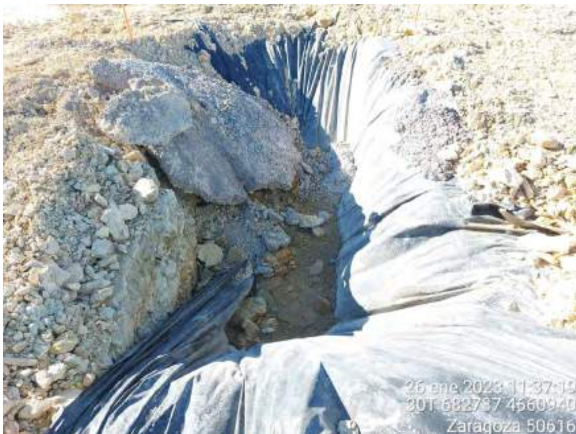
Imagen 4. Pozo de lavado utilizado en OBIII-02. Se recuerda que el suelo debe estar protegido lo máximo posible ante el hormigón. Al finalizar su uso ese hormigón se picará y se gestionará correctamente, restaurando la zona en la que se creó ese pozo.