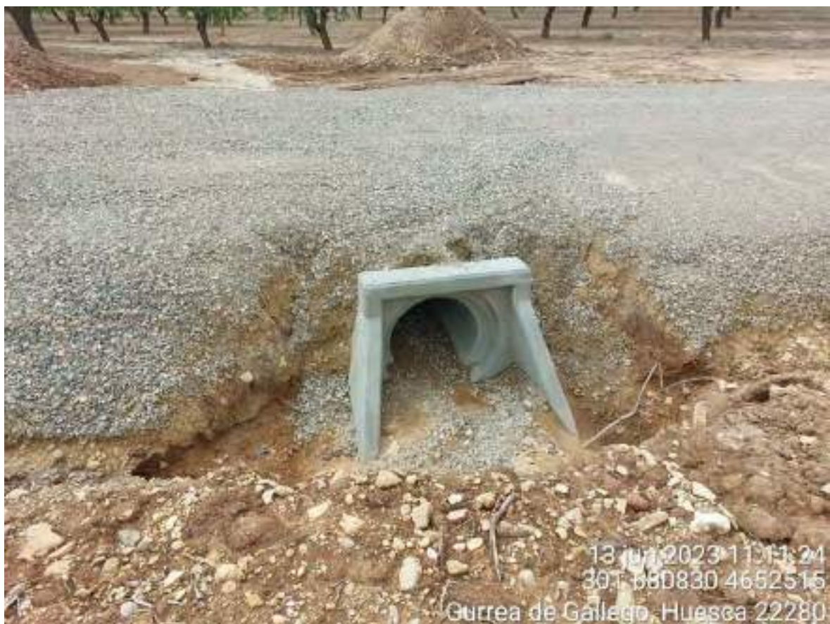
Imagen 2. Problemas de erosión y de fijación del suelo.