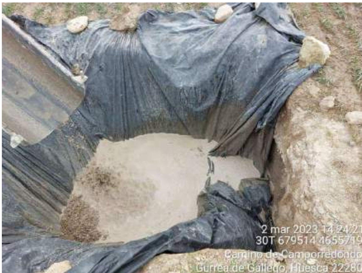
Imagen 2. Pozo de lavado en mal estado debido al levantamiento del plástico consecuencia del aire.