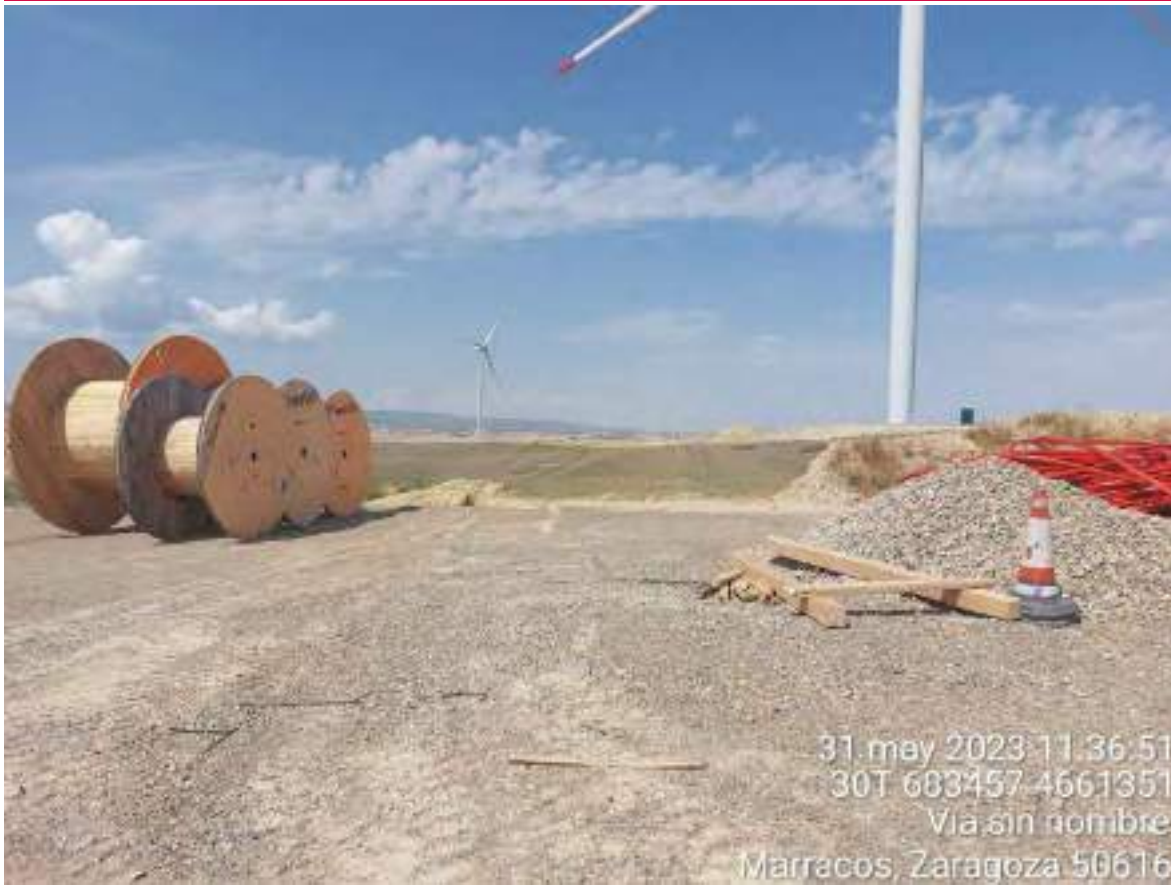
Imagen 1. Bridas y demás residuos en la campa de acopio y el punto limpio de Collosa.