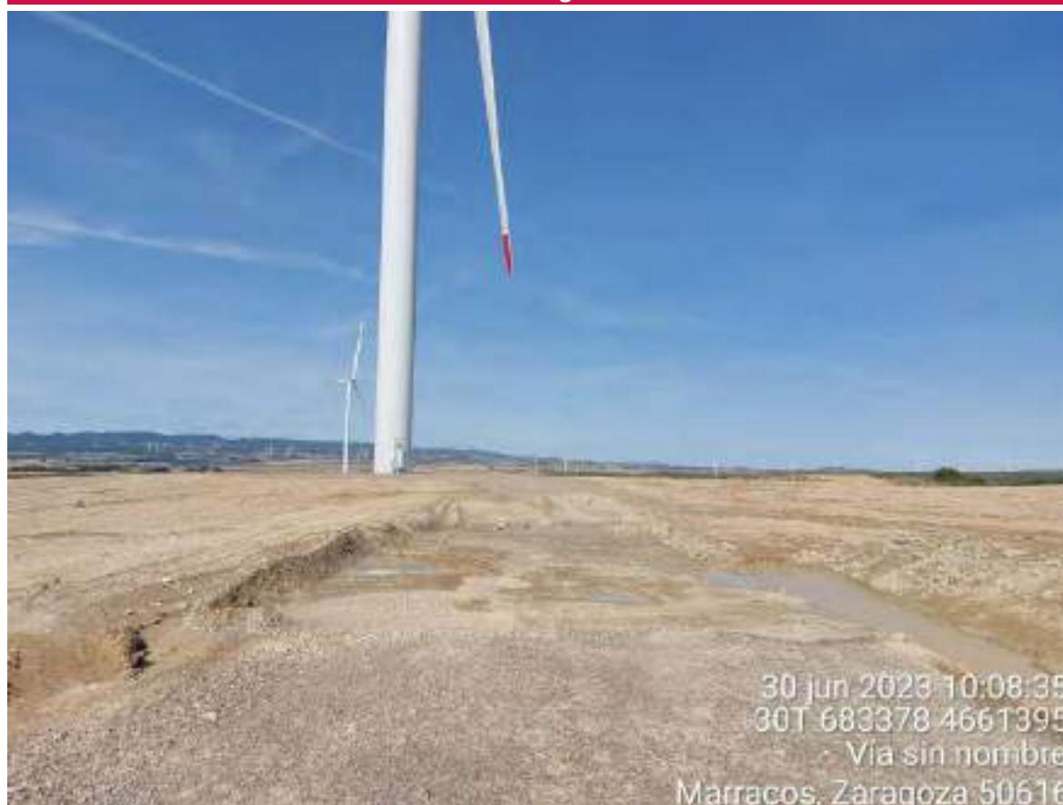
Imagen 1. Vial hacia OBIII-01 sobre el que se están haciendo trabajos de restauración ambiental.