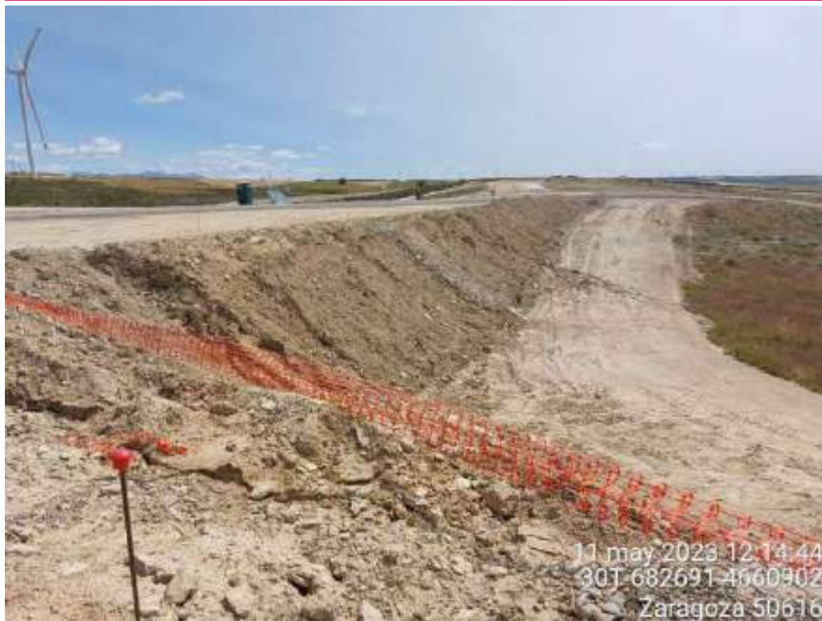
Imagen 2. Posición OBIII-02, conflictiva desde el punto de vista de la restauración morfológica.