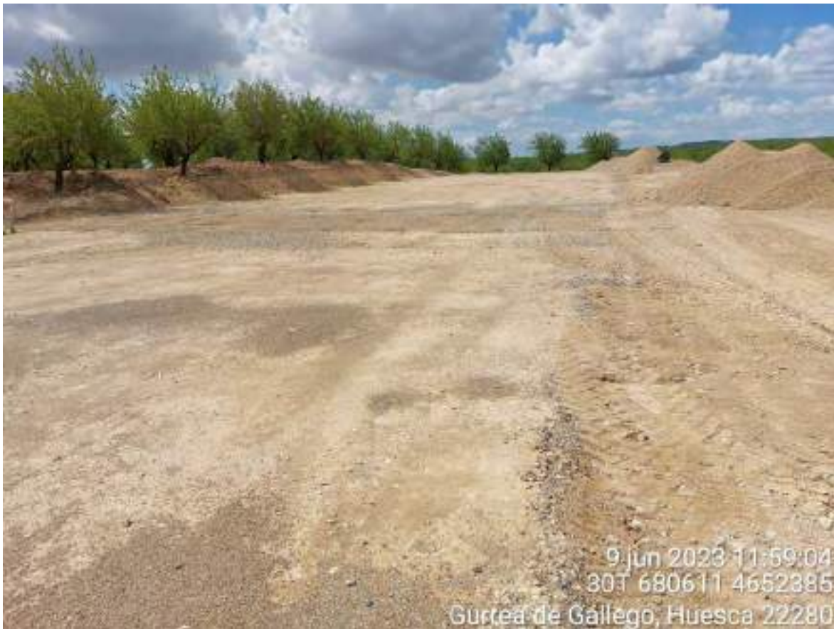
Imagen 4. Retirada de zahorra en la plataforma de ocupación temporal en OBII-01.