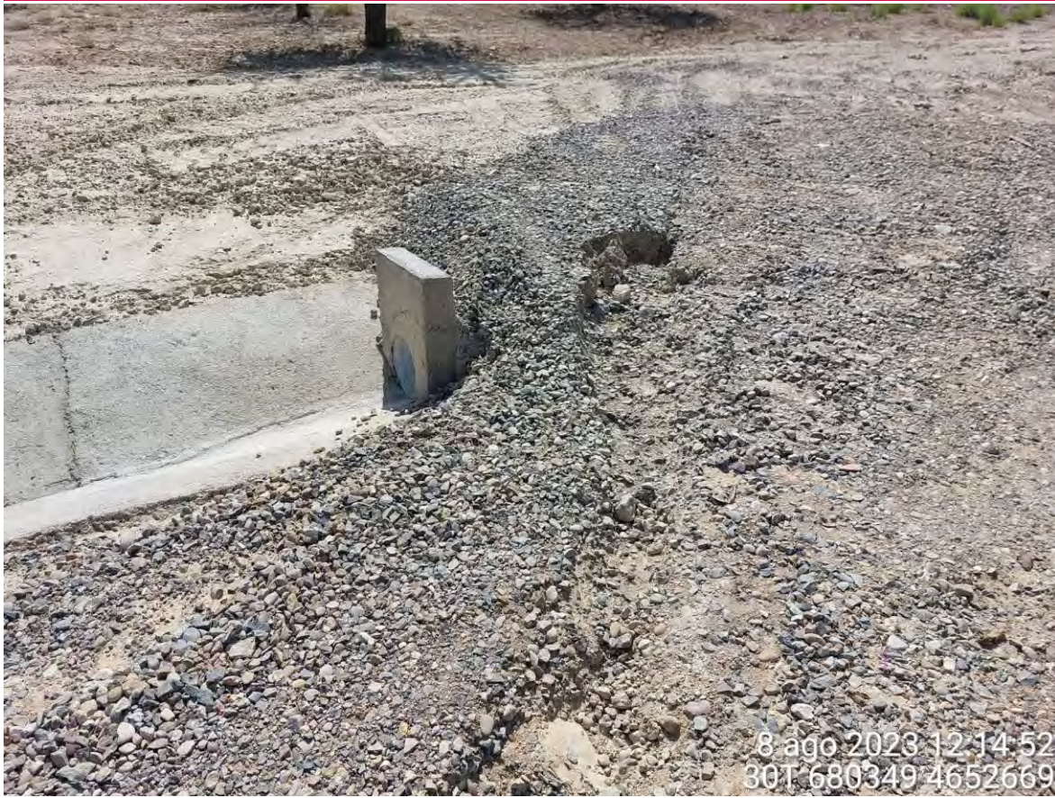
Imagen 1. Drenaje que se debe mejorar tras la restauración geomorfológica.