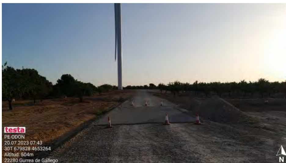
Acceso cortado a plataforma