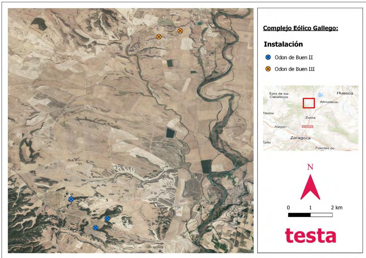
Imagen 1. Mapa de situación de los parques eólicos Odón de Buen II y Odón de Buen III

Los parques eólicos Odón de Buen II y Odón de Buen III y su línea de evacuación de encuentran en los términos municipales de Marracos (Zaragoza), Gurrea de Gállego (Huesca) y Zuera (Zaragoza).