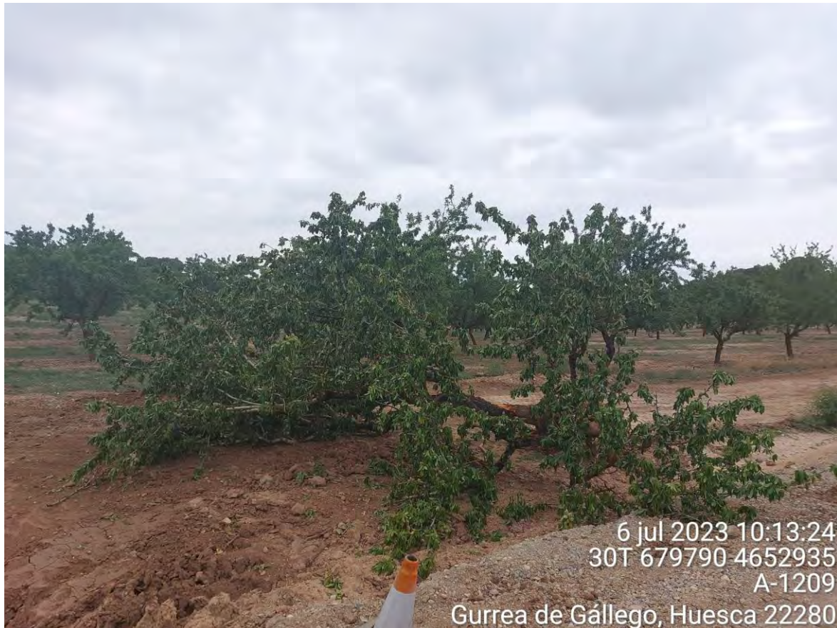
Imagen 2. Almendros arrancados que deben retirarse de la obra.