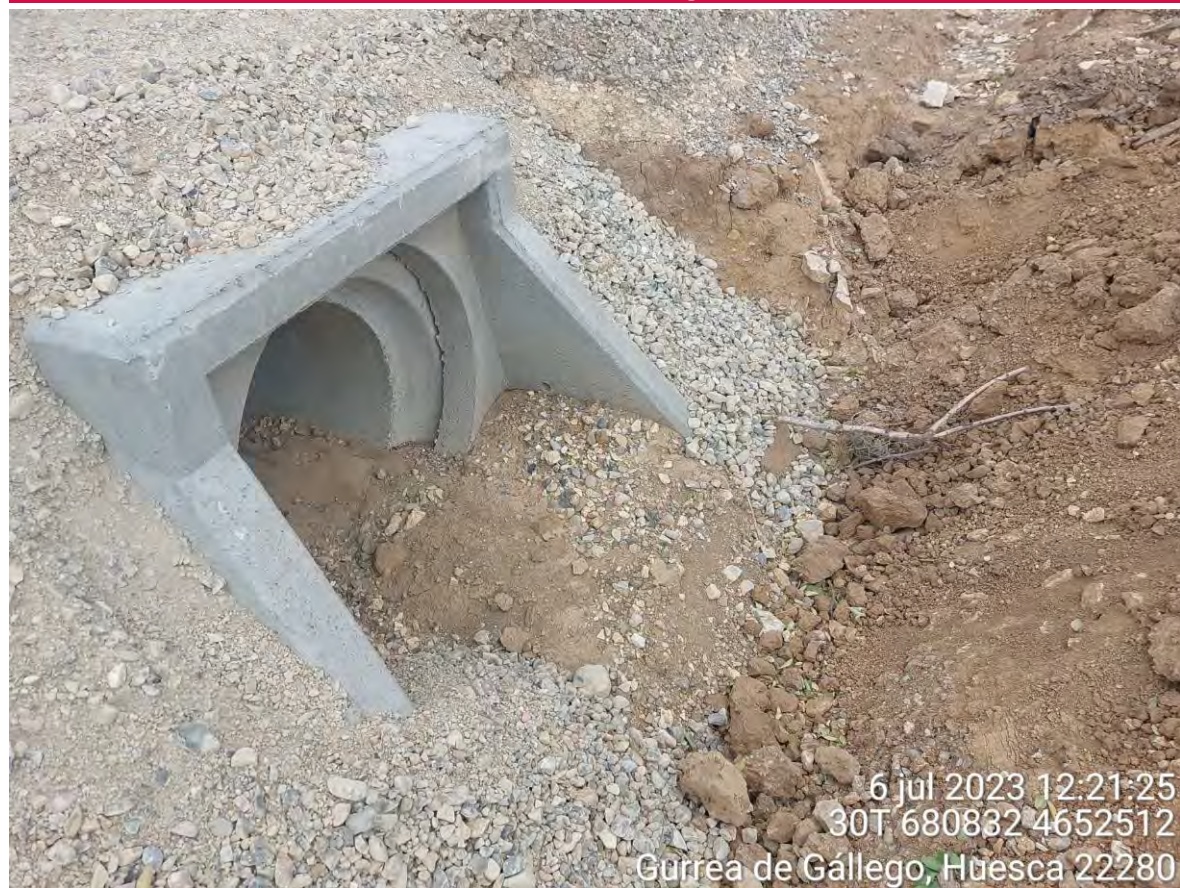
Imagen 1. Desagüe sobre el que hay que trabajar para que no tapone el agua y pueda circular por su cauce.