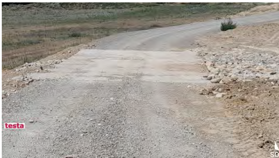
Cunetas en mal estado.