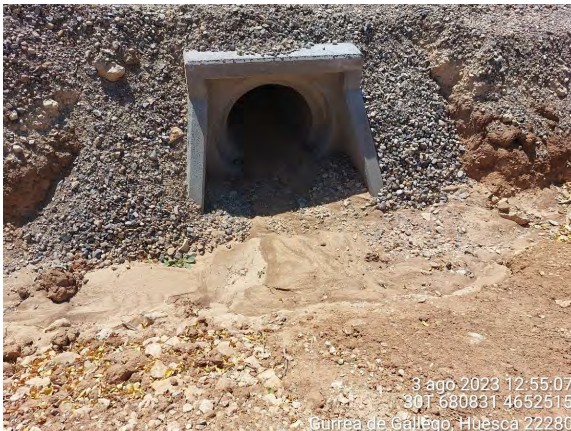
Imagen 1. Desagüe con riesgo de taponarse e impedir que el agua pueda salir por esa vía.