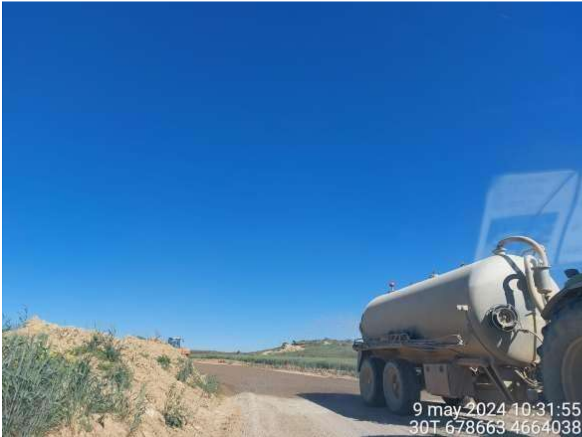
Imagen 2. Cuba regando vial que llega a PAU-06.