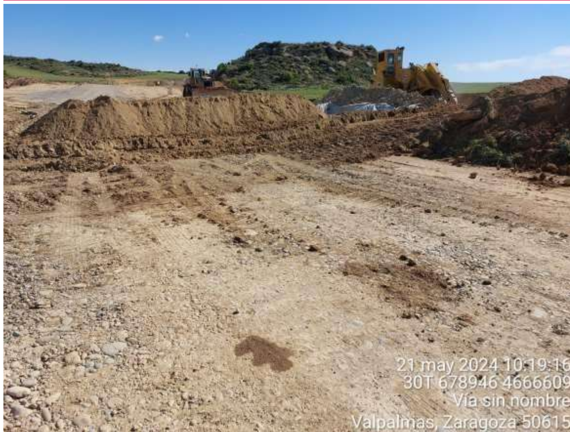
Imagen 3. NC leve. Apertura de zanja sobre residuo de hormigón.