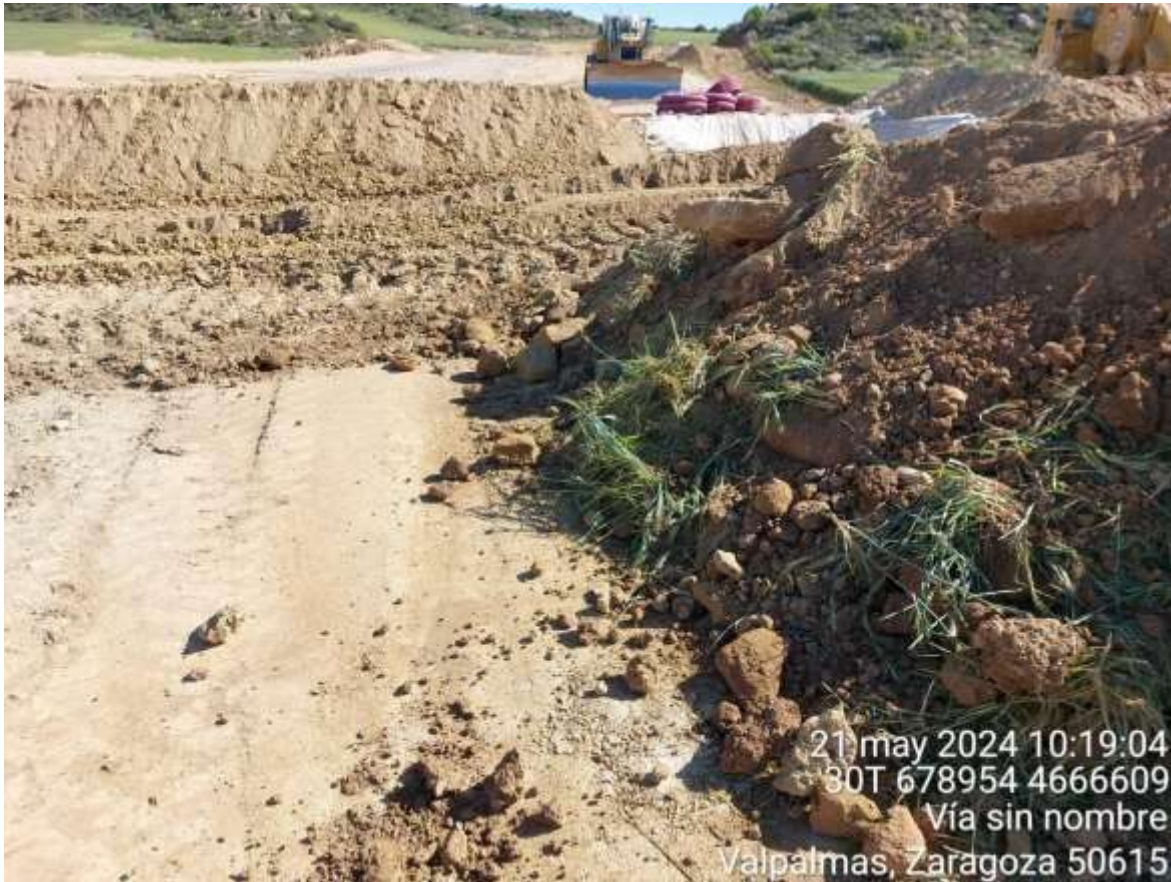
Imagen 1. NC leve. Apertura de zanja sobre residuo de hormigón.