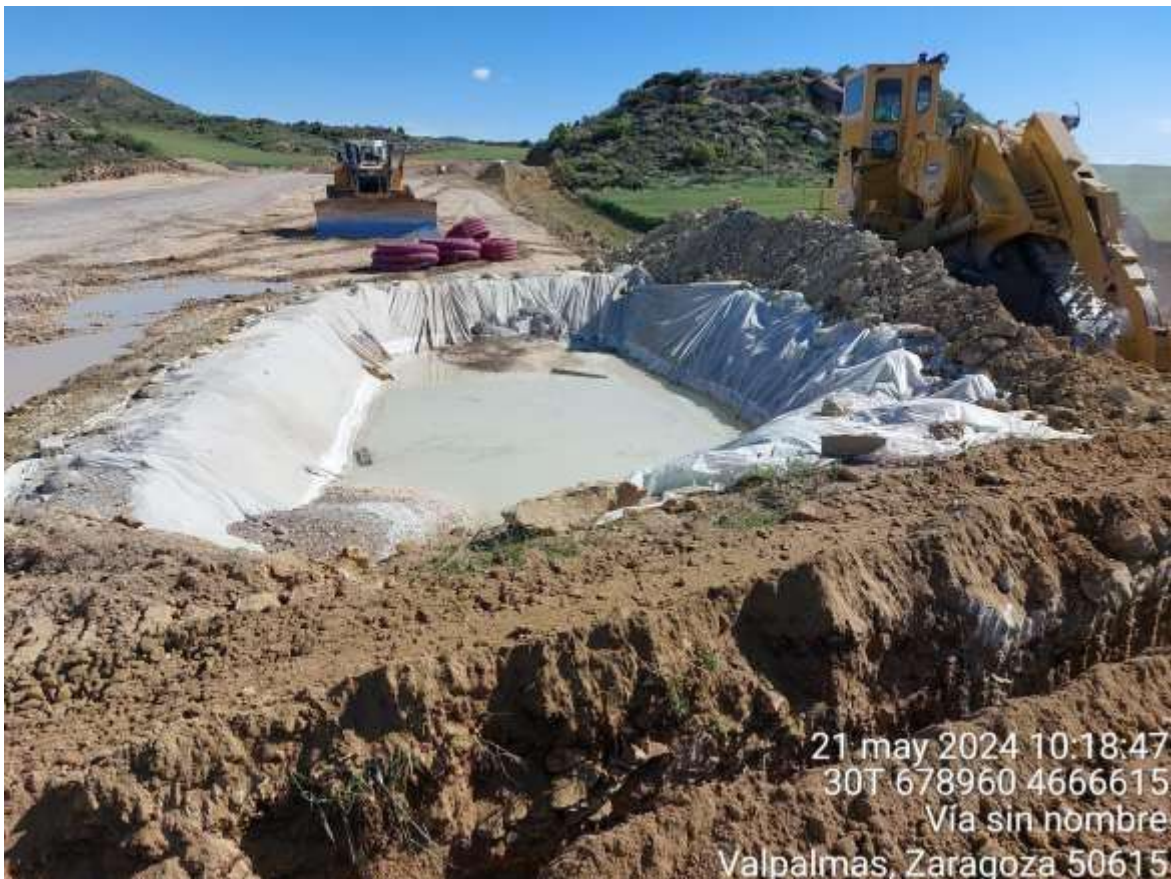
Imagen 2. NC leve. Apertura de zanja sobre residuo de hormigón.