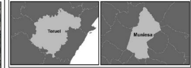
MAPA DE EMPLAZAMIENTO