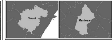
MAPA DE EMPLAZAMIENTO