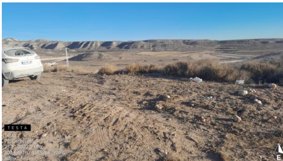
Residuos en CNT1-07