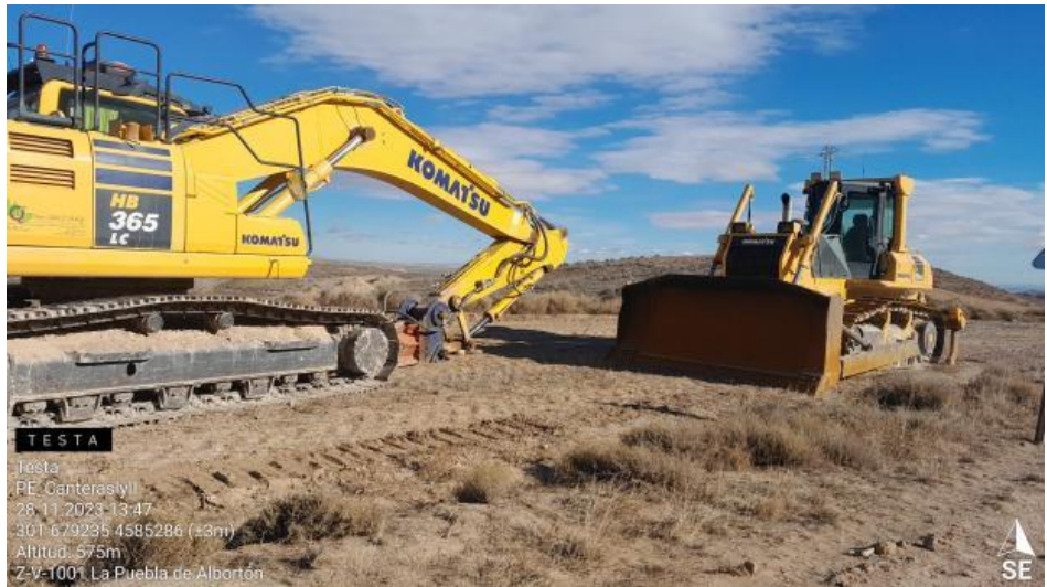
Maquinaria estacionada indebidamente cercana a CNT1-8.