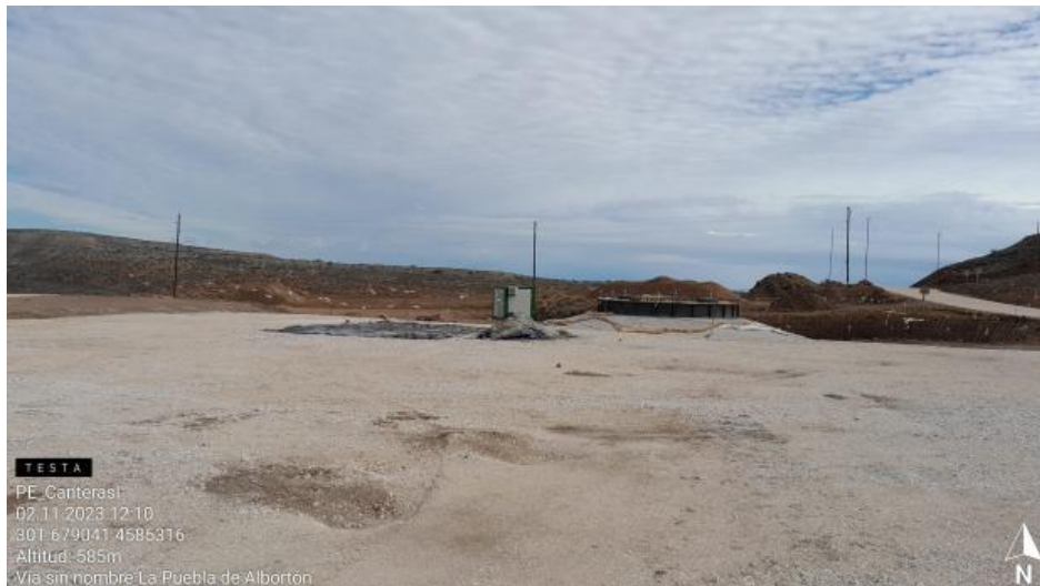
Restos de hormigón en CN1-8