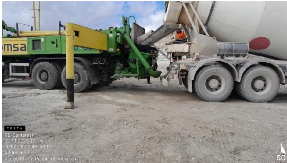
Hormigonado limpieza en CN1-2