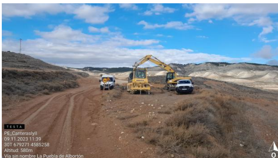
Reparación de maquinaria sobre suelo sin protección.