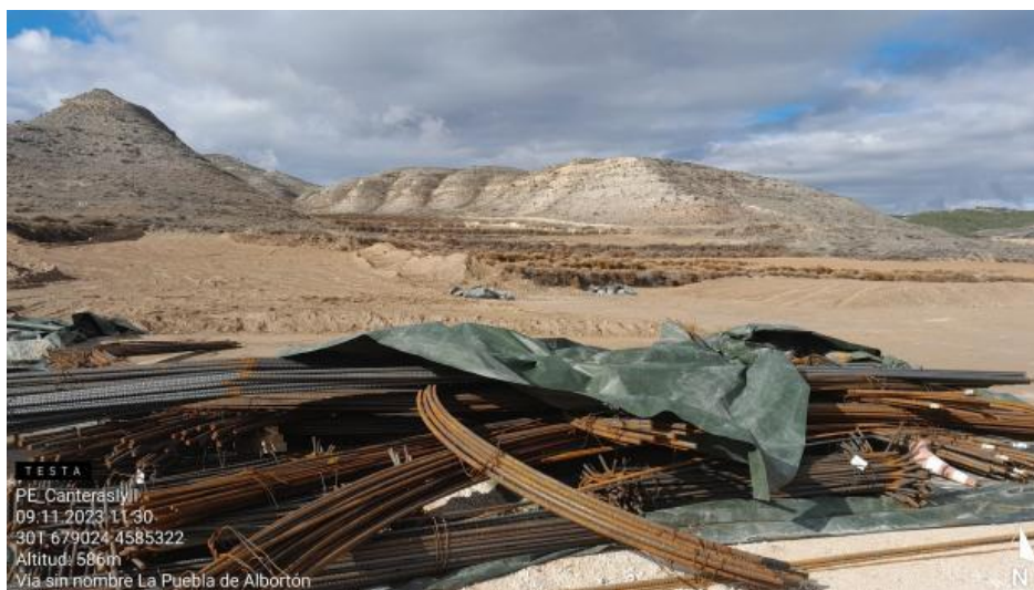
Materiales esparcidos por vientos fuertes en CNI-8