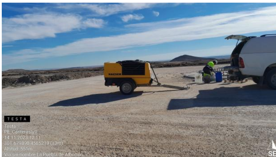
Generador sin protección de suelo en CNI-7.