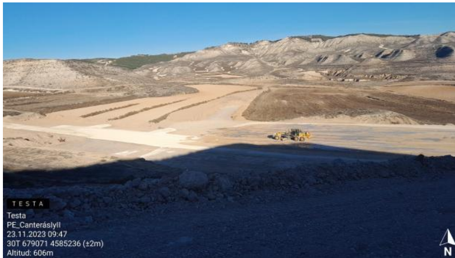
Extendido de zahorra CNT1-08