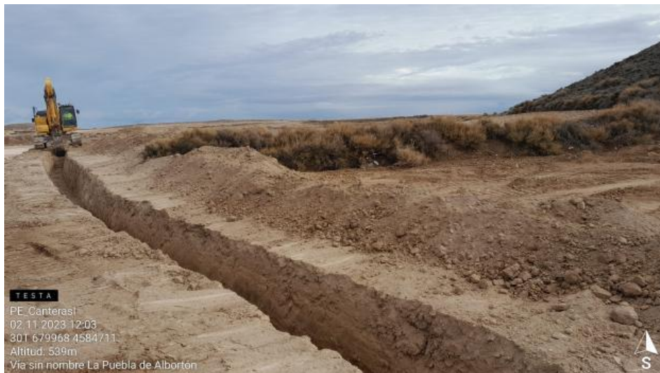
Zanja de evacuación en CN1-6 sin separación de tierras .