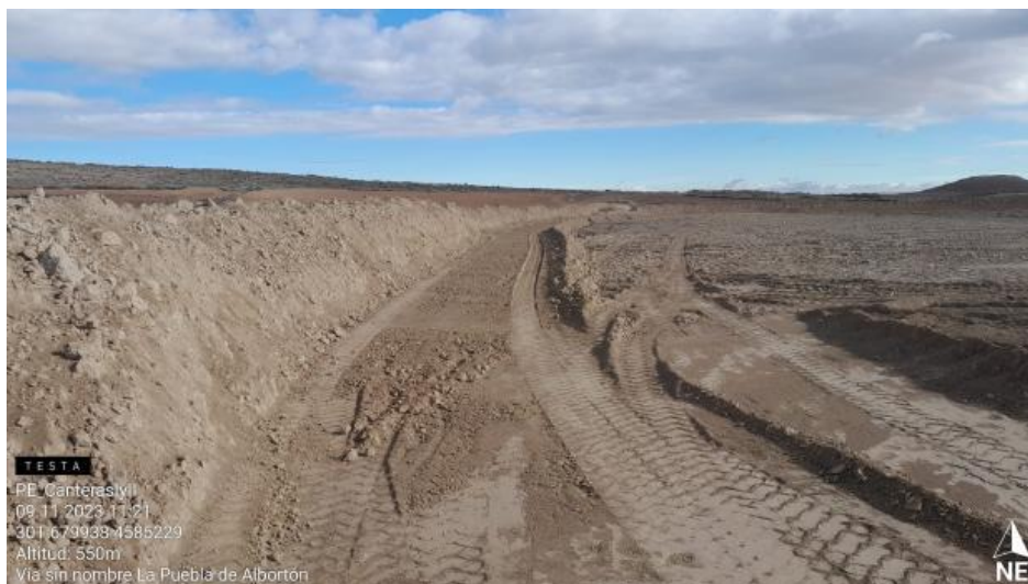
Separación de tierras insuficiente en CNI-7