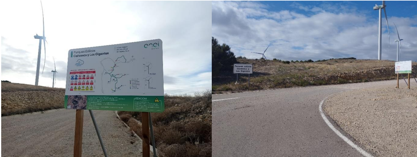
Fotografías 14 y 15: Carteles en entrada al parque