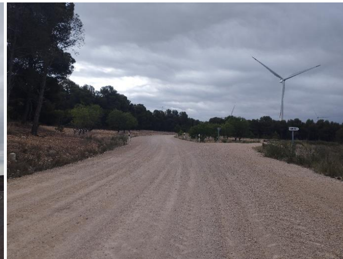
Fotografías 6 a 7: Estado de los caminos y viales