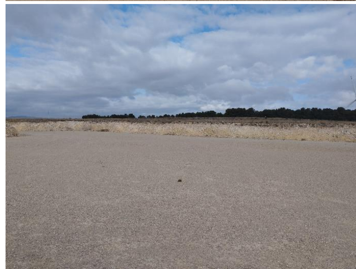
Fotografías 8 a 11: Estado de las plataformas