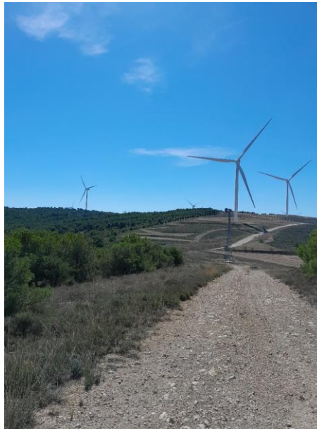
Fotografías 1 a 3: Visibilidad del parque