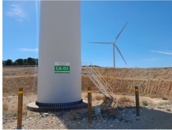
Fotografías 12 a 13: Señalización de las torres de los aerogeneradores