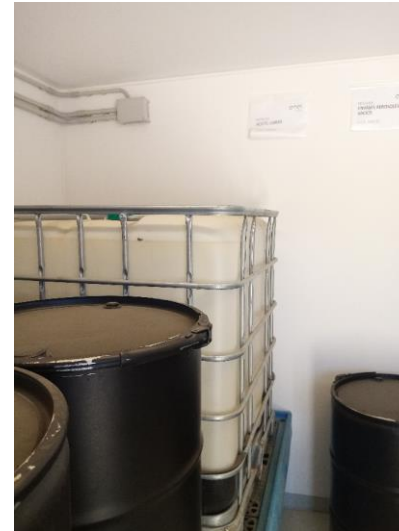
Fotografías 16 a 19: Punto limpio.