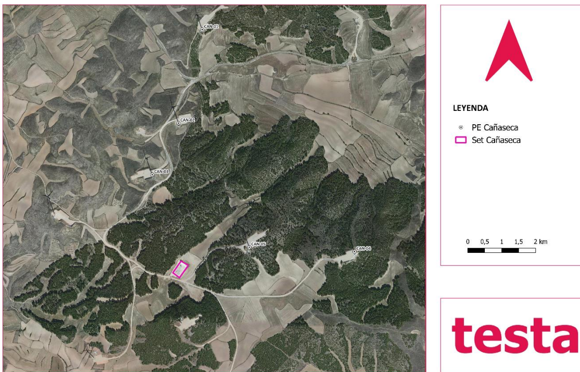
Ilustración 1. Ubicación del parque eólico

El acceso al eje norte del parque se realiza desde la carretera CV-821 y desde la carretera A-2306 al eje sur.