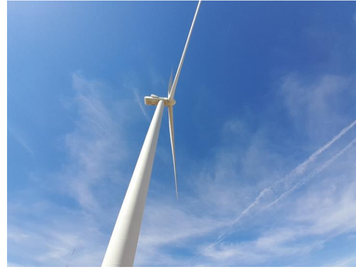
Fotografías 4 a 5: Barquillas de los aerogeneradores sin derrames de aceite