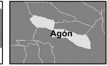
Mapa de emplazamiento