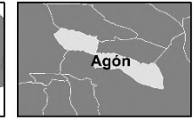
Mapa de emplazamiento