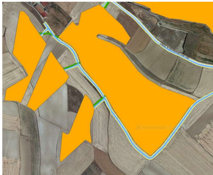
Imagen de Vial de parque (indicada en color Azul)