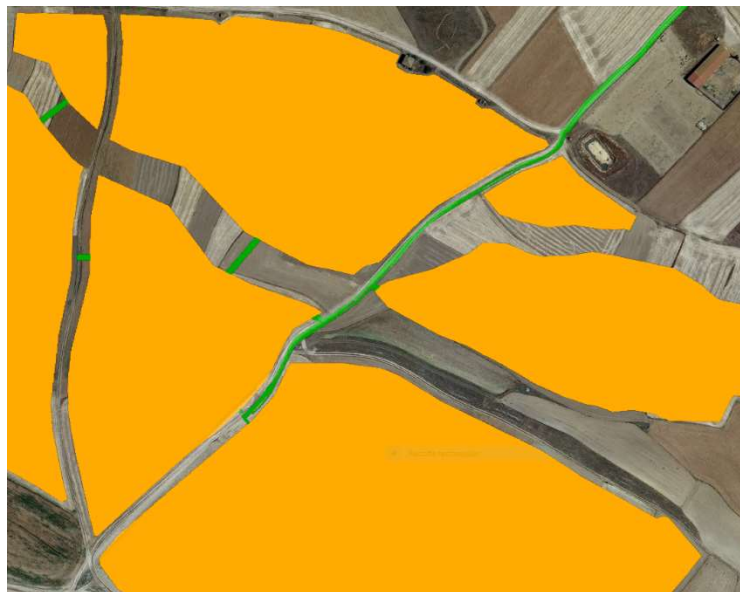
Imagen en planta de la Servidumbre de zanja (indicado en verde)