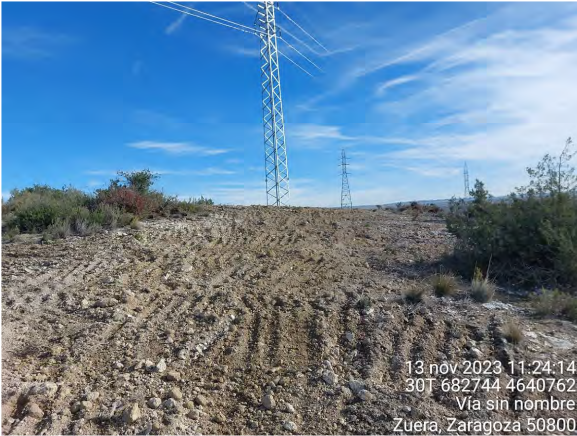
Imagen 1. Apoyo 100 restaurado morfológicamente.