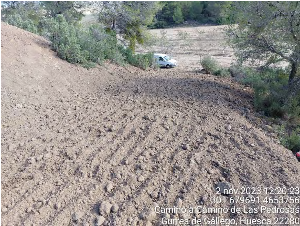
Imagen 1. Apoyo 46 tras la restauración morfológica.