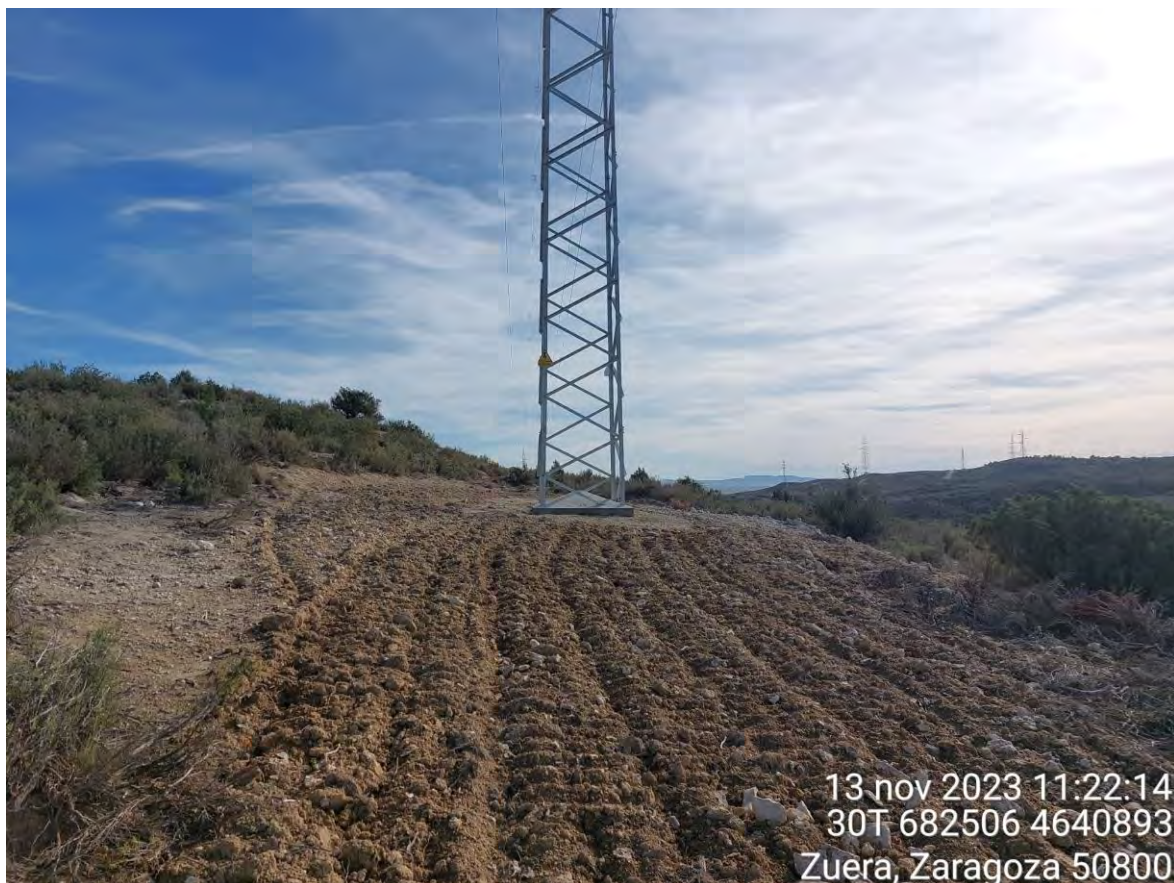
Imagen 4. Apoyo 99 restaurado morfológicamente.