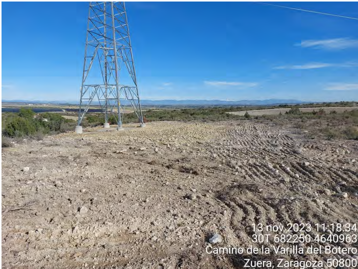
Imagen 3. Apoyo 98 restaurado morfológicamente.