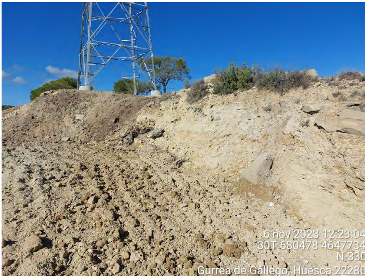
Imagen 1. Apoyo 71 sobre el que se deben realizar trabajos de rebajar pendiente y crear talud.