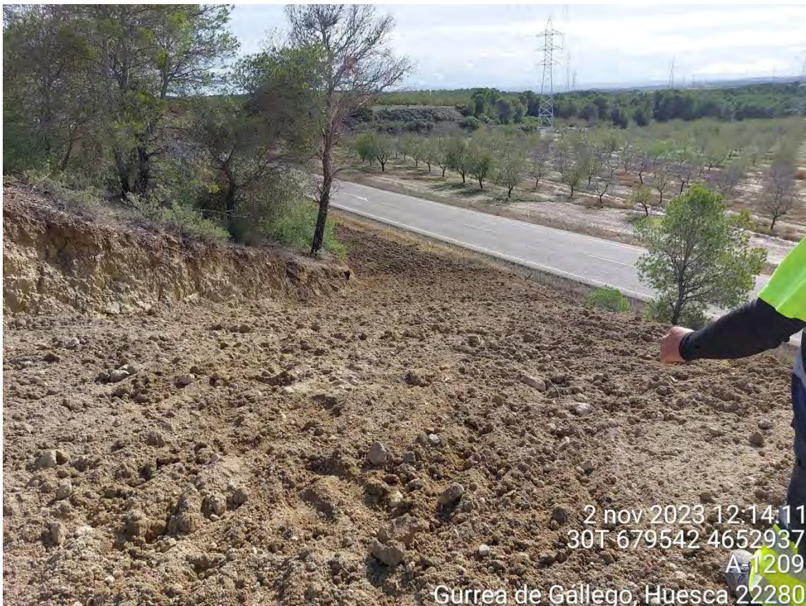
Imagen 2. Apoyo 50 tras la restauración morfológica.