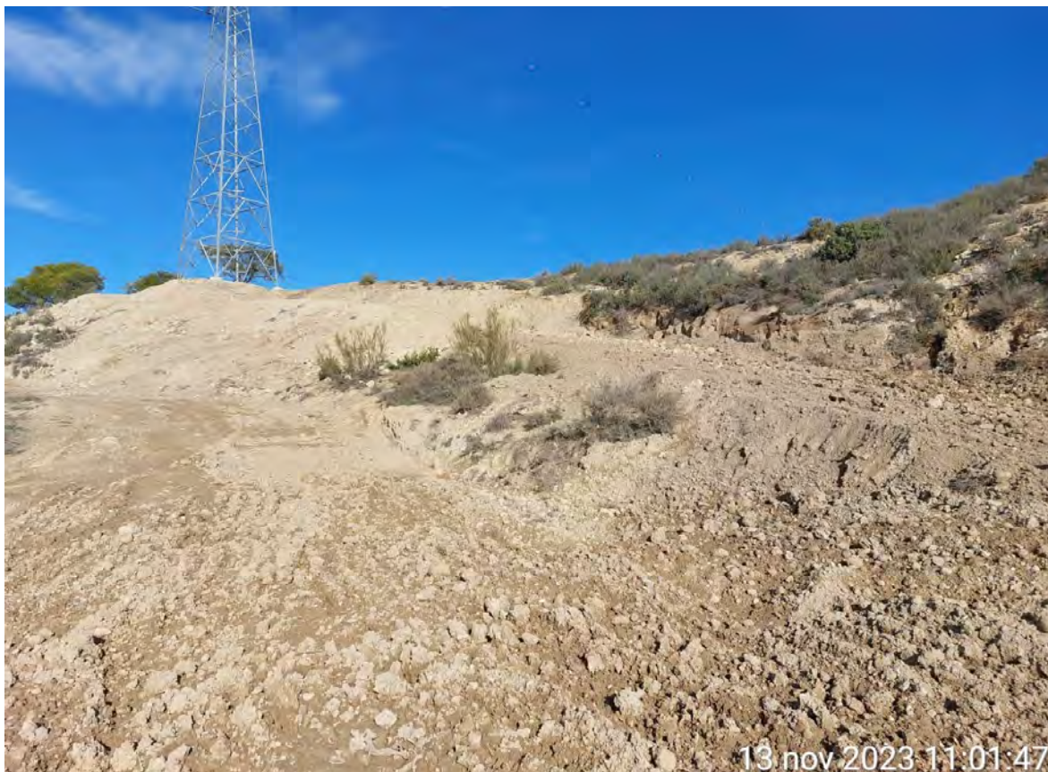
Imagen 2. Apoyo 71 restaurado morfológicamente.