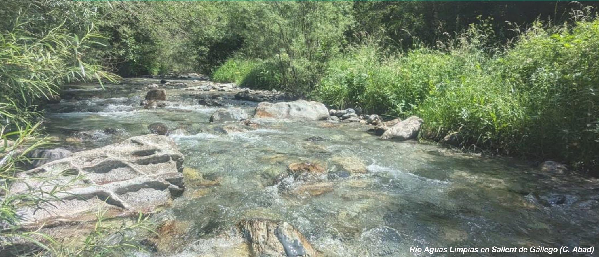
Río Aguas Limpias en Sallent de Gállego (C. Abad)

Este documento tiene carácter meramente informativo, a efectos legales se estará a lo dispuesto en la ORDEN MAT/1667/2024, de 19 de diciembre, por la que se aprueba el Plan General de Pesca de Aragón para la temporada 2025.