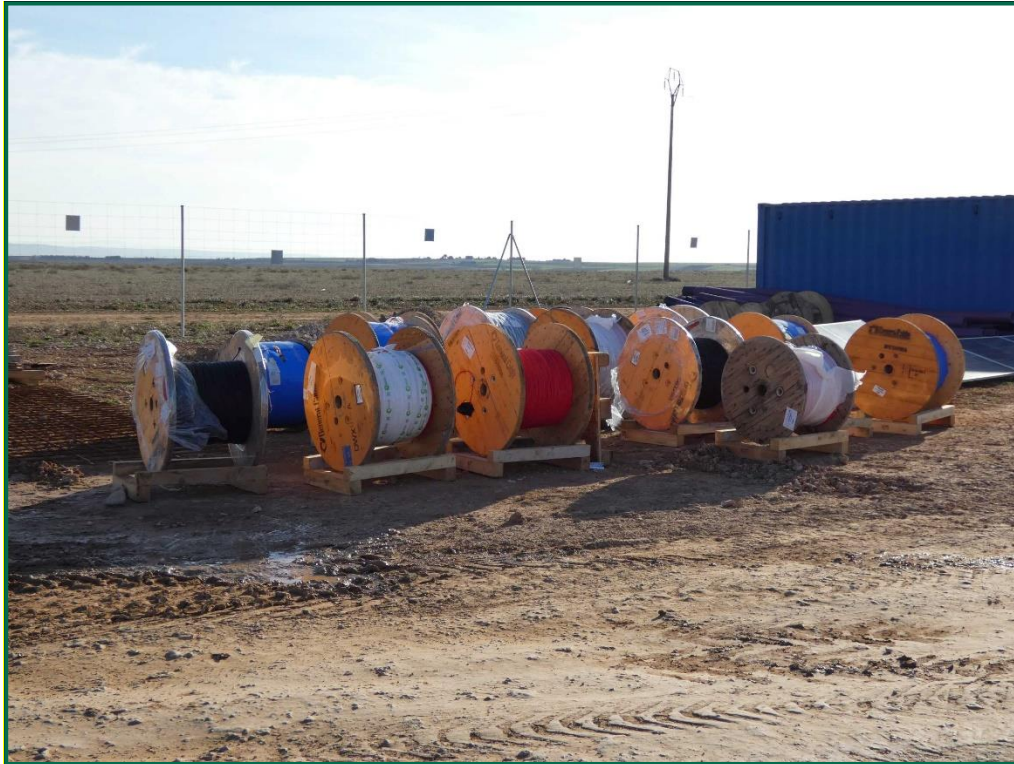
Fotografía 13. Bobinas de cable.