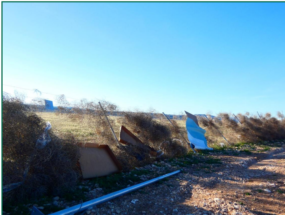
Fotografía 16. Restos de embalaje sobre el vallado.