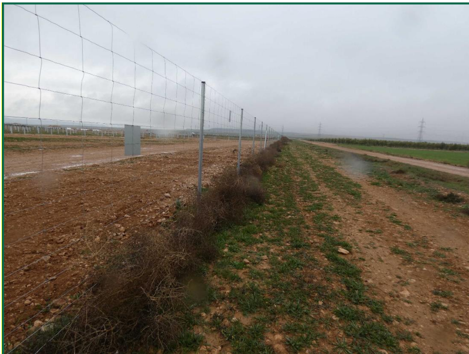
Fotografía 7. Vallado perimetral y placa anticolidión.

Durante este mes el vallado se ha doblado en ciertos puntos debido a los fuertes vientos que arrastran plantas rodadoras hasta que los postes del vallado ceden. Estos desperfectos se arreglarán en meses posteriores.