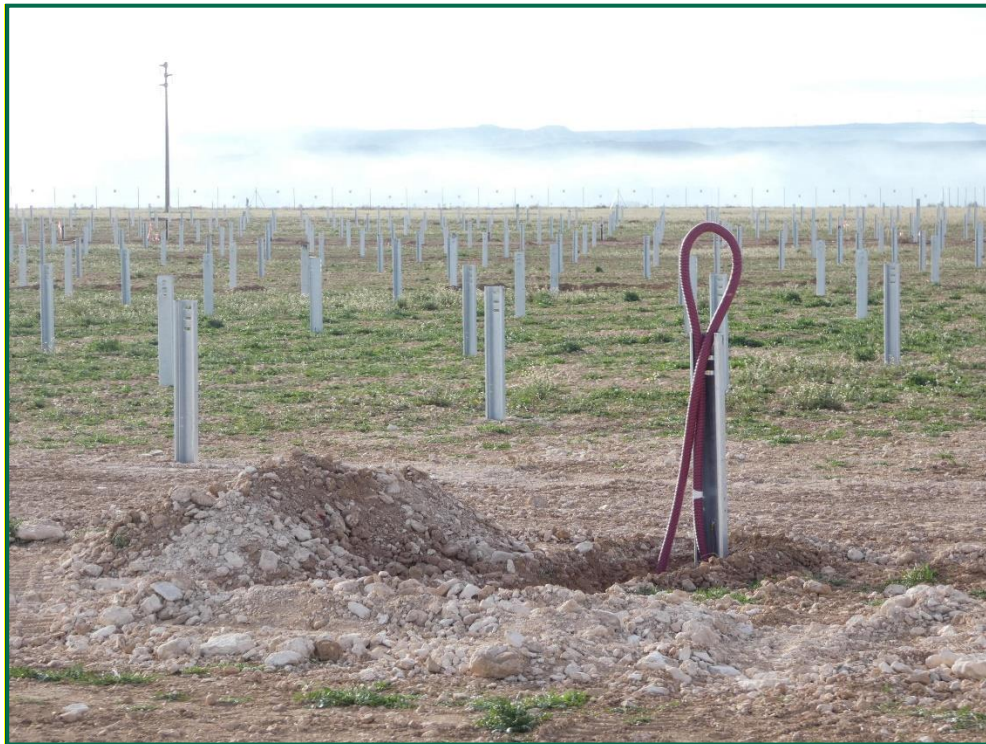
Fotografía 3. Tapado de zanjas.

Por el momento la tierra vegetal extraída ha sido escasa debido a que no ha sido necesario nivelar todo el terreno, únicamente algunas zonas y con un espesor limitado, y esta se ha ido extendiendo sobre el terreno. La tierra extraída para la construcción de balsas de limpieza se ha acopiado en caballones al igual que la tierra retirada para realizar zanjas. En las zonas donde se van a realizar plantaciones para crear una patalla vegetal no se ha realizado ningún movimiento de tierra, conservando la capa de tierra vegetal presente.