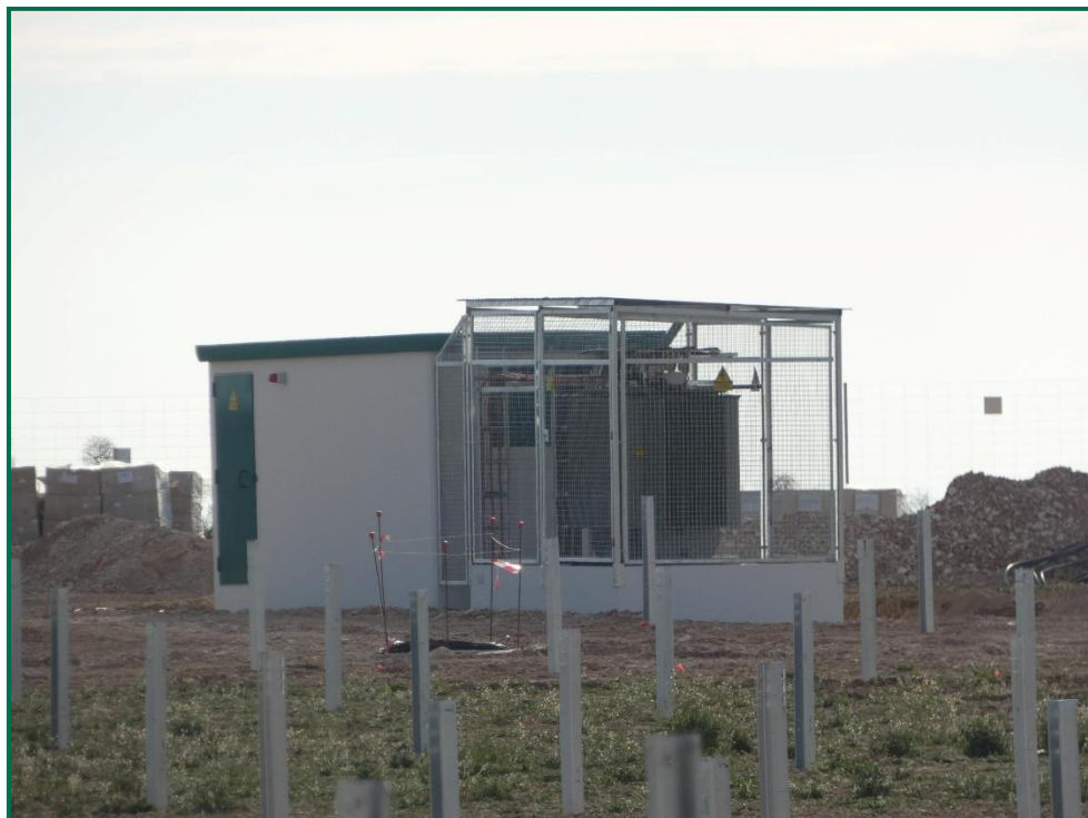
Fotografía 5. Colocación de inversores.