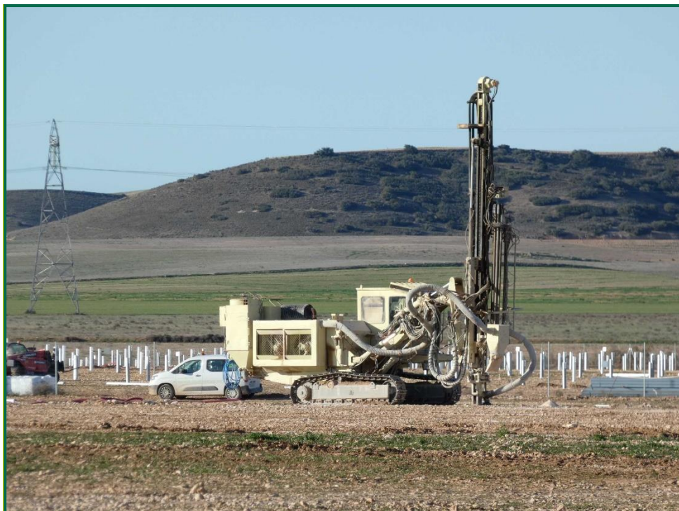
Fotografía 2. Máquina hincapostes.