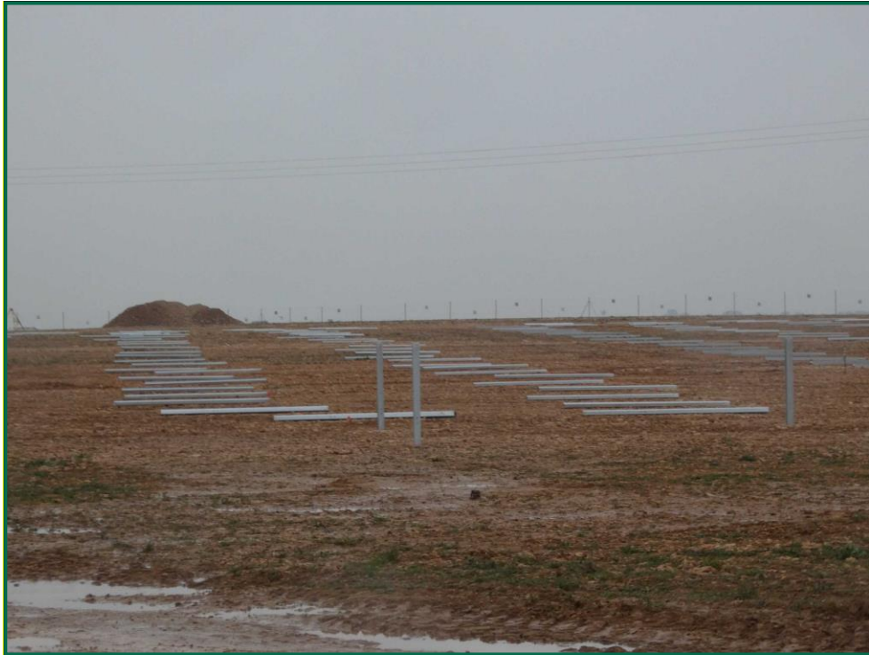
Fotografía 4. Colocación de postes verticales.