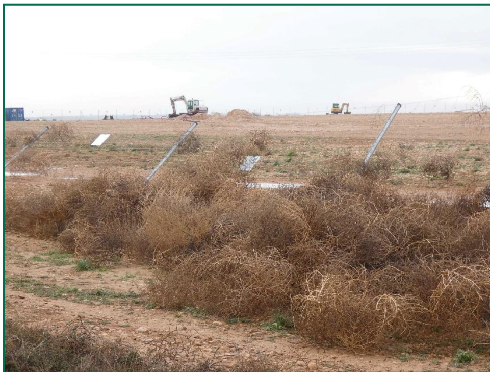
Fotografía 9. Vallado doblado por la acción del viento.