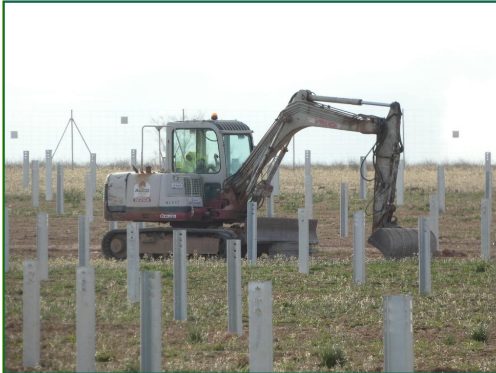
Fotografía 1. Excavadora tapando zanjas.