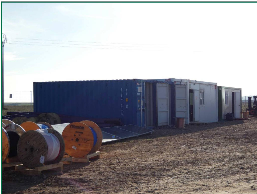
Fotografía 12. Contenedores de gestión.

Se están utilizando grupos electrógenos y se han instalado envases de combustible. Además, se han colocado bandejas de contención debajo de ellos para evitar derrames por pérdidas accidentales sobre el terreno.