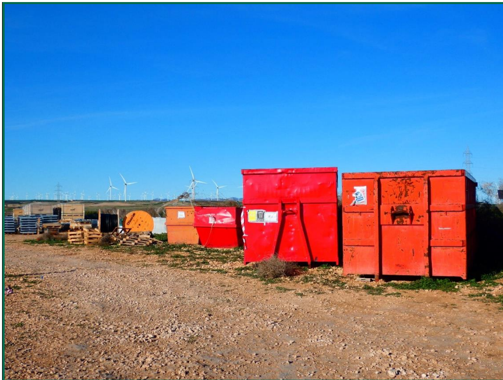
Fotografía 14. Contenedores de residuos.