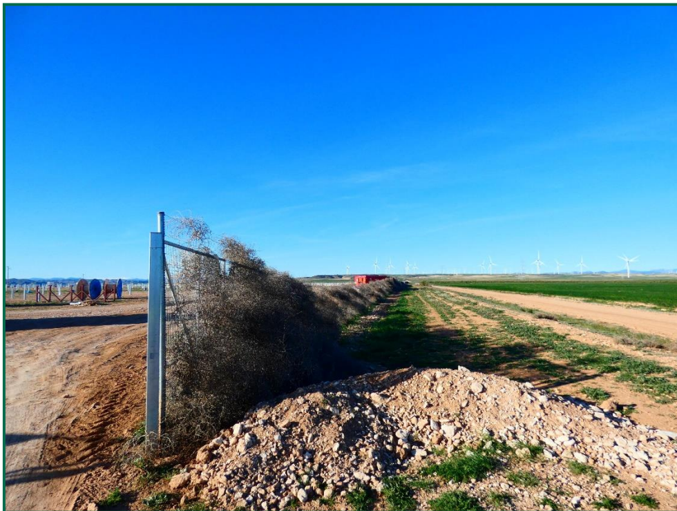
Fotografía 6. Franja vegetal y plantas rodadoras sobre el vallado.

Durante las visitas a obra se comprueba que la ocupación de zonas de vegetación se limita a lo aprobado en el proyecto. Se verifica también que la maquinaria circula únicamente por los viales habilitados para tal fin. Desde el inicio de las obras se ha planificado la ejecución de una franja vegetal de 8 m de anchura en torno al futuro vallado perimetral.