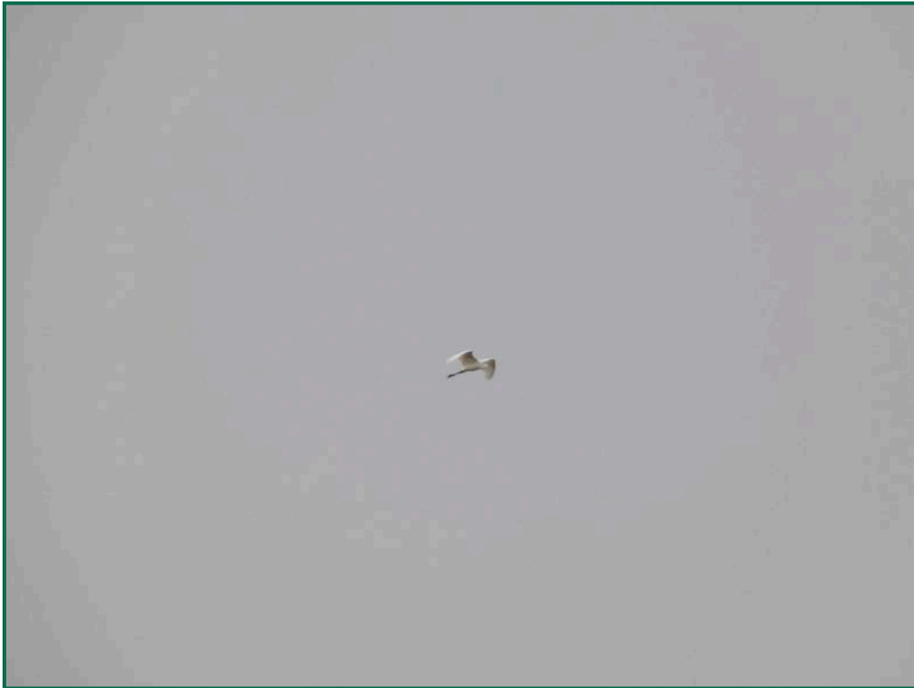
Fotografía 11. Garceta grande ( Ardea alba ).