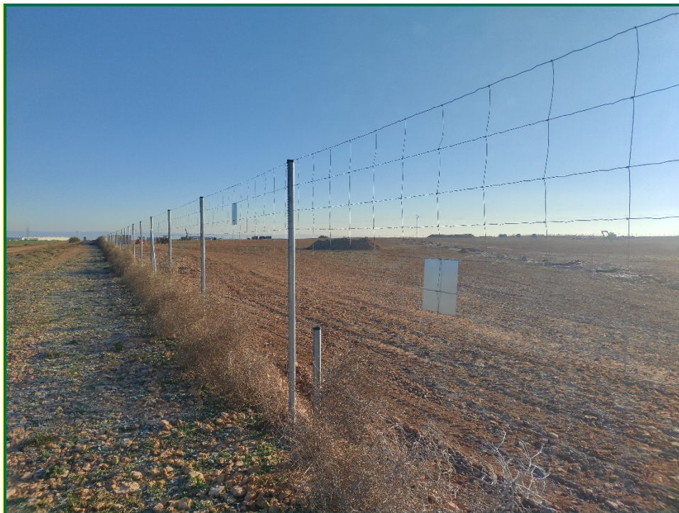
Fotografía 7. Vallado perimetral y placa anticolidión.

El vallado perimetral se ha instalado utilizando malla cinégetica y dejando un espacio de al menos 20 cm desde el suelo. Además se ha dejado un espacio en el vallado para fauna de mayor tamaño. Por otro lado, se han instalado las placas anticolidión a diferentes alturas sobre la malla.