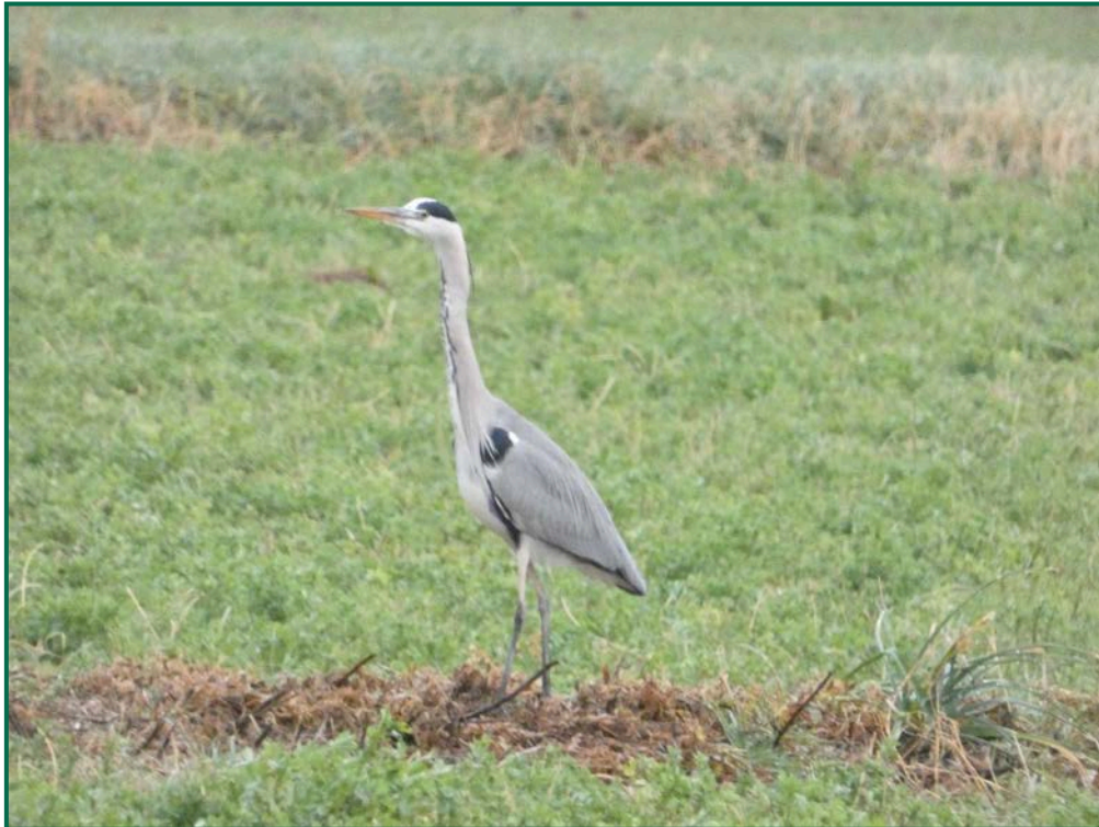
Fotografía 9. Garza real ( Ardea cinerea ).