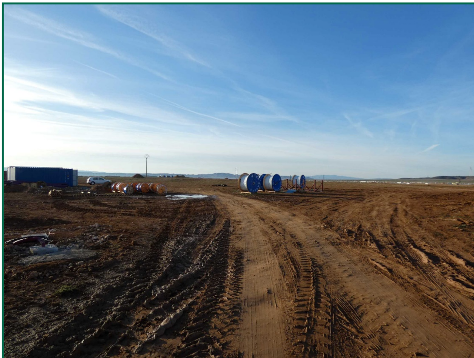
Fotografía 6. Entrada a la planta.