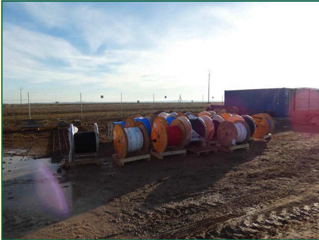
Fotografía 14. Bobinas de cable.