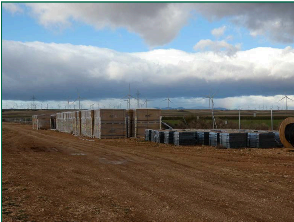
Fotografía 15. Materiales de obra.