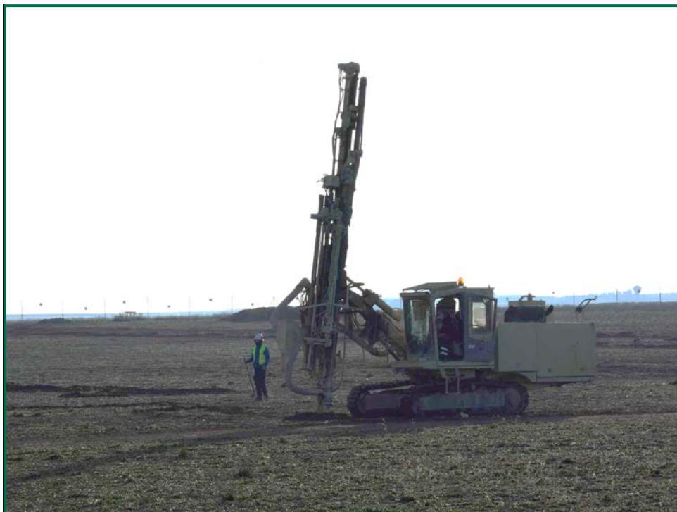
Fotografía 2. Máquina hincapostes.