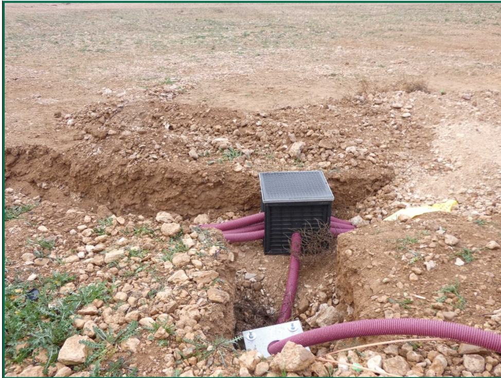
Fotografía 4. Colocación de cableado.