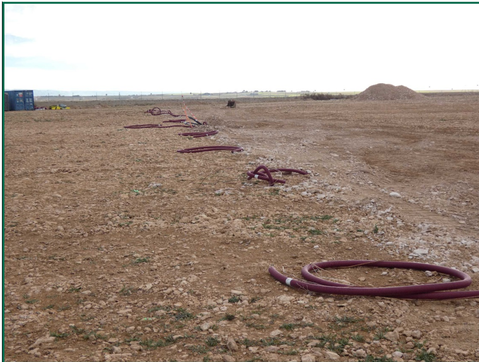
Fotografía 3. Tapado de zanjas.

Por el momento la tierra vegetal extraída ha sido escasa debido a que no ha sido necesario nivelar todo el terreno, únicamente algunas zonas y con un espesor limitado, y esta se ha ido extendiendo sobre el terreno. La tierra extraída para la construcción de balsas de limpieza se ha acopiado en caballones al igual que la tierra retirada para realizar zanjas. En las zonas donde se van a realizar plantaciones para crear una patalla vegetal no se ha realizado ningún movimiento de tierra, conservando la capa de tierra vegetal presente.