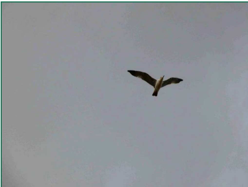
Fotografía 12. Gaviota patiamarilla ( Larus michaellis ).