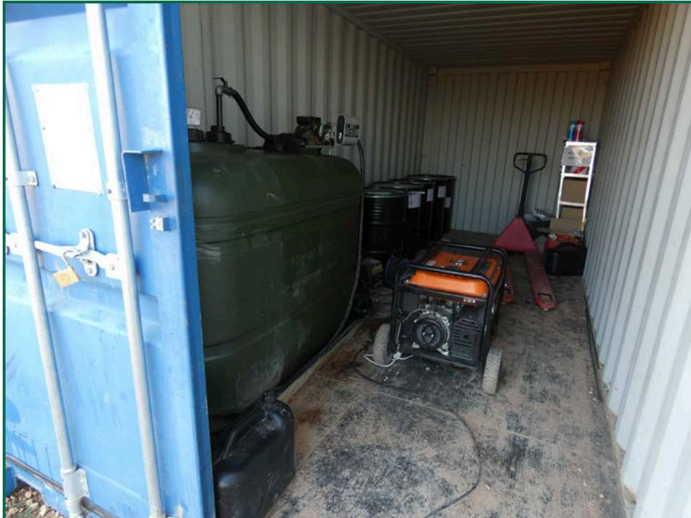
Fotografía 17. Envase de combustible y punto limpio.