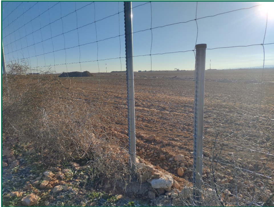
Fotografía 8. Espaciado cinegético.

Se ha realizado seguimiento de avifauna durante el proceso de la obra en el mes de septiembre, y se han avistado las siguientes especies: busardo ratonero ( Buteo buteo ), milano real ( Milvus milvus ), cuervo grande ( Corvus corax ), garza real ( Ardea cinerea ), garceta grande ( Ardea alba ) y gaviota patiamarilla ( Larus michaellis ).