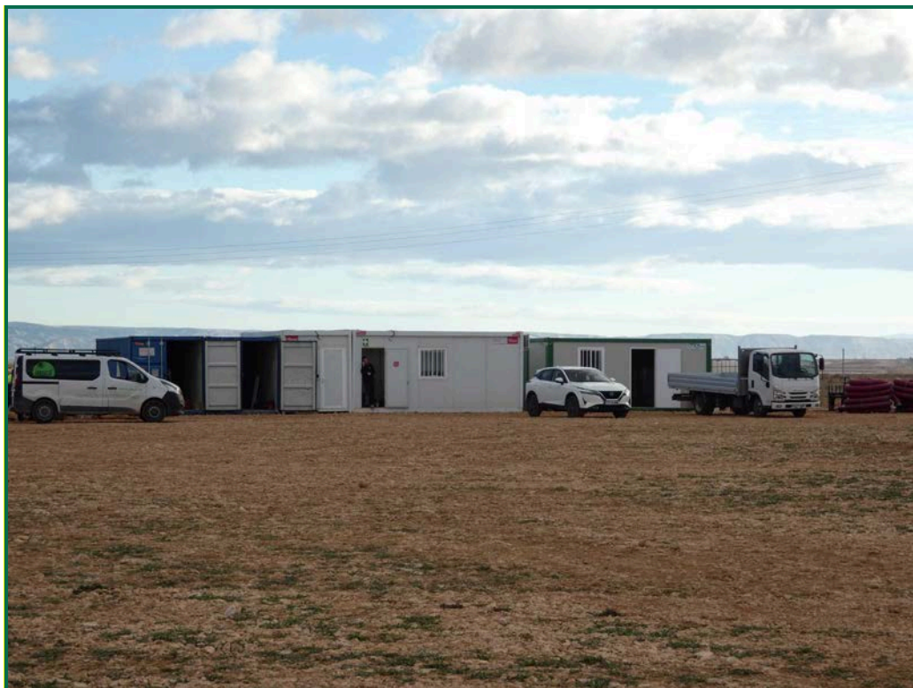
Fotografía 13. Contenedores de gestión.

Se están utilizando grupos electrógenos y se han instalado envases de combustible. Además, se han colocado bandejas de contención debajo de ellos para evitar derrames por pérdidas accidentales sobre el terreno.