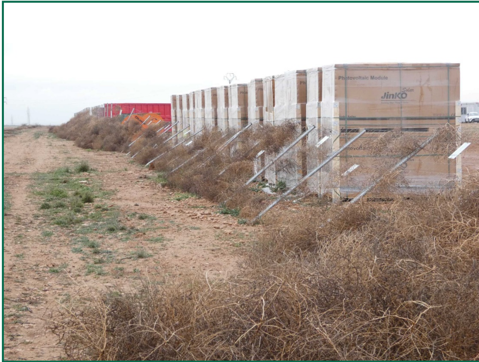
Fotografía 5. Franja vegetal.