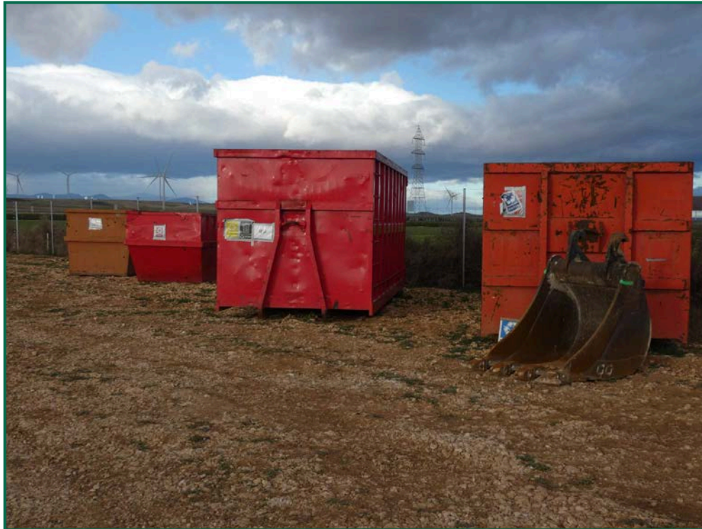
Fotografía 16. Contenedores de residuos.