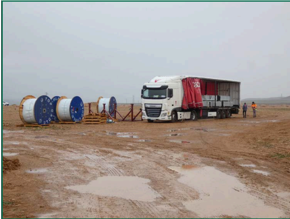
Fotografía 1. Transporte de materiales.