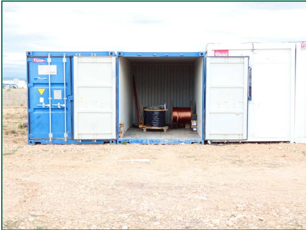
Fotografía 22. Materiales de obra.