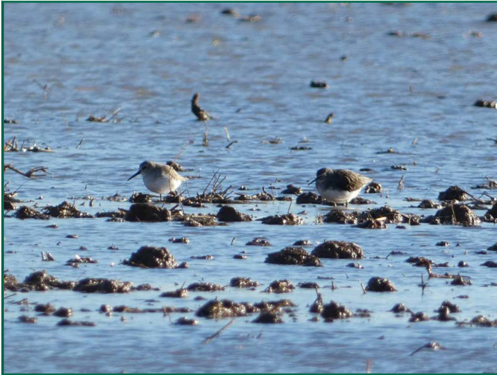
Fotografía 15. Andarrios grande ( Tringa achropus ).