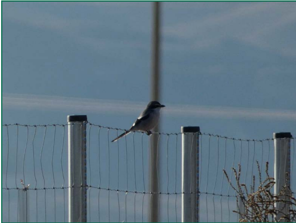
Fotografía 13. Alcaudón real ( Lanius meridionalis ).