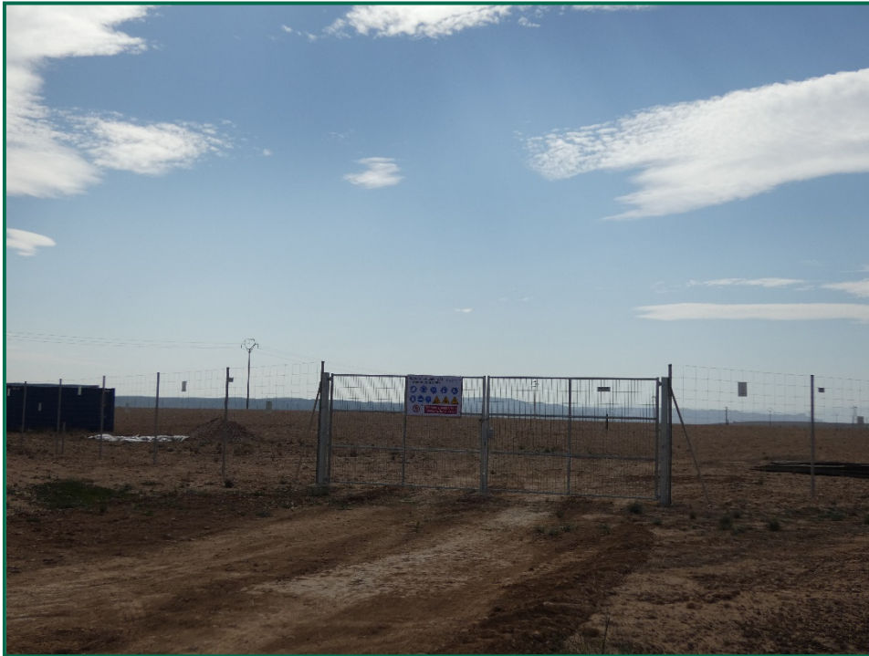
Fotografía 6. Vallado perimetral y placa anticollisión.