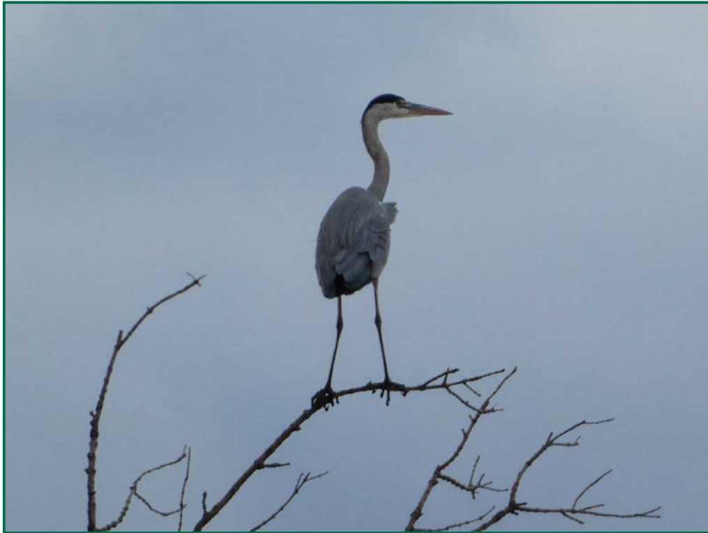
Fotografía 17. Garza real ( Ardea cinerea ).