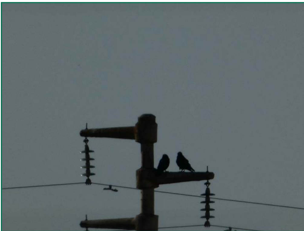
Fotografía 12. Cuervo grande ( Corvus corax ).