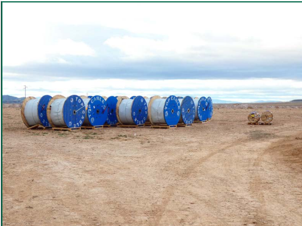
Fotografía 21. Bobinas de cable.