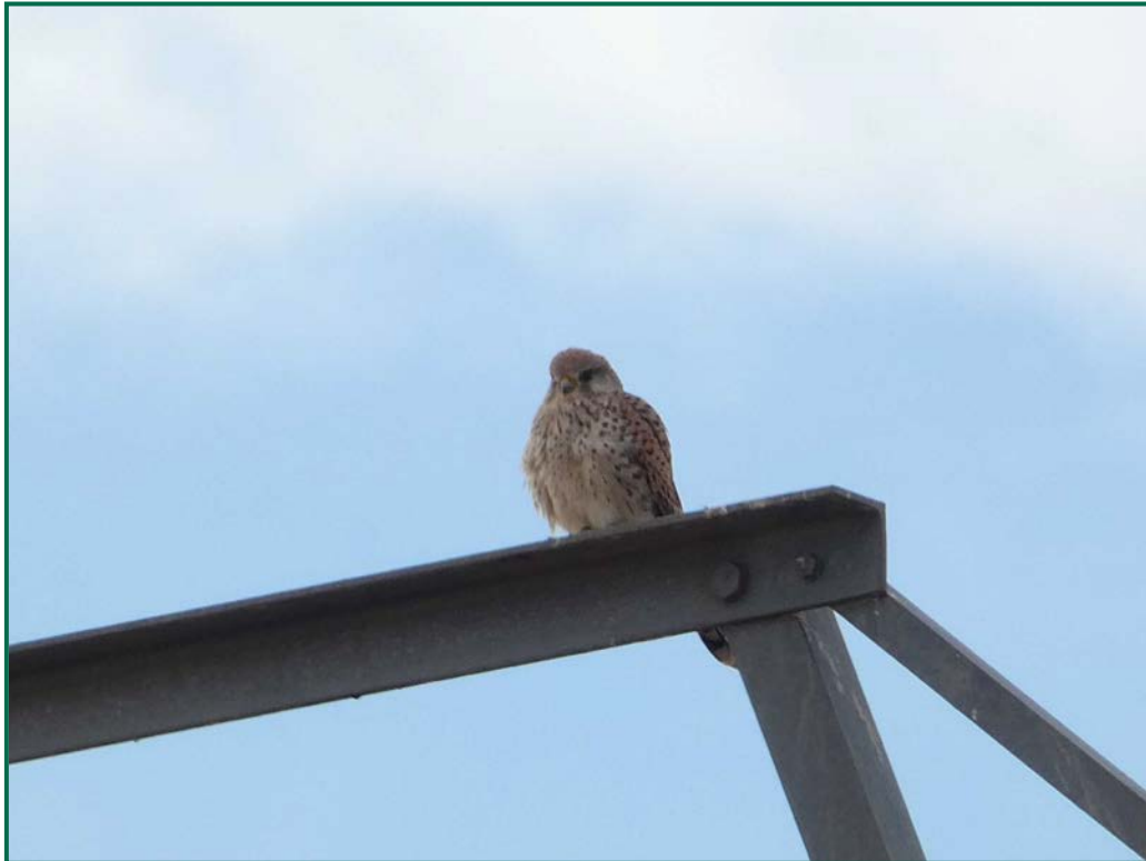
Fotografía 9. Cernícalo vulgar ( Falco tinnunculus ).