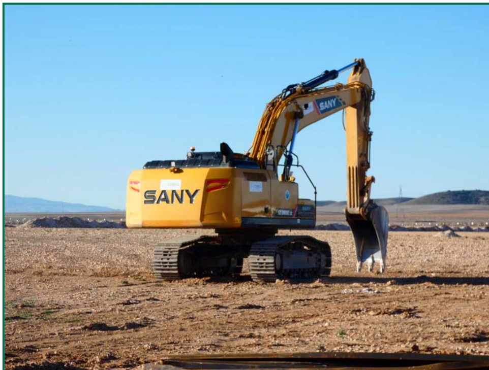
Fotografía 2. Maquinaria de construcción.

Durante las visitas a obra no se constata afección por emisión de polvo significativa durante los trabajos. Se prevé humedecer los caminos cuando las circunstancias lo requieran con la presencia de una cuba esparciendo agua por el terreno.