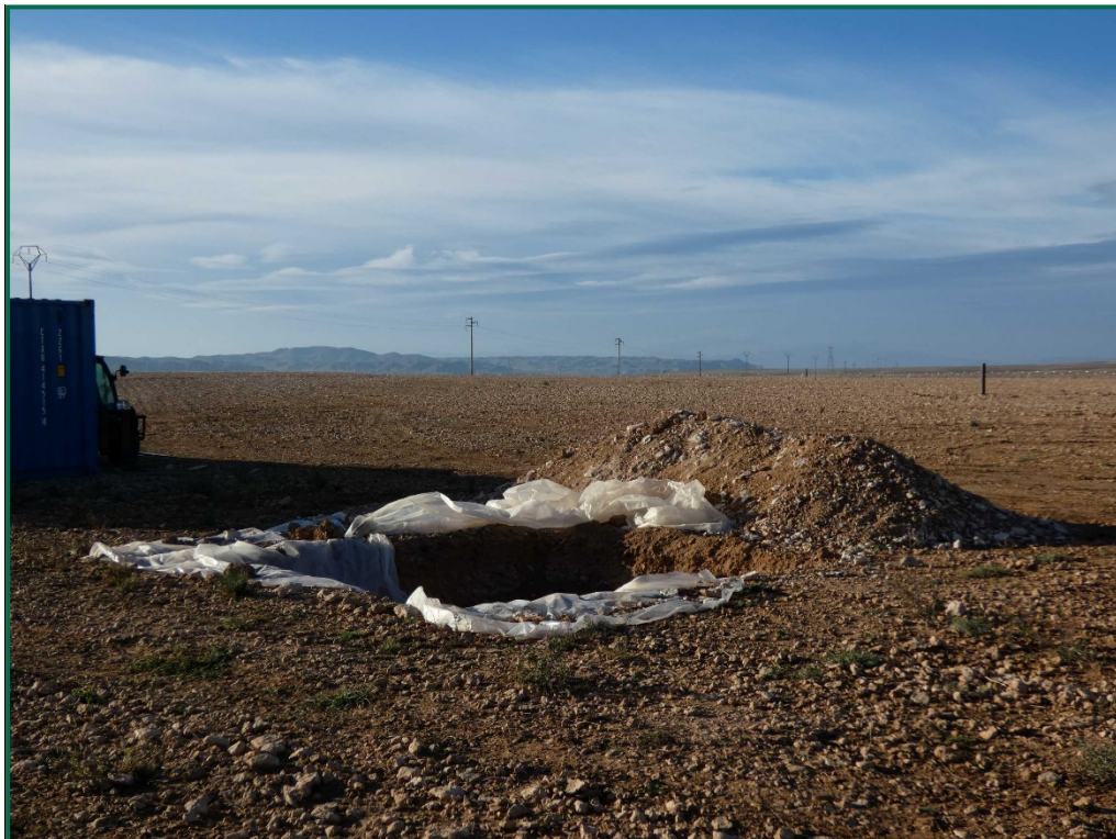
Fotografía 19. Balsa de limpieza.

Todavía no se han utilizado grupos electrógenos ni se han instalado envases de combustible, cuando se comiencen a utilizar se colocarán bandejas de contención debajo de ellos para evitar derrames por pérdidas accidentales sobre el terreno.