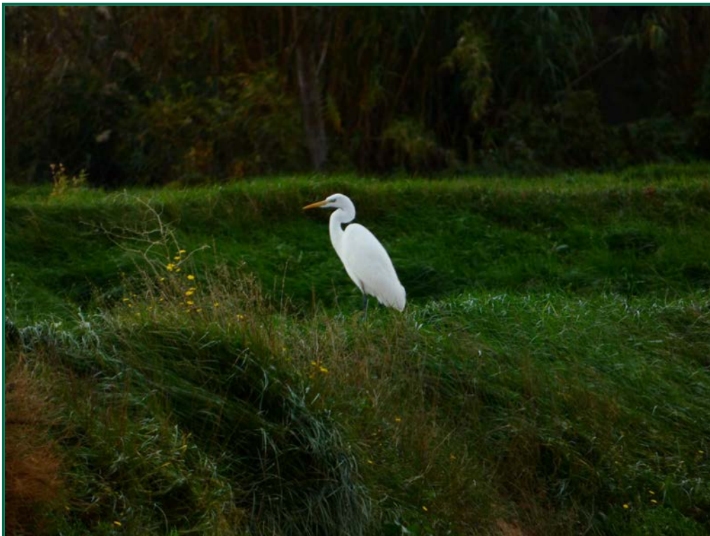
Fotografía 18. Garceta grande ( Ardea alba ).