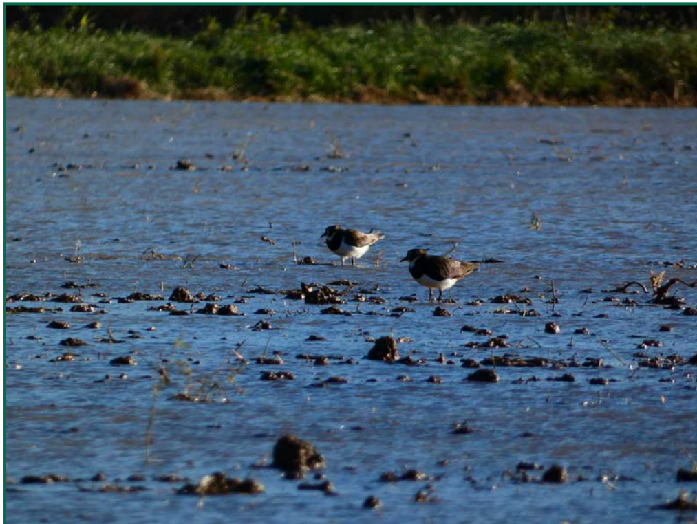
Fotografía 16. Avefría europea ( Vanellus vanellus ).