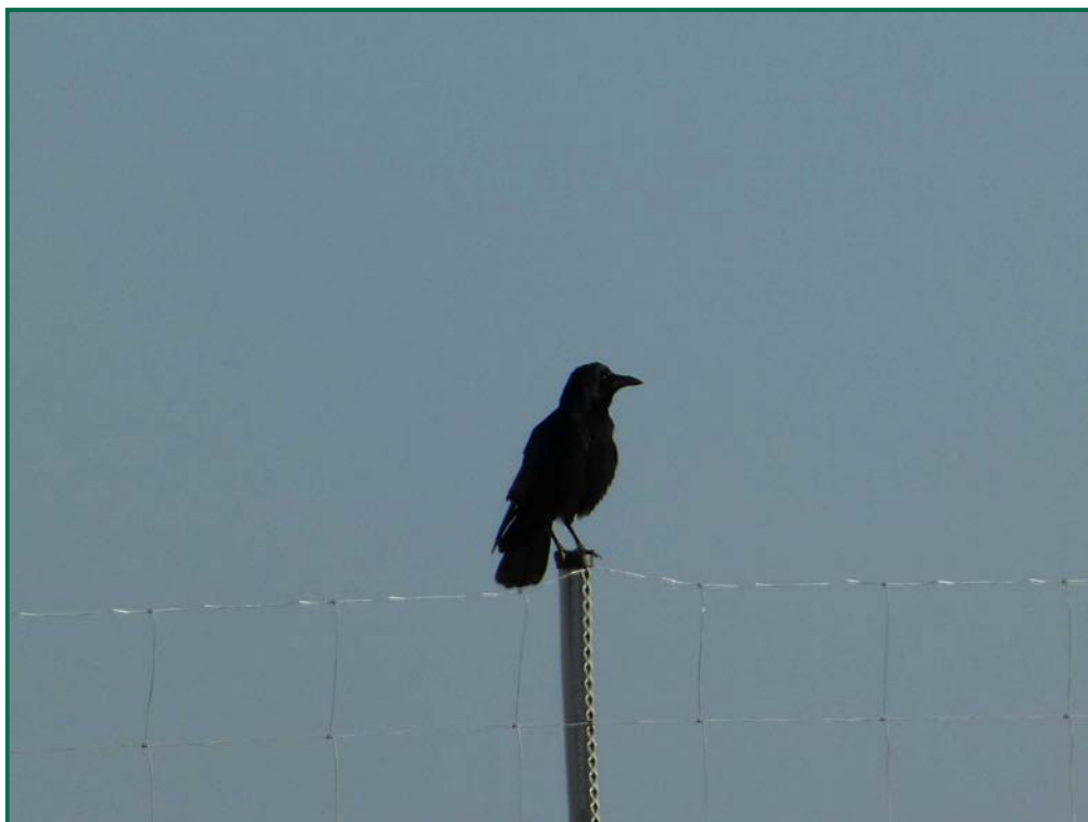
Fotografía 10. Corneja negra ( Corvus corone ).