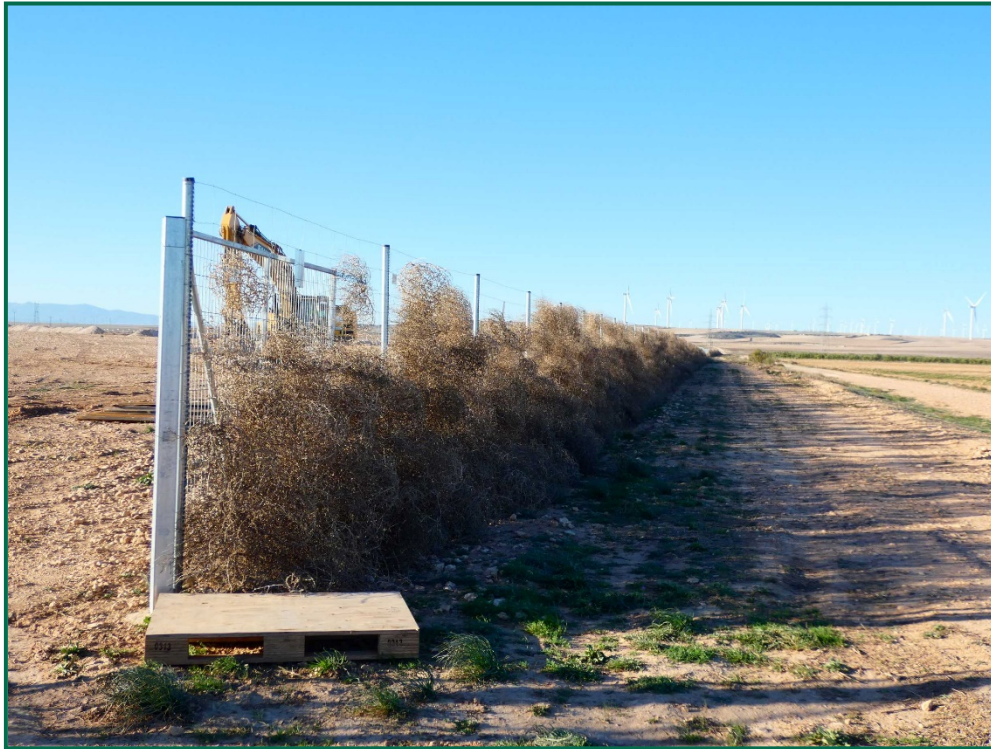
Fotografía 5. Franja vegetal.