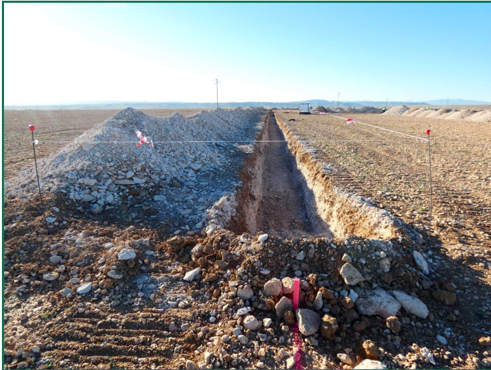
Fotografía 4. Zanjas.