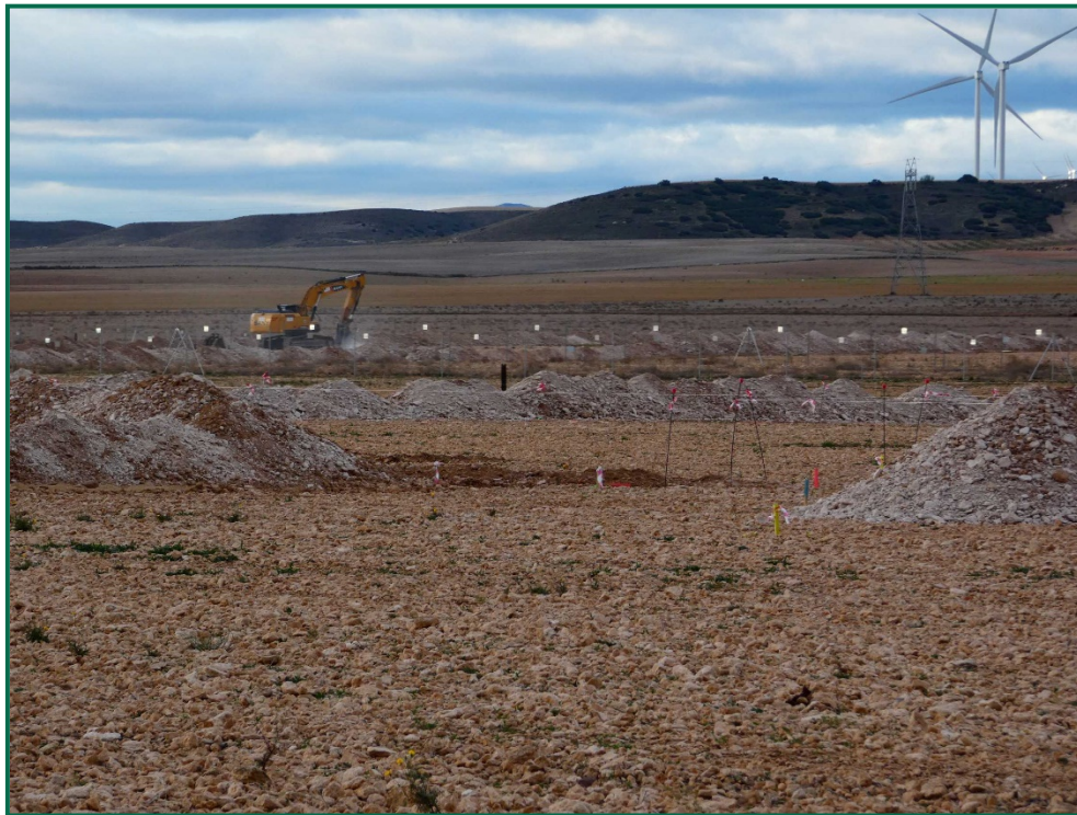
Fotografía 3. Acopios de tierra.

Por el momento la tierra vegetal extraída ha sido escasa debido a que no ha sido necesario nivelar todo el terreno, únicamente algunas zonas y con un espesor limitado, y esta se ha ido extendiendo sobre el terreno. La tierra extraída para la construcción de balsas de limpieza se ha acopiado en caballones al igual que la tierra retirada para realizar zanjas. En las zonas donde se van a realizar plantaciones para crear una patalla vegetal no se ha realizado ningún movimiento de tierra, conservando la capa de tierra vegetal presente.