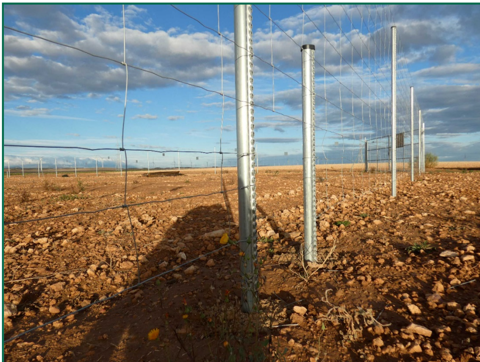
Fotografía 7. Espaciado cinegético.