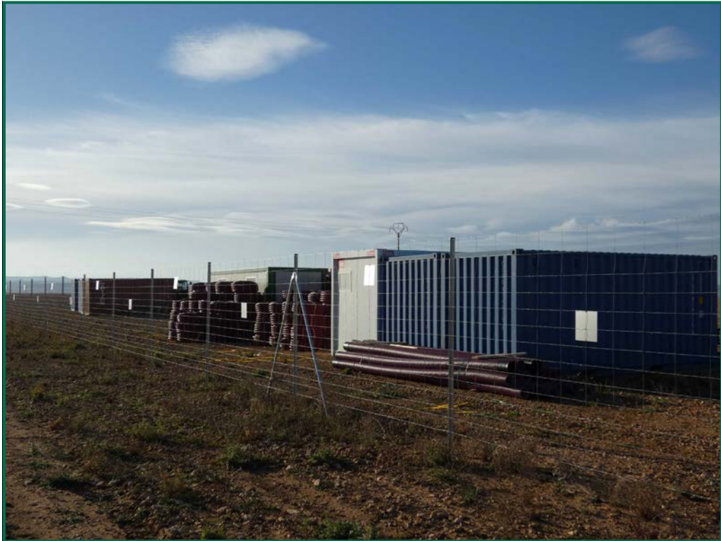
Fotografía 20. Contenedores de gestión y materiales.