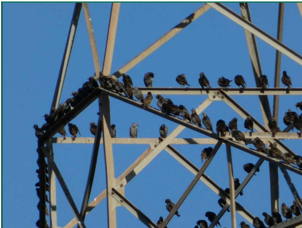
Fotografía 14. Estornino negro ( Sturnus unicolor ).