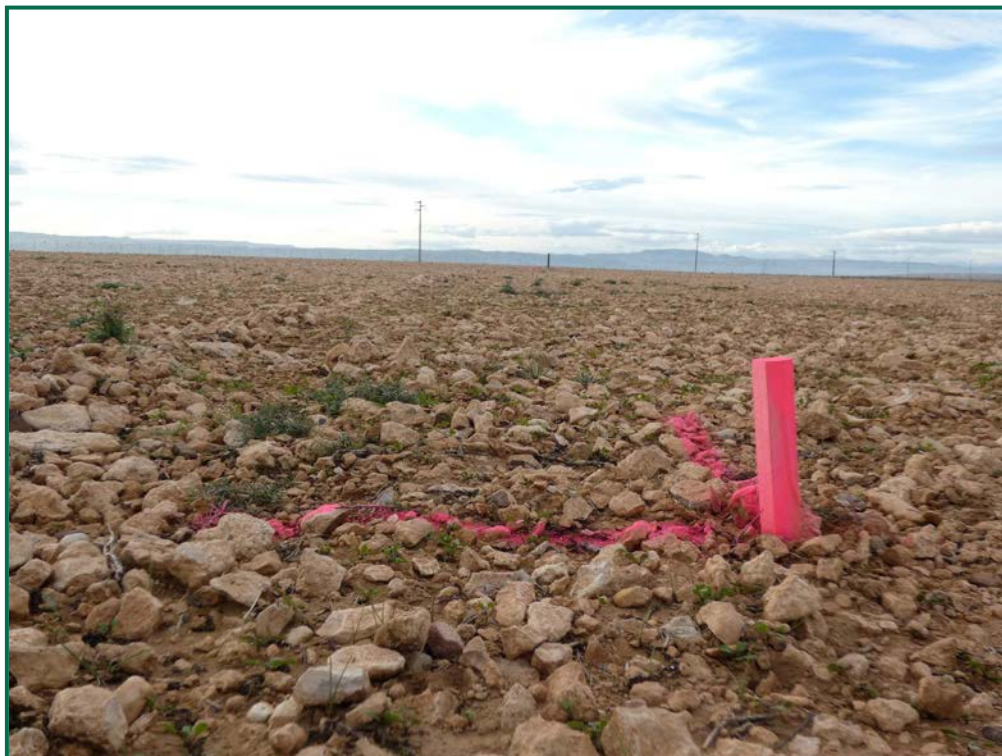
Fotografía 1. Balizamiento para las zanjas.

No se realiza el balizamiento de todo el perímetro de la obra ya que se generaría una gran cantidad de residuos de malla de obra o cinta que tiende a romperse y dispersarse por toda la zona. Sí se realiza un jalonamiento del perímetro mediante banderines. La Dirección Ambiental realiza un control visual continuado para comprobar que no se sobrepasan los límites de la zona de ocupación.