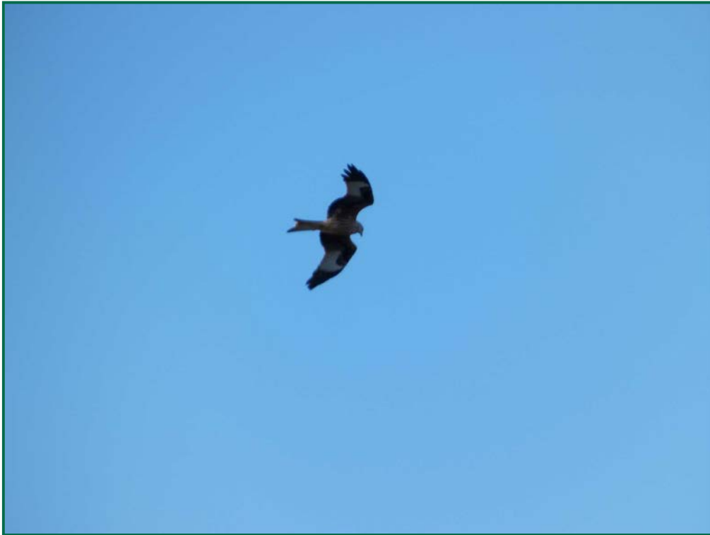
Fotografía 11. Milano real ( Milvus milvus ).