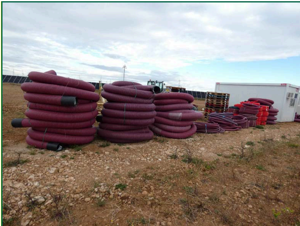
Fotografía 15. Materiales de obra.