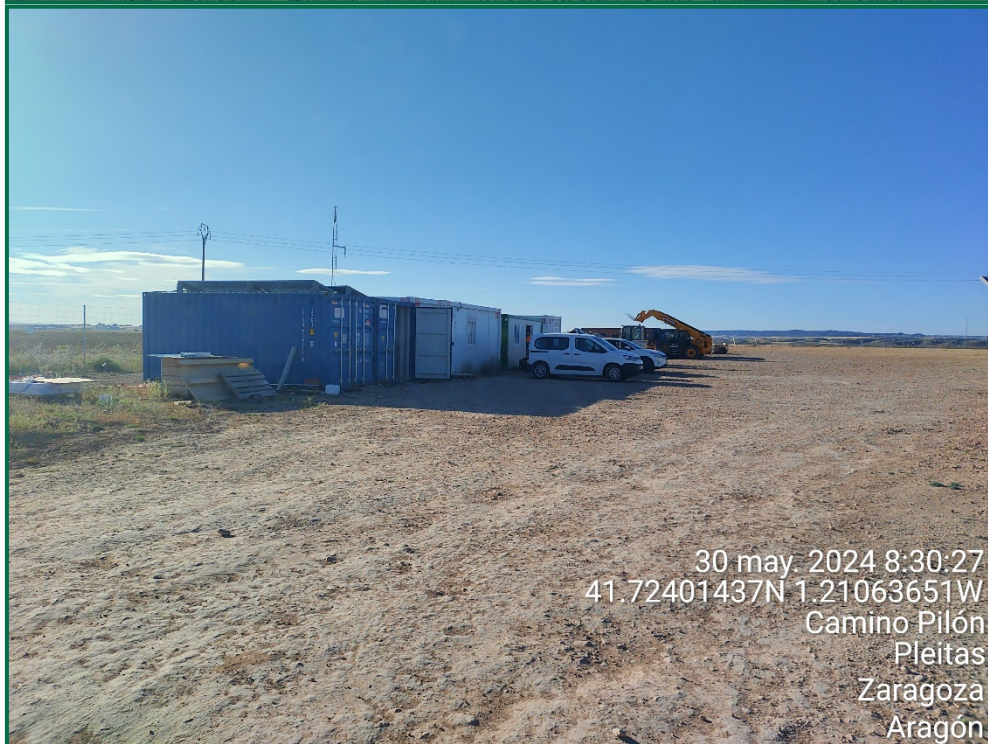
Fotografía 6. Casetas de gestión y contenedores de almacenaje.