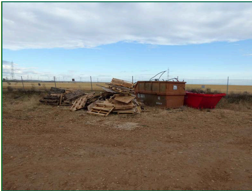
Fotografía 13. Contenedores de residuos.