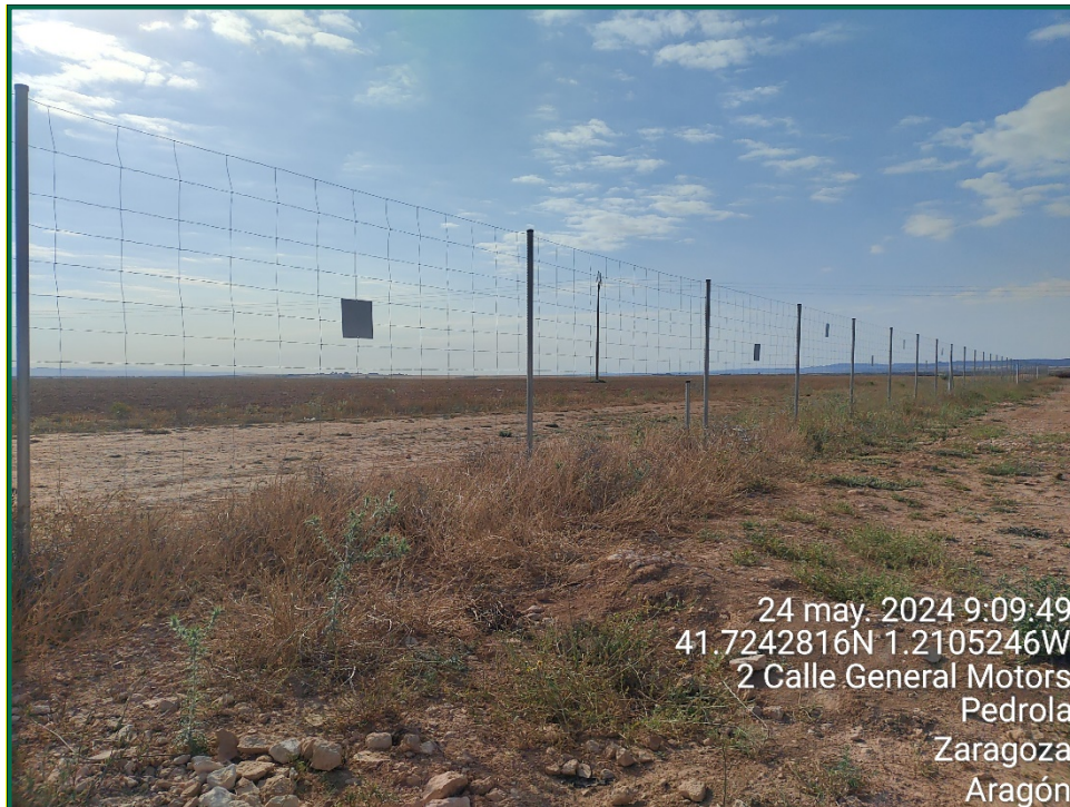
Fotografía 9. Vallado perimetral y placa anticolidión.