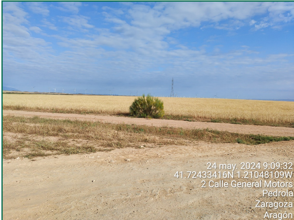
Fotografía 8. Vegetación natural y cultivos próximos.