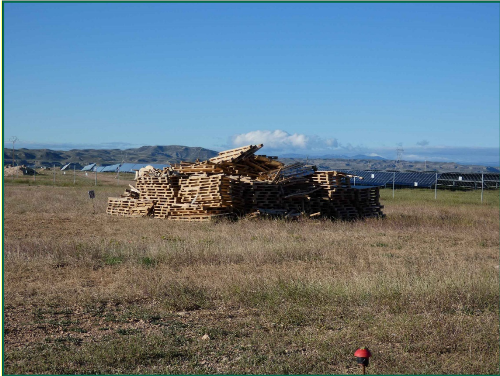
Fotografía 14. Recogida de palets.