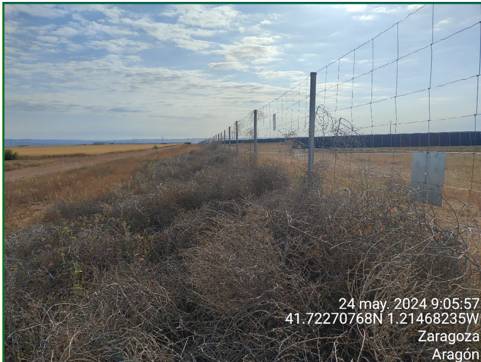
Fotografía 7. Franja vegetal y plantas rodadoras sobre el vallado tumbado.

Durante las visitas a obra se comprueba que la ocupación de zonas de vegetación se limita a lo aprobado en el proyecto. Se verifica también que la maquinaria circula únicamente por los viales habilitados para tal fin. Desde el inicio de las obras se ha planificado la ejecución de una franja vegetal de 8 m de anchura en torno al futuro vallado perimetral.