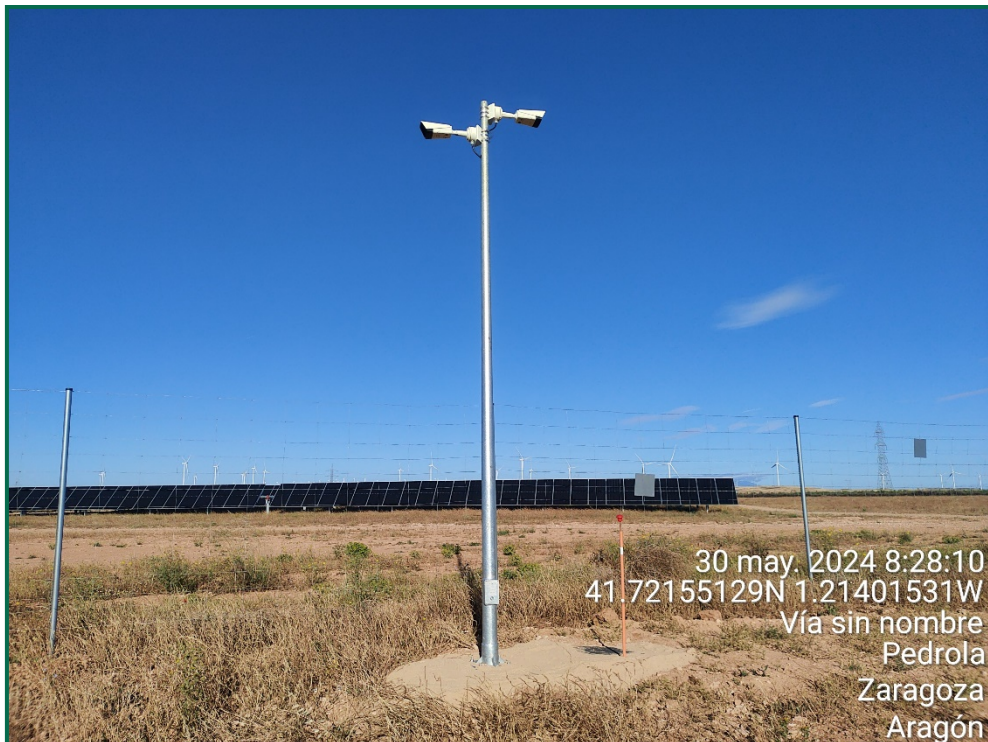
Fotografía 5. Cámara de vigilancia.