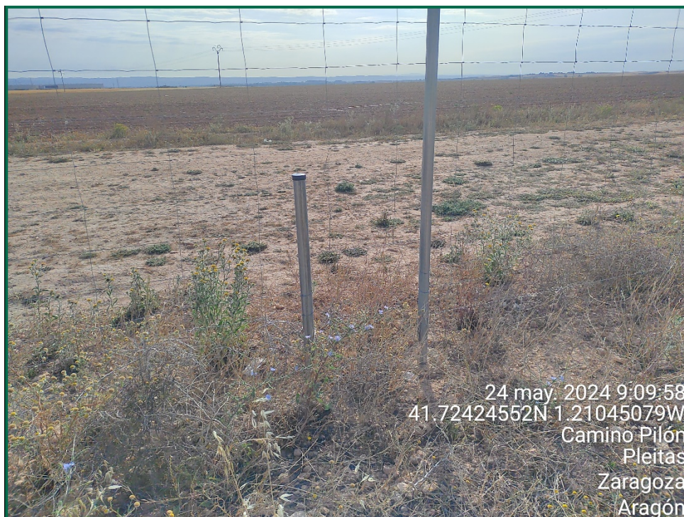
Fotografía 10. Espaciado cinético.