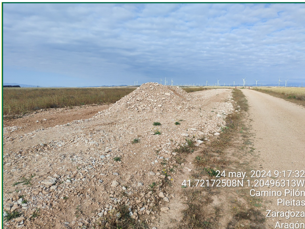
Fotografía 17. Acopios de tierra.

Durante este mes se ha finalizado la construcción de la línea de evacuación, la cual está soterrada. Se ha procedido a balizar la vegetación natural colindante, los caminos próximos a las zanjas y los materiales que se encuentren sobre campos de cultivo. Para su construcción se han realizado zanjas, se ha colocado el cableado y posteriormente se han tapado dichas zanjas.