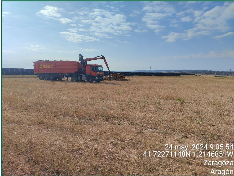
Fotografía 1. Maquinaria recogiendo palets.