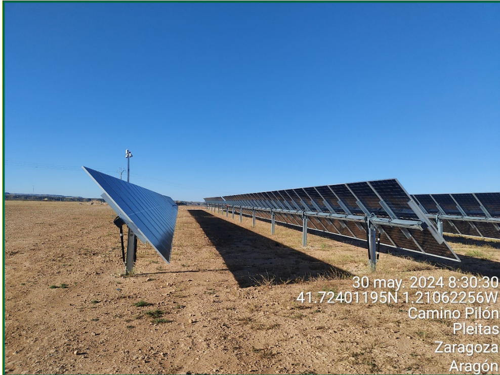
Fotografía 4. Placas fotovoltaicas.