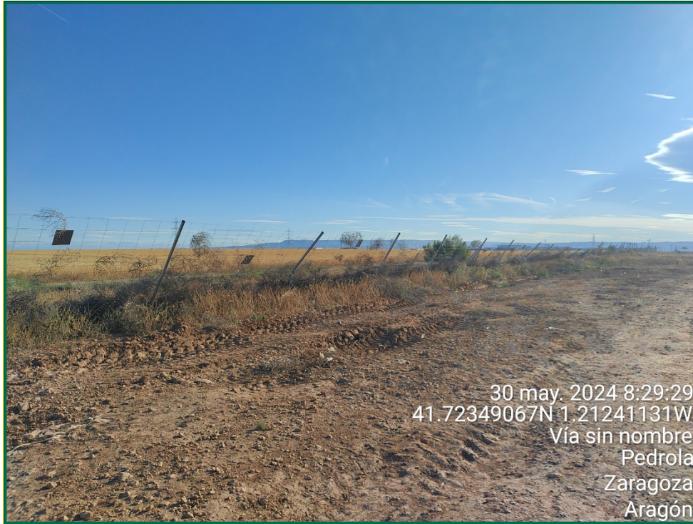
Fotografía 11. Vallado doblado por la acción del viento.

Se ha realizado seguimiento de avifauna durante el proceso de la obra en el mes de septiembre, y se han avistado las siguientes especies: cuervo grande ( Corvus corax ), corneja negra ( Corvus corone ), milano negro ( Milvus migrans ) y chova piquirroja ( Pyrrhocorax pyrrhocorax ). Además de otras especies de menor embergadura como pueden ser calandria común ( Melanocorypha calandra ), cogujada montesina ( Galerida teklae ), alcaudón real ( Lanius meridionalis ), estornino negro ( Sturnus unicolor ) o pardillo común ( Linaria cannabina ).