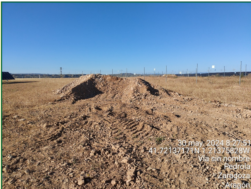
Fotografía 3. Acopio de tierra.

Por el momento la tierra vegetal extraída ha sido escasa debido a que no ha sido necesario nivelar todo el terreno, únicamente algunas zonas y con un espesor limitado, y esta se ha ido extendiendo sobre el terreno. La tierra extraída para la construcción de balsas de limpieza se ha acopiado en caballones al igual que la tierra retirada para realizar zanjas. En las zonas donde se van a realizar plantaciones para crear una patalla vegetal no se ha realizado ningún movimiento de tierra, conservando la capa de tierra vegetal presente.