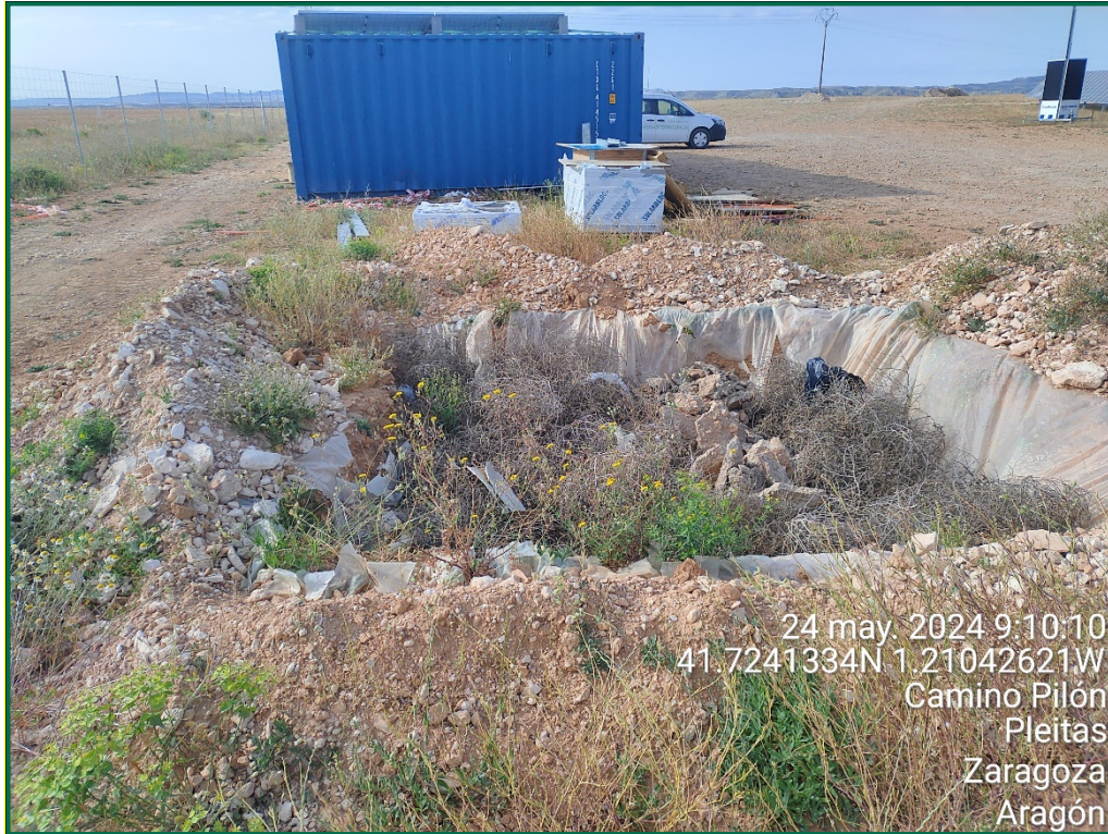
Fotografía 12. Balsa de limpieza.