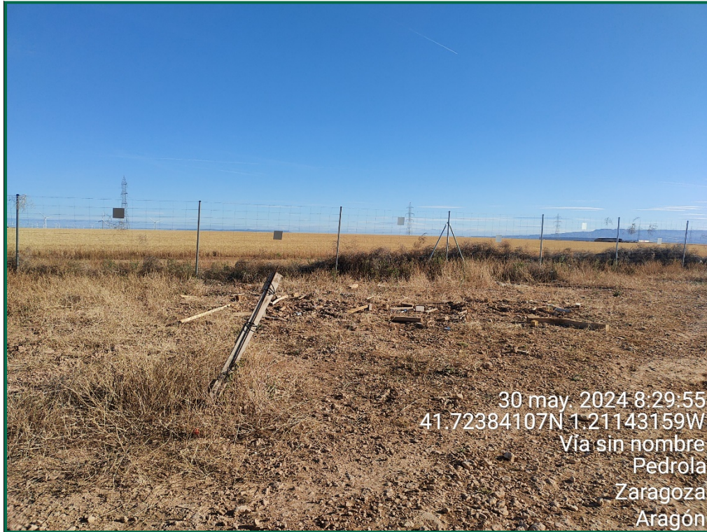
Fotografía 16. Restos de maderas tras su recogida.