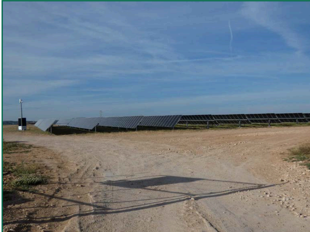
Fotografía 2. Superficie de la obra.