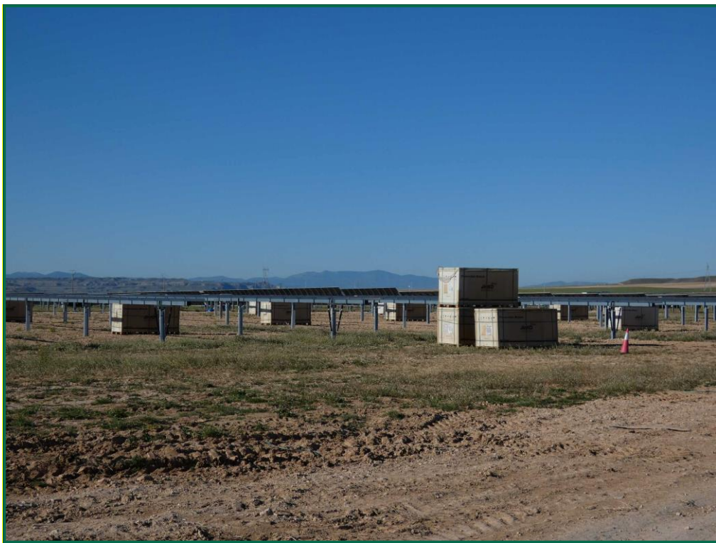
Fotografía 13. Materiales de obra.