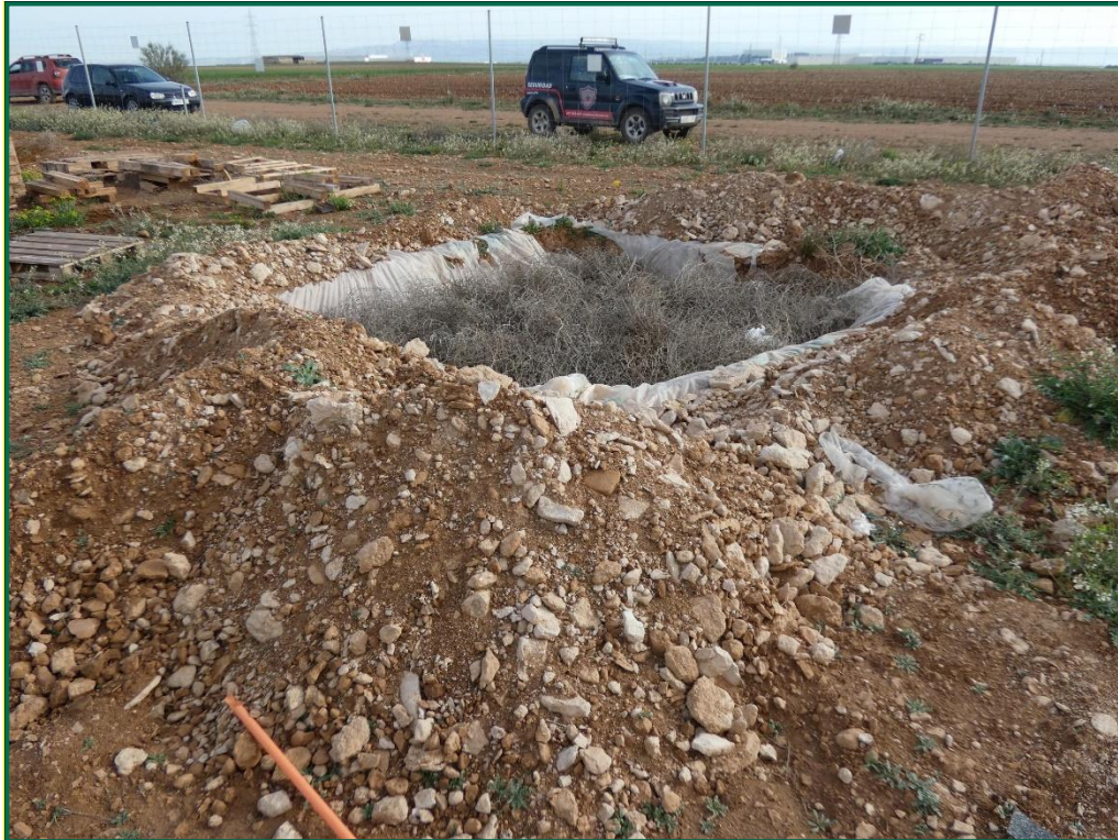
Fotografía 10. Balsa de limpieza.