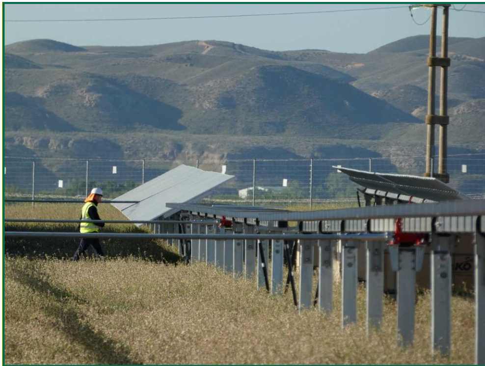
Fotografía 3. Colocación de placas fotovoltaicas