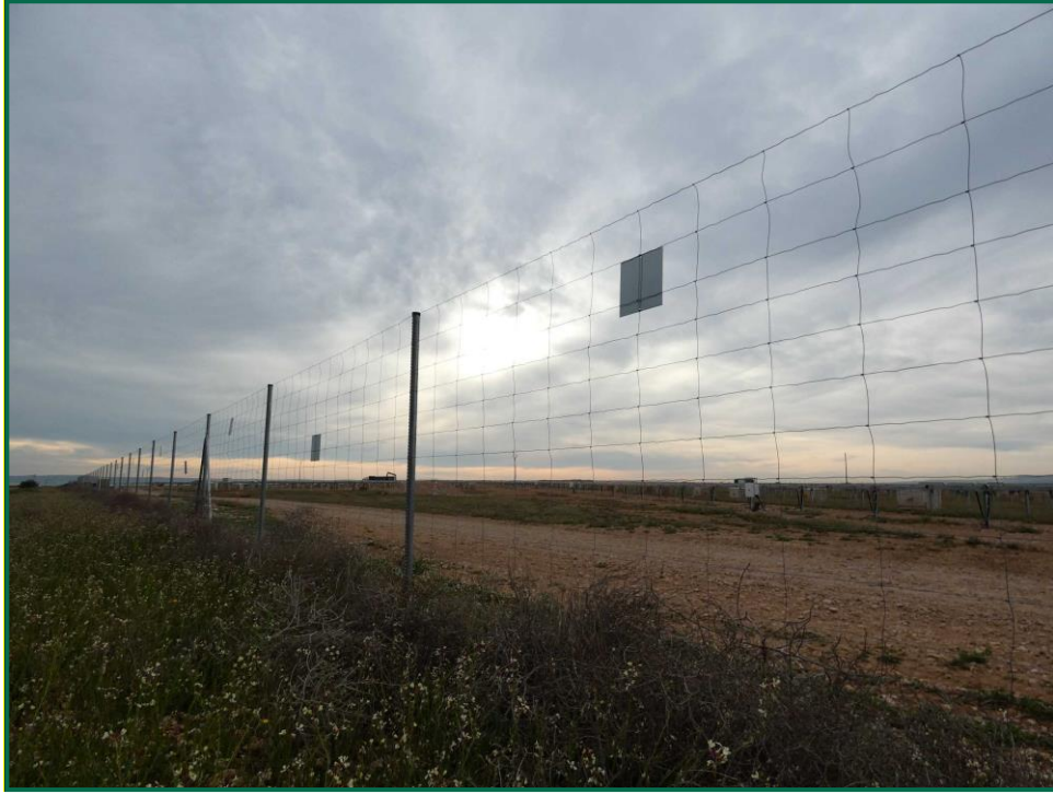
Fotografía 6. Vallado perimetral y placa anticollisión.