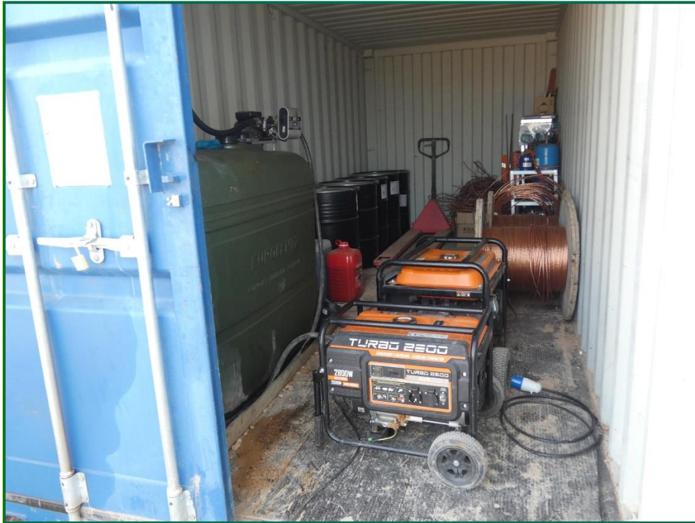
Fotografía 12. Envase de combustible y punto limpio.