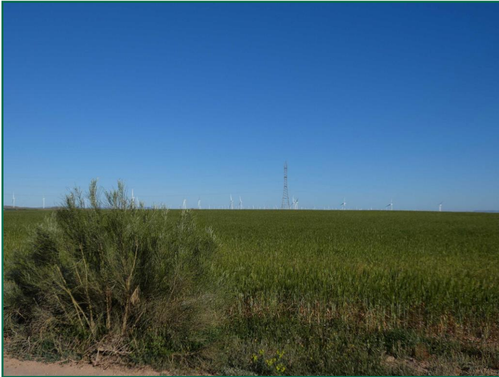
Fotografía 5. Vegetación natural y cultivos próximos.