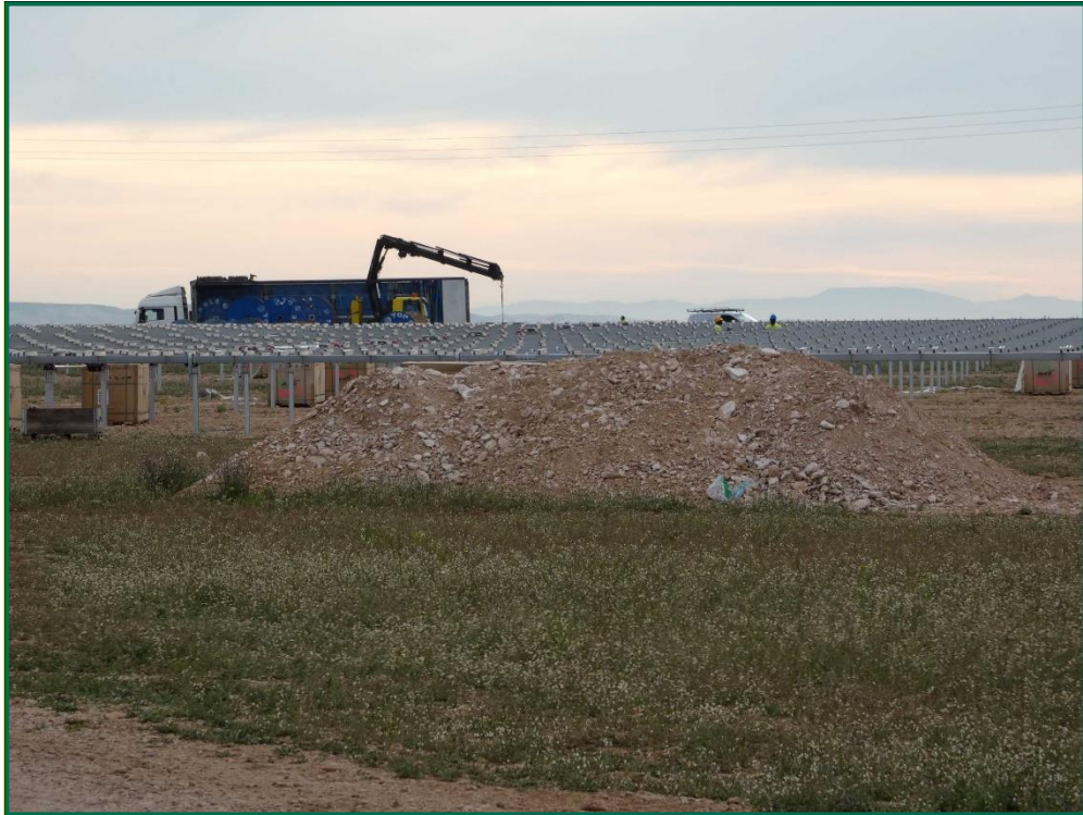
Fotografía 2. Acopio de tierra.