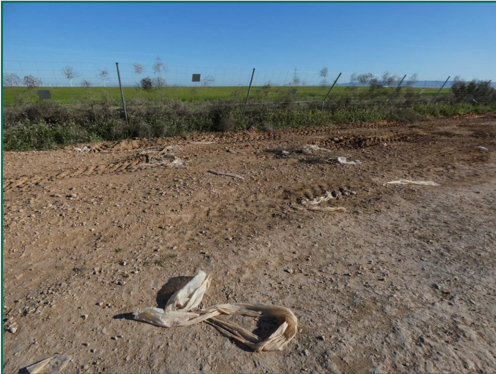
Fotografía 14. Restos de embalaje.