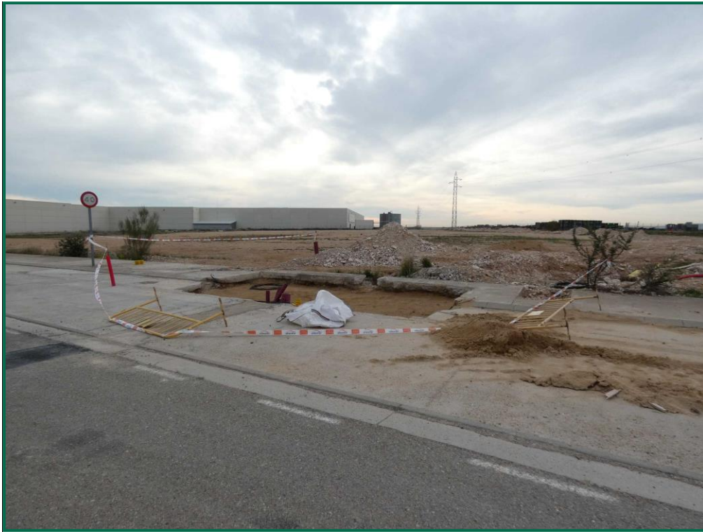
Fotografía 16. Balizamiento de la zanja.