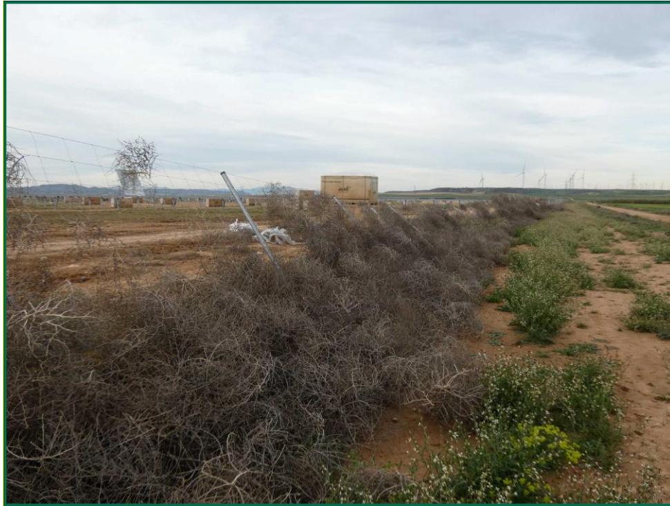
Fotografía 8. Vallado doblado por la acción del viento.