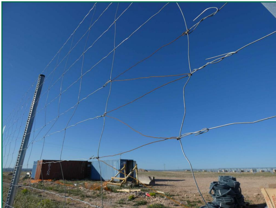
Fotografía 9. Vallado cortado tras robo.