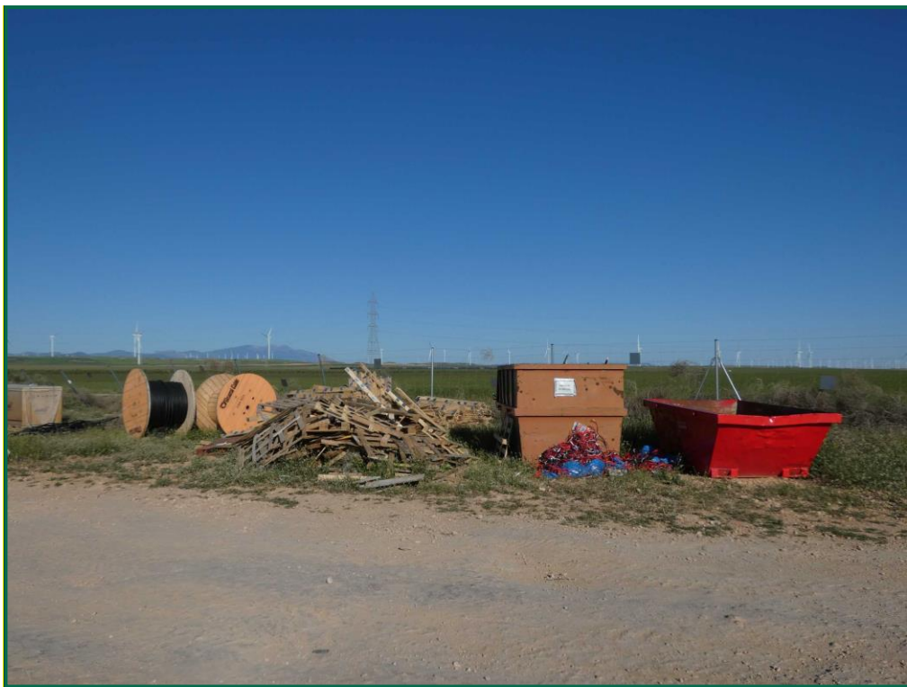
Fotografía 11. Contenedores de residuos.