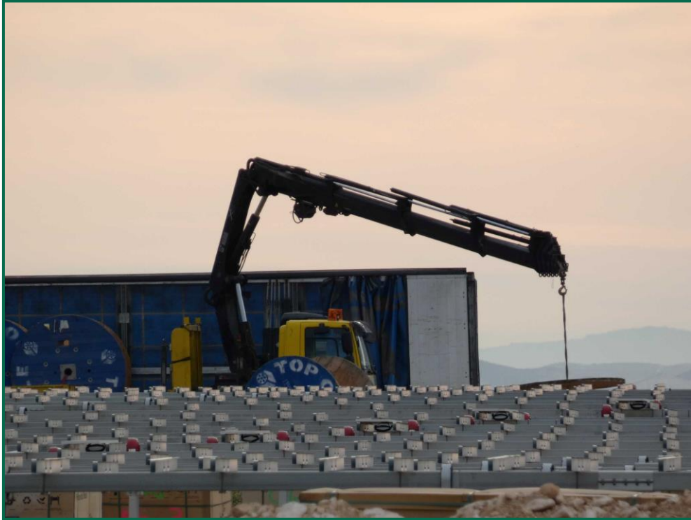
Fotografía 1. Maquinaria descargando material.