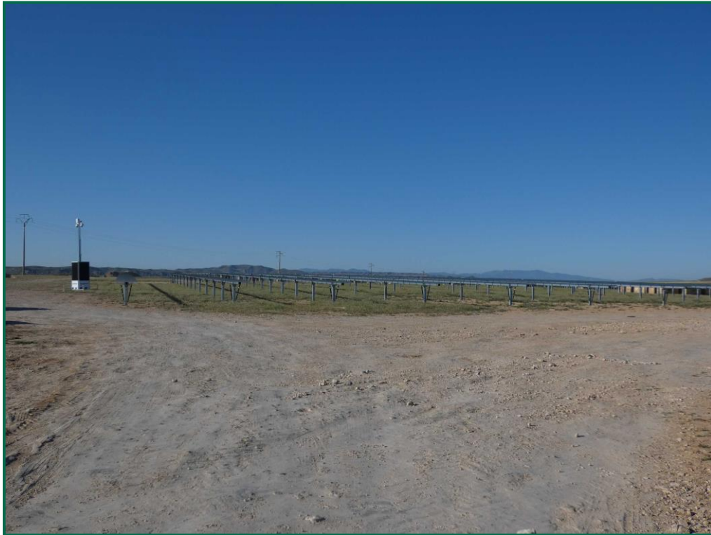
Fotografía 15. Superficie de la obra.