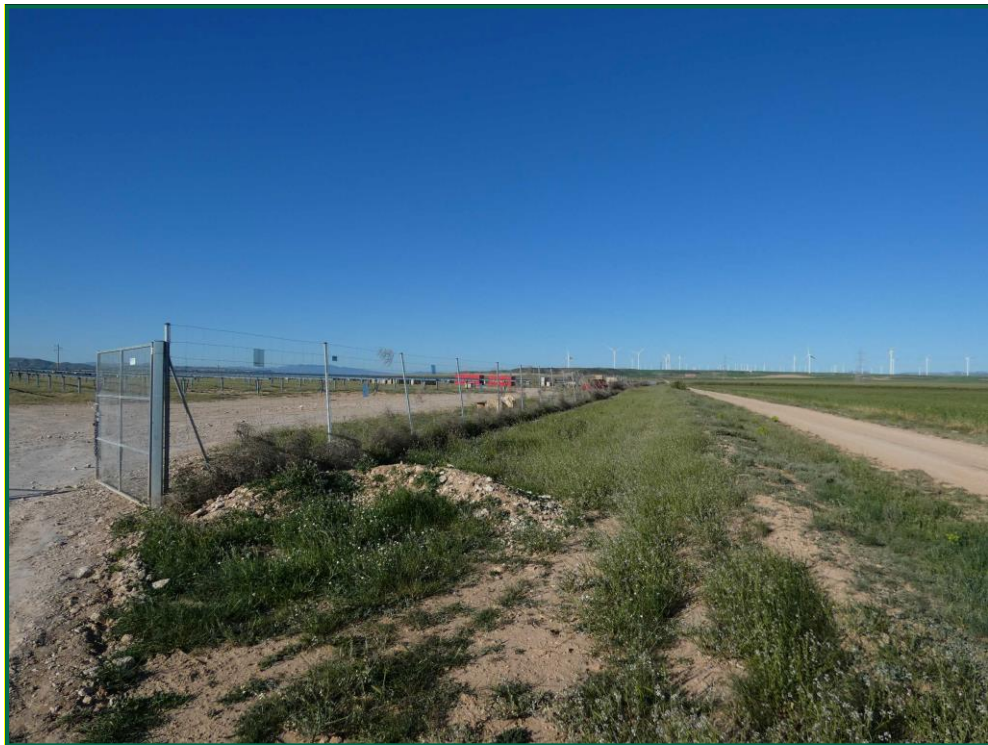
Fotografía 4. Franja vegetal y plantas rodadoras sobre el vallado tumbado.

Durante las visitas a obra se comprueba que la ocupación de zonas de vegetación se limita a lo aprobado en el proyecto. Se verifica también que la maquinaria circula únicamente por los viales habilitados para tal fin. Desde el inicio de las obras se ha planificado la ejecución de una franja vegetal de 8 m de anchura en torno al futuro vallado perimetral.