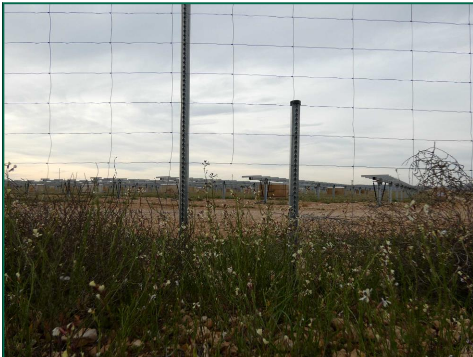
Fotografía 7. Espaciado cinegético.