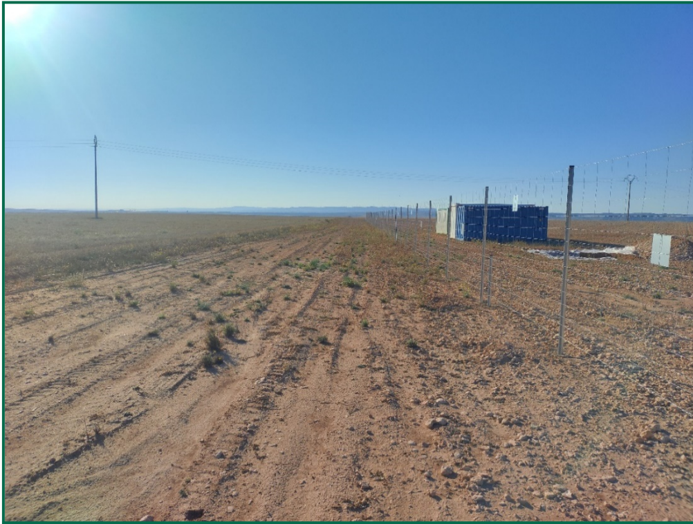
Fotografía 2. Zona reservada para franja vegetal.