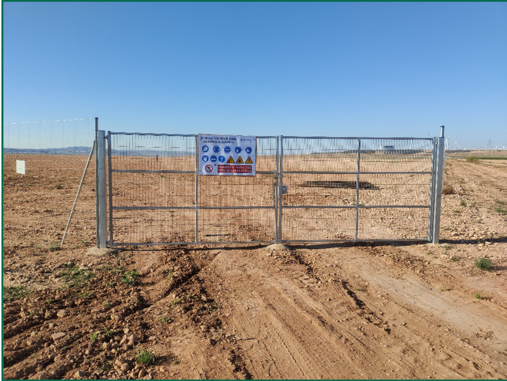
Fotografía 1. Superficie de la planta.