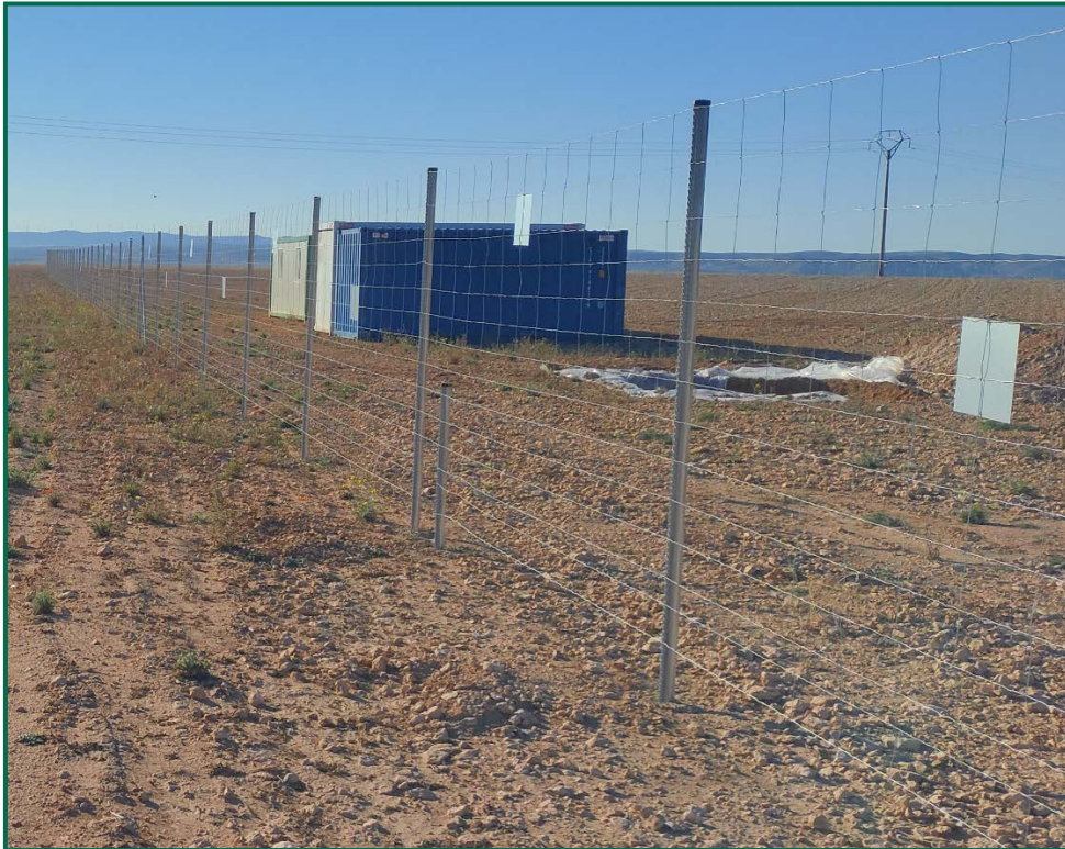
Fotografía 3. Vallado perimetral y placas anticolidión.

Se ha realizado seguimiento de avifauna durante el proceso de la obra en el mes de septiembre, y se han avistado las siguientes especies: Cernícalo vulgar ( Falco tinnunculus ) posado sobre el vallado y en un poste eléctrico, chova piquirroja ( Pyrrhocorax pyrrhocorax ) en bandos alimentándose sobre campos de cultivos anexos a la obra, corneja negra ( Corvus corone ) y otras especies de menor tamaño posadas sobre el vallado como son la cogujada montesina ( Galerida teklae ) y collalba gris ( Oenanthe oenanthe ).