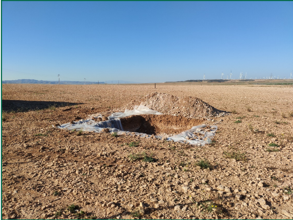
Fotografía 9. Balsa de limpieza.