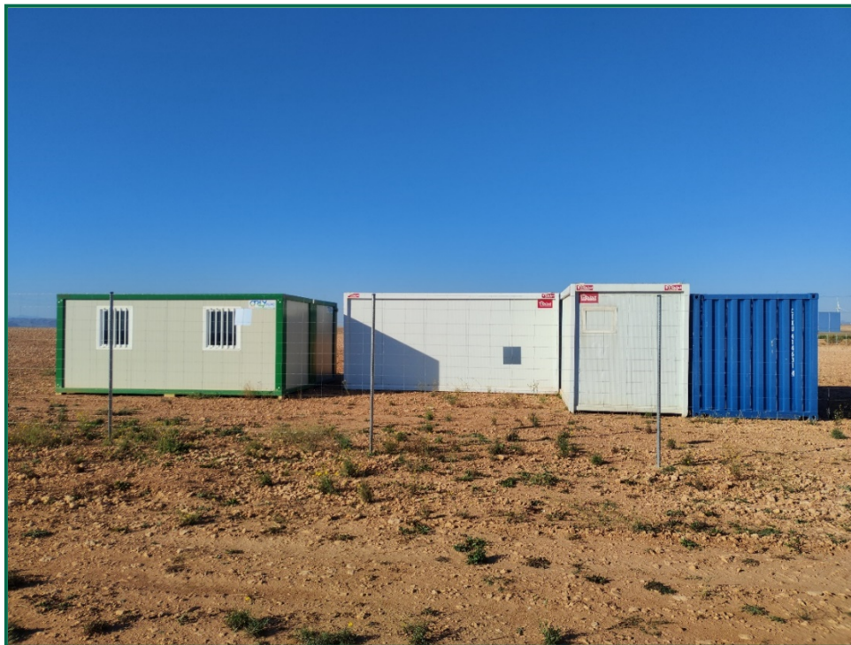
Fotografía 8. Contenedores de residuos.

Todavía no se han utilizado grupos electrógenos ni se han instalado envases de combustible, cuando se comiencen a utilizar se colocarán bandejas de contención debajo de ellos para evitar derrames por pérdidas accidentales sobre el terreno.