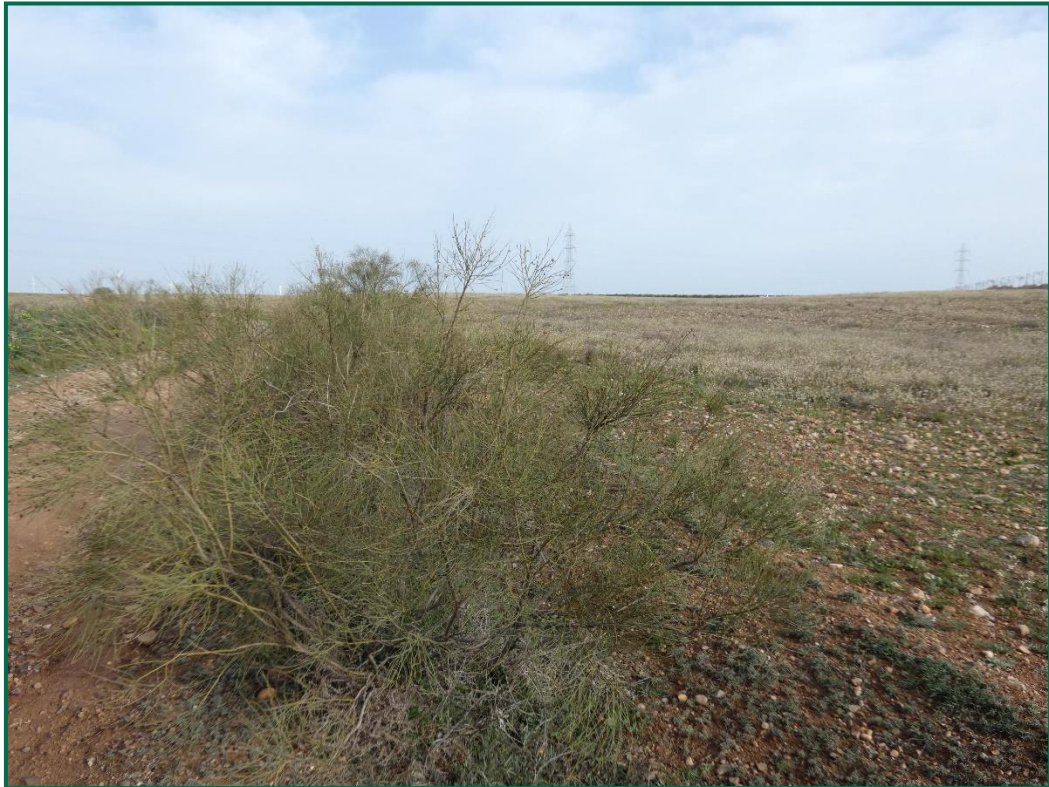
Fotografía 5. Vegetación natural.