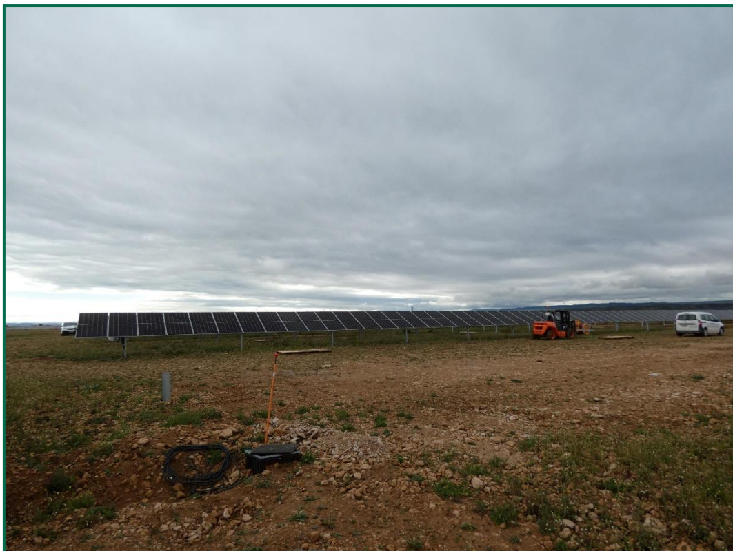
Fotografía 3. Colocación de placas fotovoltaicas.