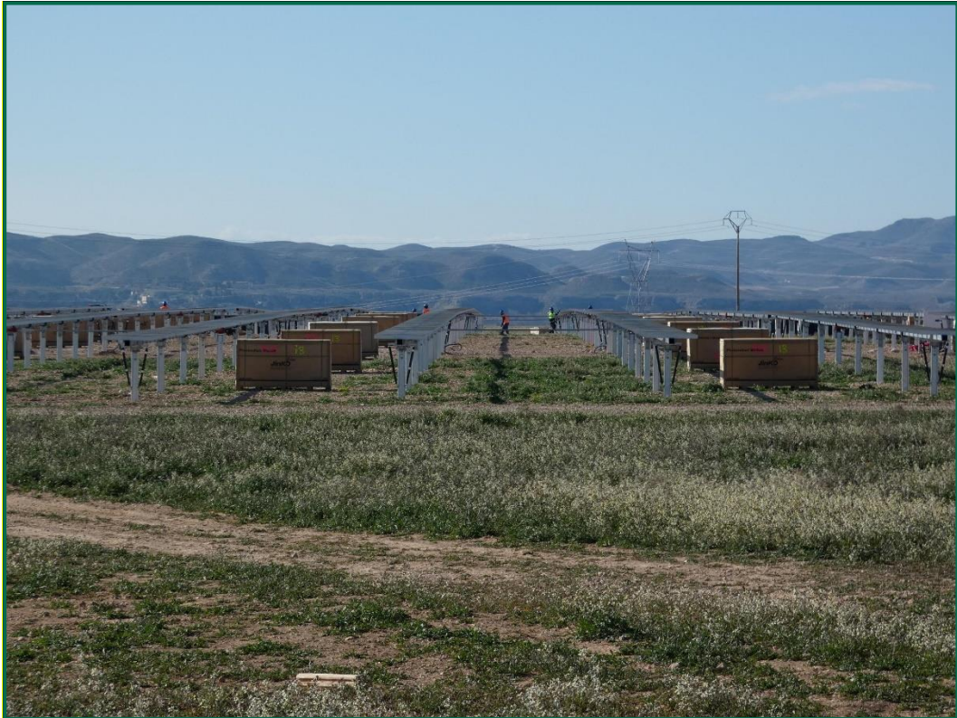
Fotografía 10. Materiales de obra.