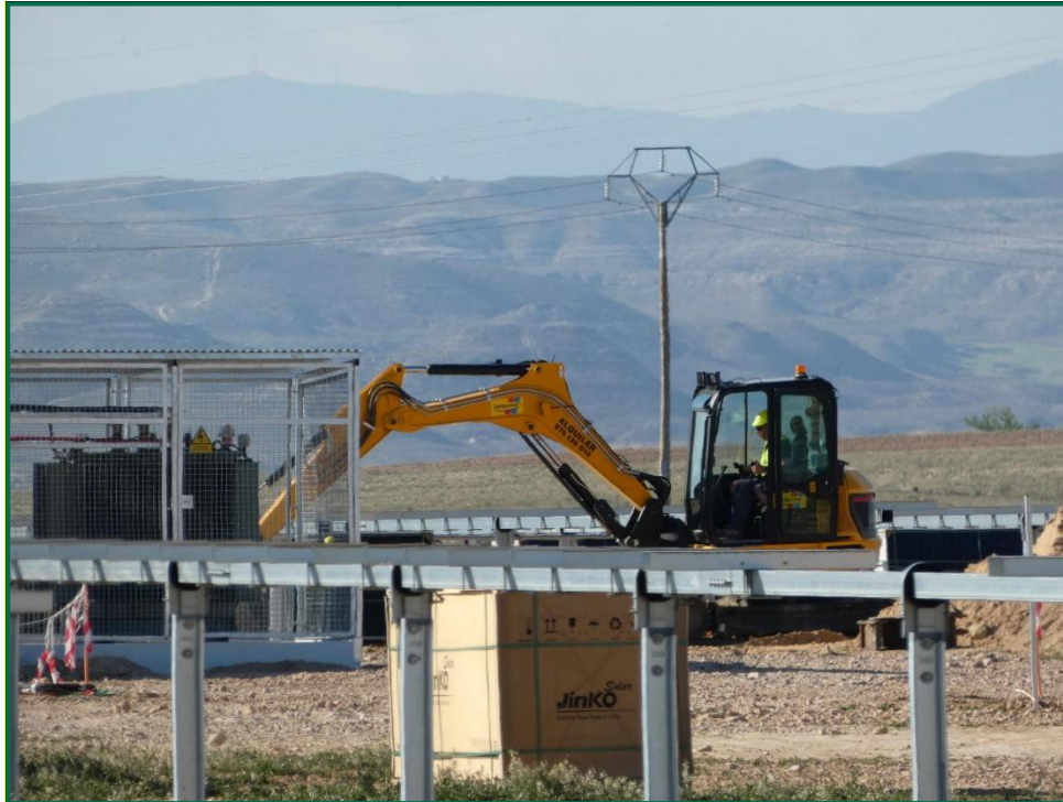
Fotografía 1. Excavadora tapando zanjas del inversor.