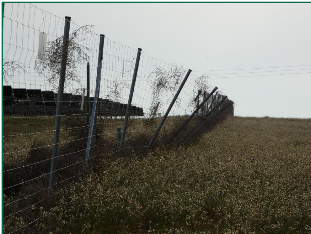
Fotografía 7. Vallado doblado por la acción del viento.