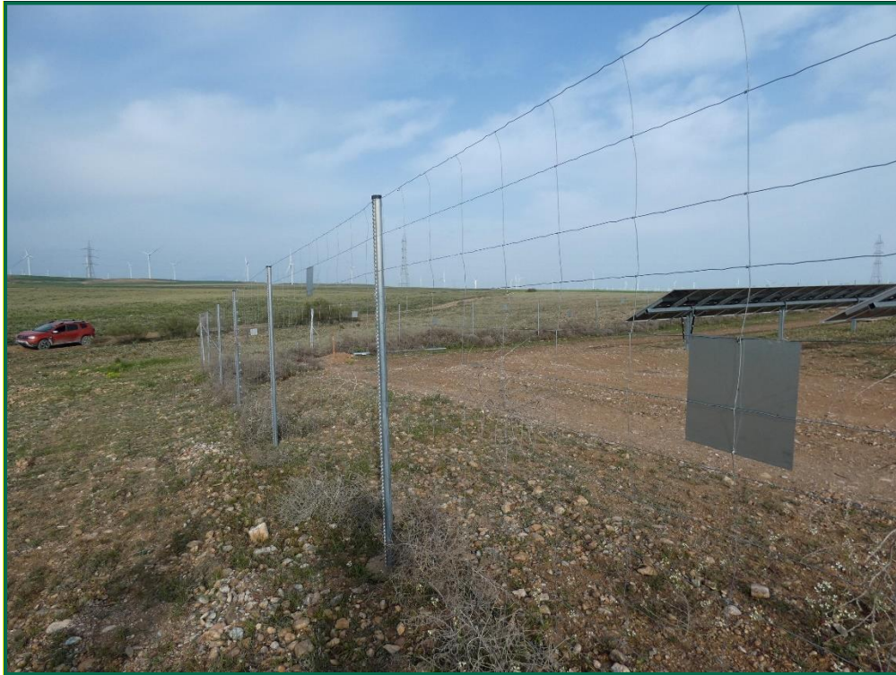
Fotografía 6. Vallado perimetral y placas anticollisión.