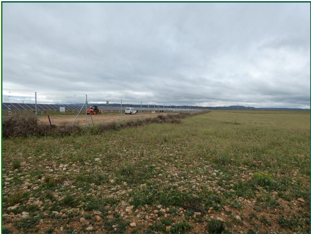
Fotografía 4. Franja vegetal y plantas rodadoras acumuladas sobre el vallado.

Durante las visitas a obra se comprueba que la ocupación de zonas de vegetación se limita a lo aprobado en el proyecto. Se verifica también que la maquinaria circula únicamente por los viales habilitados para tal fin. Desde el inicio de las obras se ha planificado la ejecución de una franja vegetal de 8 m de anchura en torno al futuro vallado perimetral.