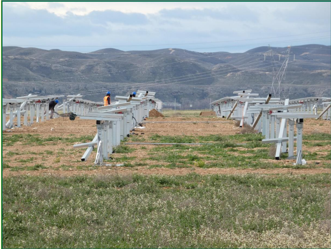
Fotografía 2. Postes verticales y horizontales para las placas fotovoltaicas.