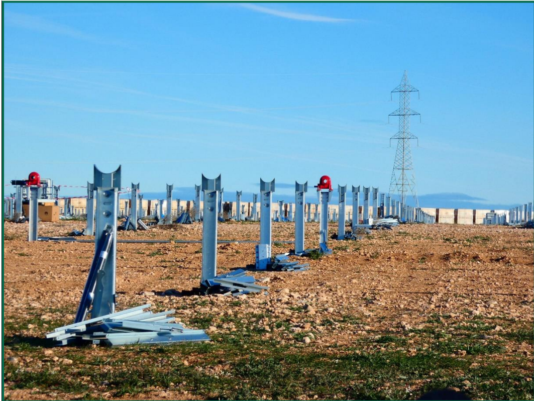
Fotografía 4. Postes verticales para las placas fotovoltaicas.