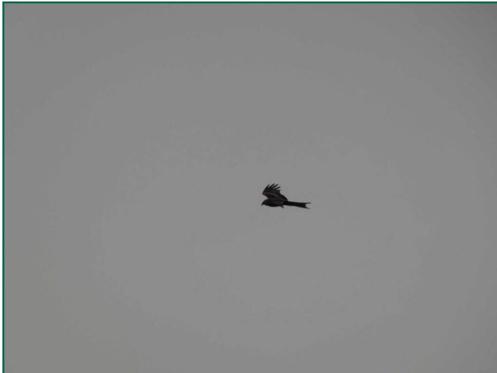
Fotografía 10. Milano real ( Milvus milvus ).

Se ha realizado seguimiento de avifauna durante el proceso de la obra en el mes de septiembre, y se han avistado las siguientes especies: milano real ( Milvus milvus ), cuervo grande ( Corvus corax ), gaviota patiamarilla ( Larus michaellis ) y chova piquirroja ( Pyrrhocorax pyrrhocorax ).