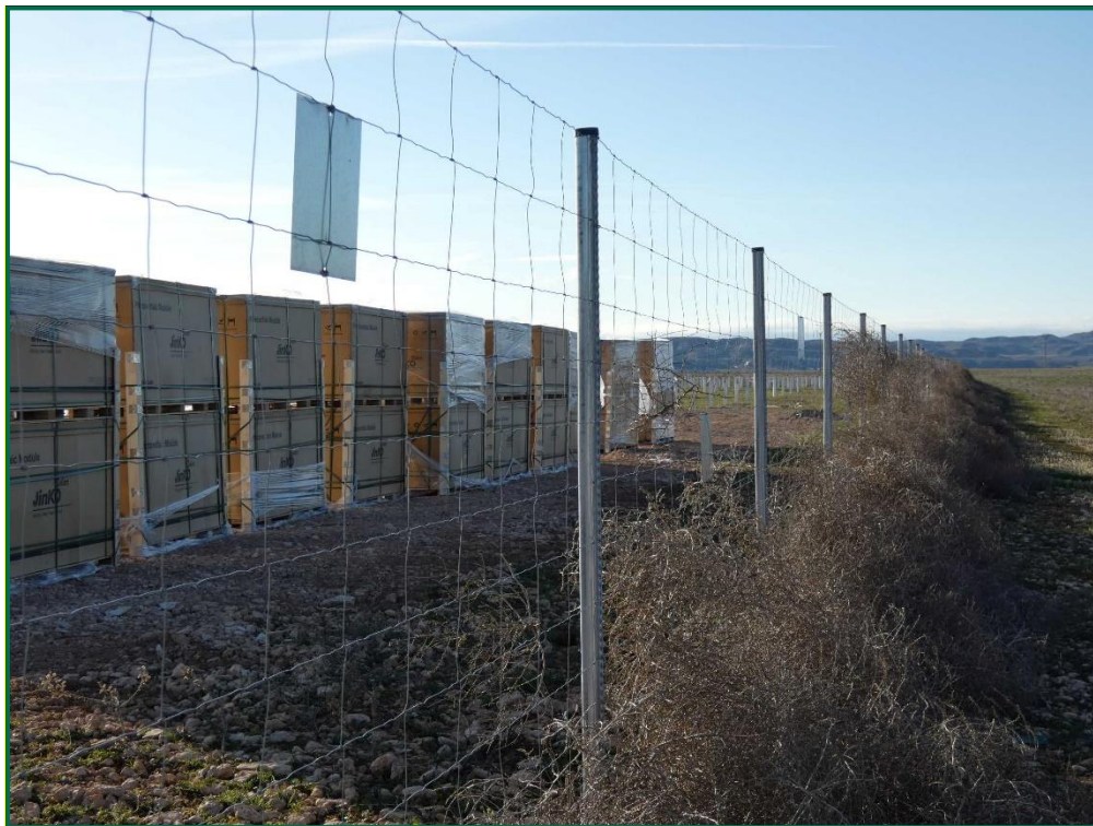
Fotografía 7. Vallado perimetral y placas anticolidión.

Durante este mes el vallado se ha doblado en ciertos puntos debido a los fuertes vientos que arrastran plantas rodadoras hasta que los postes del vallado ceden. Estos desperfectos se arreglarán en meses posteriores.