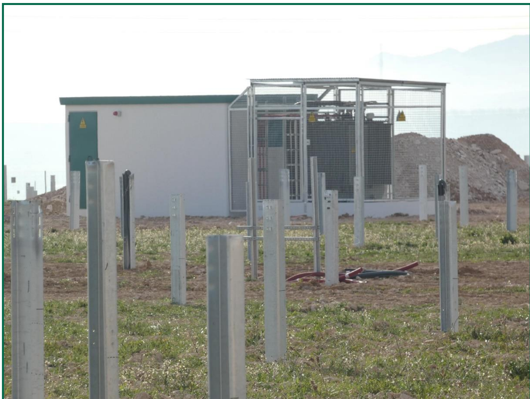
Fotografía 5. Colocación de inversores.