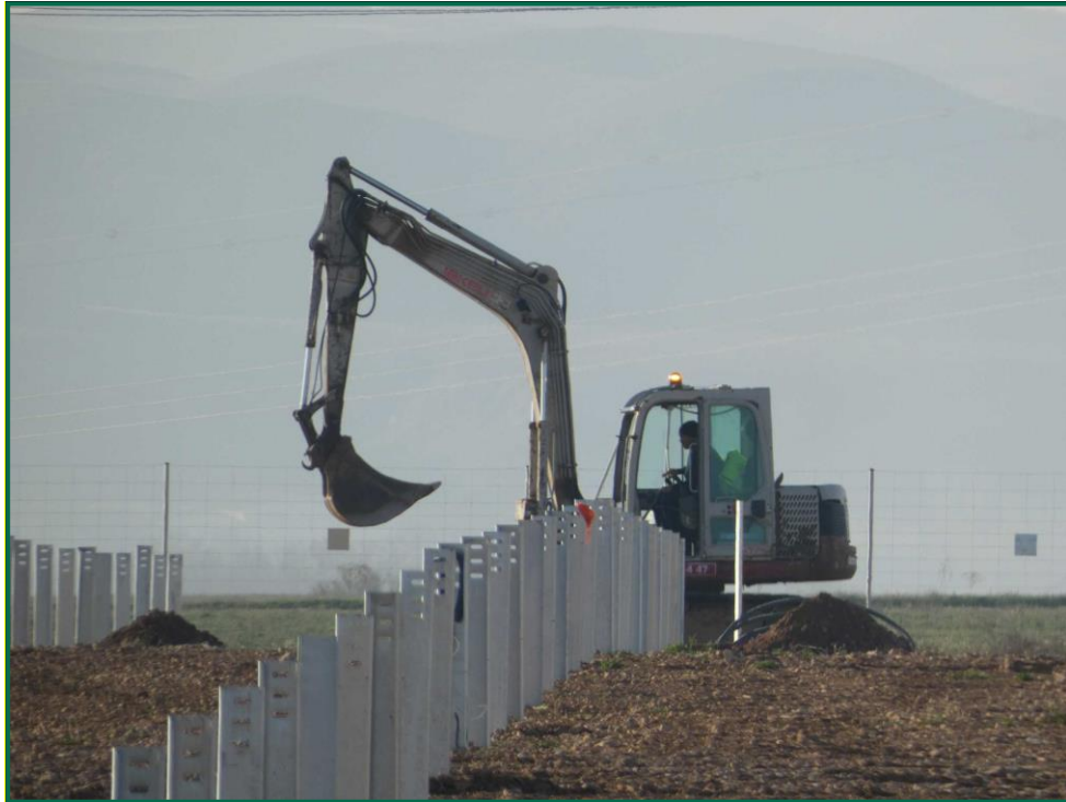
Fotografía 1. Excavadora tapando zanjas.