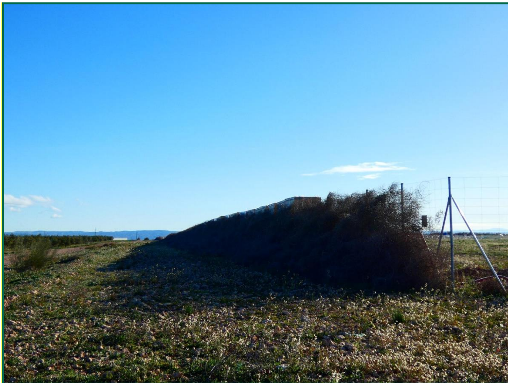
Fotografía 6. Franja vegetal y plantas rodadoras acumuladas sobre el vallado.

Durante las visitas a obra se comprueba que la ocupación de zonas de vegetación se limita a lo aprobado en el proyecto. Se verifica también que la maquinaria circula únicamente por los viales habilitados para tal fin. Desde el inicio de las obras se ha planificado la ejecución de una franja vegetal de 8 m de anchura en torno al futuro vallado perimetral.