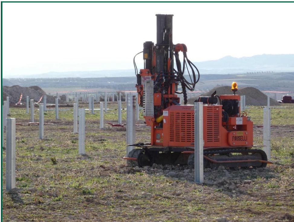
Fotografía 2. Maquinas hincando los postes verticales.