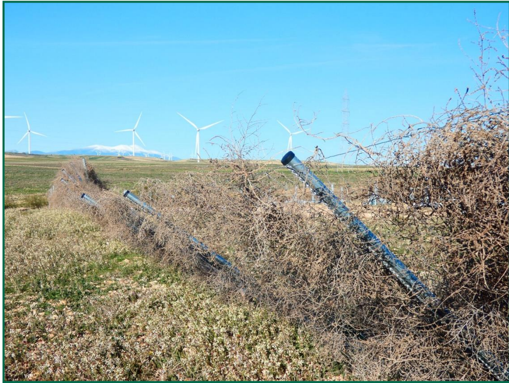
Fotografía 8. Vallado doblado por la acción del viento.