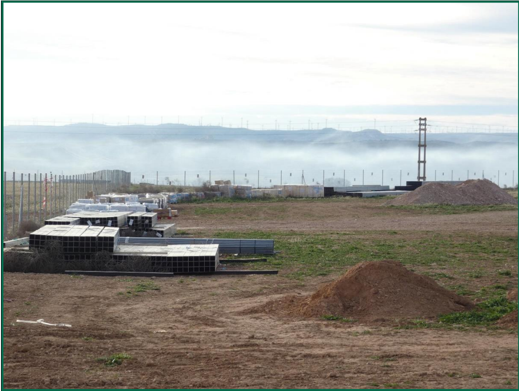
Fotografía 13. Materiales de obra.