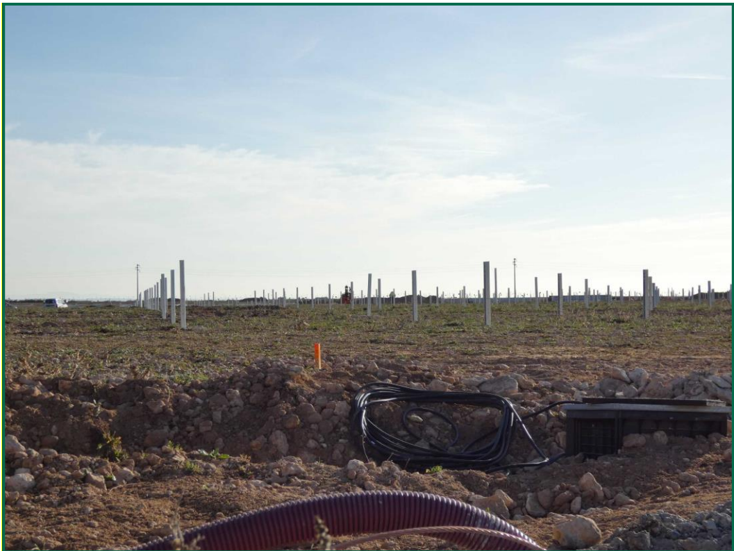
Fotografía 3. Tapado de zanjas.

Por el momento la tierra vegetal extraída ha sido escasa debido a que no ha sido necesario nivelar todo el terreno, únicamente algunas zonas y con un espesor limitado, y esta se ha ido extendiendo sobre el terreno. La tierra extraída para la construcción de balsas de limpieza se ha acopiado en caballones al igual que la tierra retirada para realizar zanjas. En las zonas donde se van a realizar plantaciones para crear una patalla vegetal no se ha realizado ningún movimiento de tierra, conservando la capa de tierra vegetal presente.