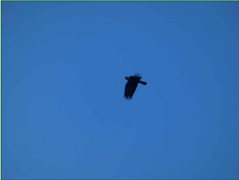
Fotografía 11. Chova piquirroja ( Pyrrhocorax pyrrhocorax ).